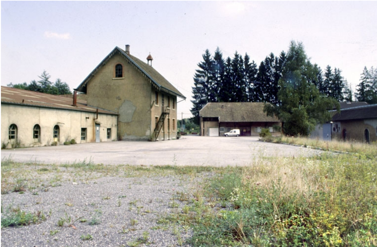
Vue de la cour depuis l'emplacement de l'ancienne salle des machines.