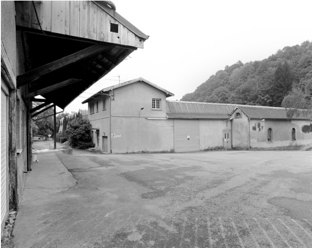
Bâtiments de la filature depuis le nord.