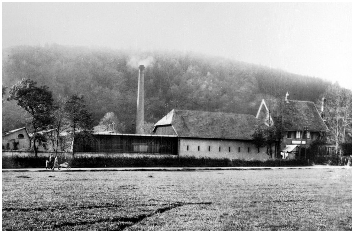
Tissage et filature des Ets Zeller frères et Cie.