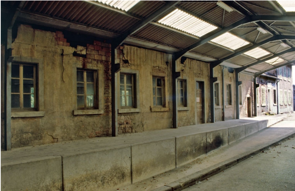
Quai couvert établi contre l'ancien tissage. 90, Étueffont Grande Rue 28, 37