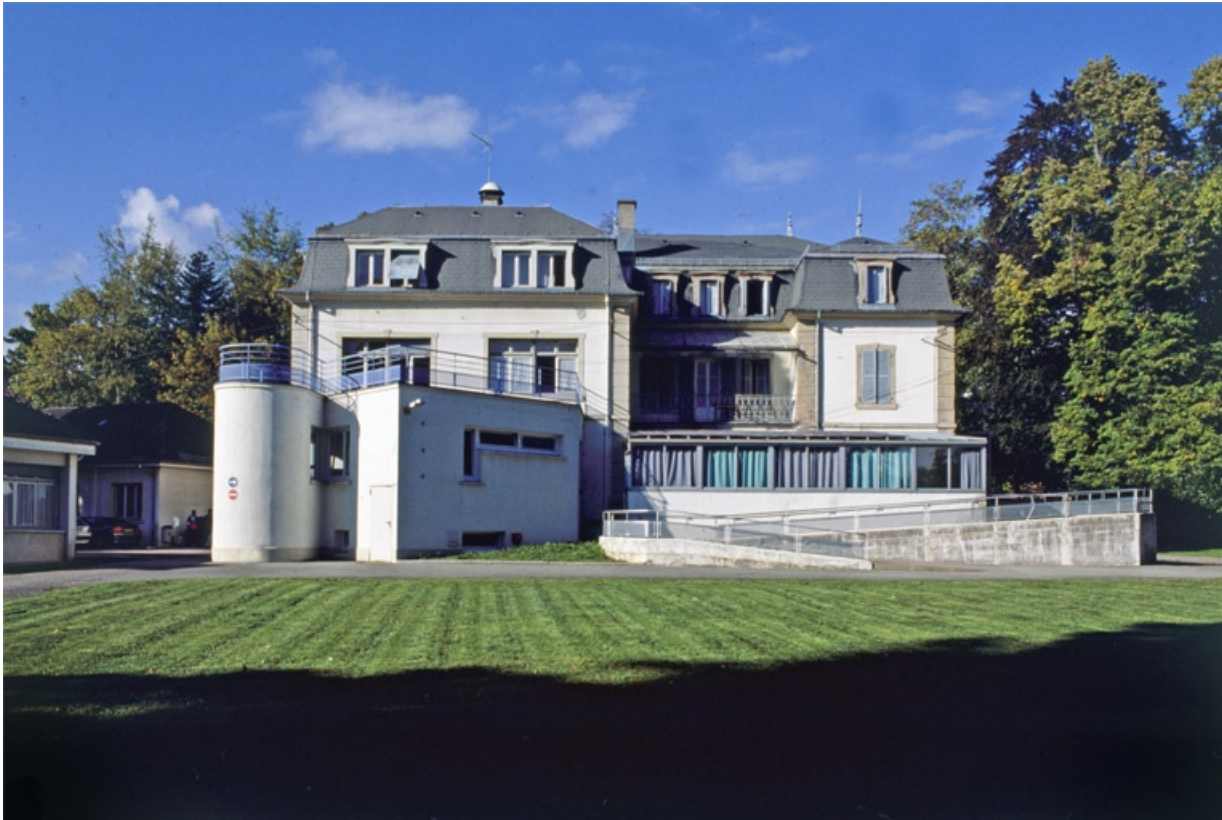
Façade postérieure du logement patronal.