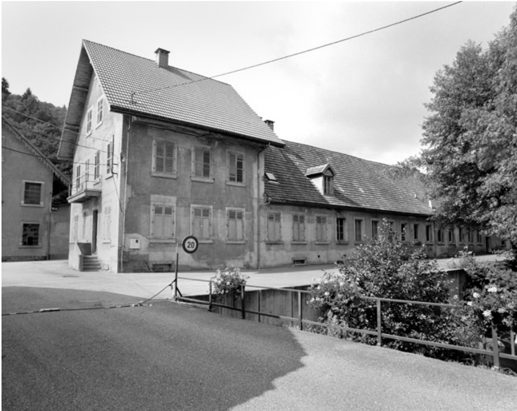
Bureaux et conciergerie depuis l'entrée.