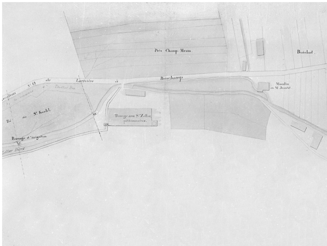
Demande des sieurs Zeller, manufacturiers à Etueffont-Bas, tendant à établir une prise d'eau dans la Madeleine pour l'alimentation de leur tissage d'Etueffont-Bas - Plan des lieux.