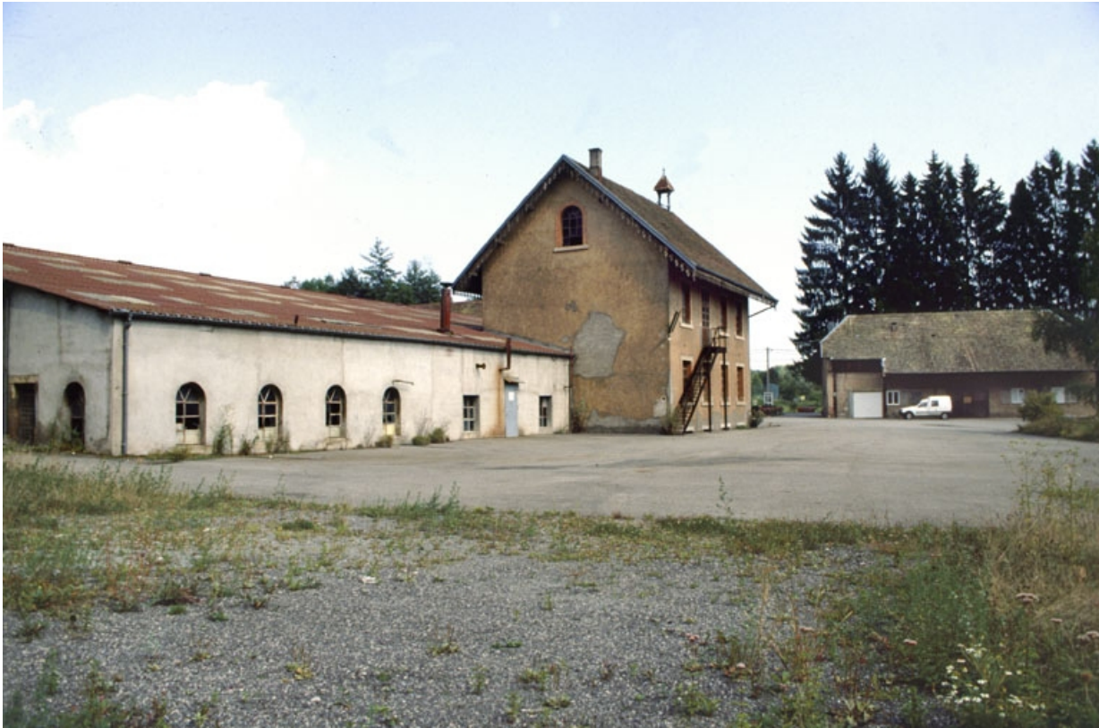
Atelier de forge et bâtiment du laboratoire et des bureaux.