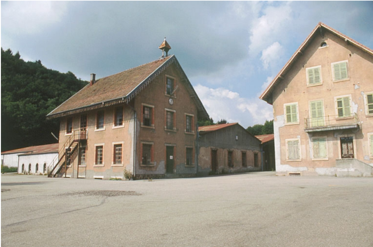
Bâtiments du tissage depuis le sud-est.