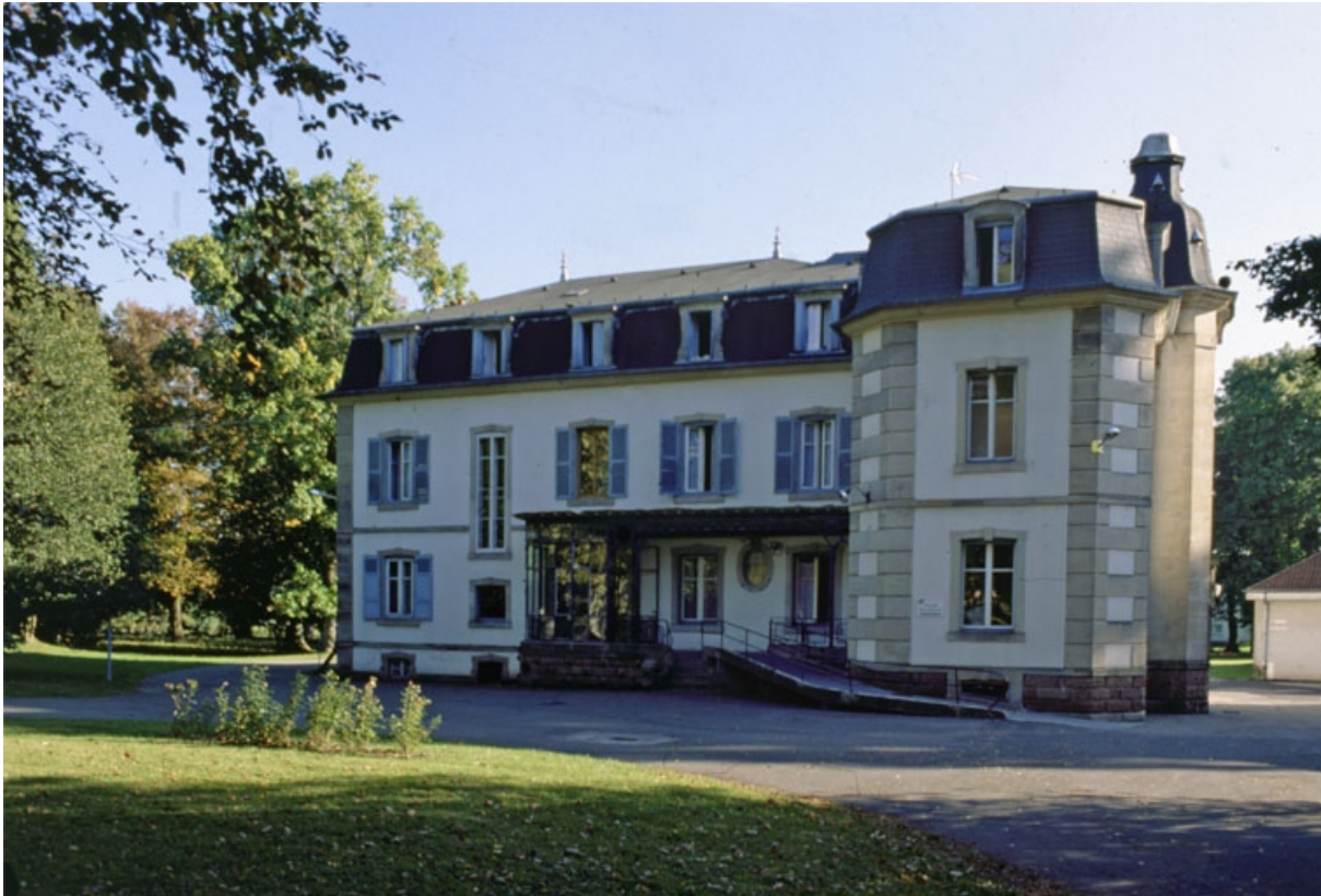
Logement patronal depuis le nord.