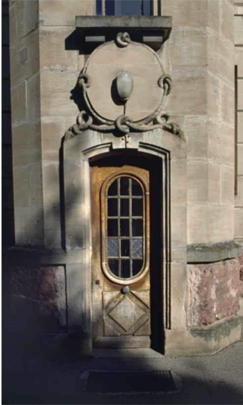
Décor sculpté de la porte de la tourelle.