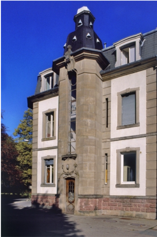
Tourelle sur la façade ouest du logement patronal. 90, Étueffont Grande Rue 28, 37