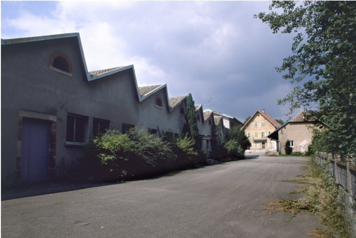
Sheds de l'atelier de filature.