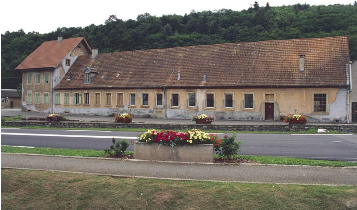
Vue d'ensemble du tissage depuis l'est. 90, Étueffont Grande Rue 28, 37