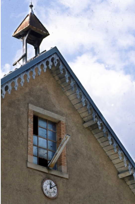
Détail du pignon du bâtiment des bureaux et du laboratoire. 90, Étueffont Grande Rue 28, 37