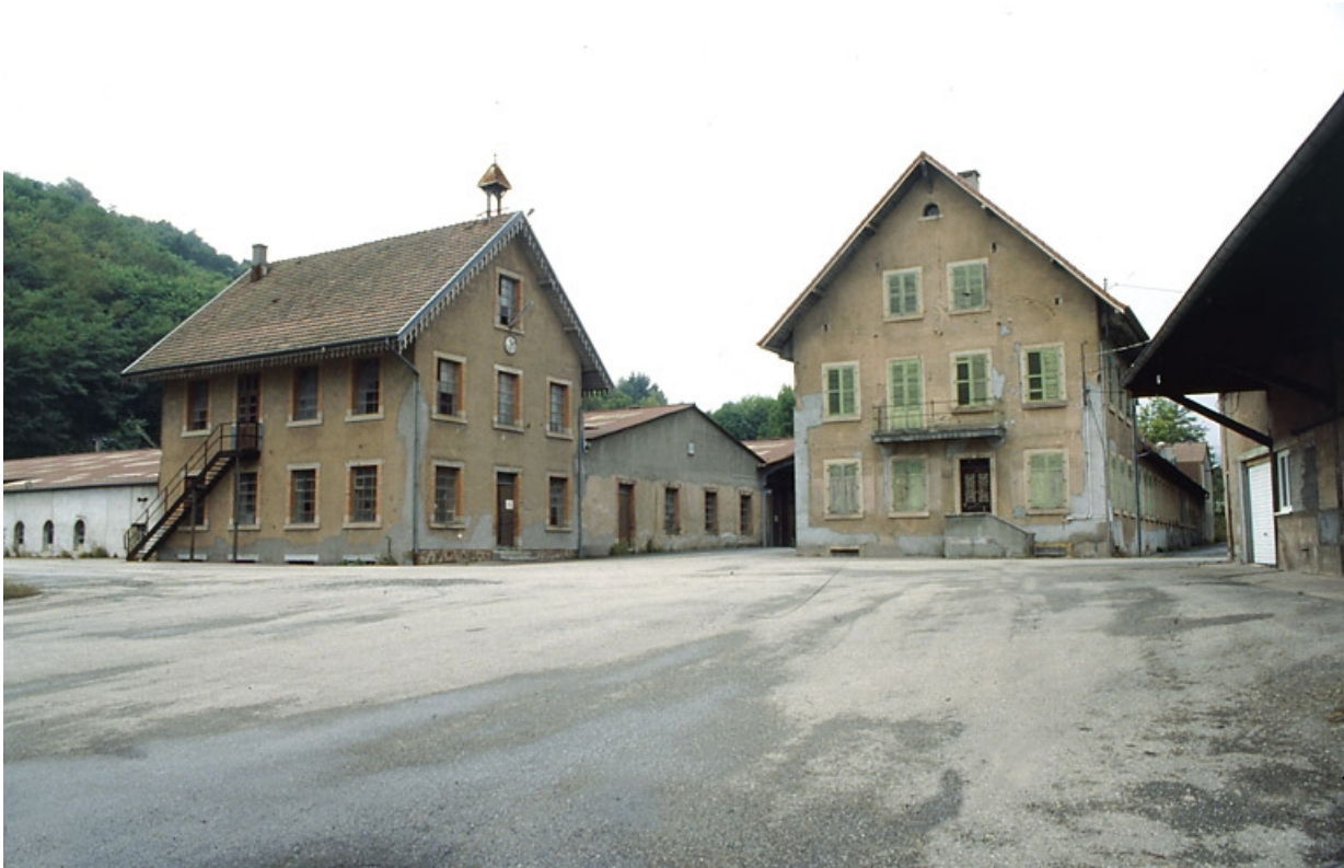
Laboratoire, bureaux et conciergerie depuis le sud.