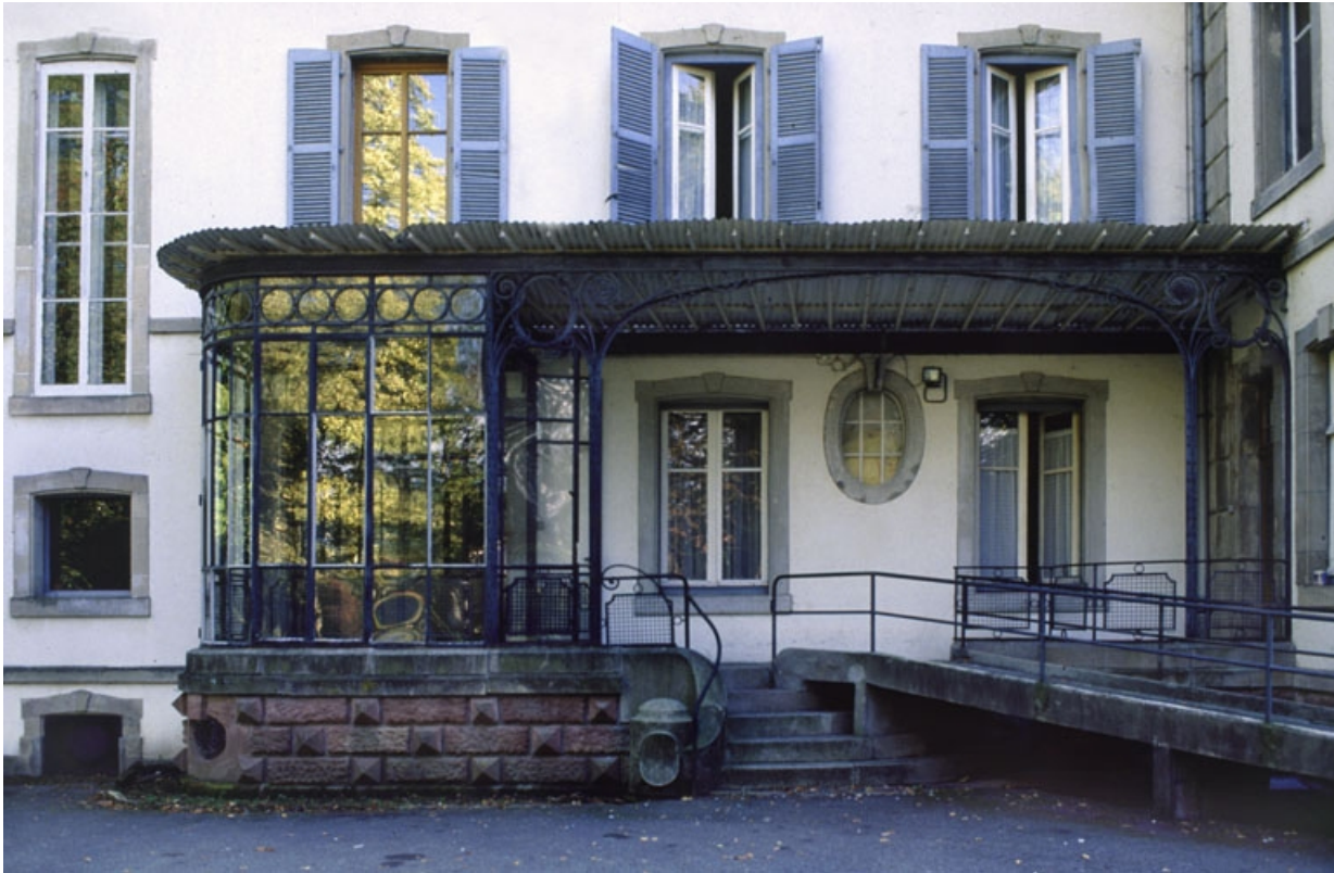
Perron et véranda du logement patronal.