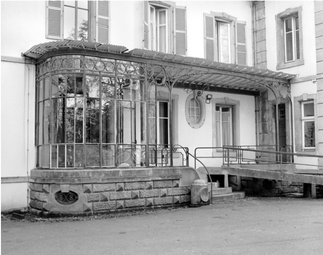
Détail de la véranda et de la marquise du logement patronal.