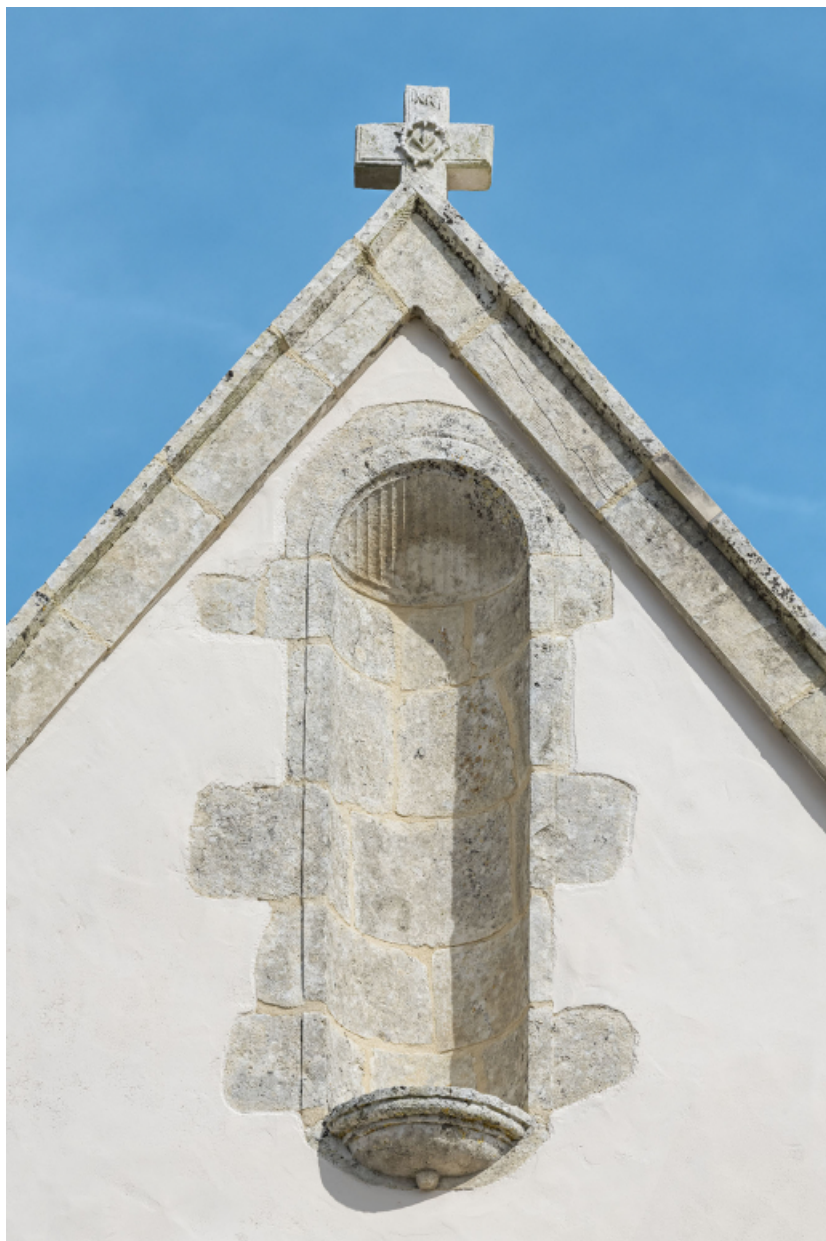
Niche vide dans le pignon de la façade principale.