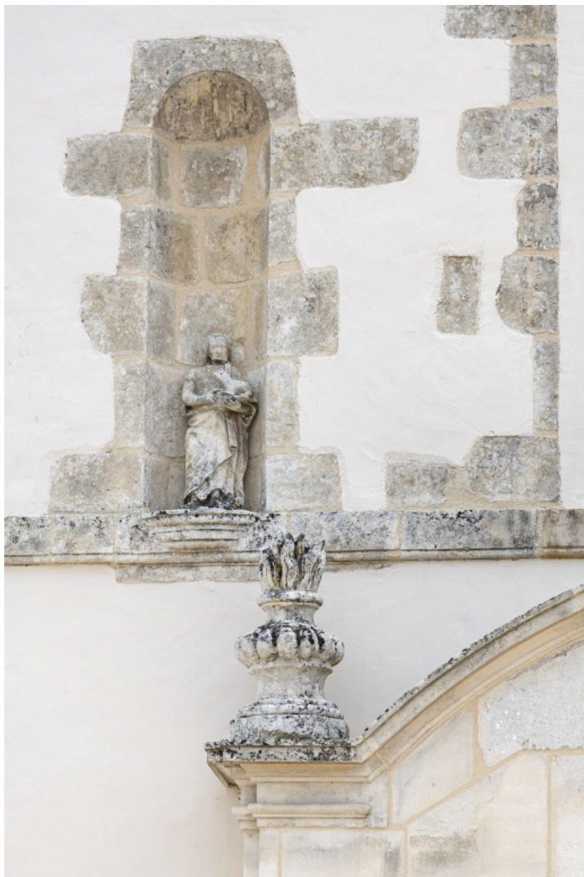
Détail de la façade principale : niche et pot à feu.