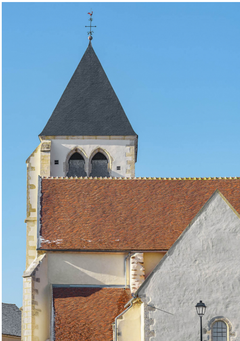
Détail de la toiture restaurée : vue depuis le chevet plat.