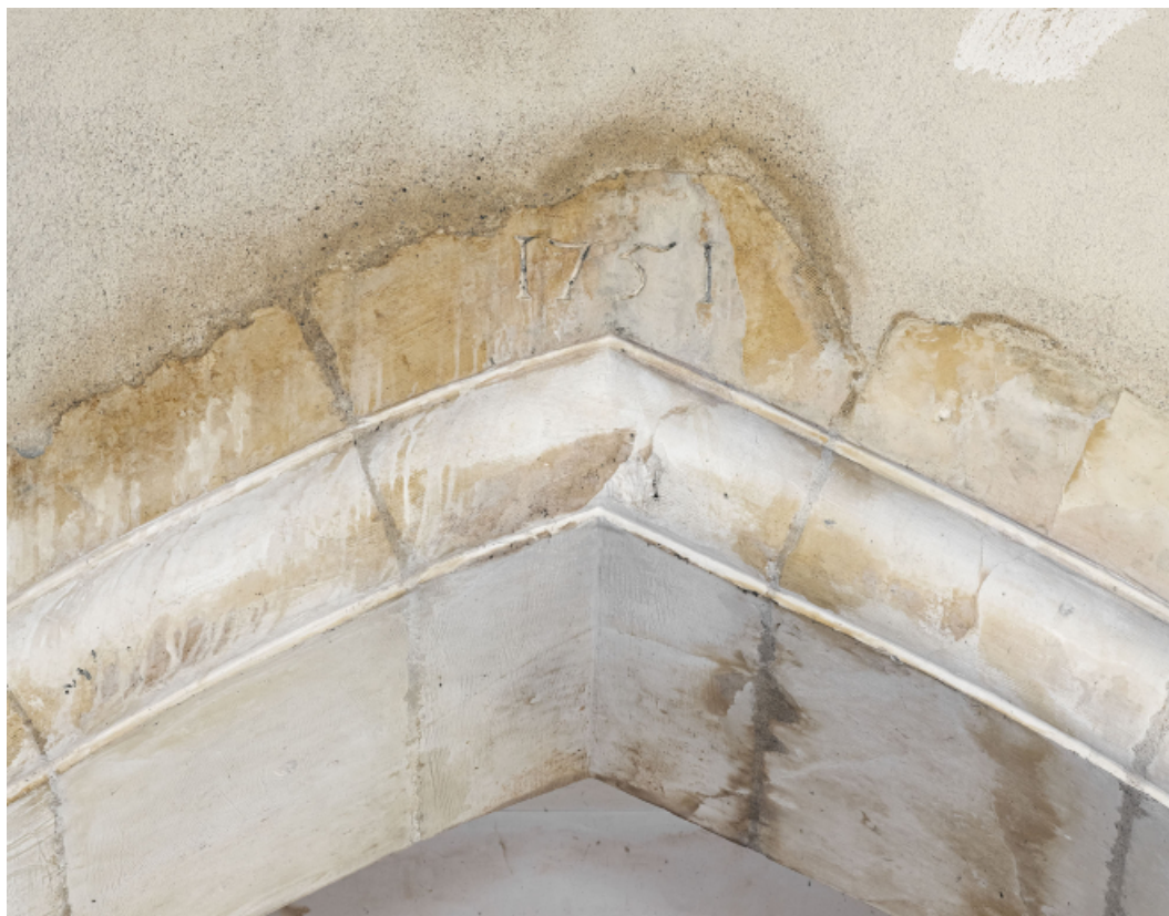
Arc brisé du transept nord : date (1751).