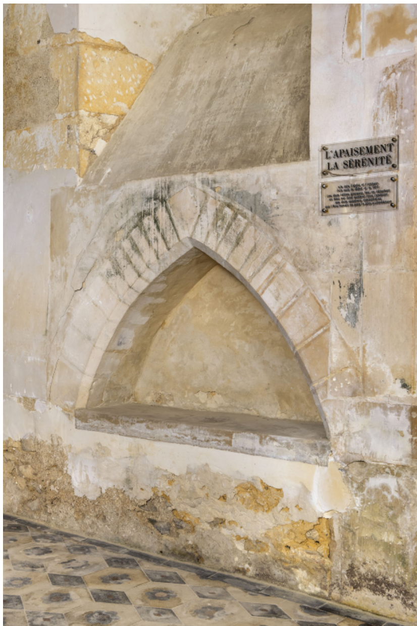
Lavabo liturgique dans le chœur.