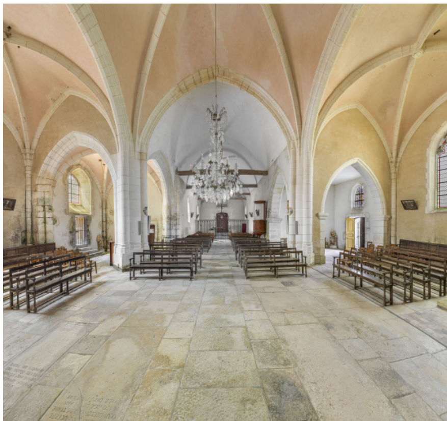
Vue d'ensemble de la nef et du transept depuis le chœur.