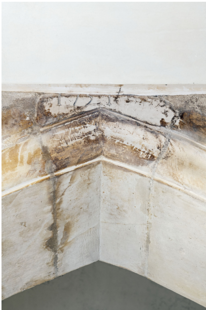
Arc brisé du transept nord : date (1751).