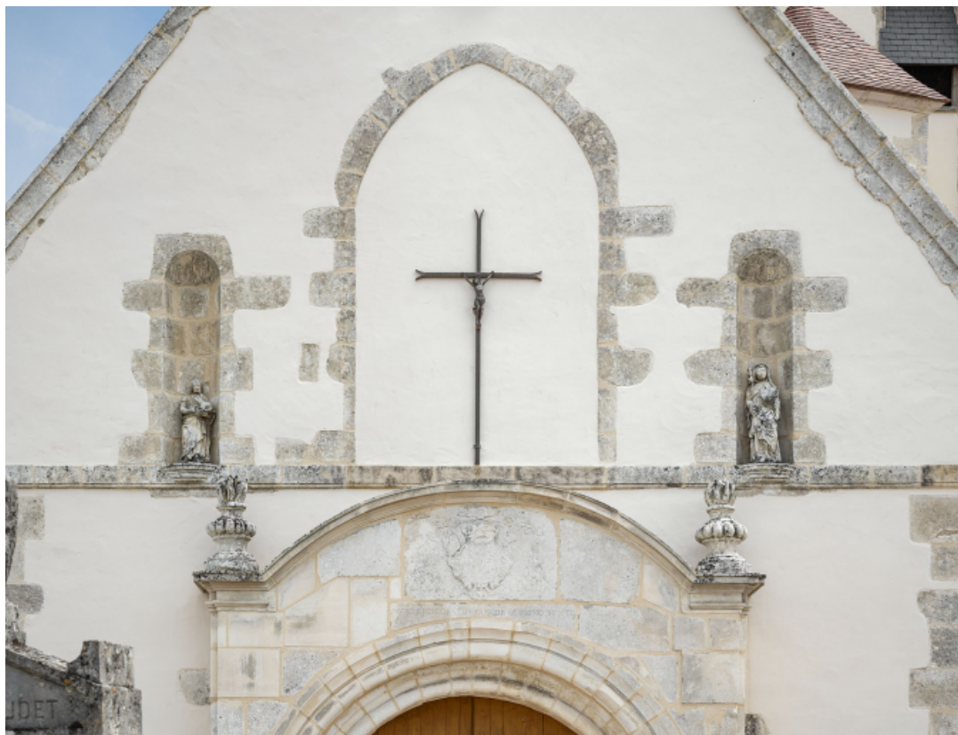
Détail de la façade principale et du portail.