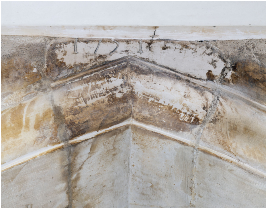
Arc brisé du transept nord : date (1751).