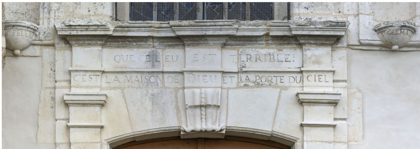
Détail de l'inscription surmontant la porte nord.