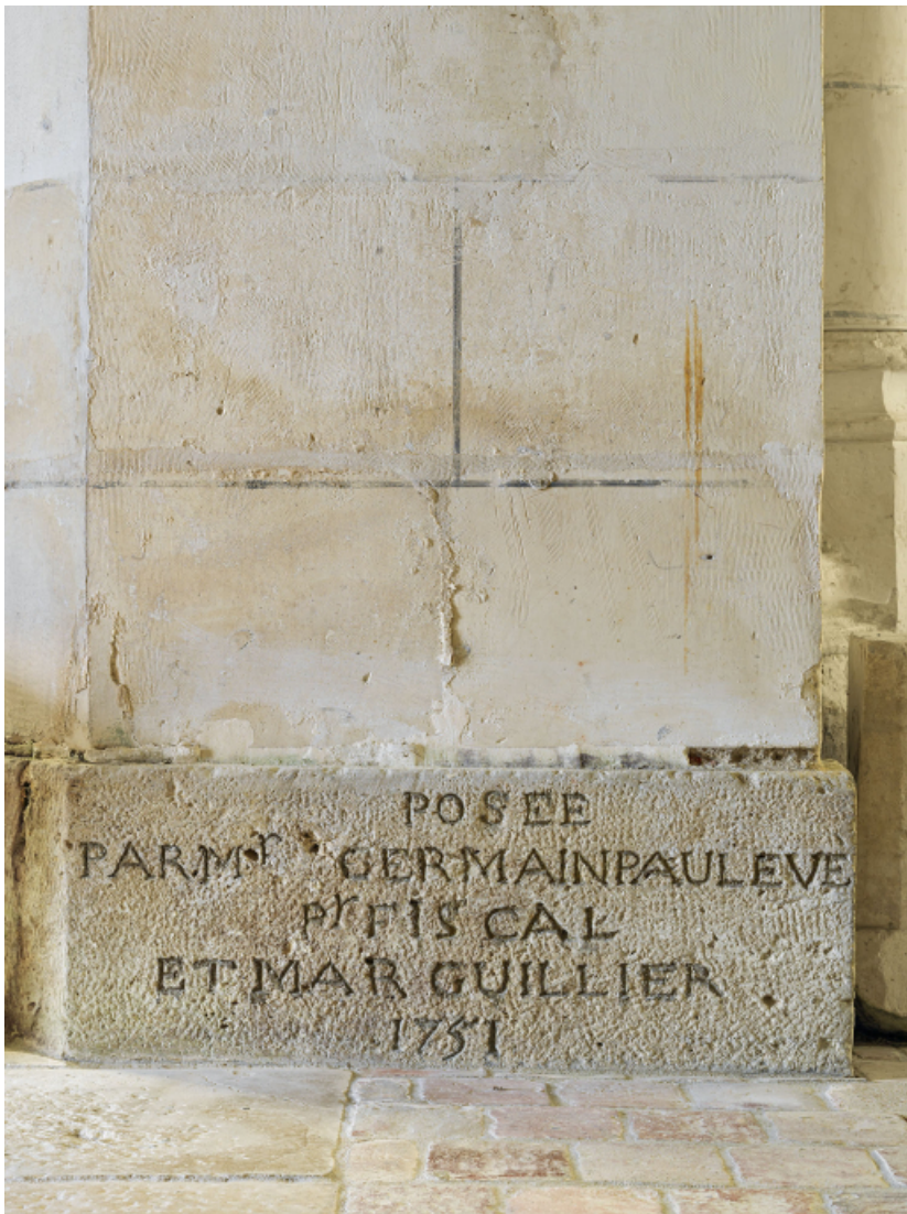
Détail de la pierre portant l'inscription commémorant sa pose en 1751. 89, Venoy rue de l' Église