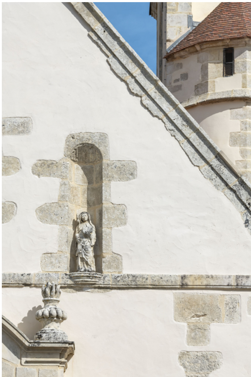
Détail de la façade principale : niche et pot à feu.