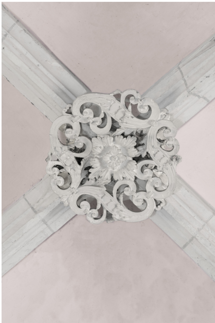
Clef de voûte du chœur.