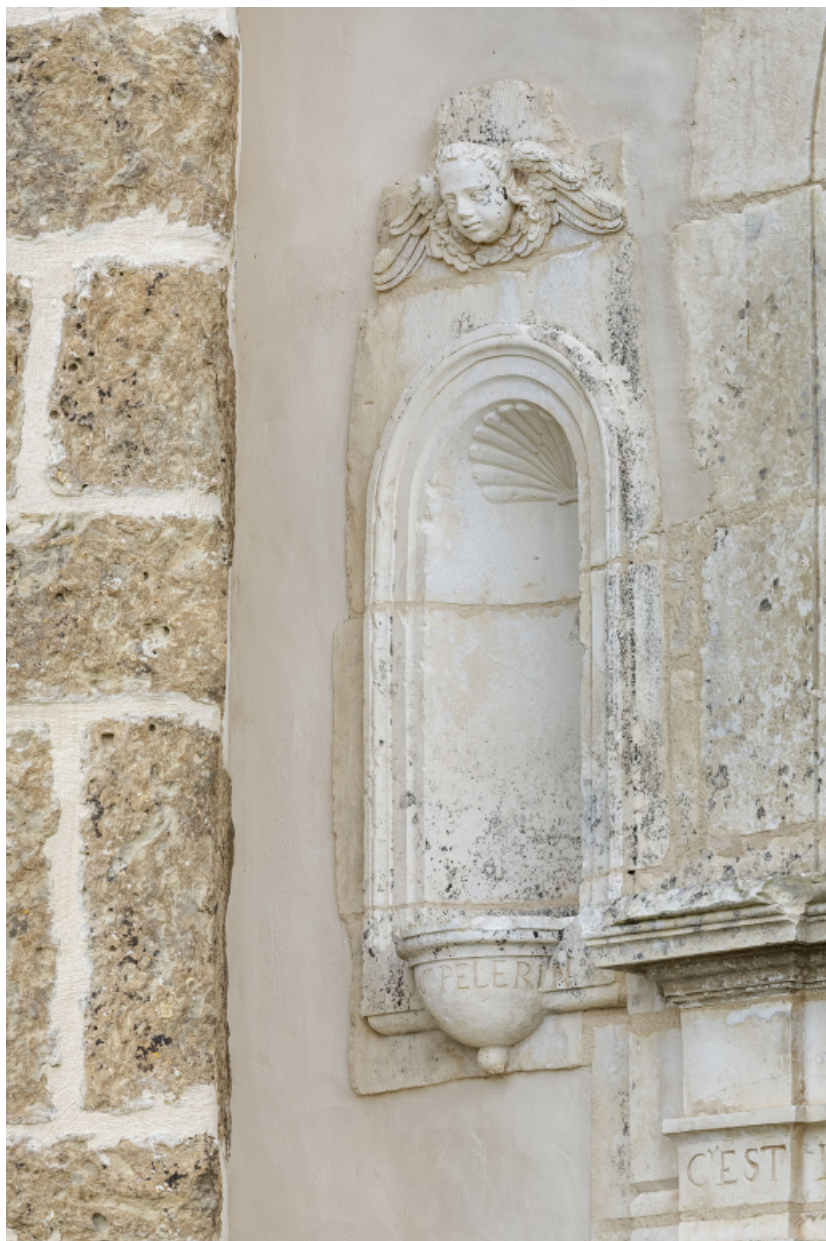
Niche portant l'inscription de saint Pélerin.