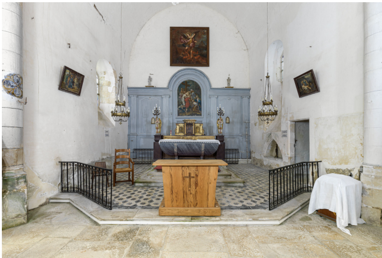
Vue d'ensemble du sanctuaire.