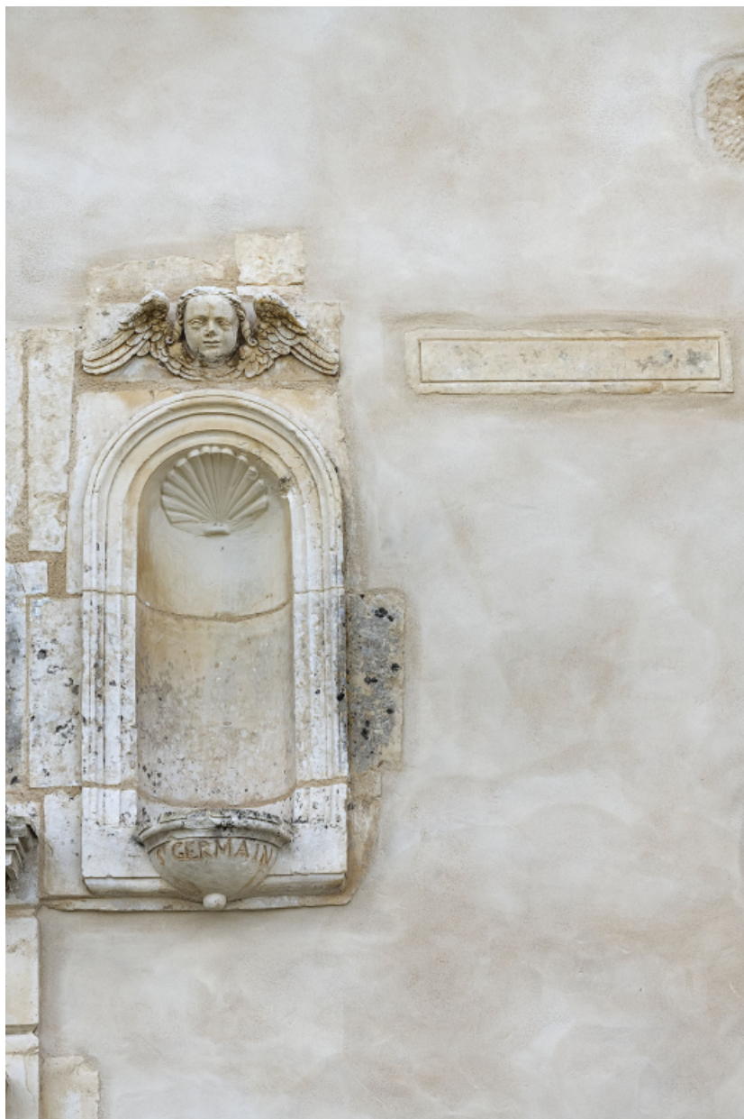
Niche portant l'inscription de saint Germain.