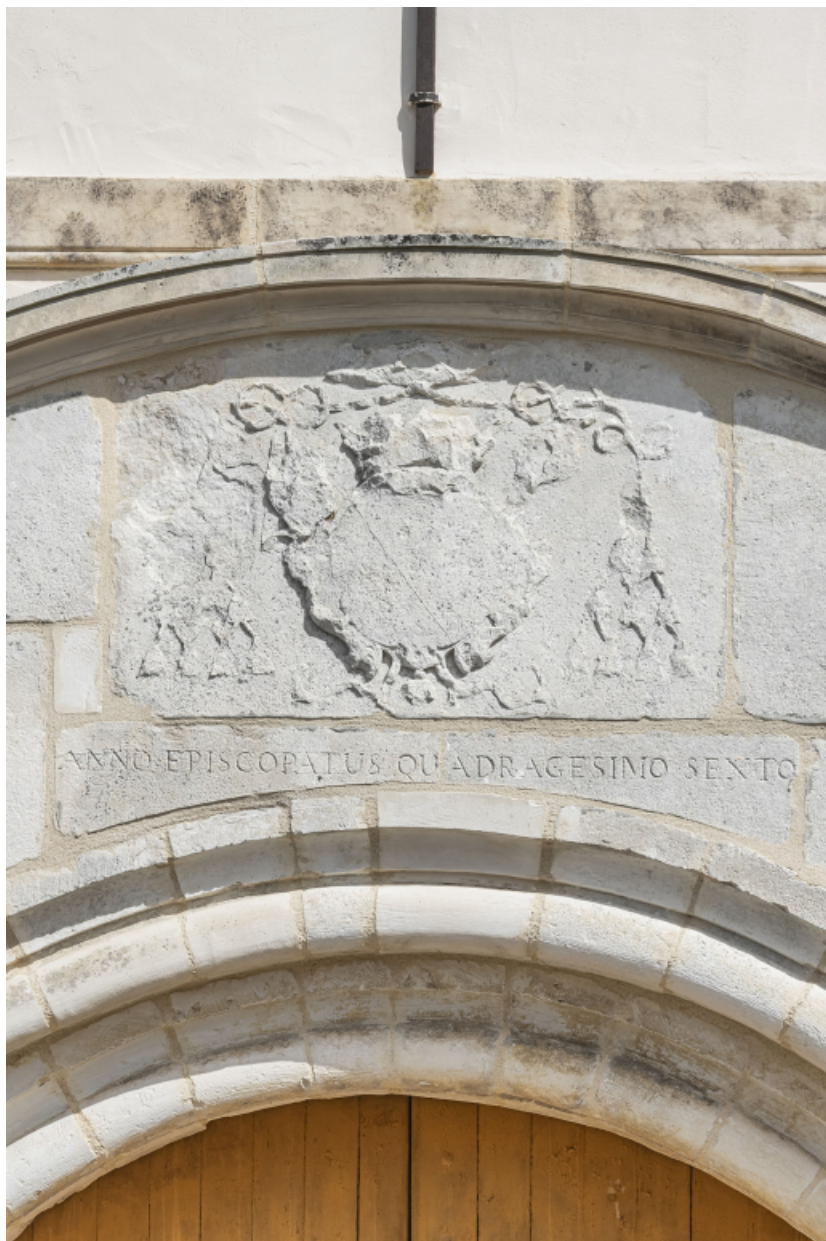
Détail du blason et de l'inscription figurant sur le portail.