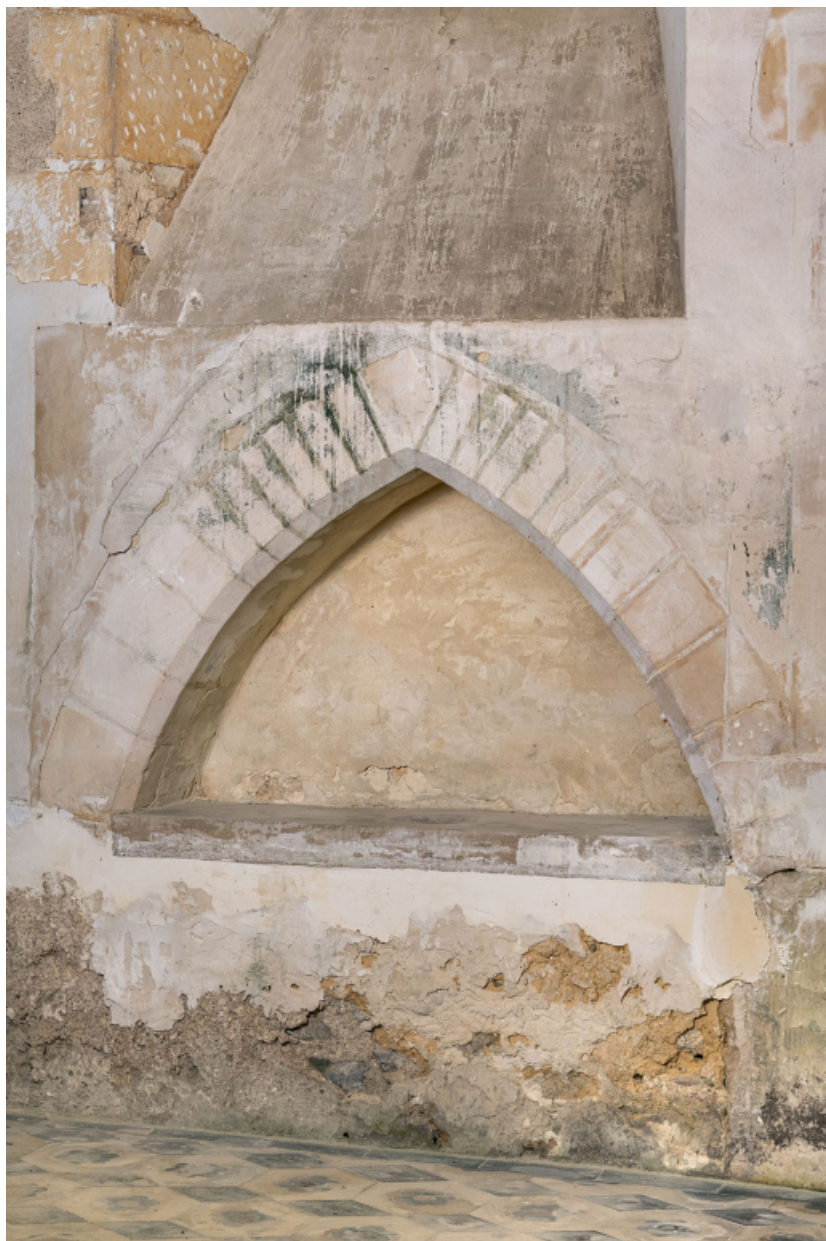
Lavabo liturgique dans le chœur.