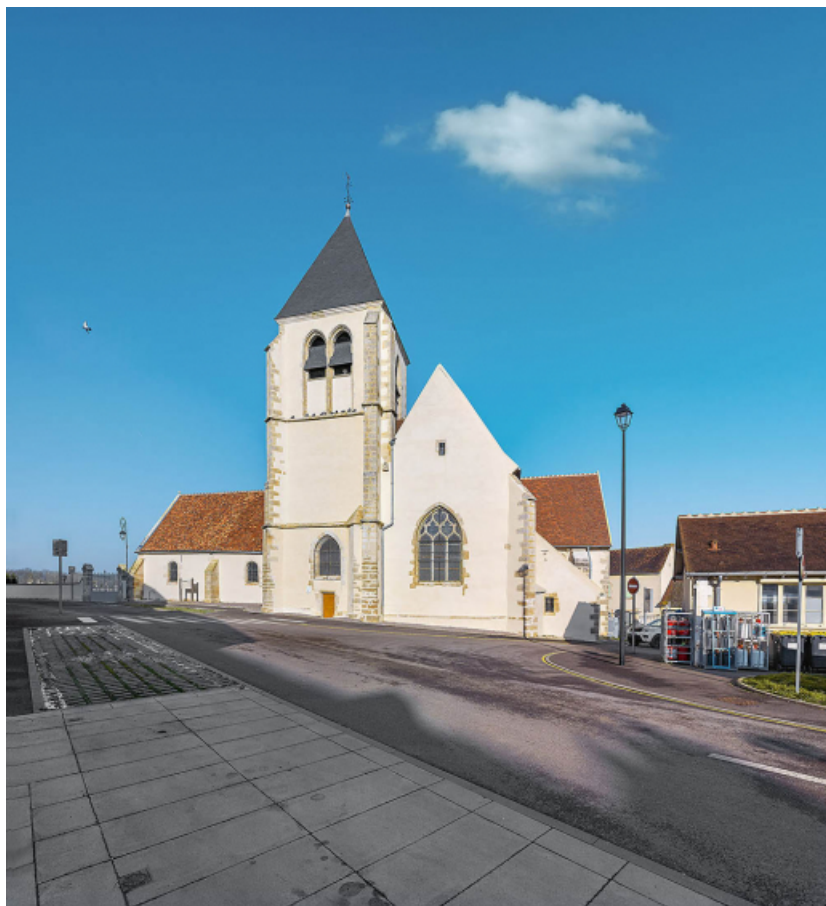
Élévation sud avec clocher.