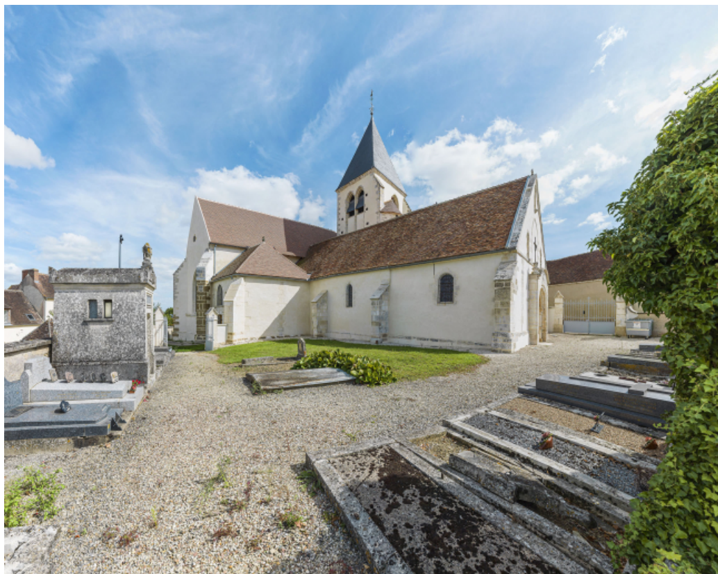
Vue d'ensemble de l'élévation nord, depuis le cimetière.