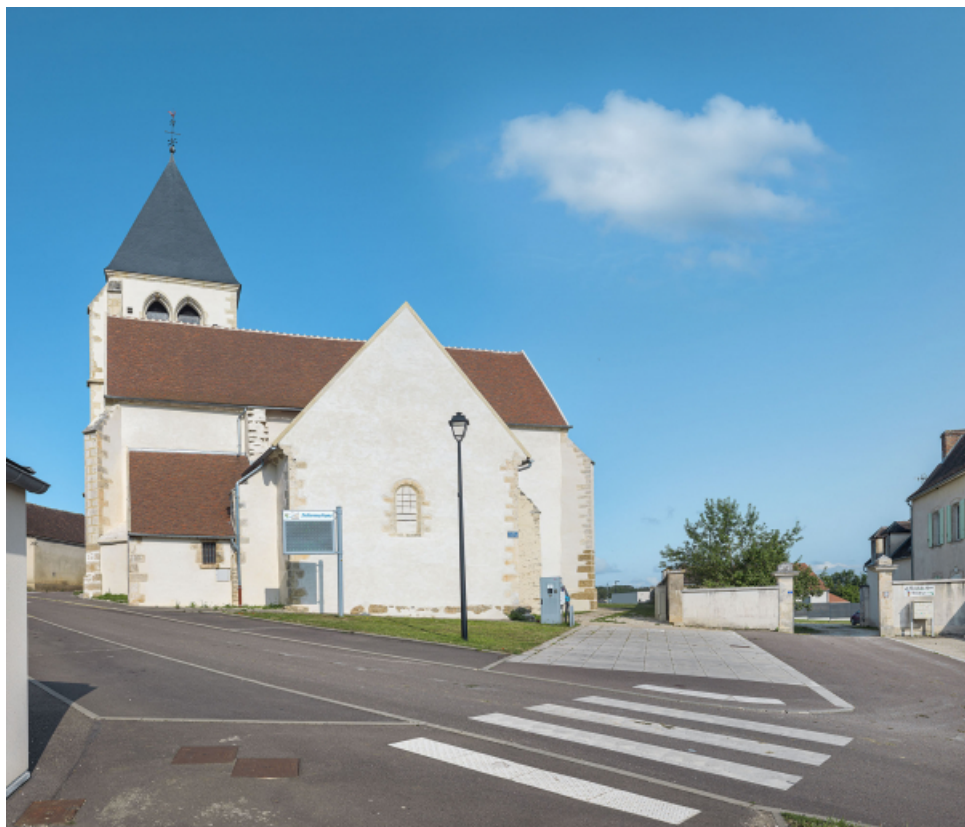
Vue d'ensemble depuis le chevet.