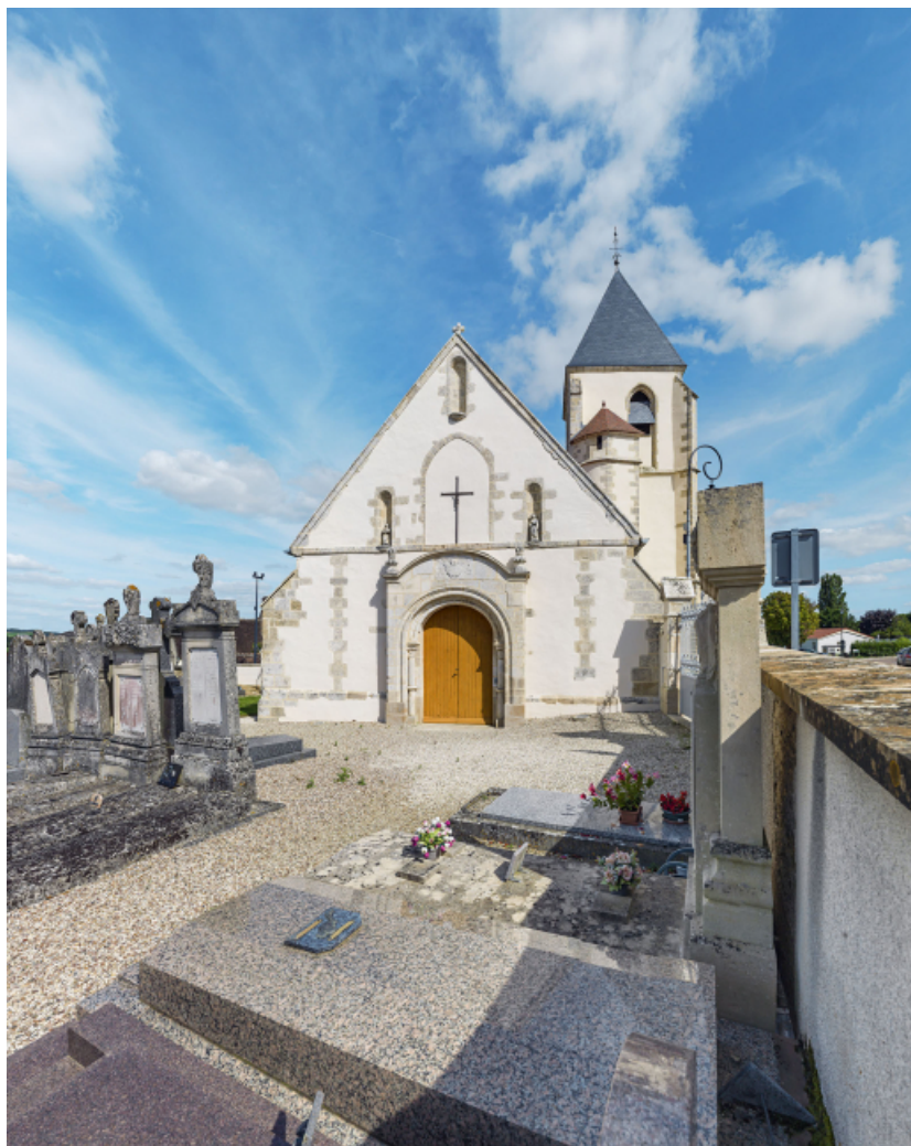
Façade principale, vue depuis le cimetière.