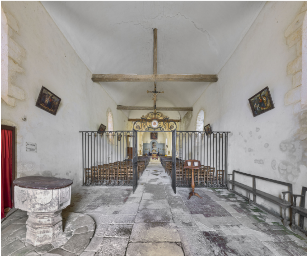
Vue d'ensemble de l'intérieur de l'église depuis la première travée de la nef. A gauche, les fonts baptismaux et au premier plan, la grille de clôture du chœur.