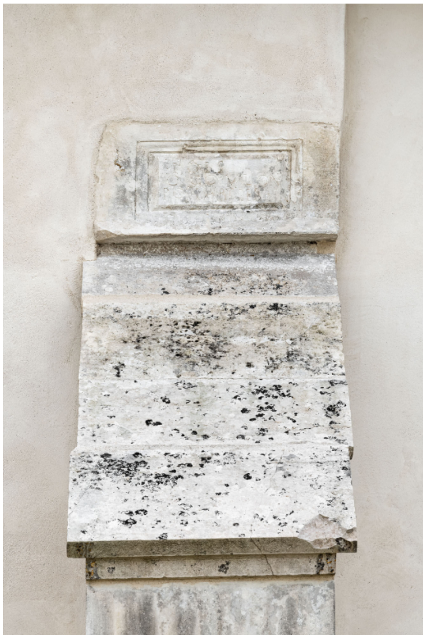
Contrefort en pierre de taille sur le mur nord de la nef surmonté d'un cartouche portant une inscription (dédicace ?). 89, Venoy rue de l' Église