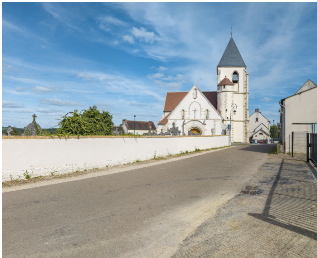
Vue d'ensemble de la façade principale et du clocher.