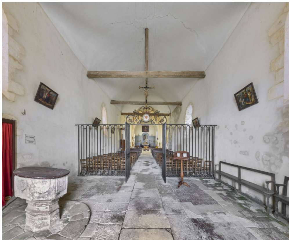
Vue d'ensemble de l'intérieur de l'église depuis la première travée de la nef. A gauche, les fonts baptismaux et au premier plan, la grille de clôture du chœur.