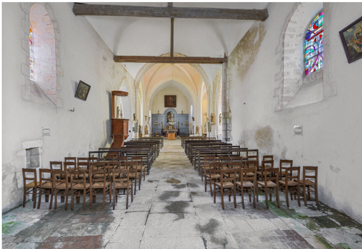
Vue d'ensemble de l'intérieur de l'église depuis la deuxième travée de la nef. 89, Venoy rue de l' Église