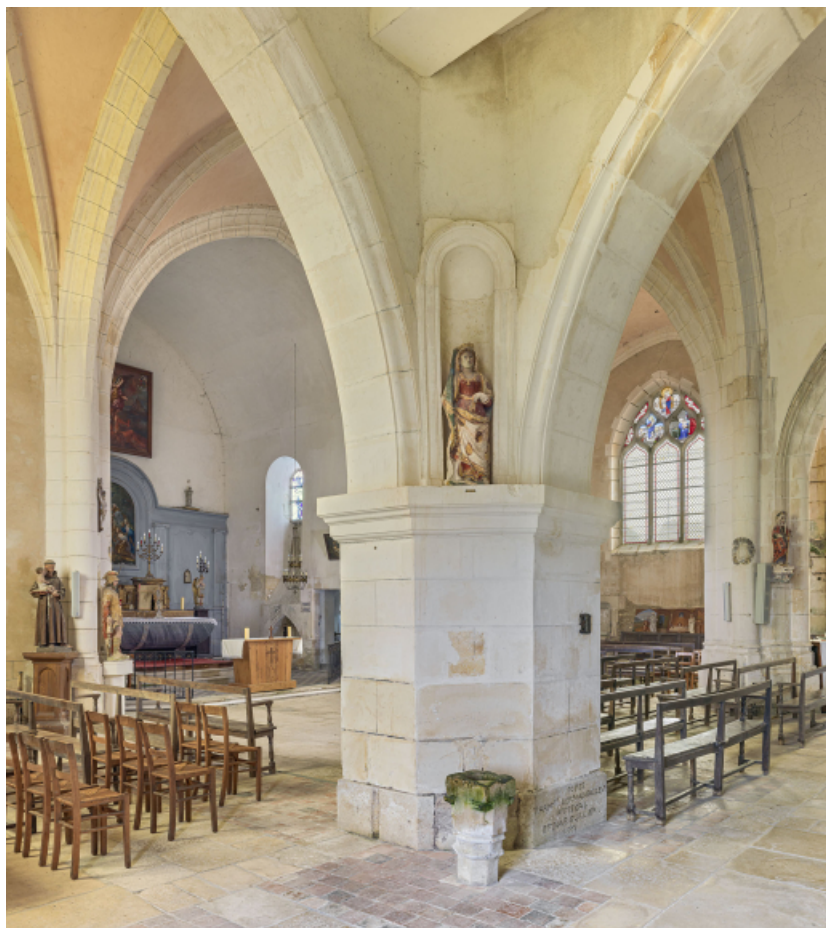
Le chœur vu depuis le transept nord.