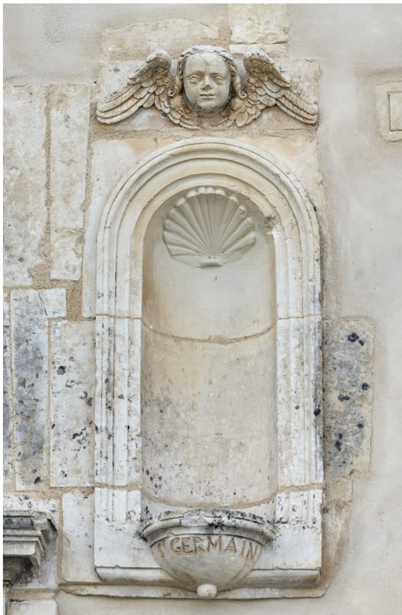
Détail de la niche portant l'inscription de saint Germain.