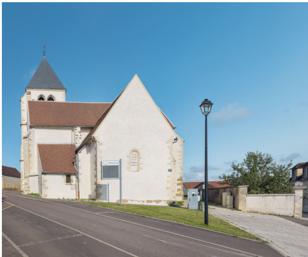
Vue d'ensemble depuis le chevet.