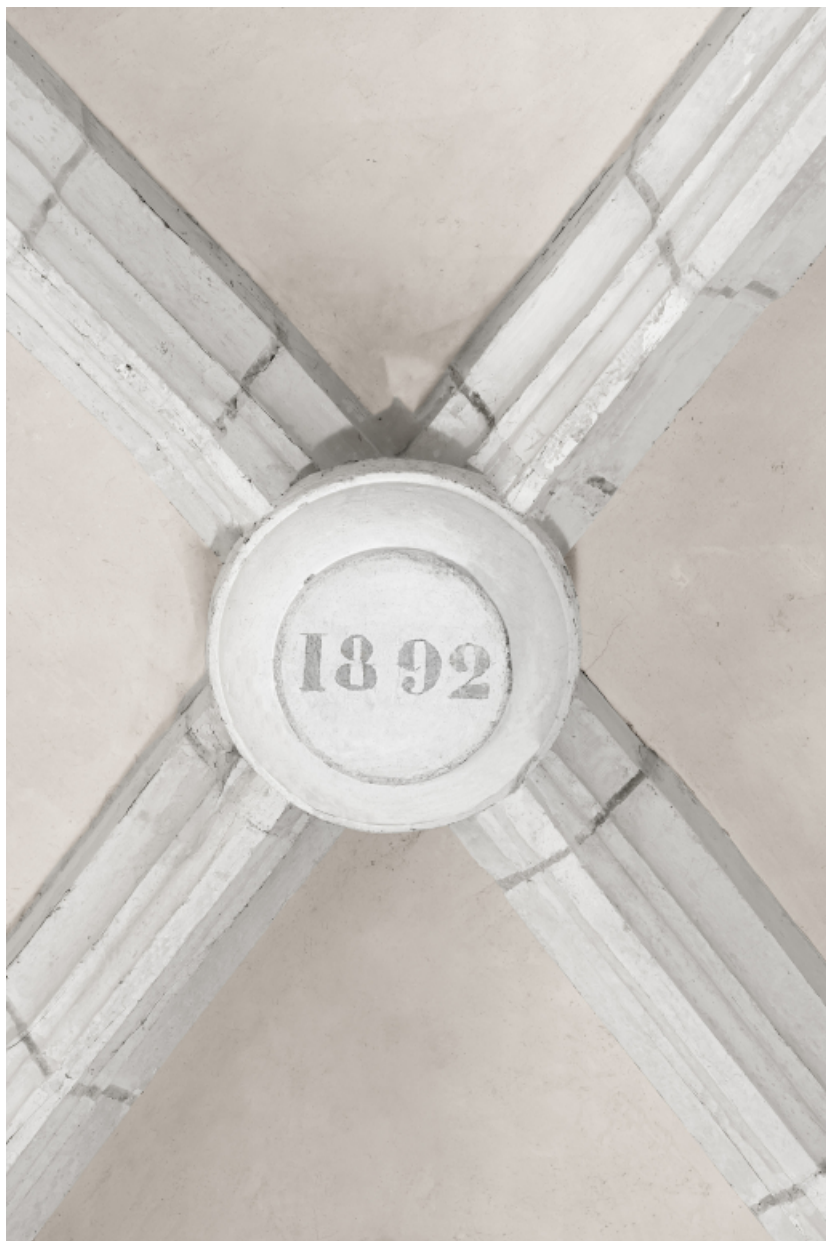
Clef de voûte de la chapelle nord : date (1892).