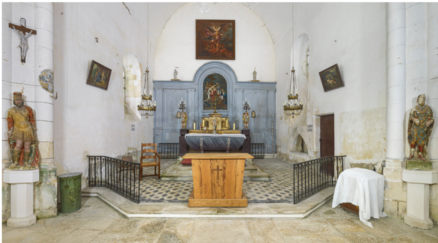
Vue d'ensemble du sanctuaire depuis le chœur. 89, Venoy rue de l' Église