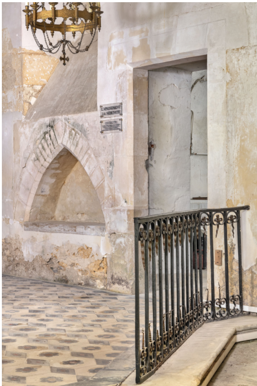
Sanctuaire : grille de communion, lavabo liturgique et porte de la sacristie. 89, Venoy rue de l' Église