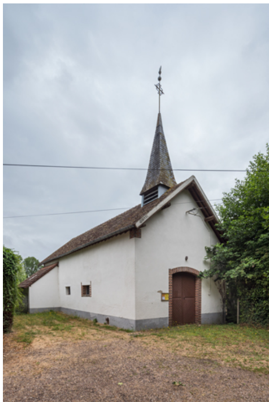
Vue des façades est (antérieure) et sud.

89, Saint-Maurice-Thizouaille rue du Château