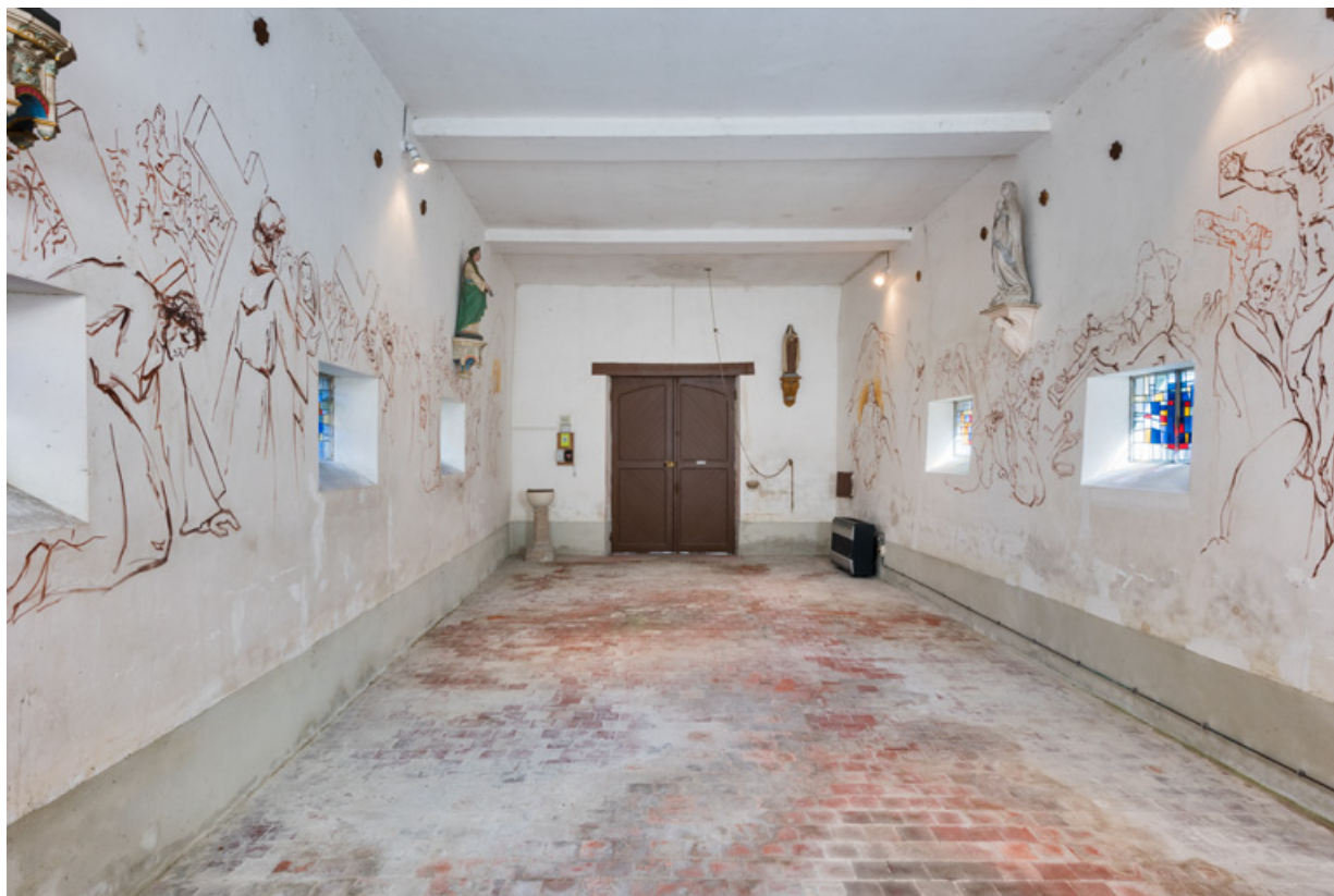
Vue de la nef en direction de l'entrée.

89, Saint-Maurice-Thizouaille rue du Château