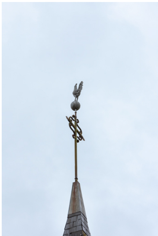
Détail du coq, girouette dominant le campanile.

89, Saint-Maurice-Thizouaille rue du Château