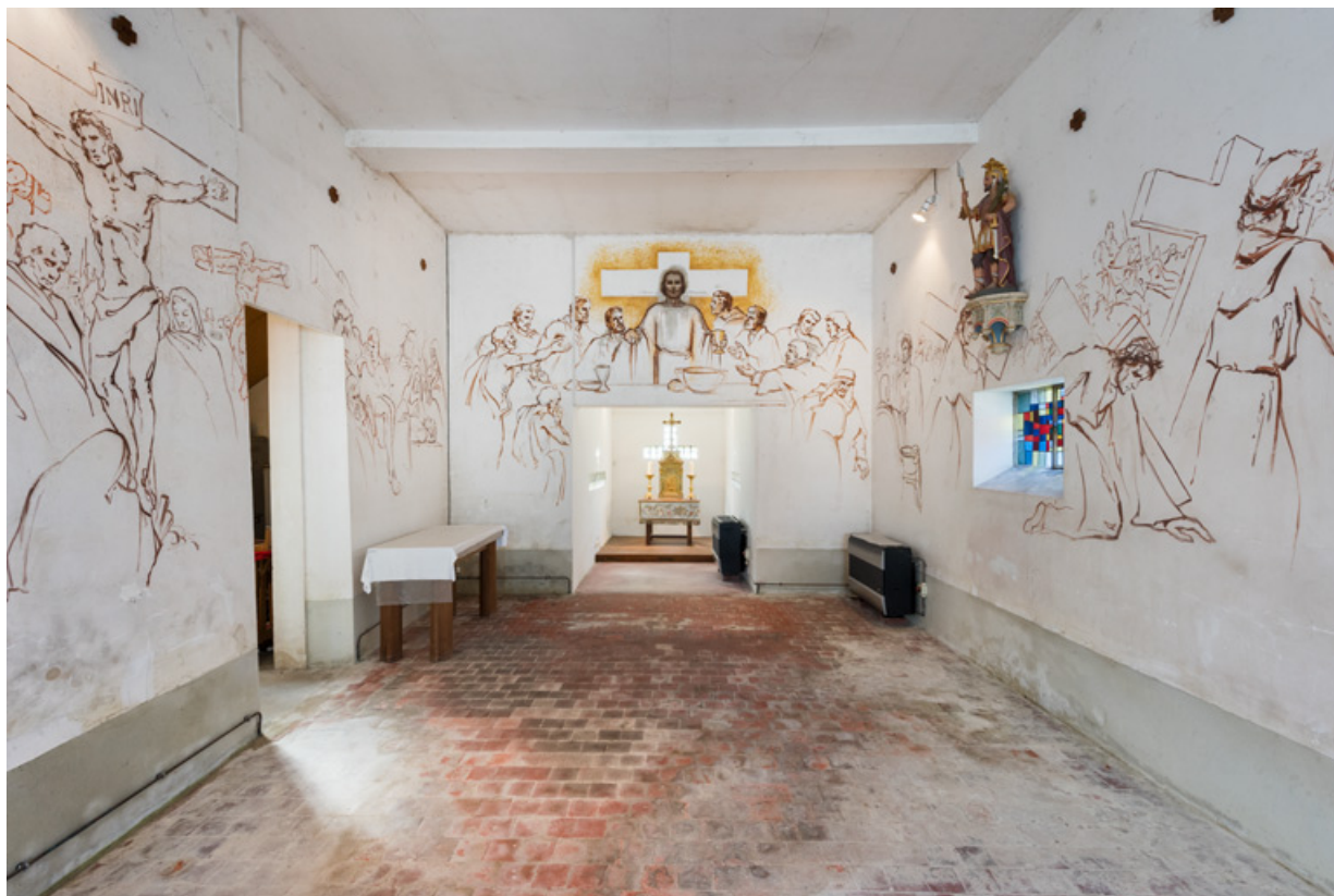
Vue en direction du chœur.

89, Saint-Maurice-Thizouaille rue du Château