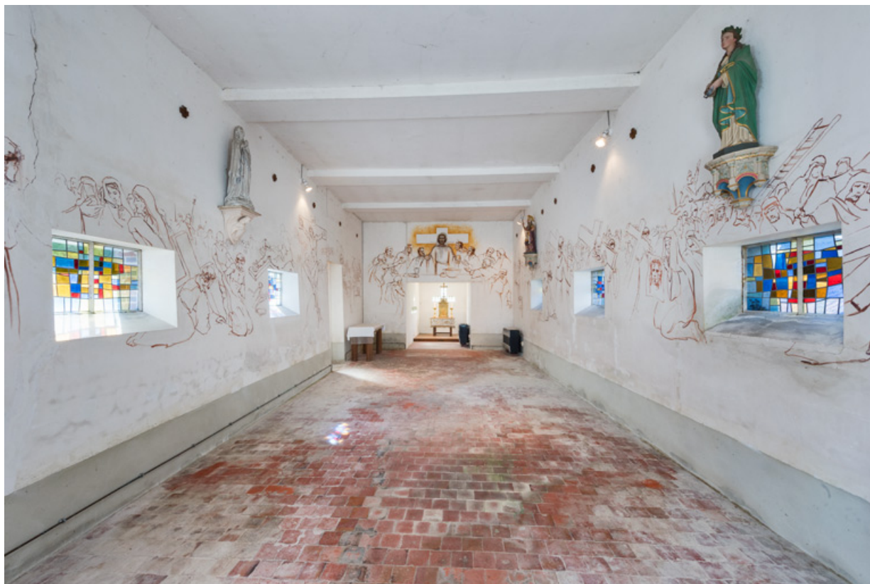
Vue de la nef en direction du chœur.

89, Saint-Maurice-Thizouaille rue du Château