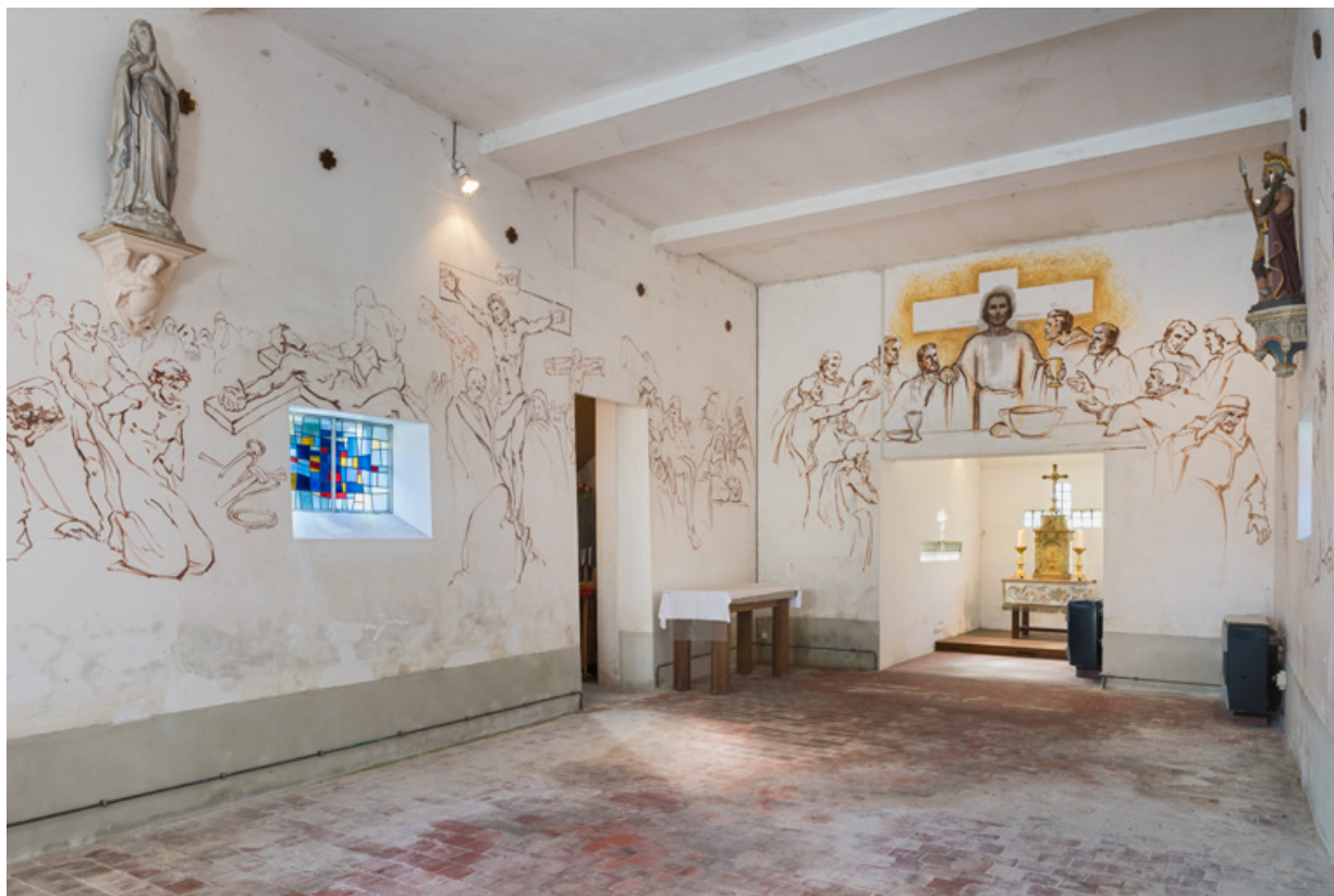
Vue en direction du chœur et de la sacristie.

89, Saint-Maurice-Thizouaille rue du Château