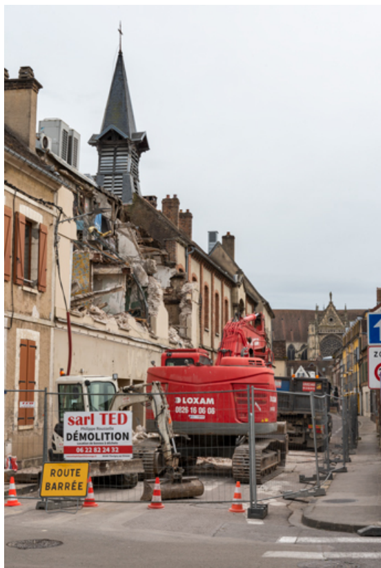
Cinéma Vox (14 rue Victor Guichard) en cours de démolition (22 mars 2023). 89, Sens