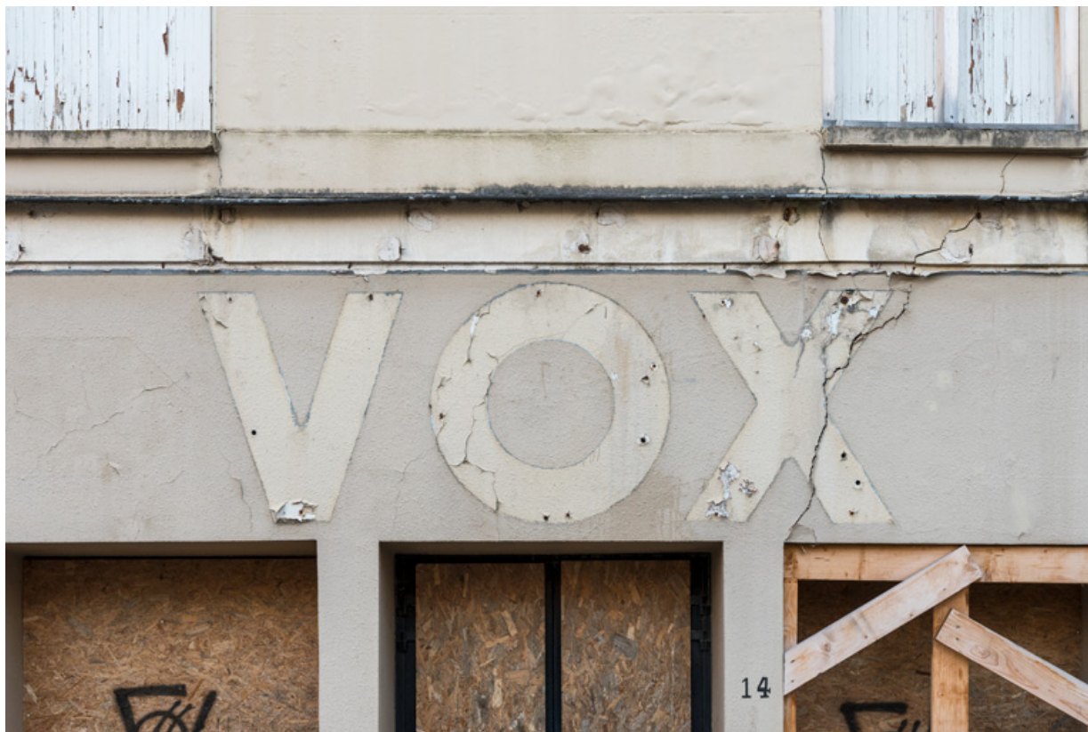
Traces de l'enseigne du Vox (février 2023).