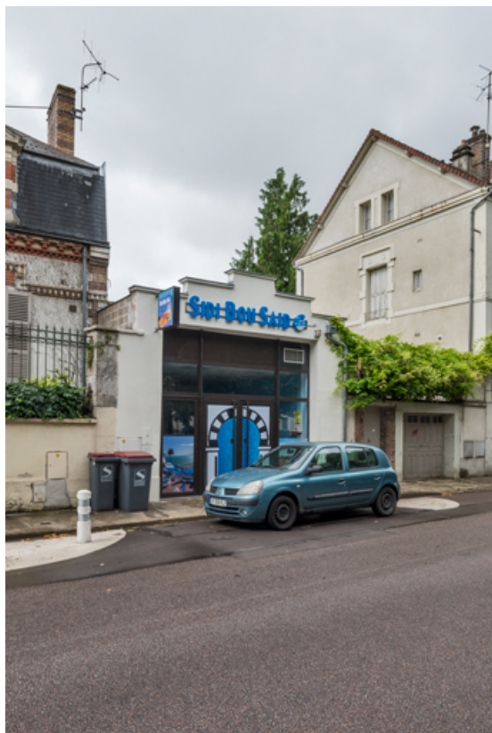
Cinéma Variétés (12 boulevard du Mail).