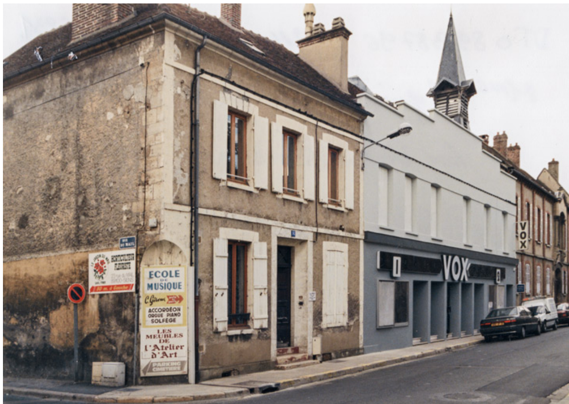
[Façade antérieure du Vox, de trois quarts gauche]. 1996.