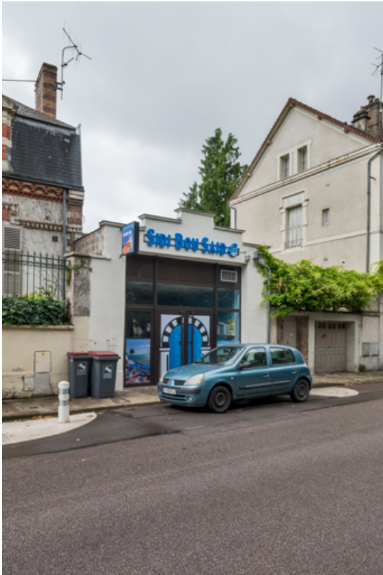
Cinéma Variétés (12 boulevard du Mail).