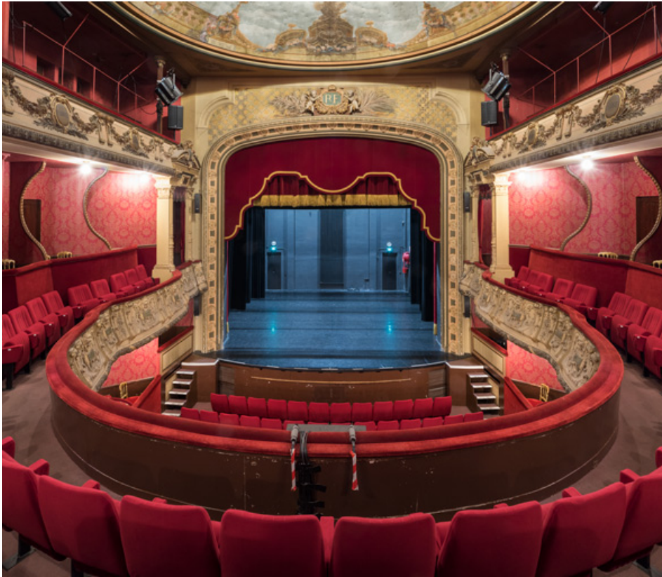
Scène vue de la salle, depuis le 1er balcon.