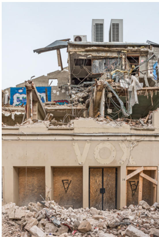
Cinéma Vox (14 rue Victor Guichard) en cours de démolition : entrée (22 mars 2023).