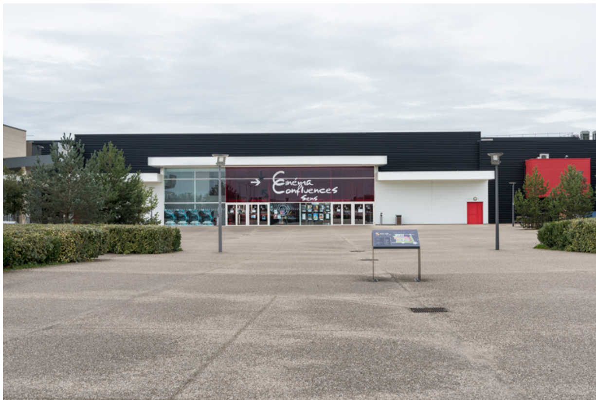
Cinéma Confluences (chemin des Cannetières). 89, Sens