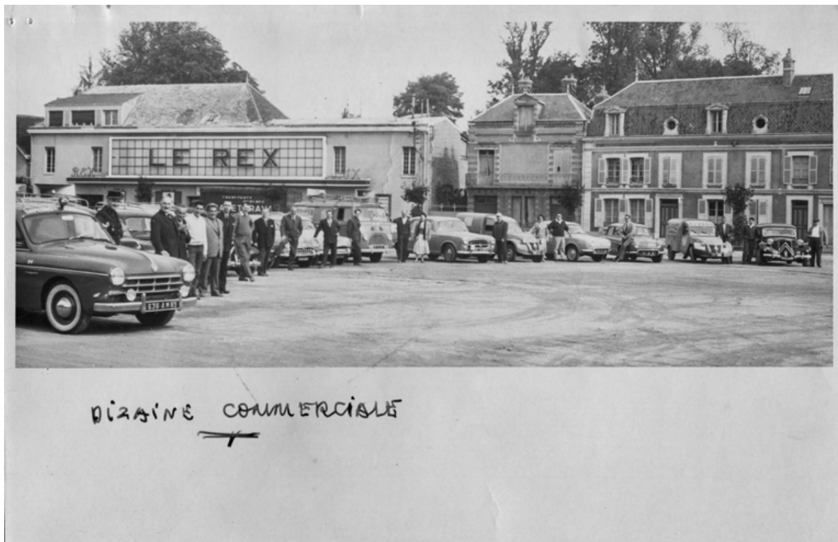
Dizaine commerciale. Les véhicules de la "Caravane" [devant le Rex]. 14 juin 1960.