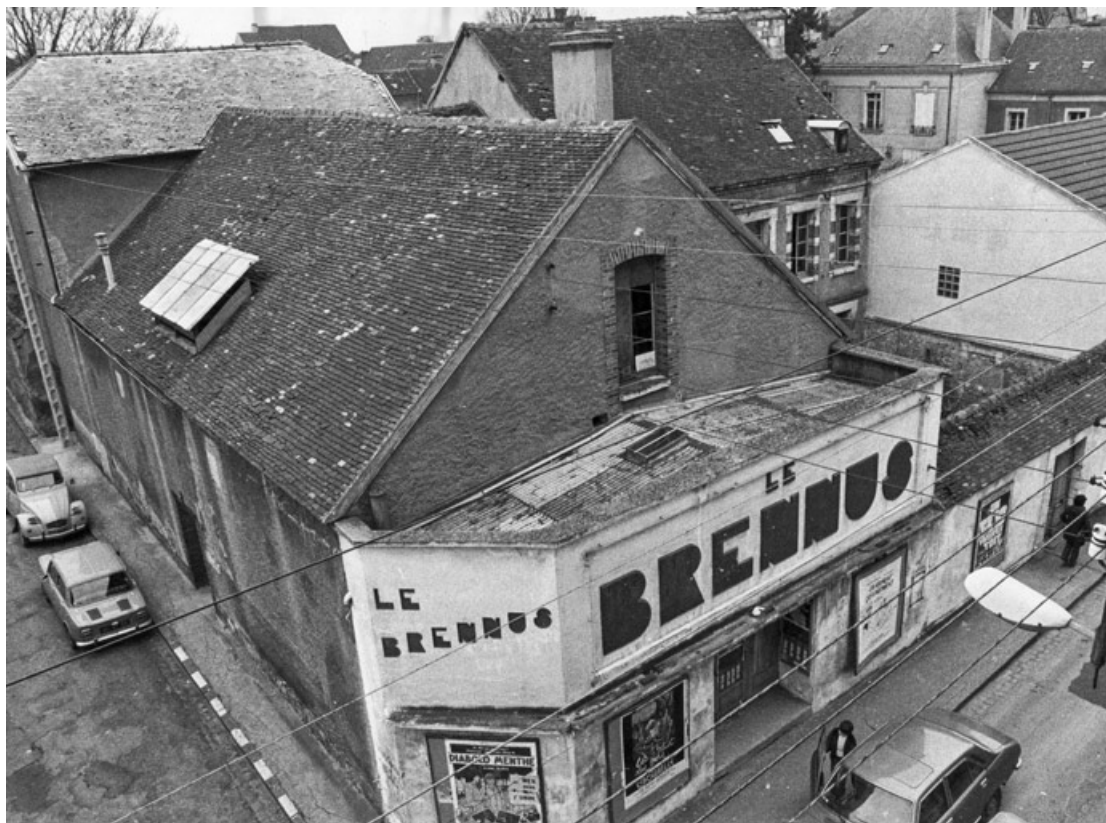
Cinéma le Brennus [vue plongeante]. S.d. [1977]. 89, Sens

Cinéma le Brennus. Photographie noir et blanc, s.n. S.d. [1977]. 17,5 x 24 cm. Inscription au verso : "Brennus. Rue des Déportés et de la Résistance, Sens".