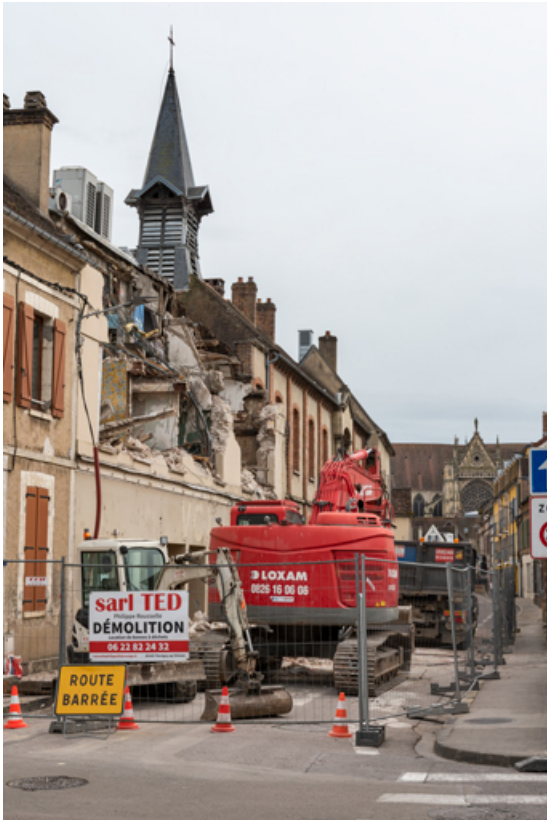
Cinéma Vox (14 rue Victor Guichard) en cours de démolition (22 mars 2023). 89, Sens