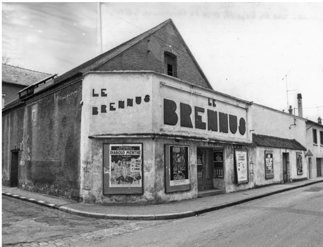
Cinéma le Brennus [de trois quarts gauche]. S.d. [1977].