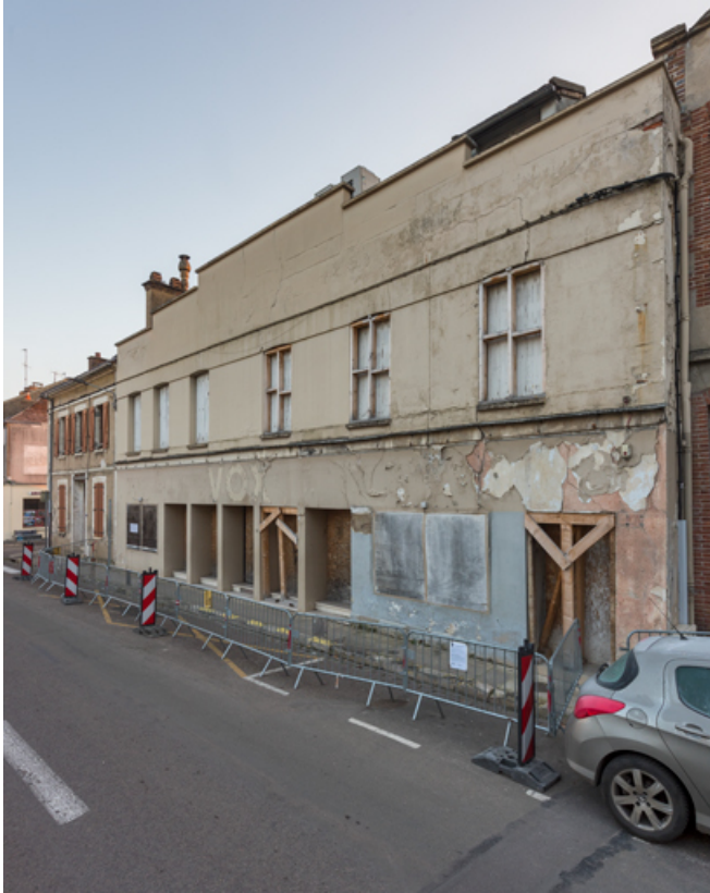
Façade antérieure du Vox, de trois quarts droite (février 2023).