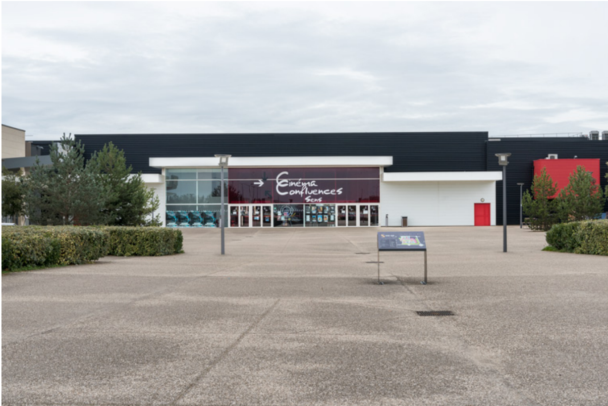
Cinéma Confluences (chemin des Cannetières). 89, Sens