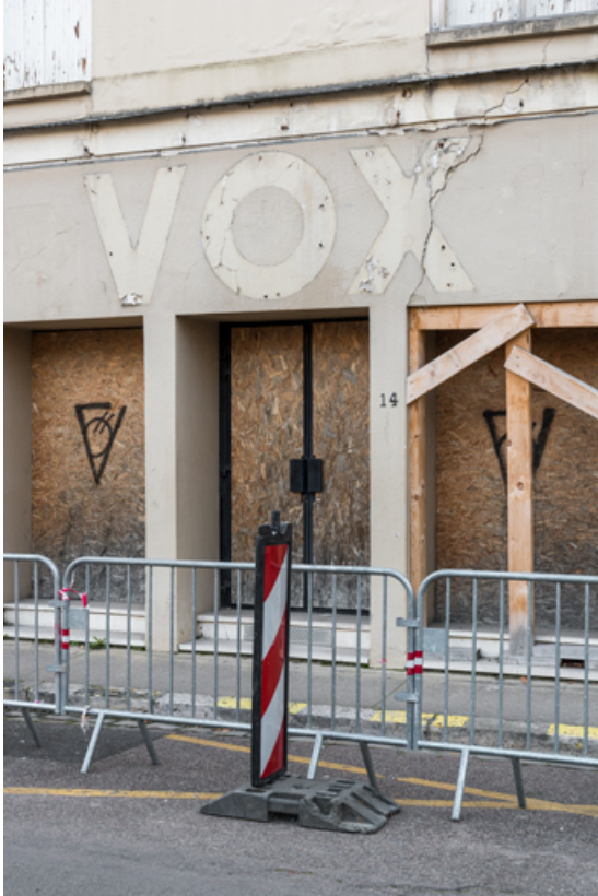
Entrée du Vox, de trois quarts droite (février 2023). 89, Sens