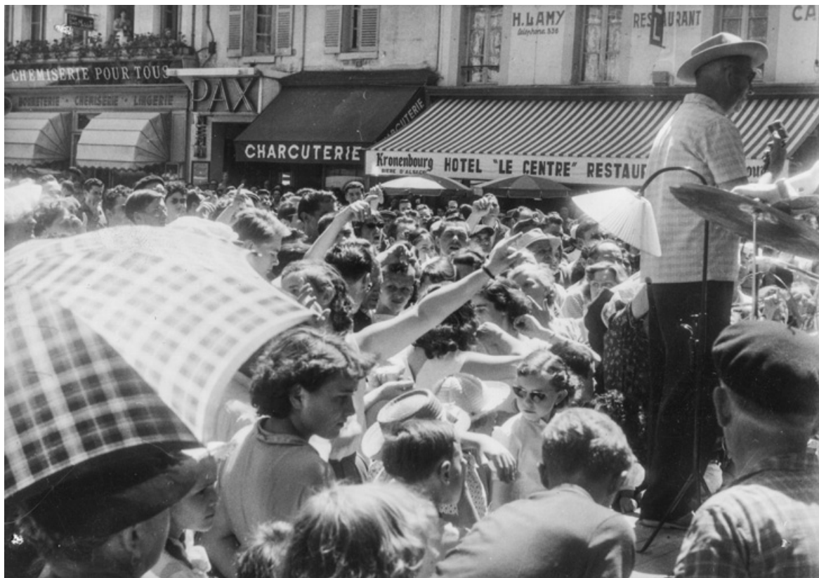
Sens braderie 60 (Place de la République) [montrant l'entrée du Pax]. 1960.