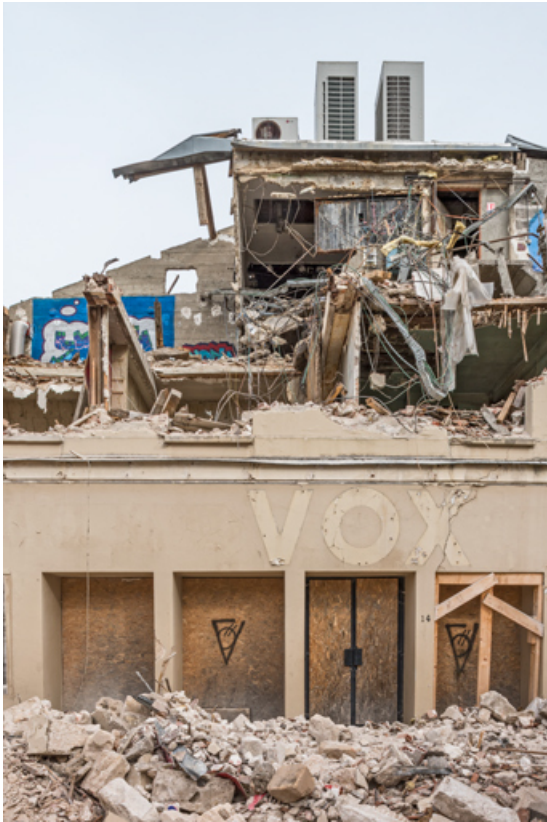
Cinéma Vox (14 rue Victor Guichard) en cours de démolition : entrée (22 mars 2023).