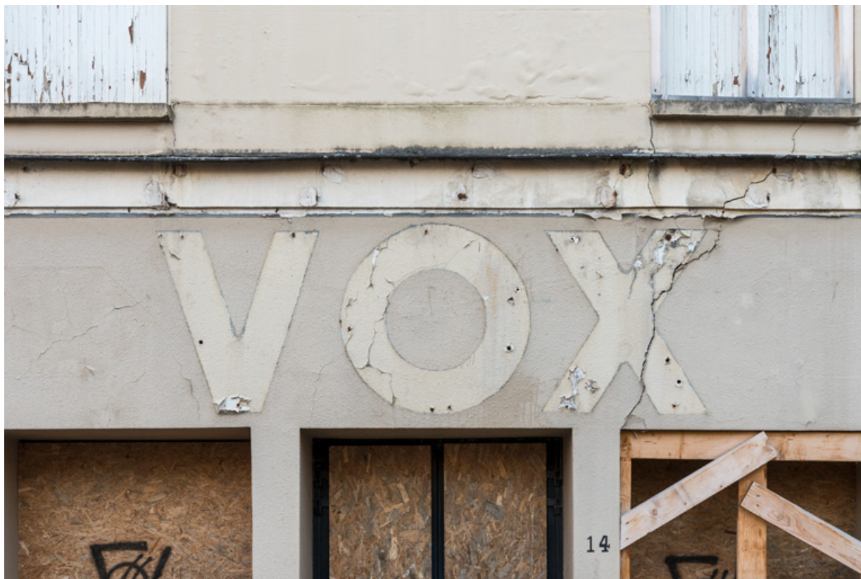
Traces de l'enseigne du Vox (février 2023). 89, Sens