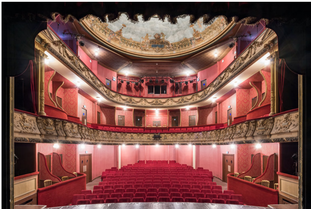
Salle, vue de la scène.