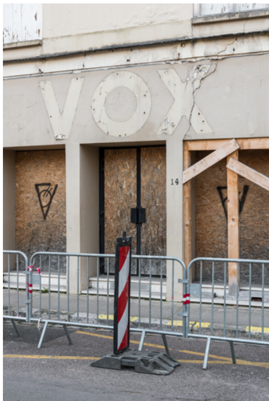
Entrée du Vox, de trois quarts droite (février 2023). 89, Sens