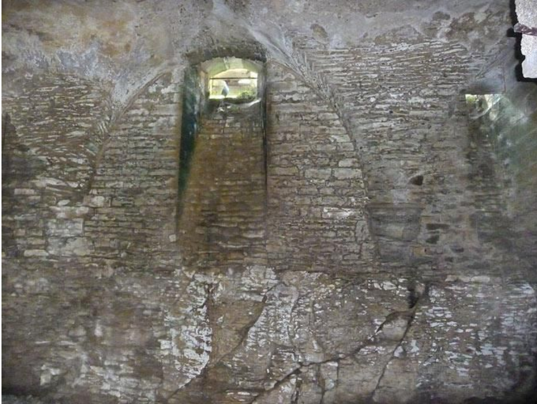
Cave sous la grange : soubassement rocheux, souterrain et culots.

89, Vézelay Fontenay-près-Vézelay à Vézelay, lieudit : la Maladrerie