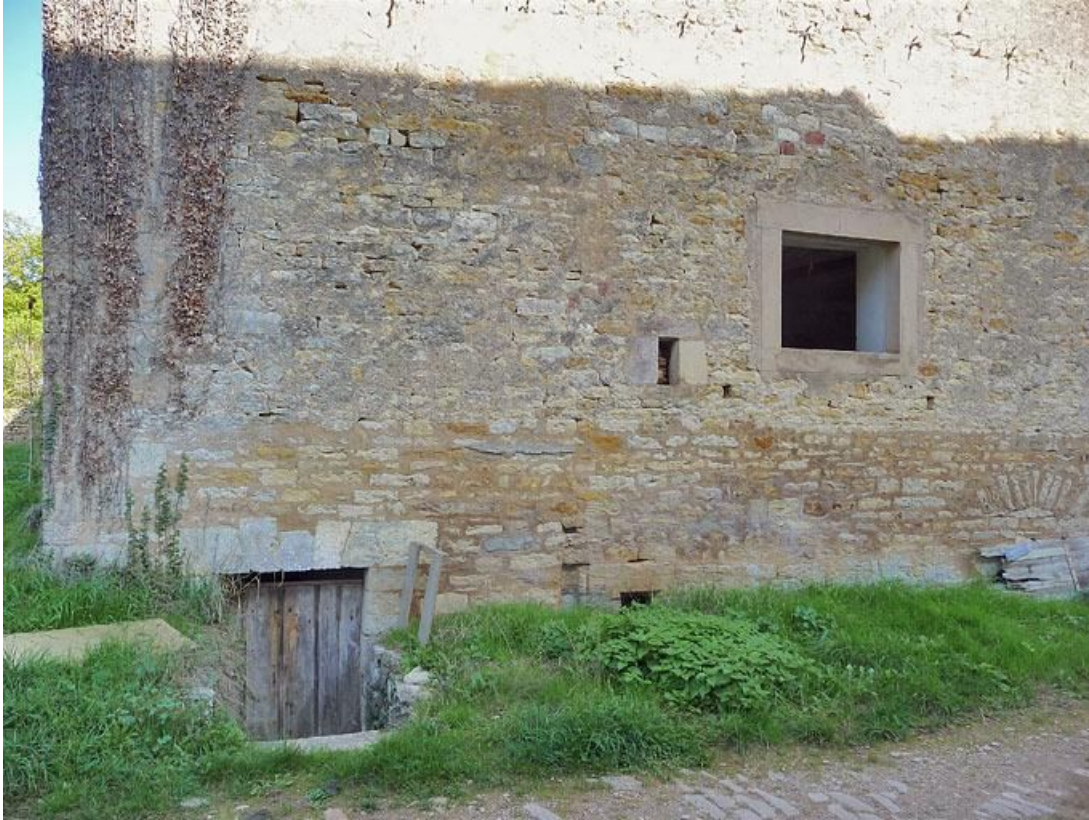
Entrée de la cave de la grange située dans le mur droit.

89, Vézelay Fontenay-près-Vézelay à Vézelay, lieudit : la Maladrerie