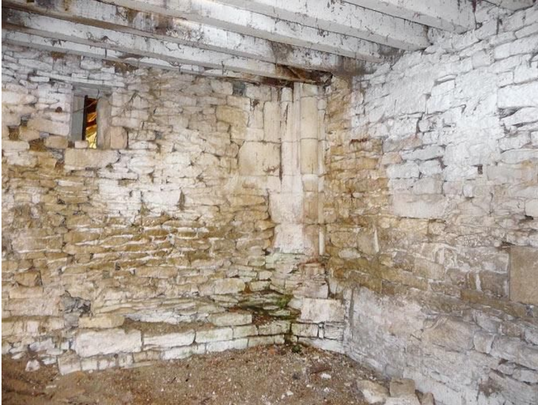
Chapelle, corps postérieur : vue de l'angle sud-ouest.

89, Vézelay Fontenay-près-Vézelay à Vézelay, lieudit : la Maladrerie