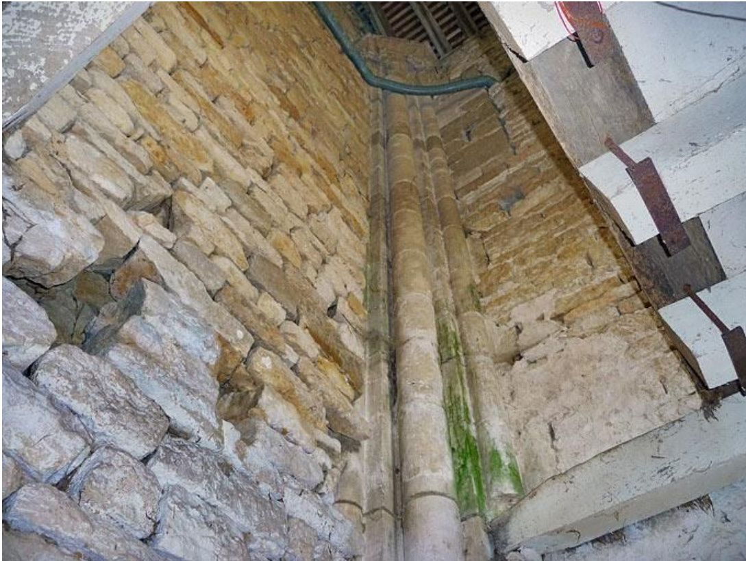
Chapelle, corps postérieur : partie supérieure des colonnes de l'angle nord-ouest.

89, Vézelay Fontenay-près-Vézelay à Vézelay, lieudit : la Maladrerie