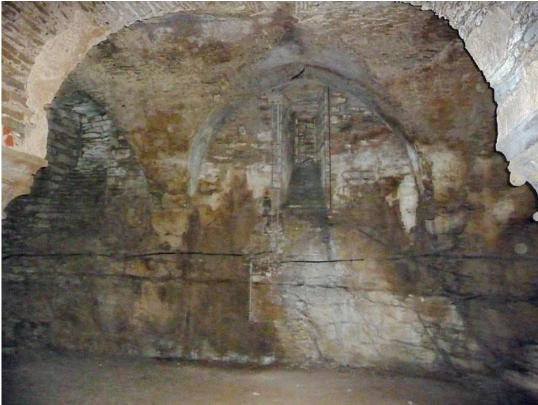
Cave sous la grange : voûte sur colonnes et culots.

89, Vézelay Fontenay-près-Vézelay à Vézelay, lieudit : la Maladrerie