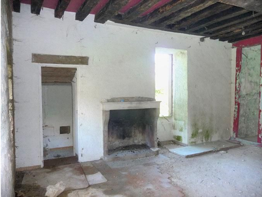
Première pièce du logis du rez-de-chaussée de la grange.

89, Vézelay Fontenay-près-Vézelay à Vézelay, lieudit : la Maladrerie