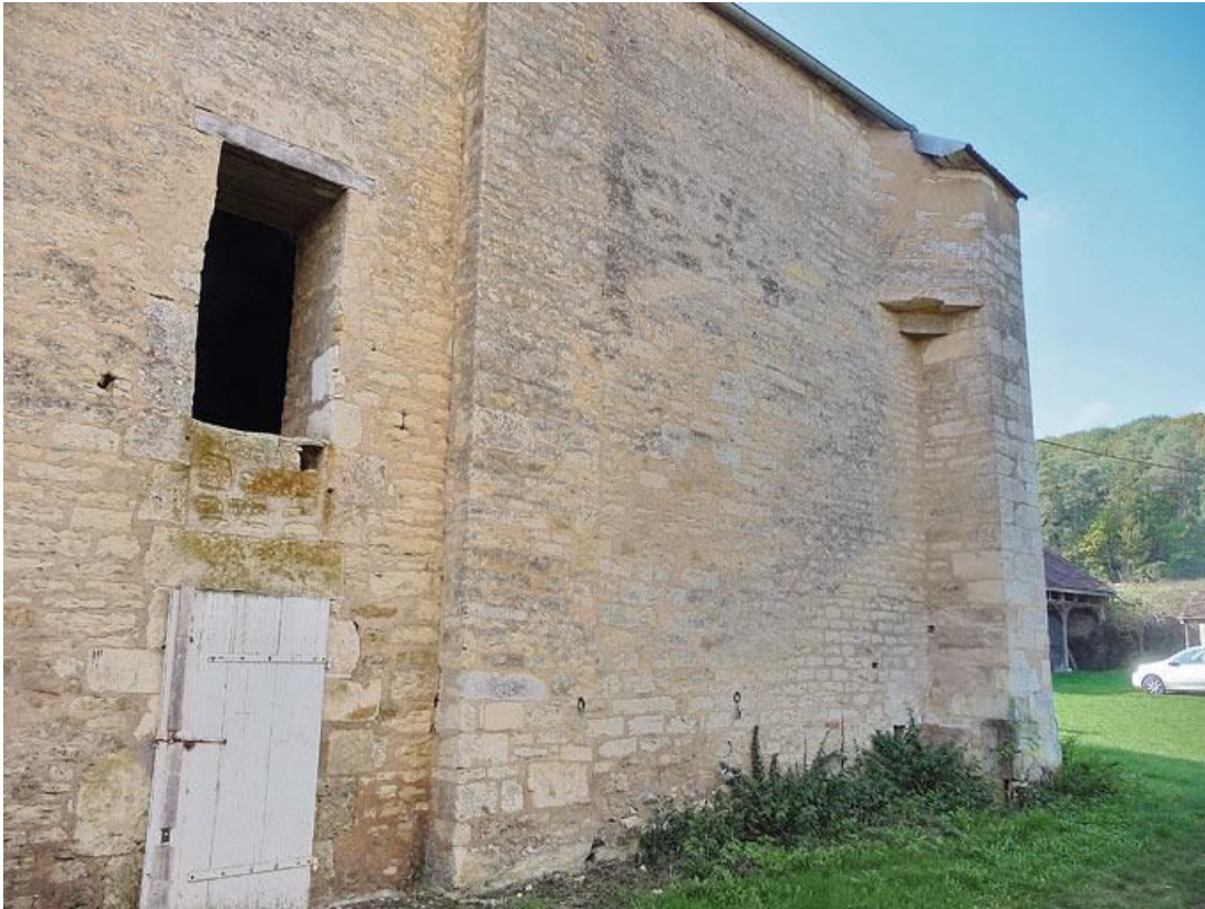
Partie du mur gauche de la chapelle.

89, Vézelay Fontenay-près-Vézelay à Vézelay, lieudit : la Maladrerie