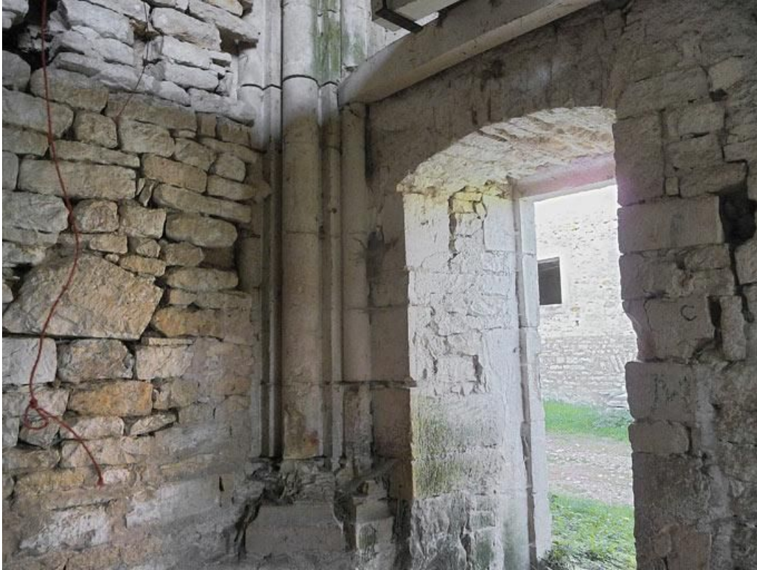
Chapelle, corps postérieur : départ des colonnes de l'angle nord-ouest.

89, Vézelay Fontenay-près-Vézelay à Vézelay, lieudit : la Maladrerie