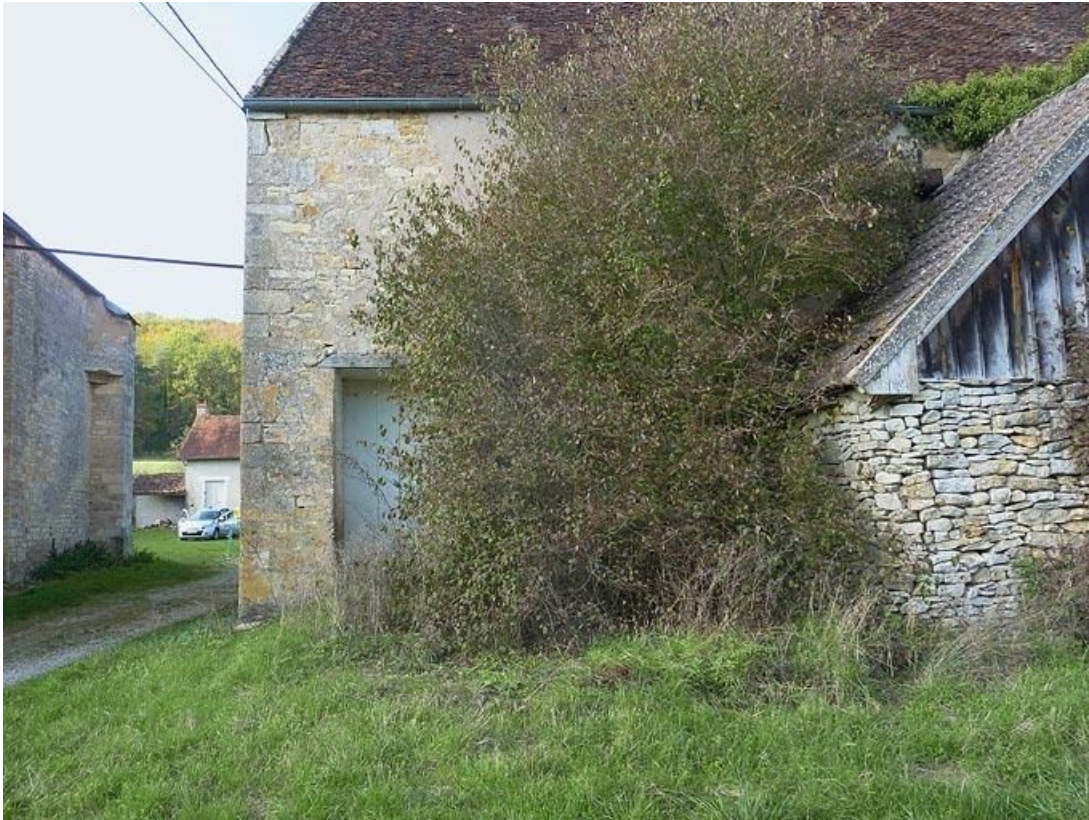
Partie du mur postérieur de la grange, côté entrée de la cour.

89, Vézelay Fontenay-près-Vézelay à Vézelay, lieudit : la Maladrerie