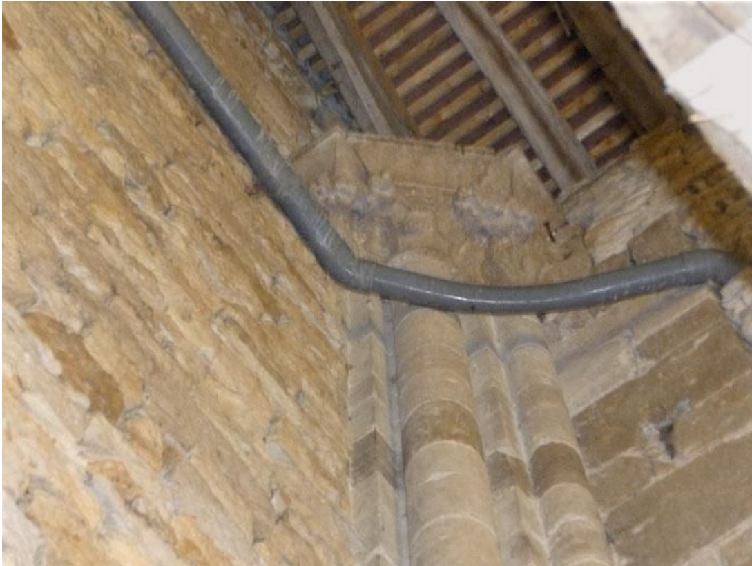
Chapelle, corps postérieur : chapiteaux des colonnes de l'angle nord-ouest.

89, Vézelay Fontenay-près-Vézelay à Vézelay, lieudit : la Maladrerie