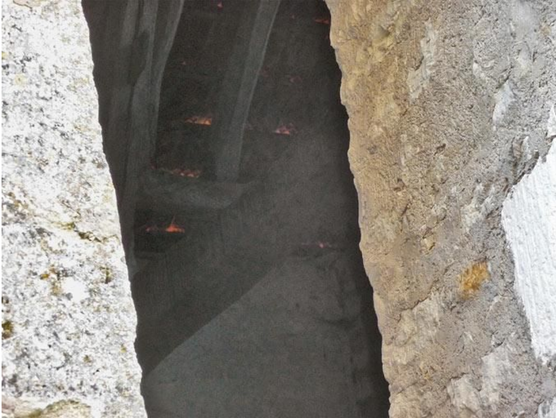
Chapelle, corps antérieur : détail de la charpente.

89, Vézelay Fontenay-près-Vézelay à Vézelay, lieudit : la Maladrerie