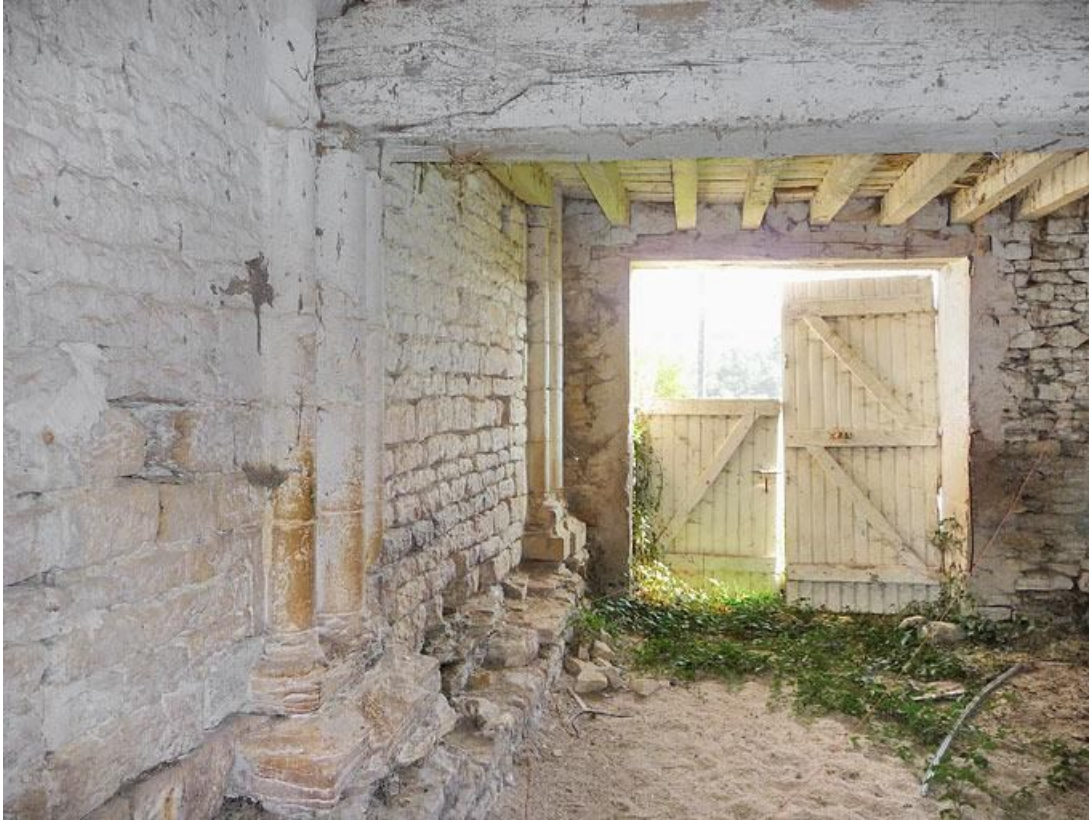
Chapelle, corps postérieur : colonnes engagées du mur sud.

89, Vézelay Fontenay-près-Vézelay à Vézelay, lieudit : la Maladrerie