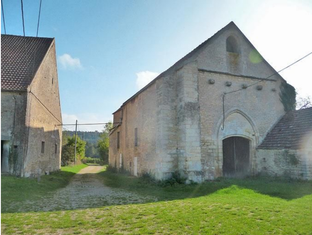
Entrée de la cour, passage entre la grange et la chapelle.

89, Vézelay Fontenay-près-Vézelay à Vézelay, lieudit : la Maladrerie