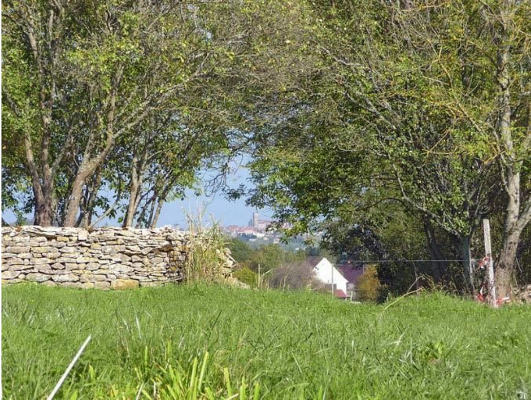
Vue sur Vézelay depuis l'enclos de la maladrerie.

89, Vézelay Fontenay-près-Vézelay à Vézelay, lieudit : la Maladrerie