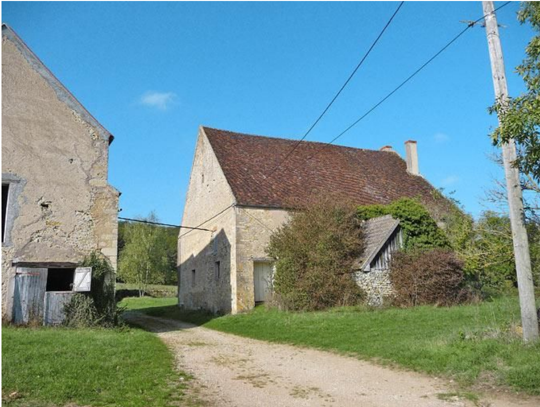
Murs postérieurs de la chapelle et de la grange.

89, Vézelay Fontenay-près-Vézelay à Vézelay, lieudit : la Maladrerie