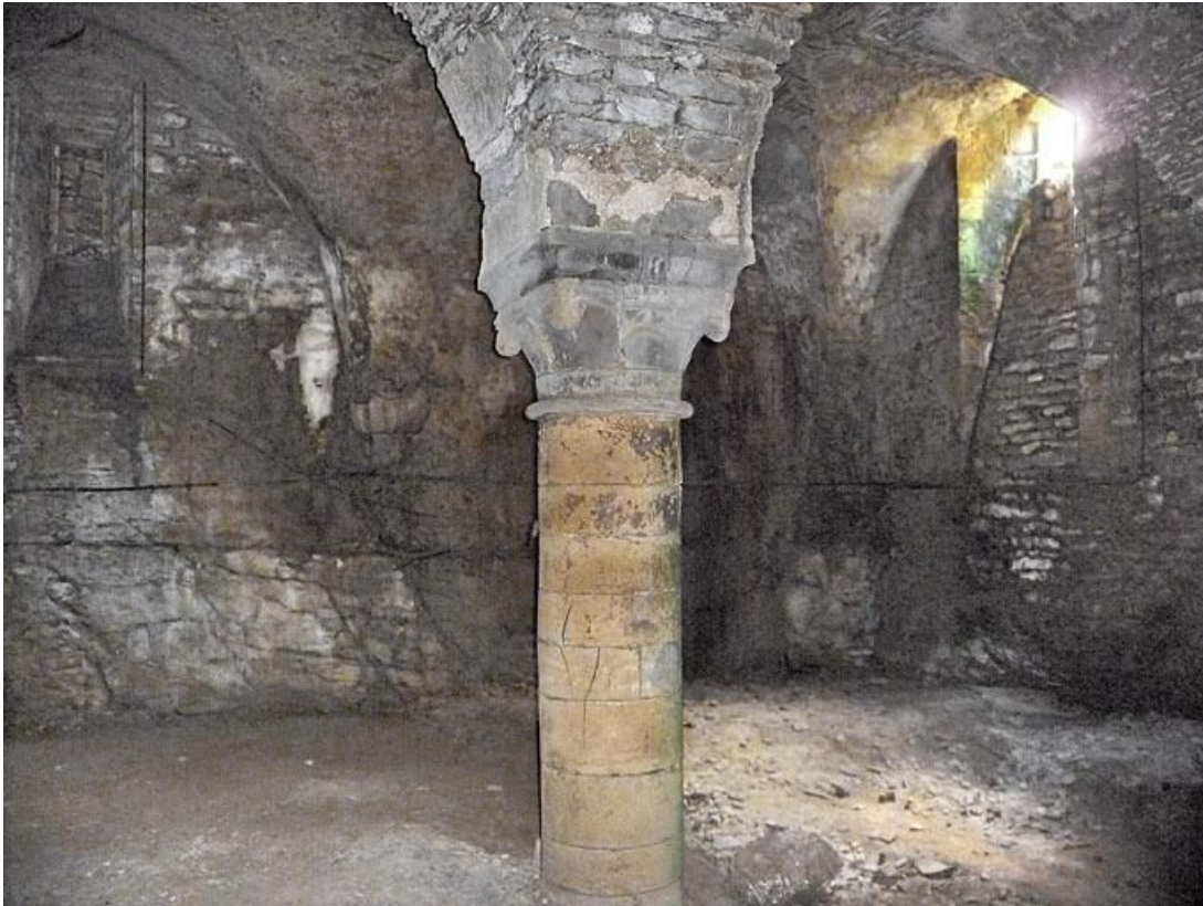
Cave sous la grange, vue d'un angle.

89, Vézelay Fontenay-près-Vézelay à Vézelay, lieudit : la Maladrerie