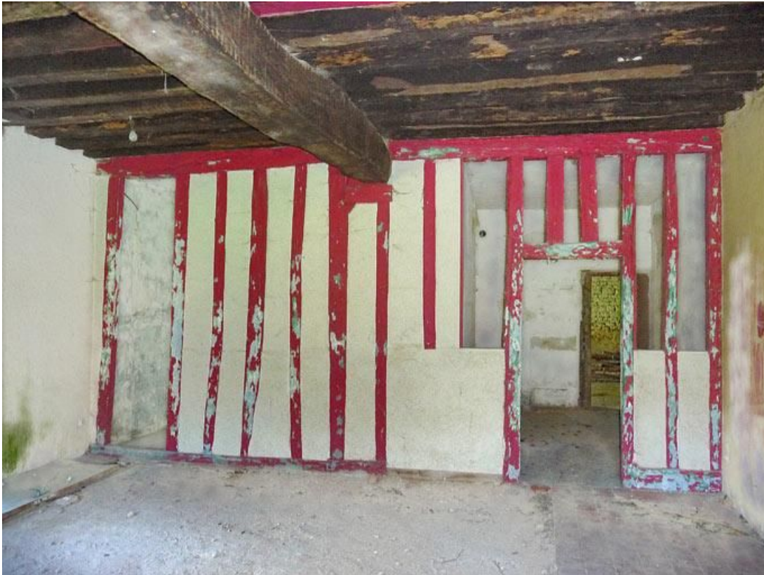
Première pièce du logis du rez-de-chaussée de la grange, cloison en pans de bois.

89, Vézelay Fontenay-près-Vézelay à Vézelay, lieudit : la Maladrerie