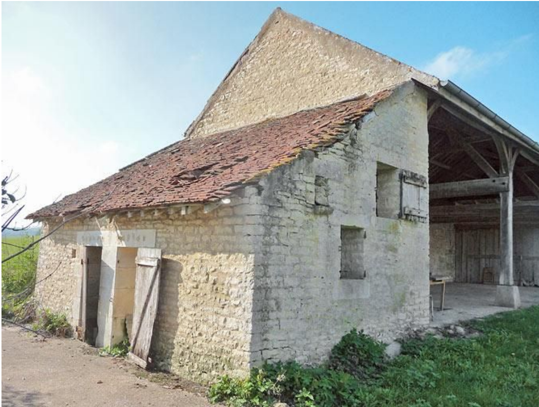
Petite dépendance prolongeant le hangar.

89, Vézelay Fontenay-près-Vézelay à Vézelay, lieudit : la Maladrerie