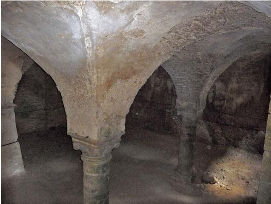
Cave sous la grange, vue d'ensemble depuis l'escalier.

89, Vézelay Fontenay-près-Vézelay à Vézelay, lieudit : la Maladrerie