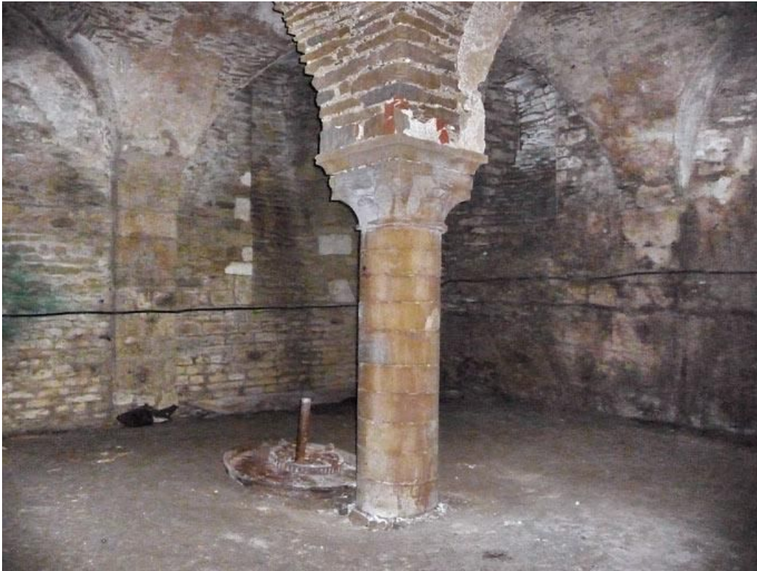
Cave sous la grange, supports des voûtes : pilastre, colonne et culot.

89, Vézelay Fontenay-près-Vézelay à Vézelay, lieudit : la Maladrerie