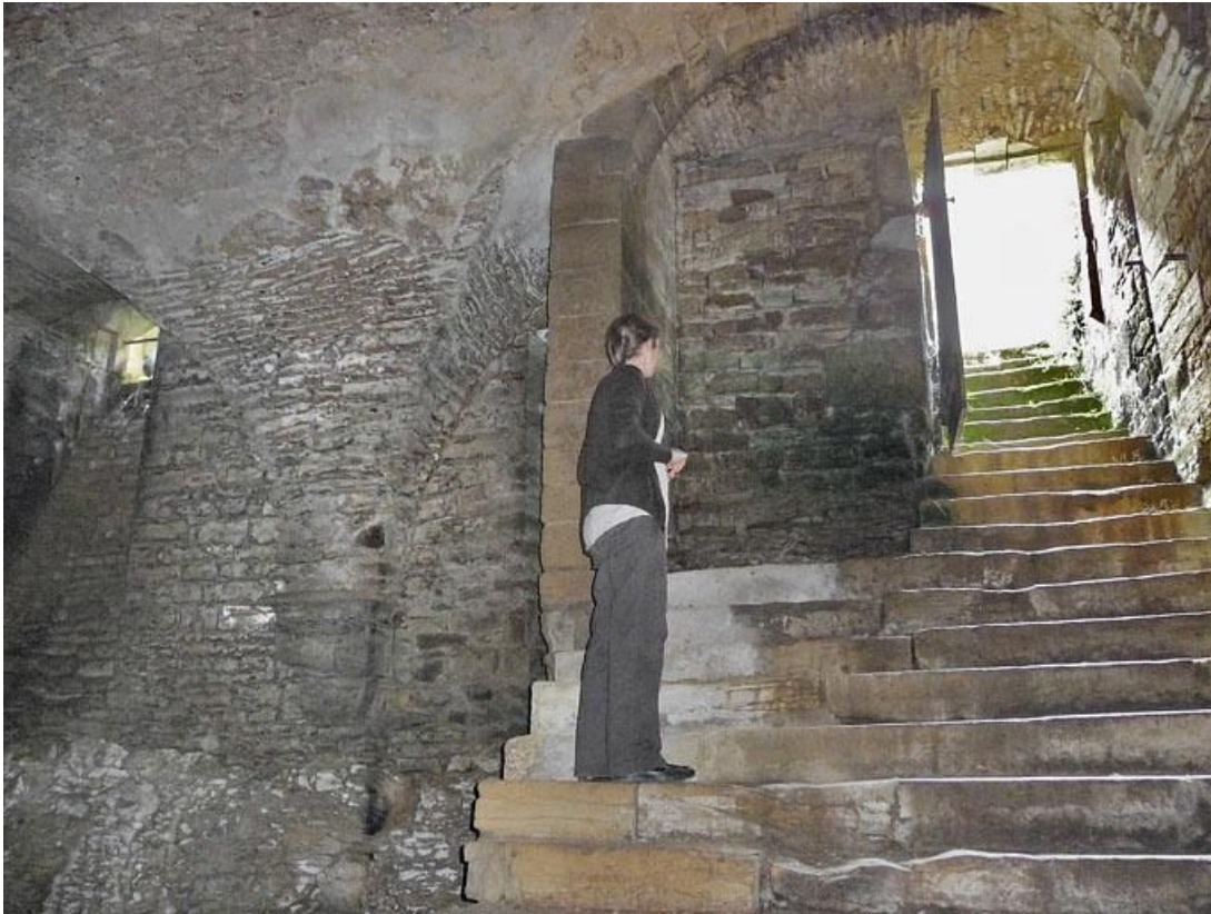
Cave sous la grange : escalier.

89, Vézelay Fontenay-près-Vézelay à Vézelay, lieudit : la Maladrerie