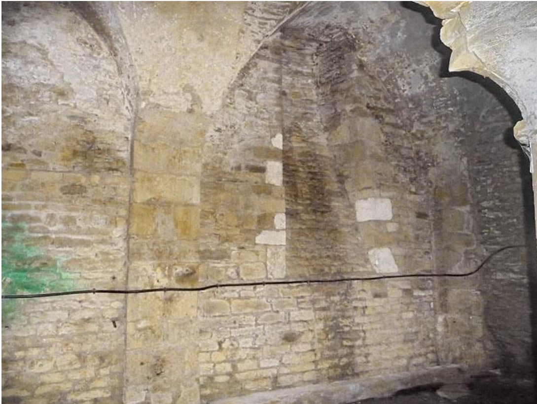
Cave sous la grange, pilastre et chapiteau d'une colonne.

89, Vézelay Fontenay-près-Vézelay à Vézelay, lieudit : la Maladrerie