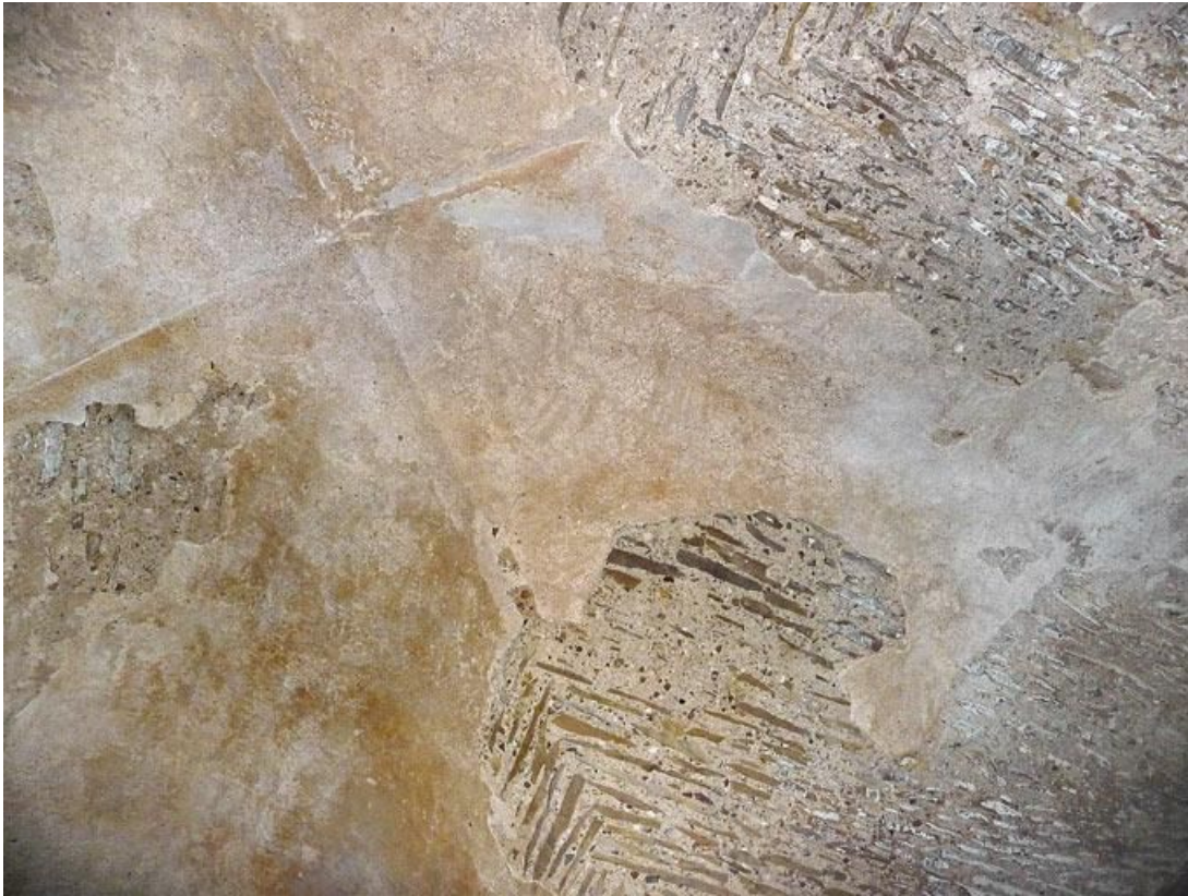
Cave sous la grange, détail de la voûte.

89, Vézelay Fontenay-près-Vézelay à Vézelay, lieudit : la Maladrerie