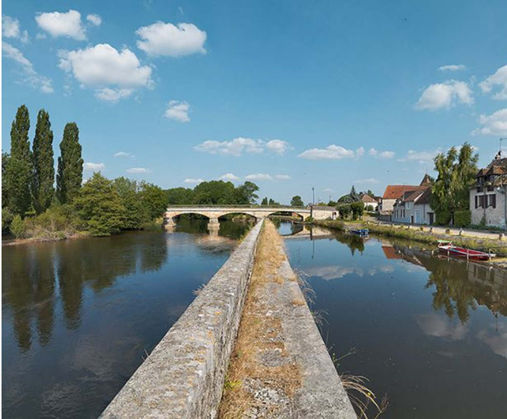
Pont d'Accolay et village sur la droite, vus depuis la digue. A gauche, la Cure. 89, Accolay, lieudit : bief 02 de l'embranchement de Vermenton