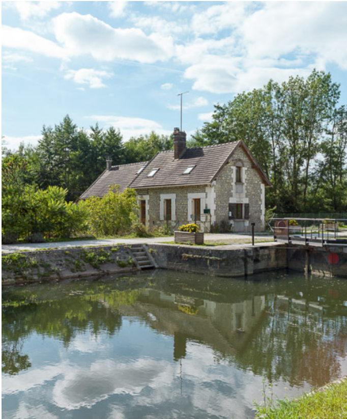
Vue du sas et de la maison éclusière.

89, Auxerre, lieudit : bief 80 du versant Seine