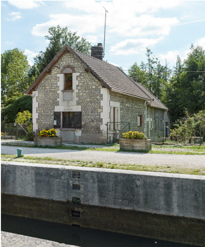
Vue de la maison éclusière.

89, Auxerre, lieudit : bief 80 du versant Seine