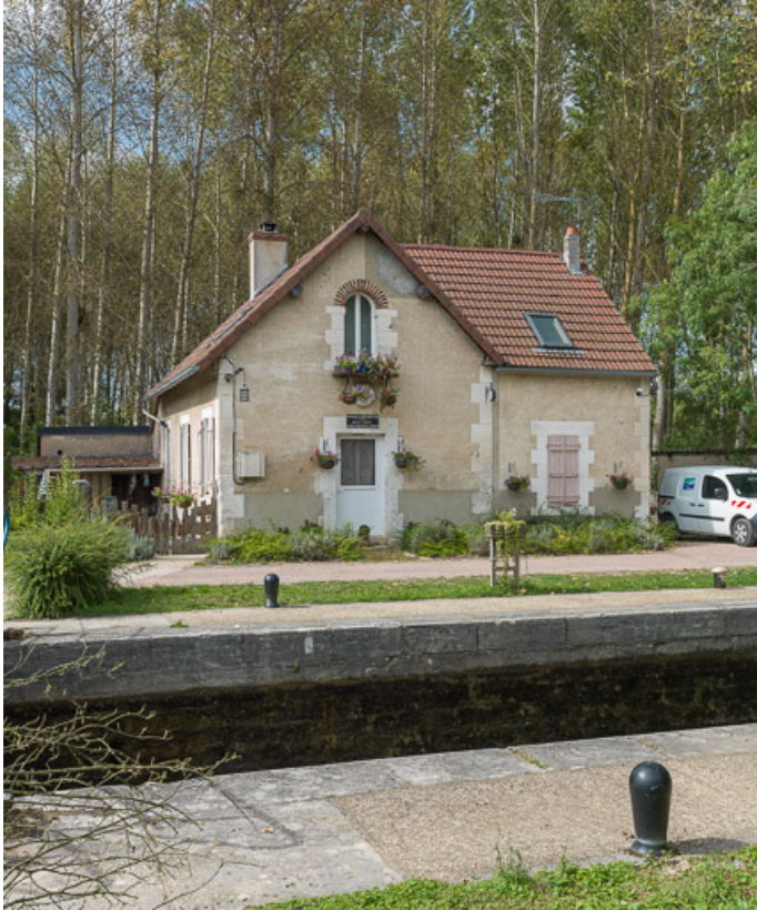
Vue de la maison éclusière.

89, Auxerre, lieudit : bief 79 du versant Seine