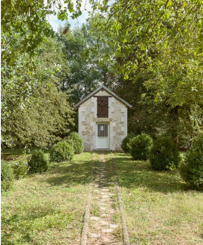
Vue de l'annexe agricole.

89, Auxerre, lieudit : bief 79 du versant Seine