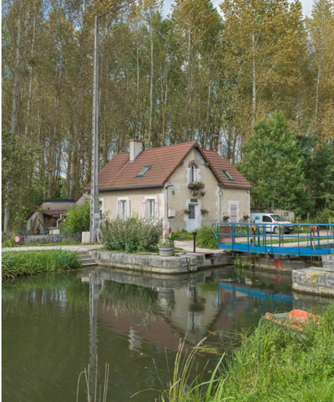
Vue du sas et de la maison éclusière.

89, Auxerre, lieudit : bief 79 du versant Seine