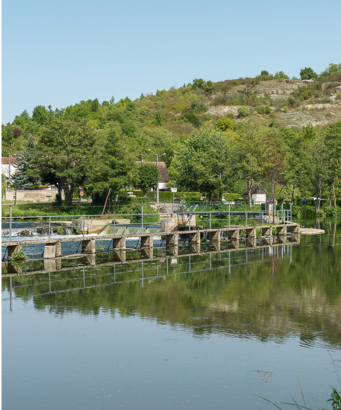
Vue du barrage.

89, Escolives-Sainte-Camille, lieudit : bief 75 du versant Seine