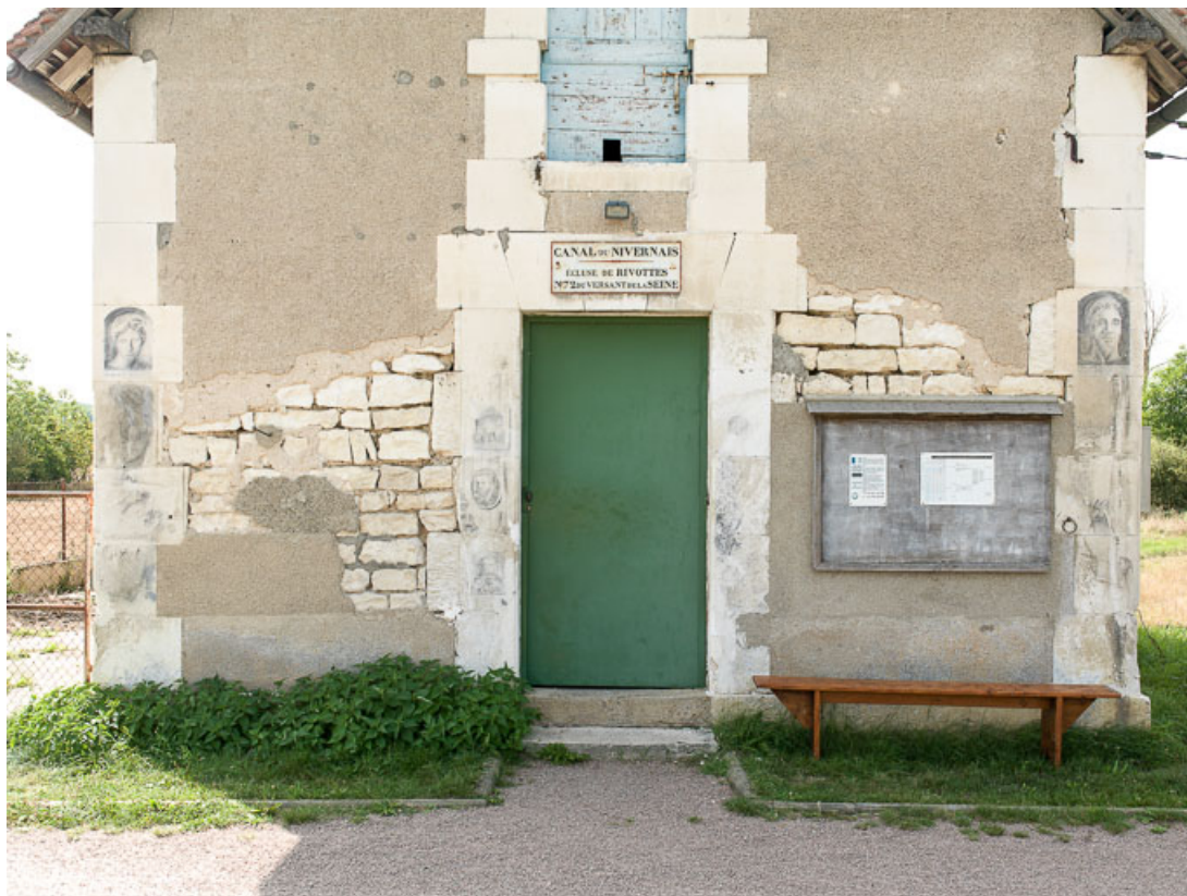
Maison éclusière. Détail du mur pignon, avec la porte d'entrée surmontée d'une fenêtre en plein-cintre. 89, Cravant, lieudit : bief 72 du versant Seine