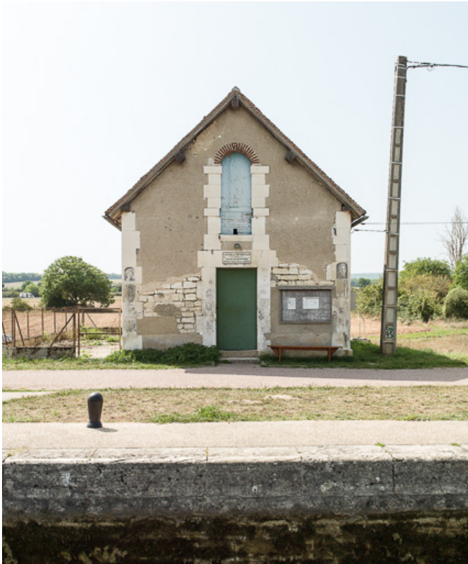
Vue du mur pignon de la maison éclusière.

89, Cravant, lieudit : bief 72 du versant Seine