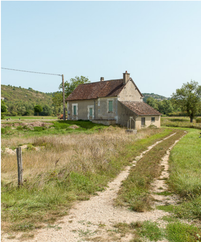
Vue de la maison éclusière.

89, Cravant, lieudit : bief 72 du versant Seine