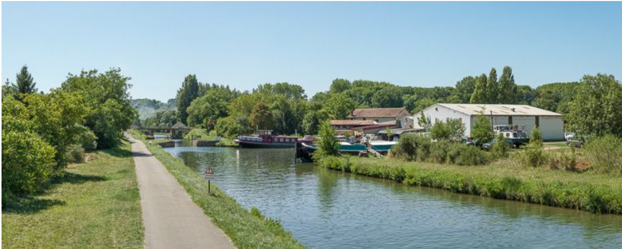
Le port avec les hangars et l'écluse de garde.

N° de l'illustration : 20138900146NUC4AQ