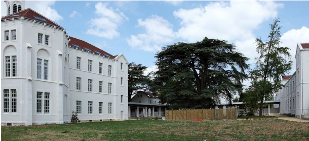
Façade postérieure du bâtiment central et ancien quartier des femmes.

89, Auxerre, 2-4 avenue Charles-de-Gaulle