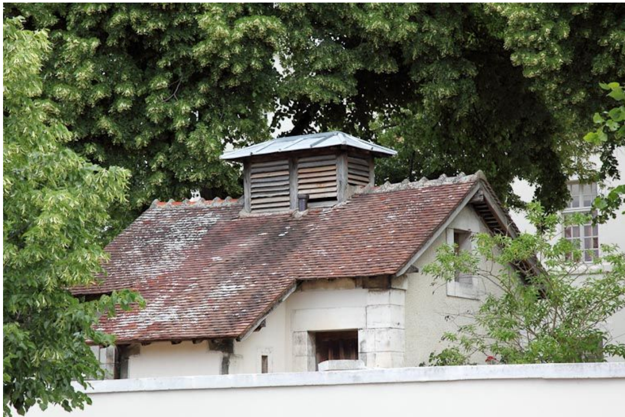
Petite dépendance vue de la rue.

89, Auxerre, 2-4 avenue Charles-de-Gaulle