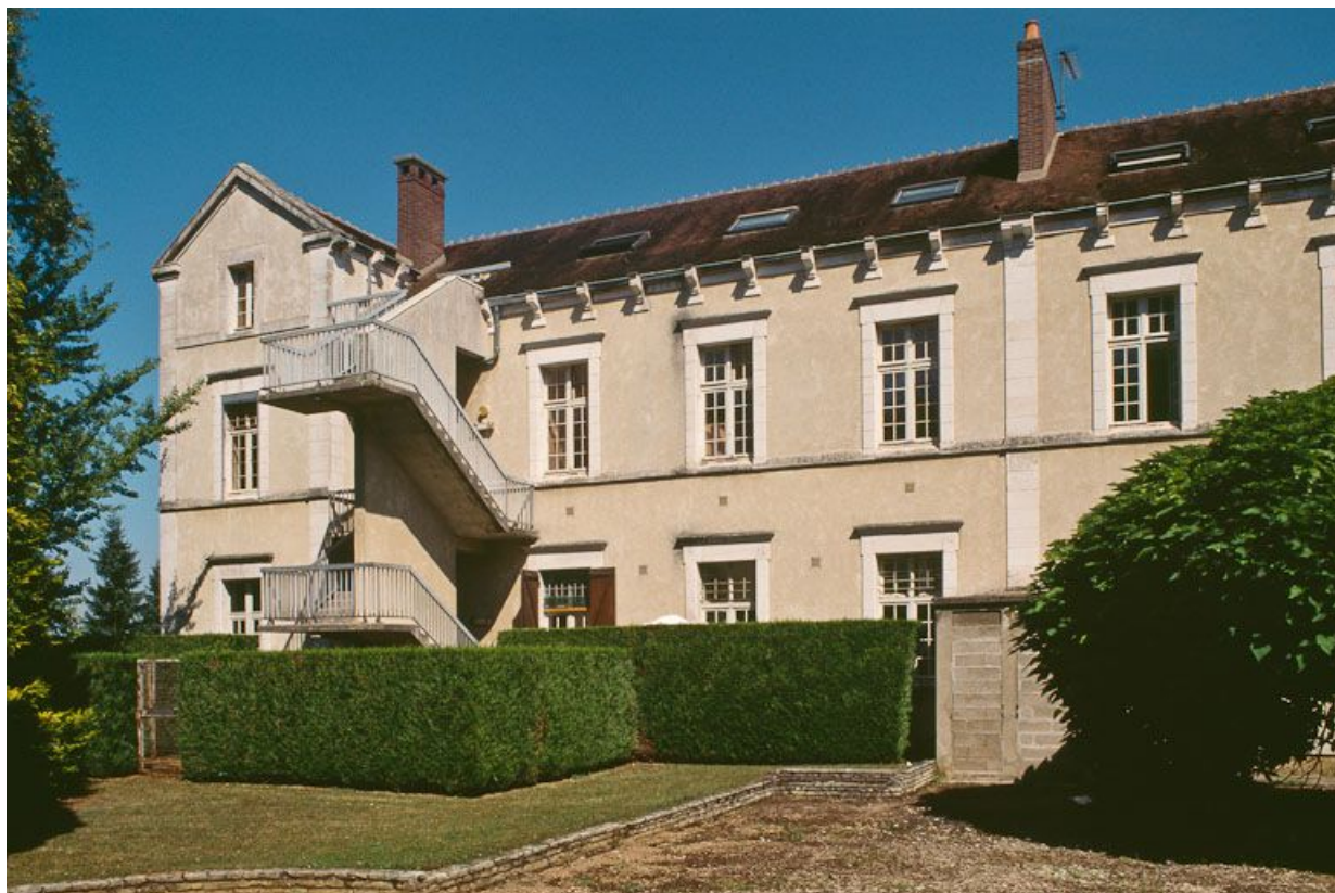
Quartier des femmes, bâtiment postérieur nord, façade ouest.

89, Auxerre, 2-4 avenue Charles-de-Gaulle