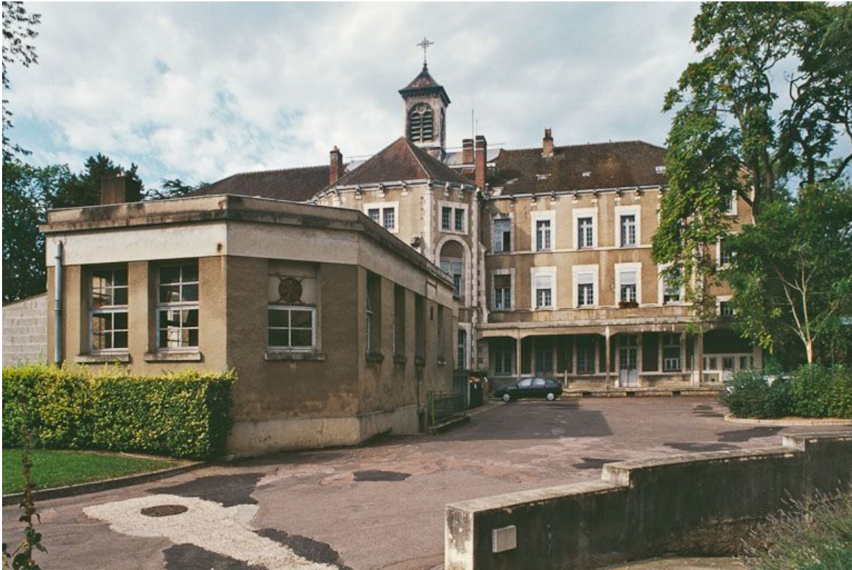
Bâtiment central, façade postérieure et cuisine construite en 1958 (1er plan).

89, Auxerre, 2-4 avenue Charles-de-Gaulle