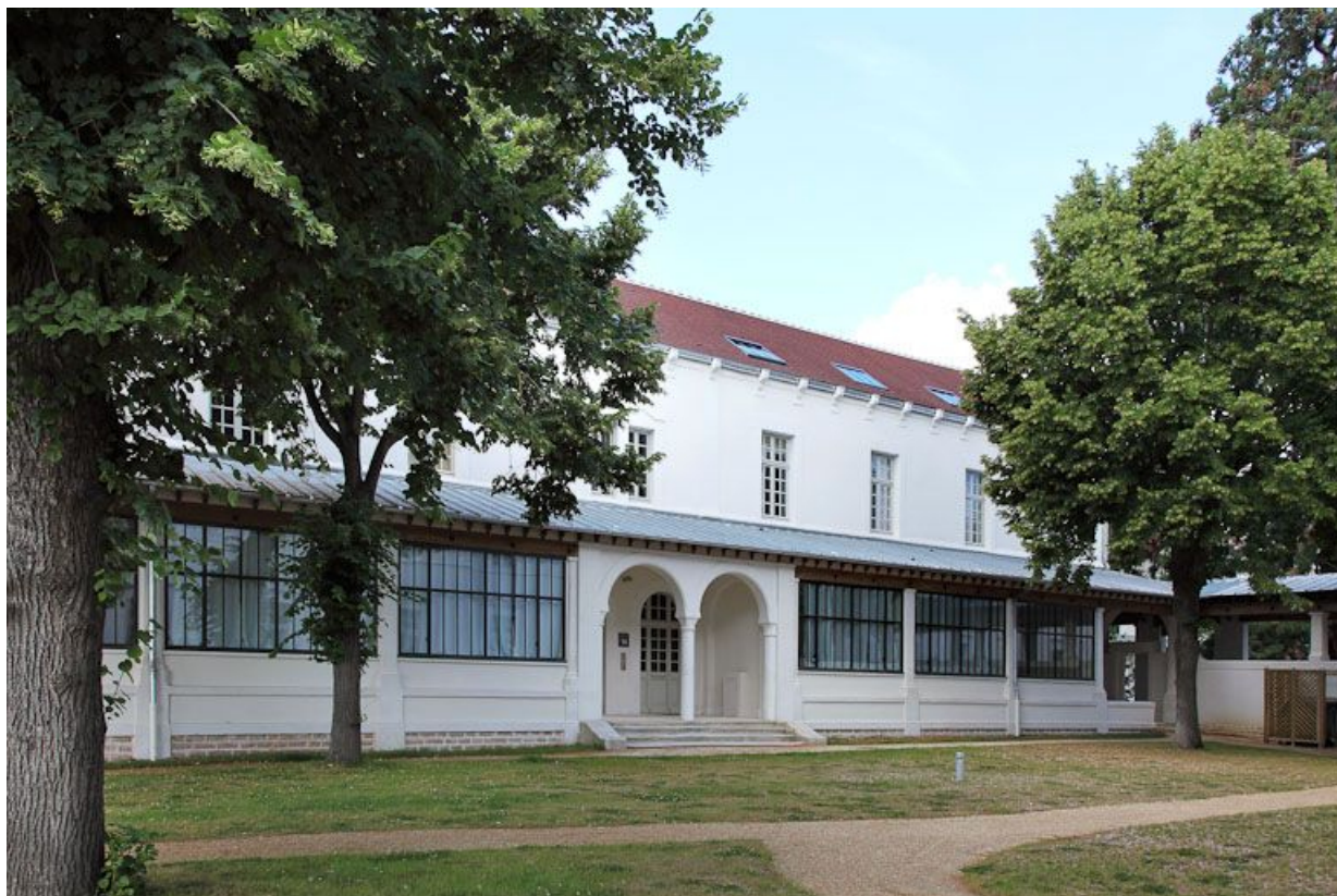
Ancien quartier des hommes, deuxième bâtiment, façade sur la troisième cour.

89, Auxerre, 2-4 avenue Charles-de-Gaulle