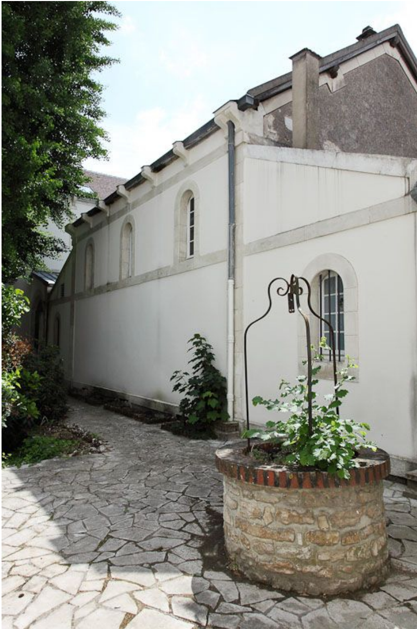
Puits de la première cour à droite.

89, Auxerre, 2-4 avenue Charles-de-Gaulle