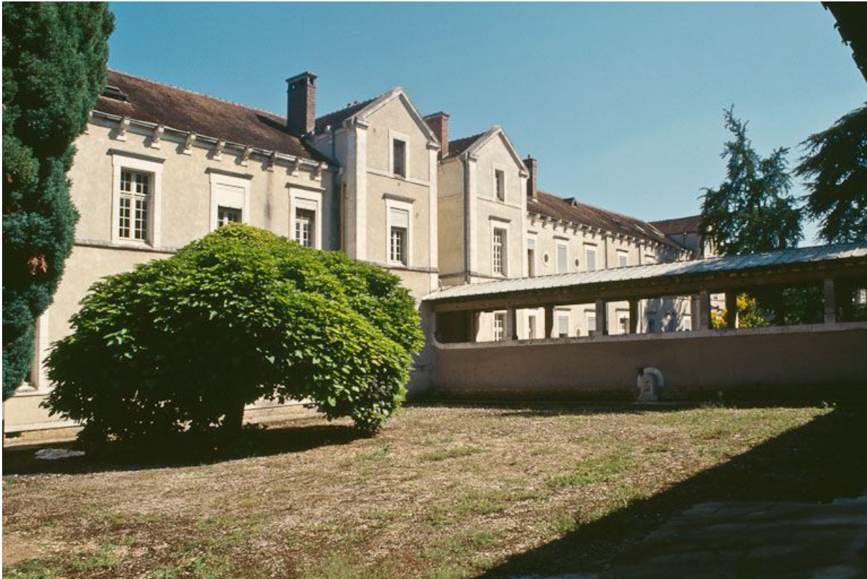
Quartier des femmes, bâtiments postérieurs, façades ouest.

89, Auxerre, 2-4 avenue Charles-de-Gaulle