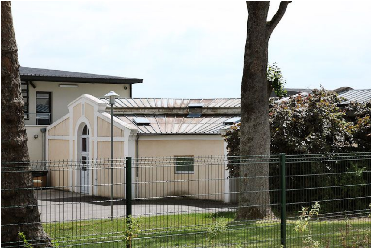
Bâtiment des "agités" de l'ancien quartier des hommes.

89, Auxerre, 2-4 avenue Charles-de-Gaulle