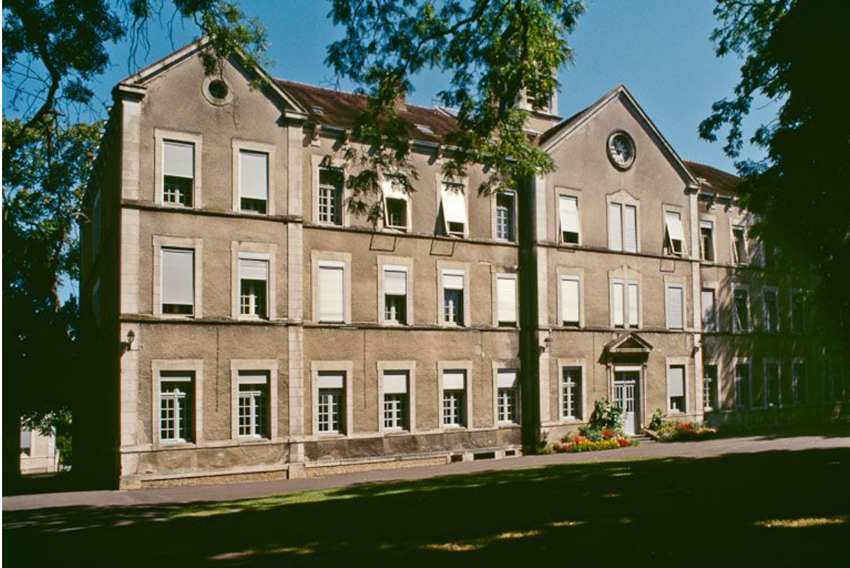
Bâtiment central, partie gauche de la façade.

89, Auxerre, 2-4 avenue Charles-de-Gaulle