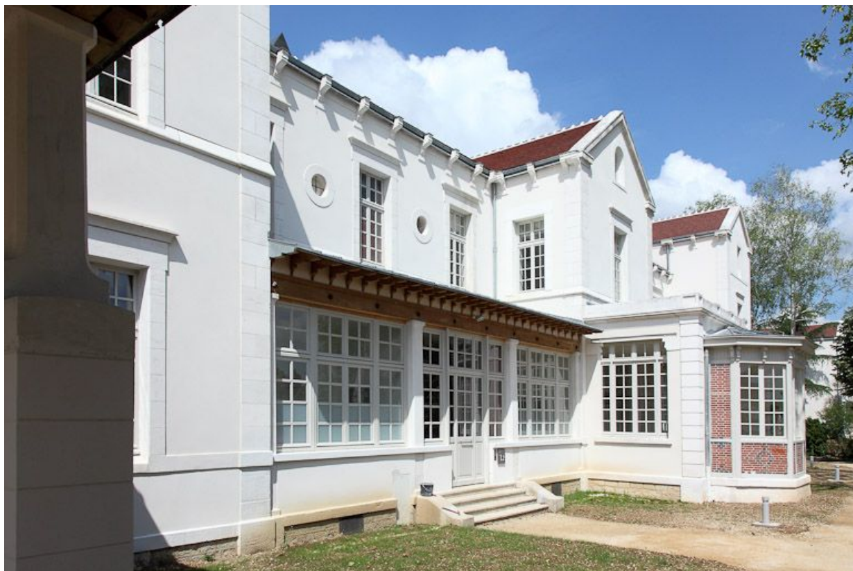
Façade est d'un des bâtiments postérieurs.

89, Auxerre, 2-4 avenue Charles-de-Gaulle