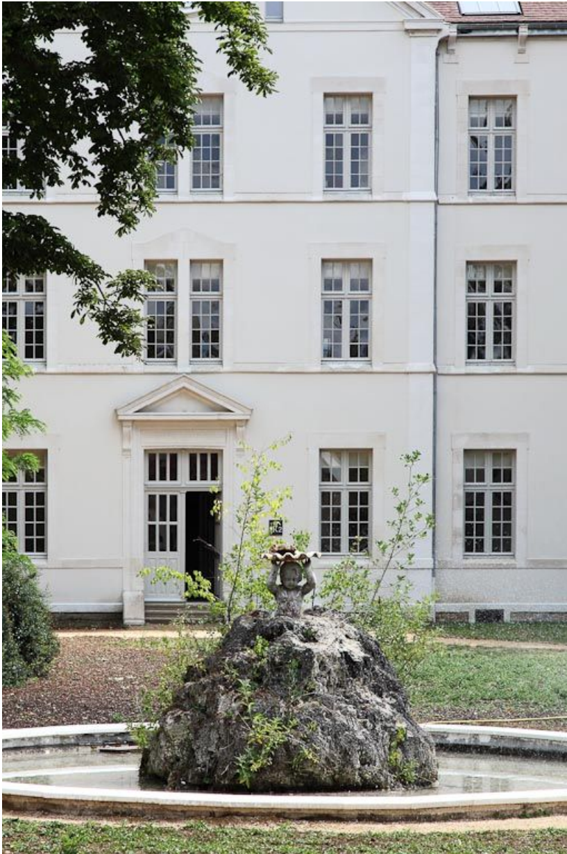
Bassin devant le bâtiment central.

89, Auxerre, 2-4 avenue Charles-de-Gaulle