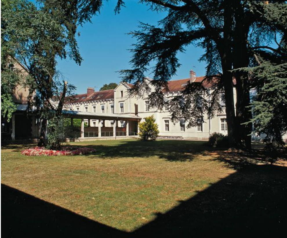
Bâtiment central, partie gauche de la façade en 2001.

89, Auxerre, 2-4 avenue Charles-de-Gaulle