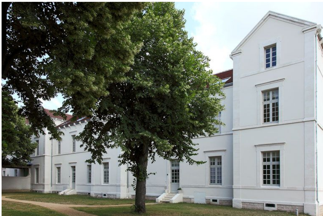
Ancien quartier des hommes, bâtiment postérieur de la troisième cour.

89, Auxerre, 2-4 avenue Charles-de-Gaulle