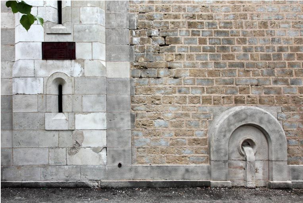
Le réservoir, détail de la façade sur rue.

89, Auxerre, 2-4 avenue Charles-de-Gaulle