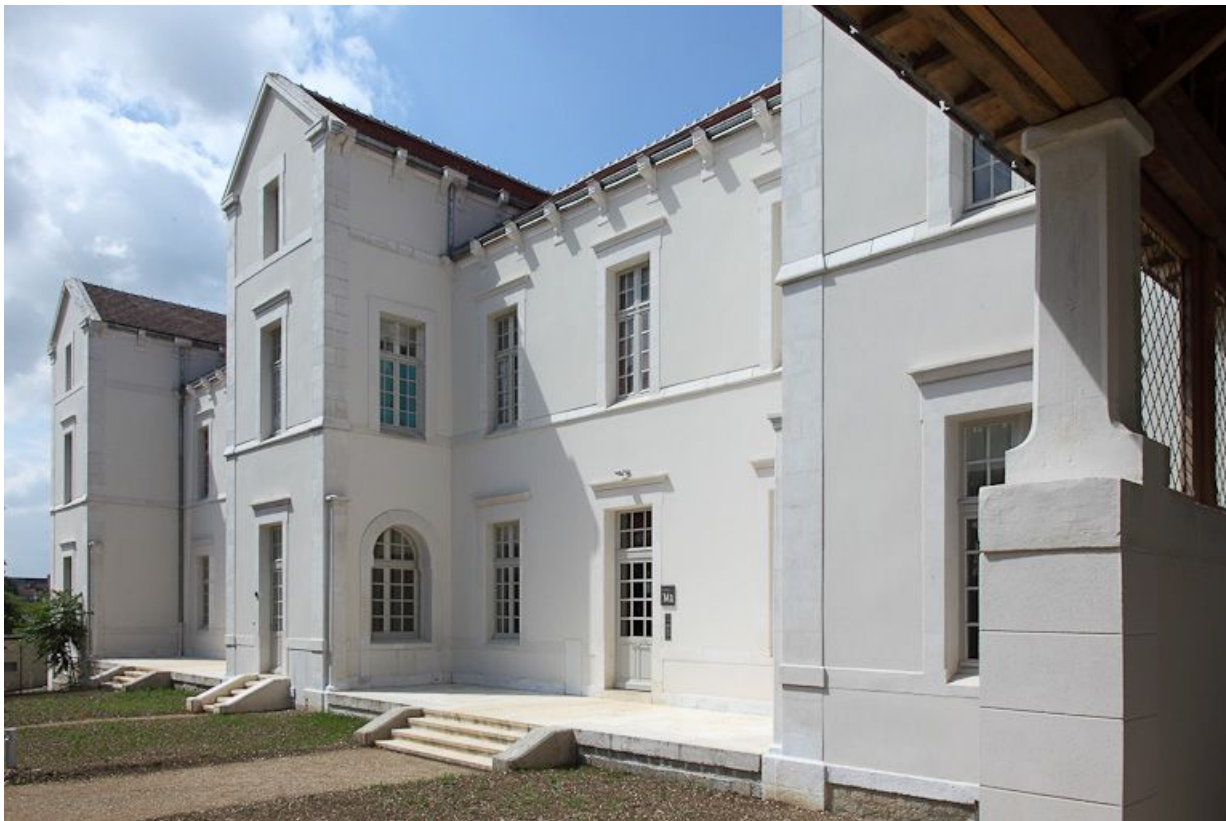
Façade est d'un des bâtiments postérieurs.

89, Auxerre, 2-4 avenue Charles-de-Gaulle