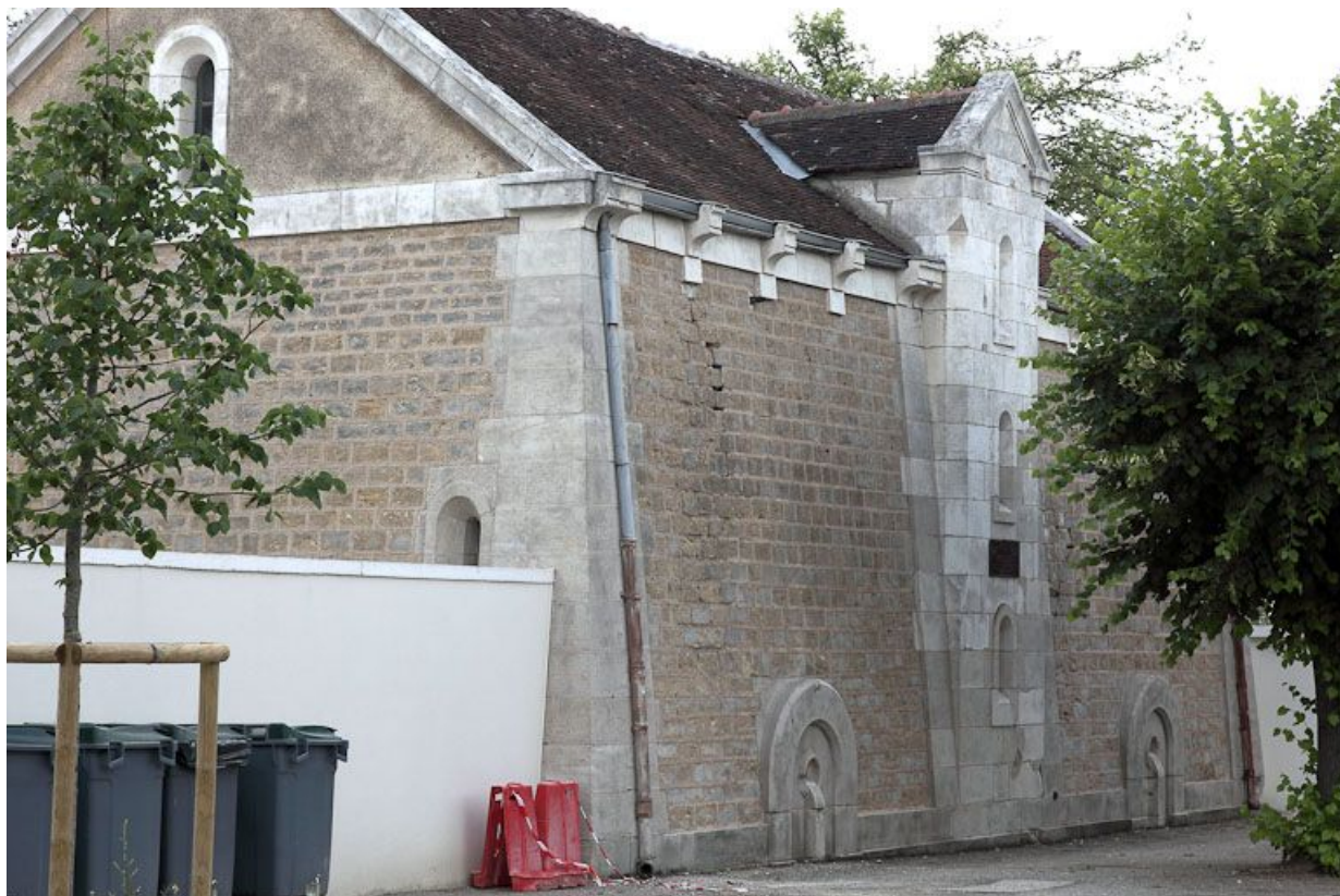
Le réservoir, façade sur rue.

89, Auxerre, 2-4 avenue Charles-de-Gaulle