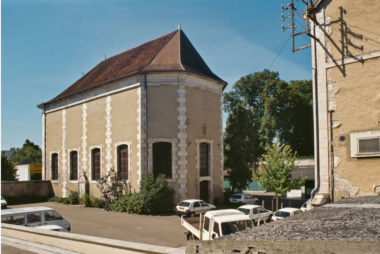
Chapelle, vue de trois-quarts postérieur. 89, Auxerre, 2-4 avenue Charles-de-Gaulle