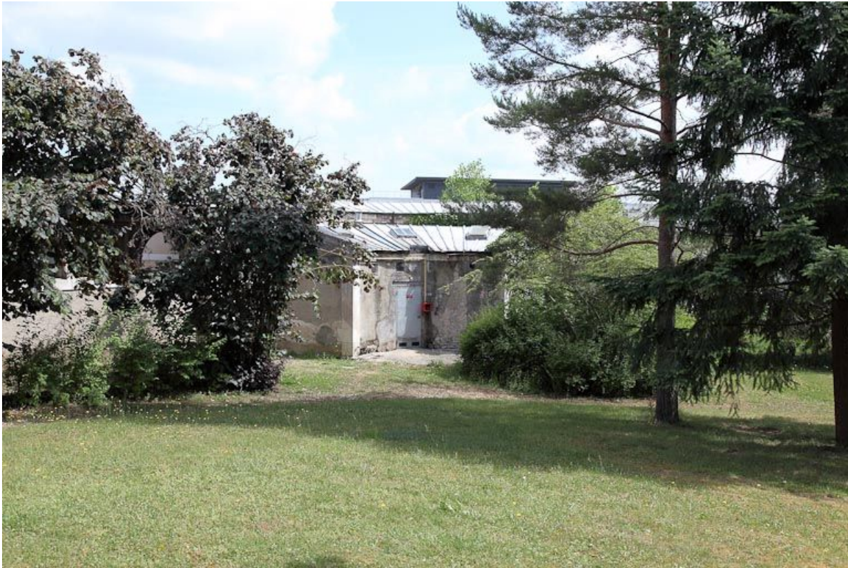
Bâtiment des "agités" de l'ancien quartier des femmes.

89, Auxerre, 2-4 avenue Charles-de-Gaulle