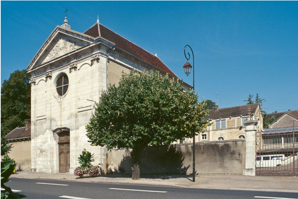
Chapelle, vue de trois-quarts.

89, Auxerre, 2-4 avenue Charles-de-Gaulle