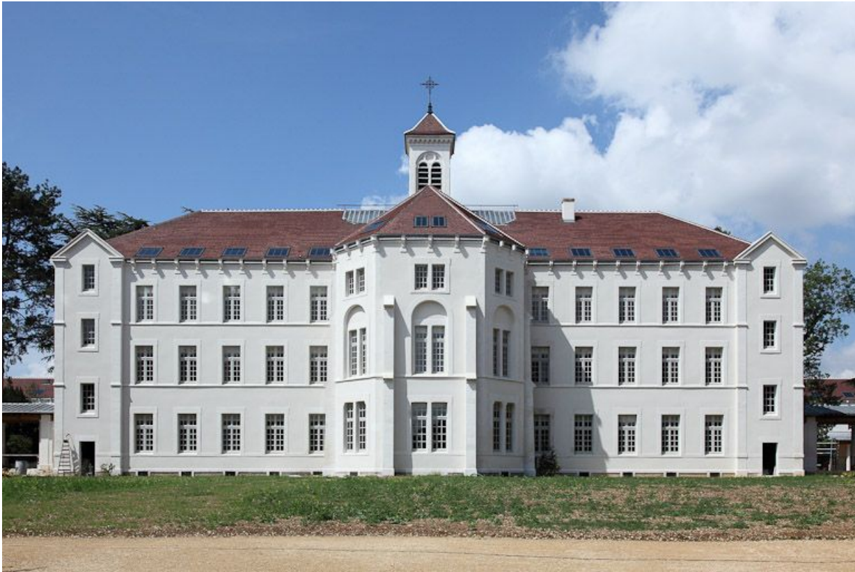
Bâtiment central, façade postérieure.

89, Auxerre, 2-4 avenue Charles-de-Gaulle