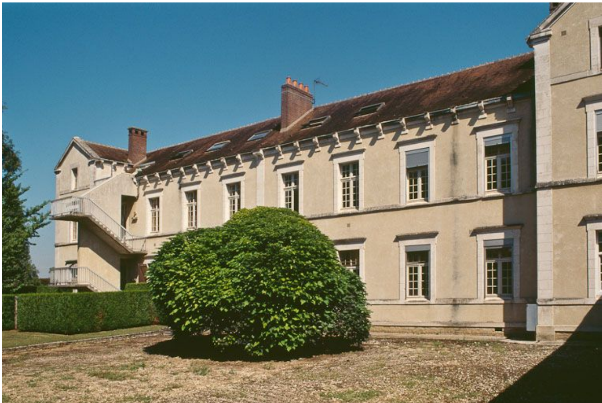
Quartier des femmes, bâtiment postérieur nord, façade ouest.

89, Auxerre, 2-4 avenue Charles-de-Gaulle