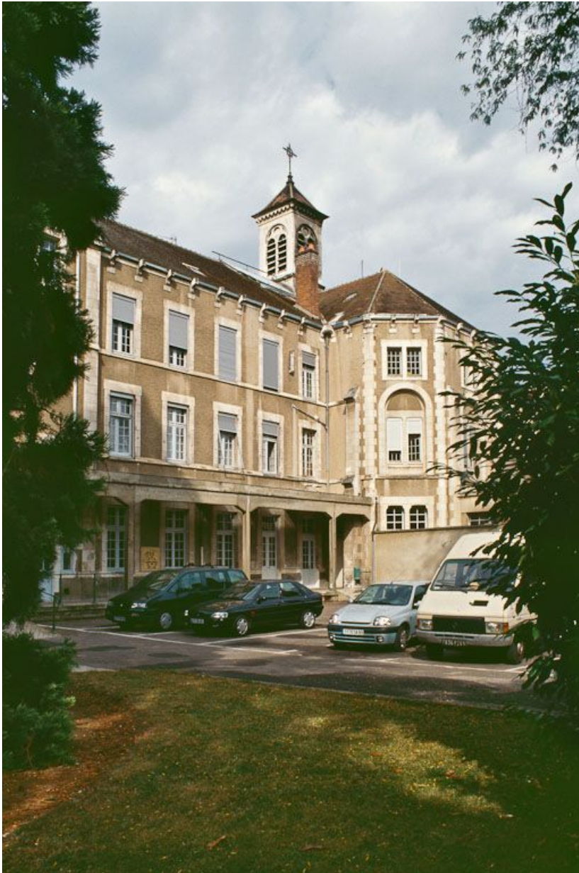
Bâtiment central, façade postérieure avec galerie en 2001.

89, Auxerre, 2-4 avenue Charles-de-Gaulle