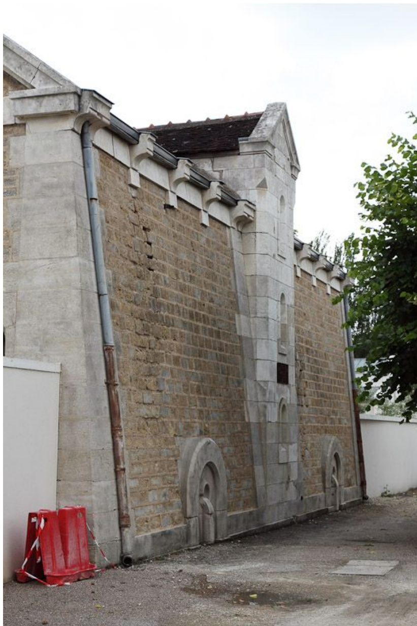
Le réservoir, façade sur rue.

89, Auxerre, 2-4 avenue Charles-de-Gaulle