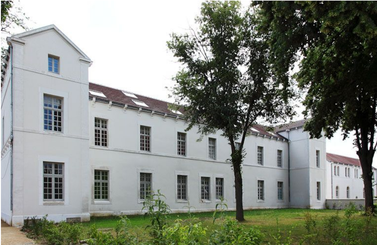
Premier bâtiment de l'ancien quartier des hommes.

89, Auxerre, 2-4 avenue Charles-de-Gaulle