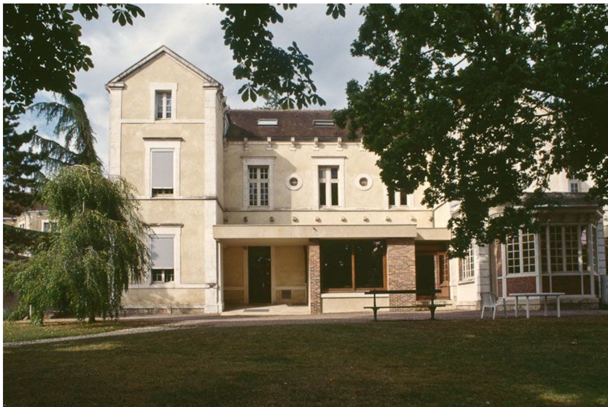
Quartier des femmes, un des bâtiments postérieurs, façade est.

89, Auxerre, 2-4 avenue Charles-de-Gaulle