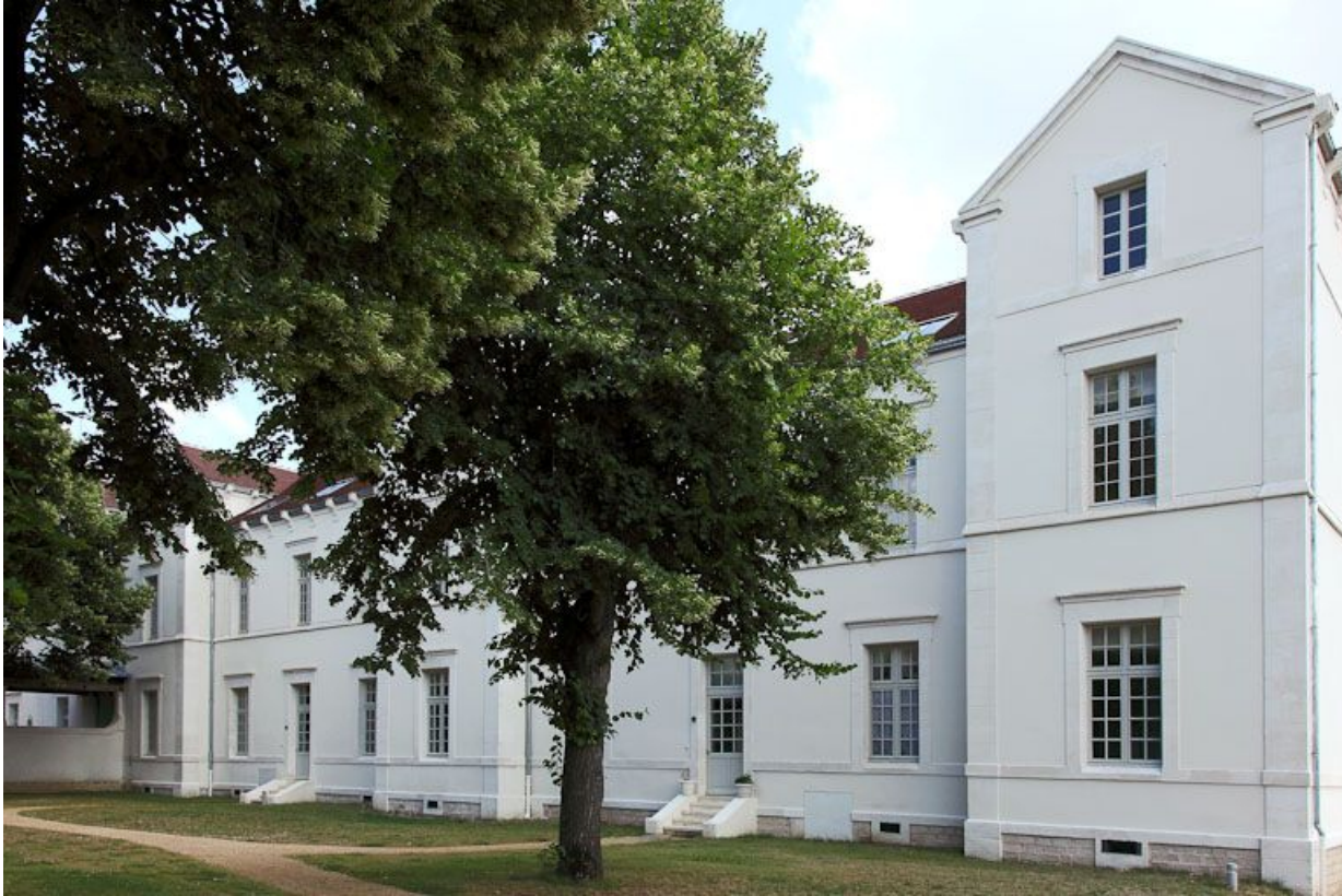
Ancien quartier des hommes, bâtiment postérieur de la troisième cour.

89, Auxerre, 2-4 avenue Charles-de-Gaulle