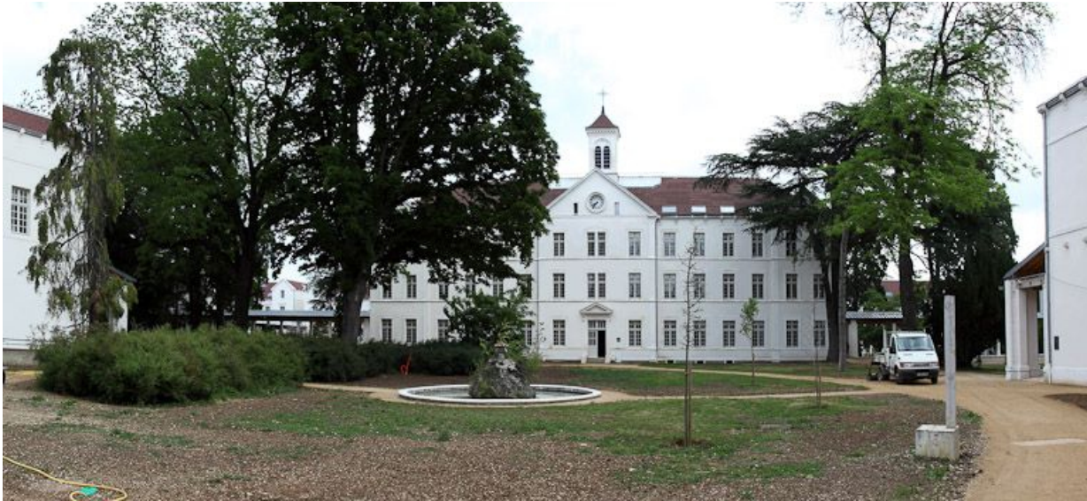
Vue d'ensemble depuis l'entrée.

89, Auxerre, 2-4 avenue Charles-de-Gaulle