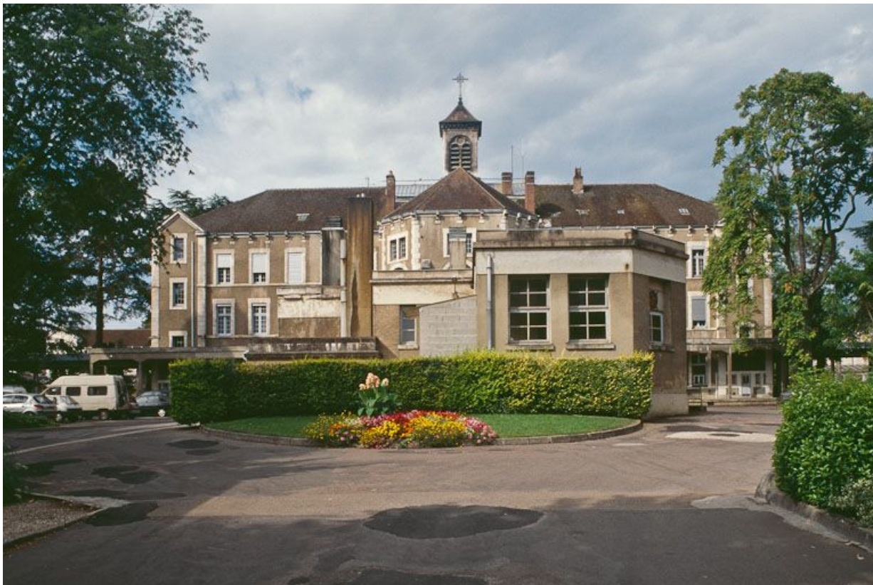
Bâtiment central, façade postérieure et cuisine construite en 1958.

89, Auxerre, 2-4 avenue Charles-de-Gaulle