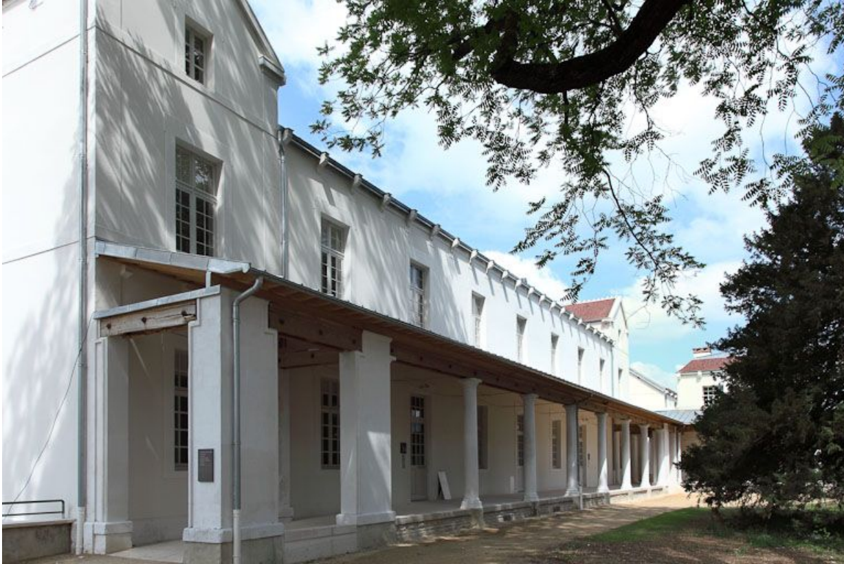
Bâtiment de l'ancien quartier des femmes.

89, Auxerre, 2-4 avenue Charles-de-Gaulle