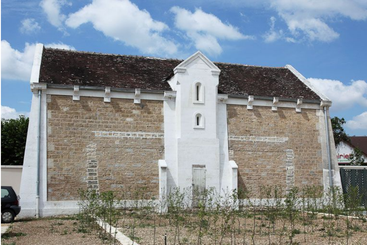
Le réservoir, façade sur cour.

89, Auxerre, 2-4 avenue Charles-de-Gaulle