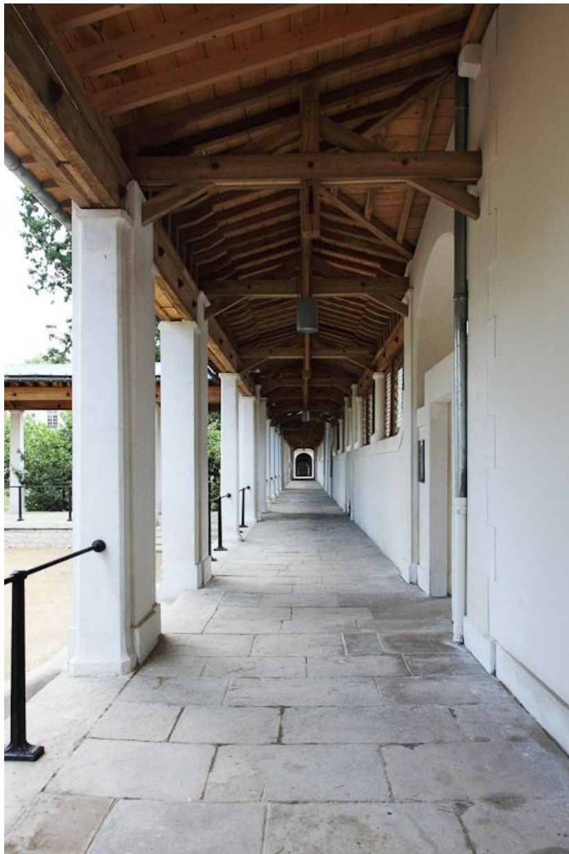
Galerie principale de l'ancien quartier des hommes, vue intérieure.

89, Auxerre, 2-4 avenue Charles-de-Gaulle