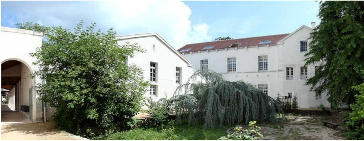
Vue de la deuxième cour.

89, Auxerre, 2-4 avenue Charles-de-Gaulle