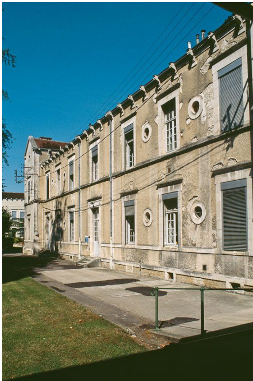
Quartier des femmes, bâtiment des pensionnaires.

89, Auxerre, 2-4 avenue Charles-de-Gaulle