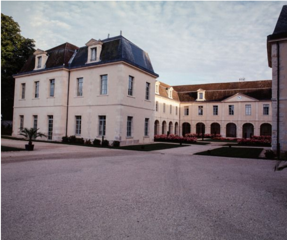
Corps central et aile droite.