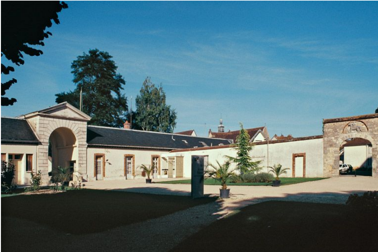
Vue d'ensemble de la première cour.