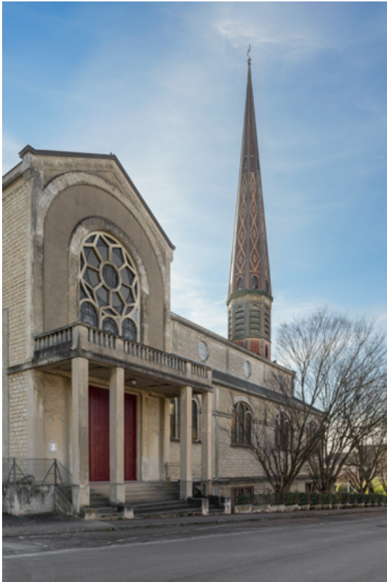
Façade ouest. Vue de trois quarts.

89, Migennes, 3 avenue Marcelin Berthelot