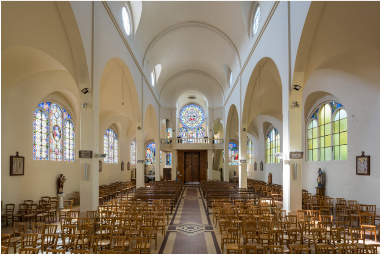
Nef. Vue depuis le chœur.

89, Migennes, 3 avenue Marcelin Berthelot