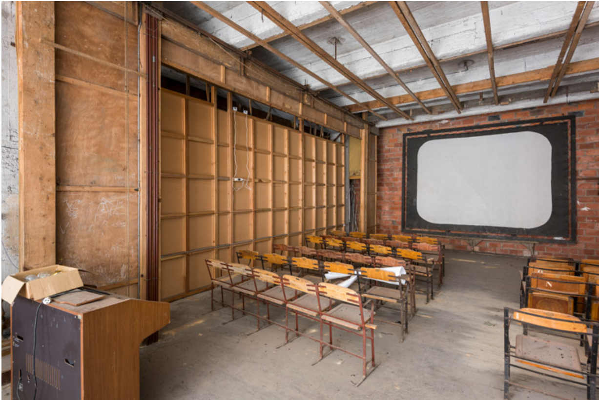
Scène transformée en salle de cinéma. Vue de trois quarts.

89, Migennes, 3 avenue Marcelin Berthelot