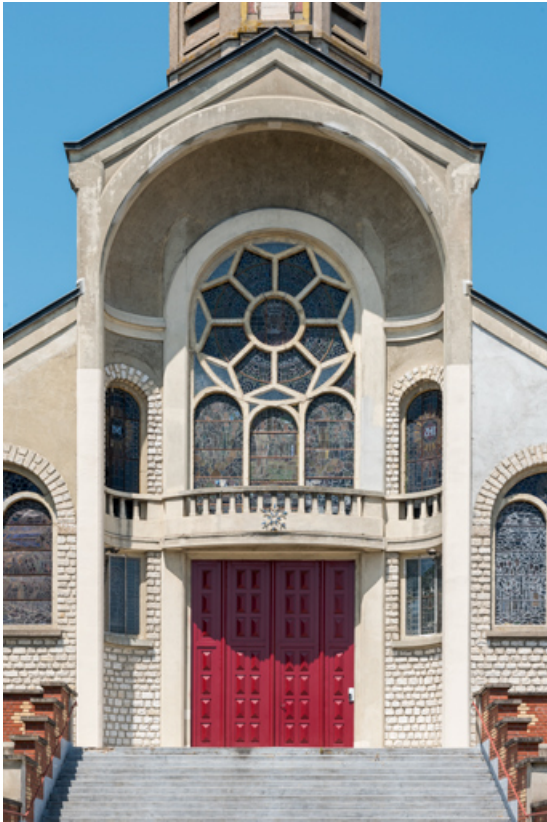
Détail de la partie centrale de la façade antérieure.

89, Migennes, 3 avenue Marcelin Berthelot