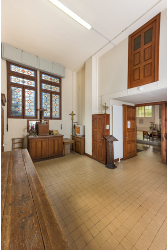
Sacristie. Vue de trois quarts en direction de la nef. 89, Migennes, 3 avenue Marcelin Berthelot