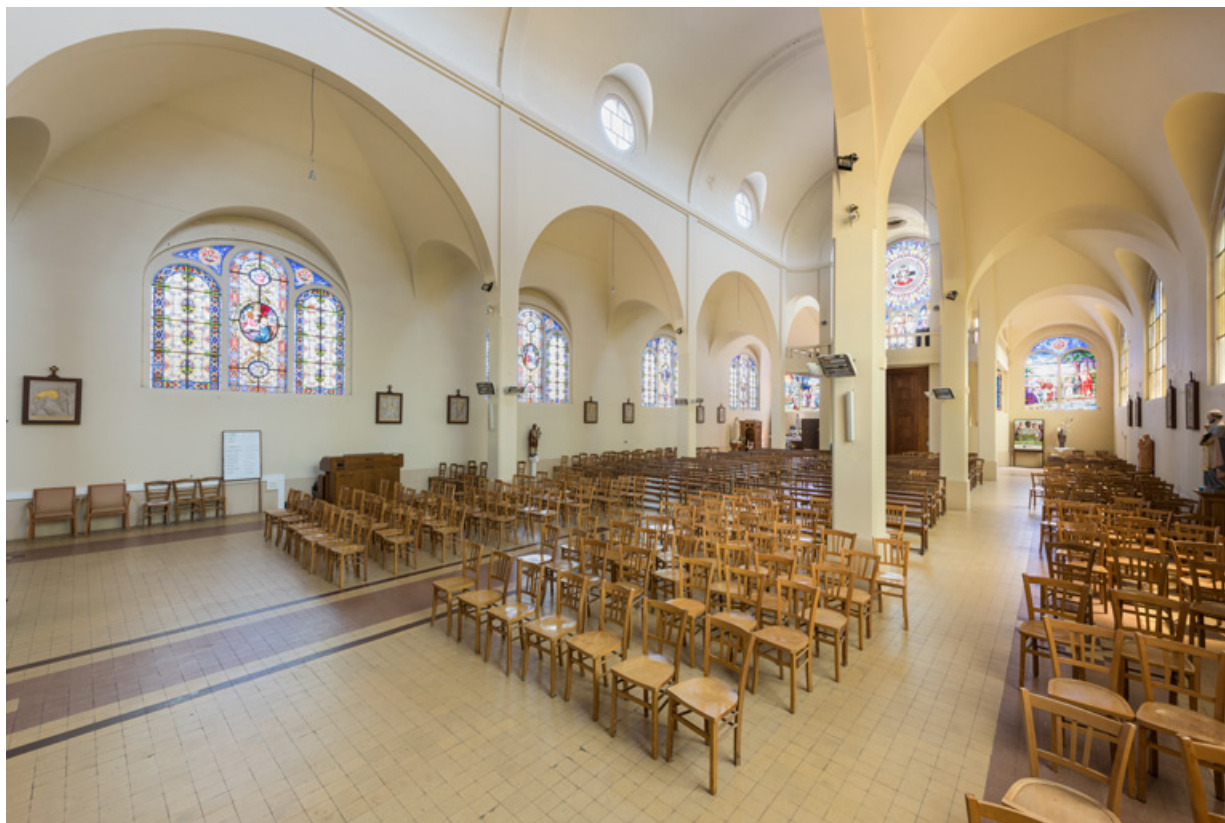
Nef. Vue de trois quarts en direction du sud-ouest.

89, Migennes, 3 avenue Marcelin Berthelot