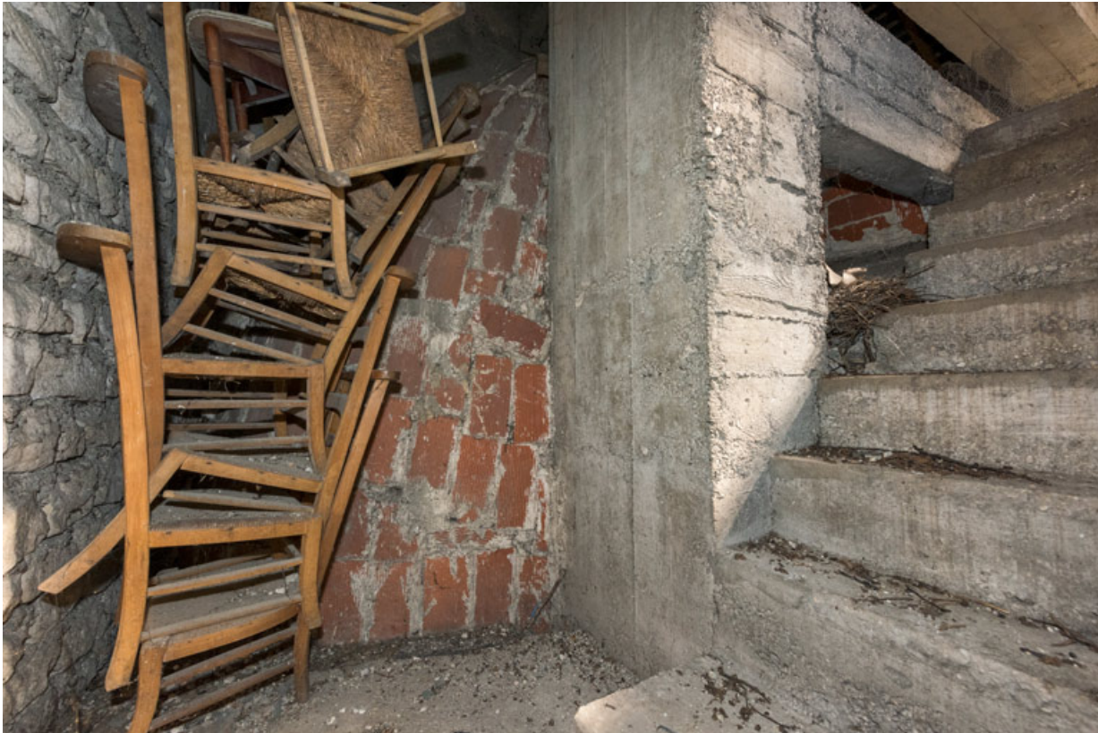
Voûte et escalier du clocher.

89, Migennes, 3 avenue Marcelin Berthelot