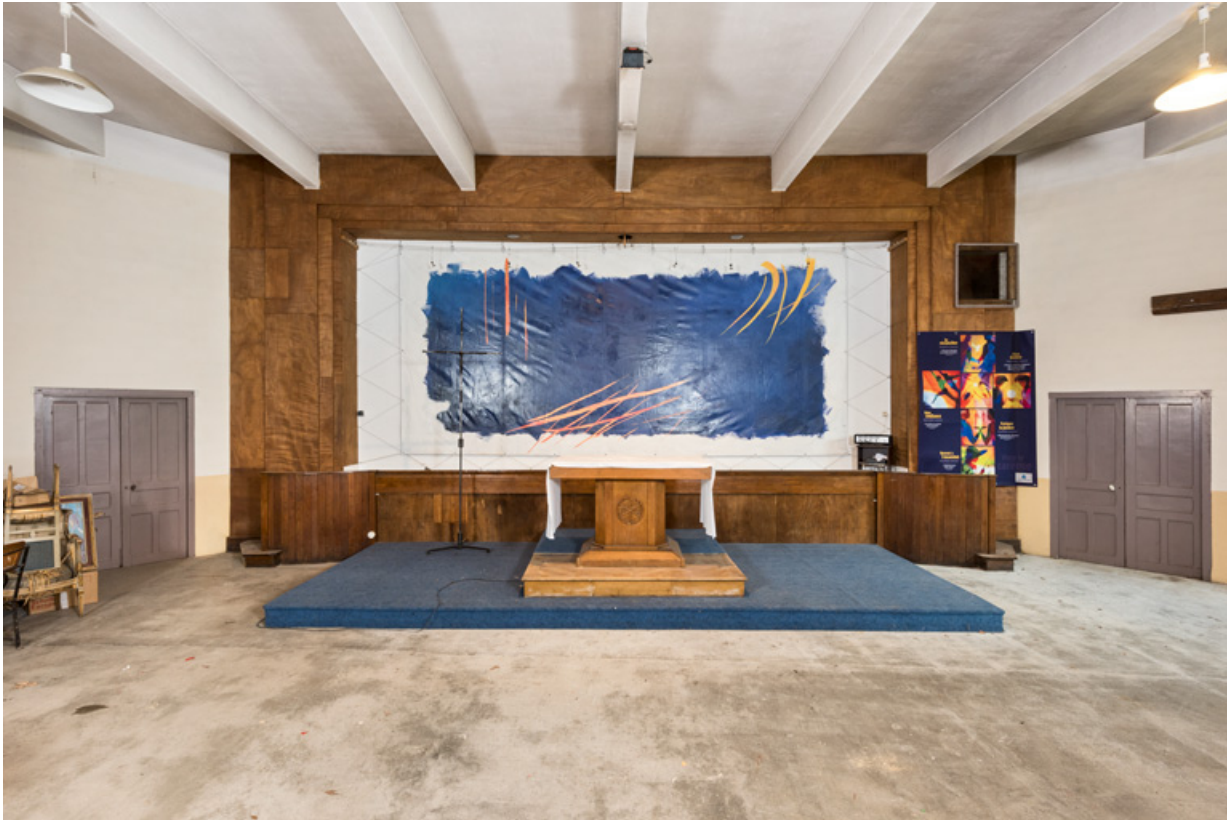
Scène de la salle de spectacle. Vue d'ensemble.

89, Migennes, 3 avenue Marcelin Berthelot