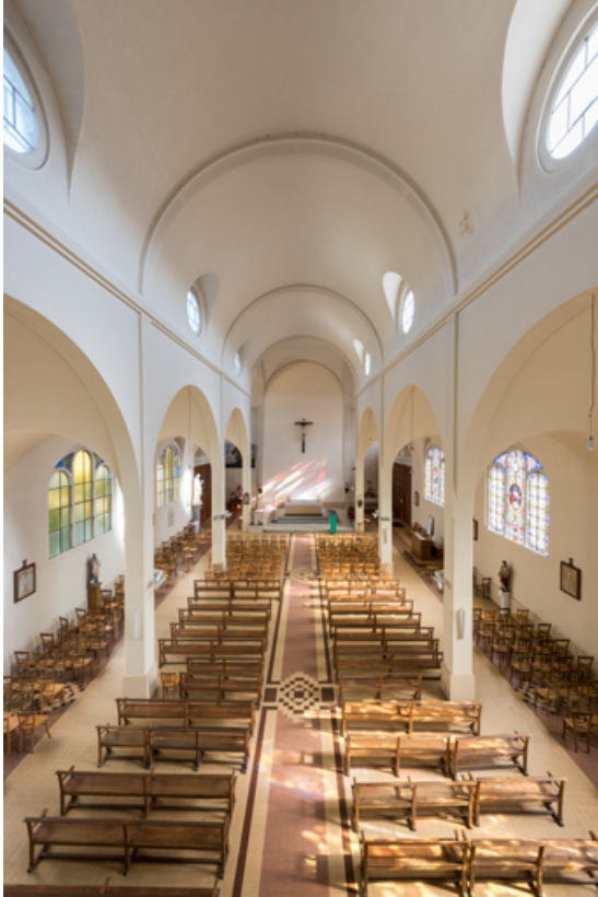
Nef. Vue en direction du choeur depuis la tribune.

89, Migennes, 3 avenue Marcelin Berthelot