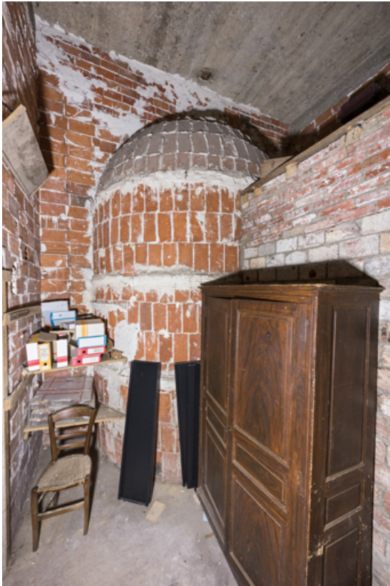
Abside du chœur de la crypte.

89, Migennes, 3 avenue Marcelin Berthelot