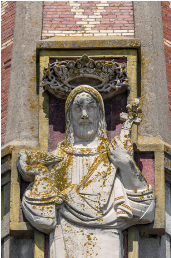
Bas-relief du clocher. Détail de la partie supérieure.

89, Migennes, 3 avenue Marcelin Berthelot