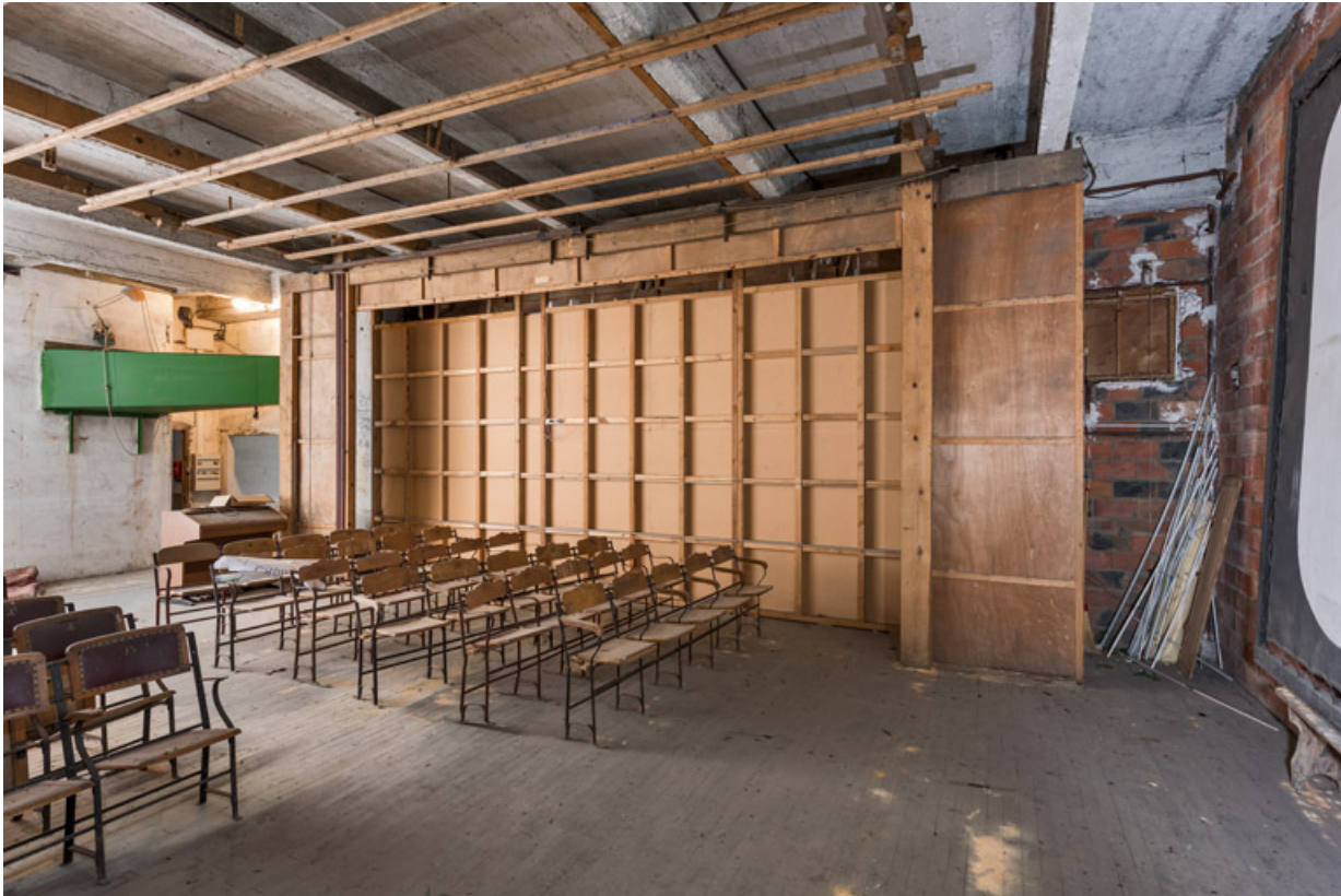
La scène. Vue en direction de la salle.

89, Migennes, 3 avenue Marcelin Berthelot