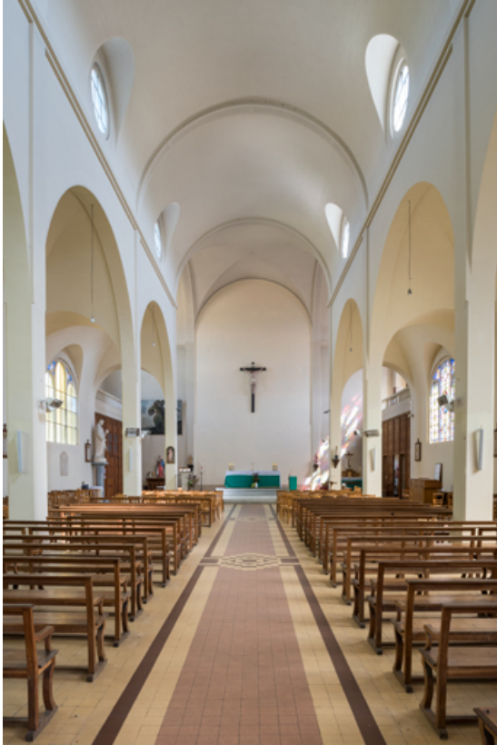
Vaisseau central. Vue en direction du chœur.

89, Migennes, 3 avenue Marcelin Berthelot