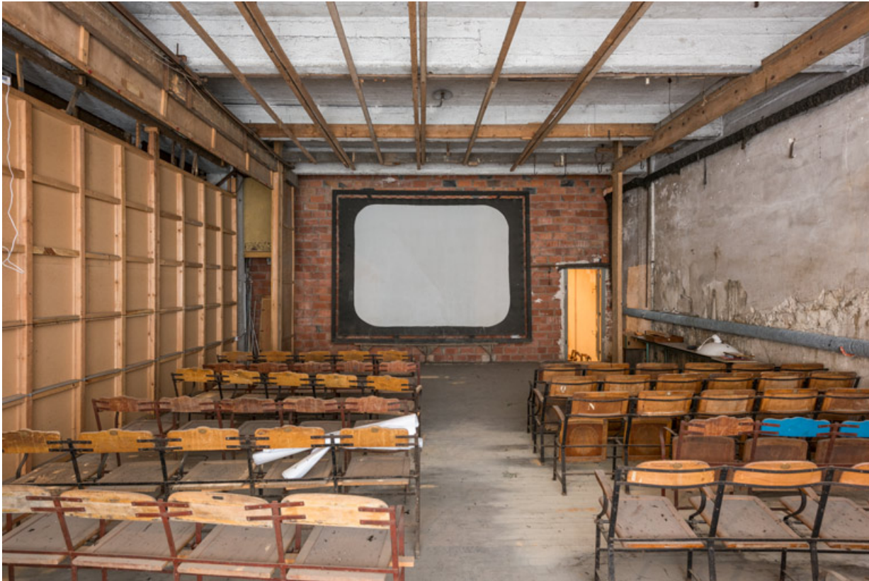
Scène transformée en salle de cinéma.

89, Migennes, 3 avenue Marcelin Berthelot