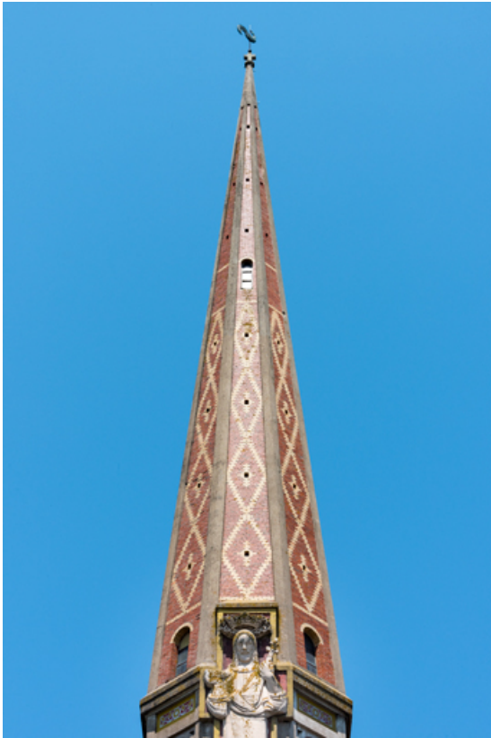
Toiture du clocher. Vue d'ensemble.

89, Migennes, 3 avenue Marcelin Berthelot