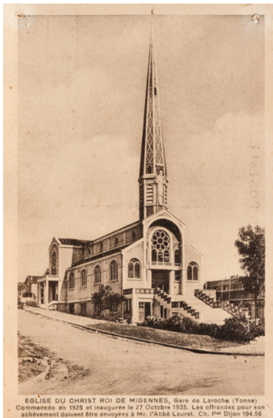
Carte postale de l'église du Christ-Roi à Migennes, entre 1935 et 1941.

89, Migennes, 3 avenue Marcelin Berthelot