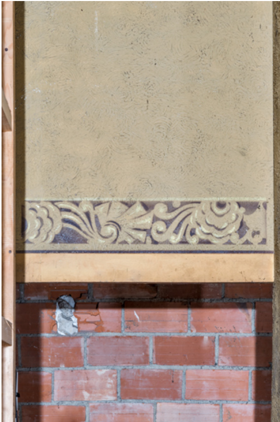
Détail d'un décor de la scène.

89, Migennes, 3 avenue Marcelin Berthelot