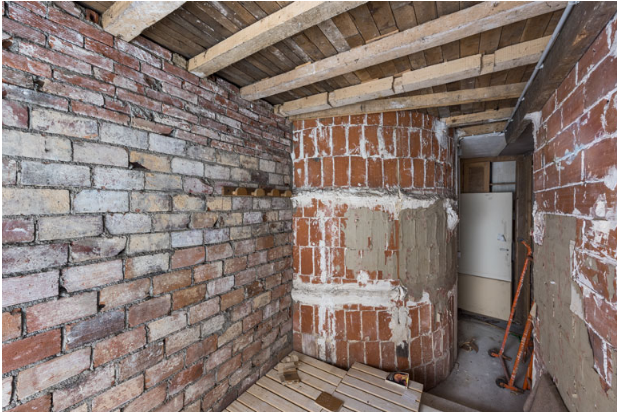
Abside du choeur de la crypte.

89, Migennes, 3 avenue Marcelin Berthelot