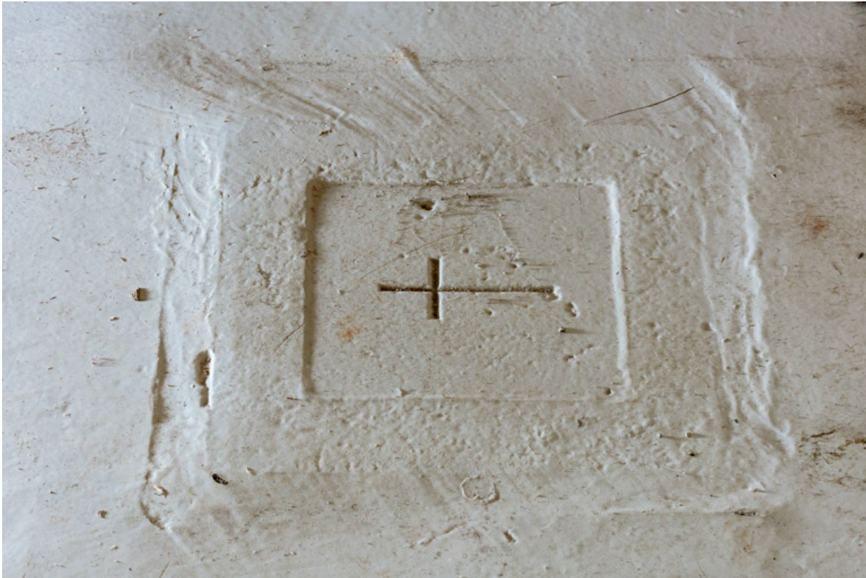
Première pierre, sol de la crypte.

89, Migennes, 3 avenue Marcelin Berthelot