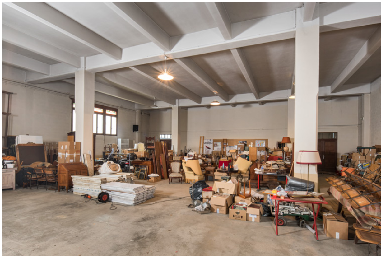
Salle de spectacle. Vue de trois quarts, depuis le chœur.

89, Migennes, 3 avenue Marcelin Berthelot