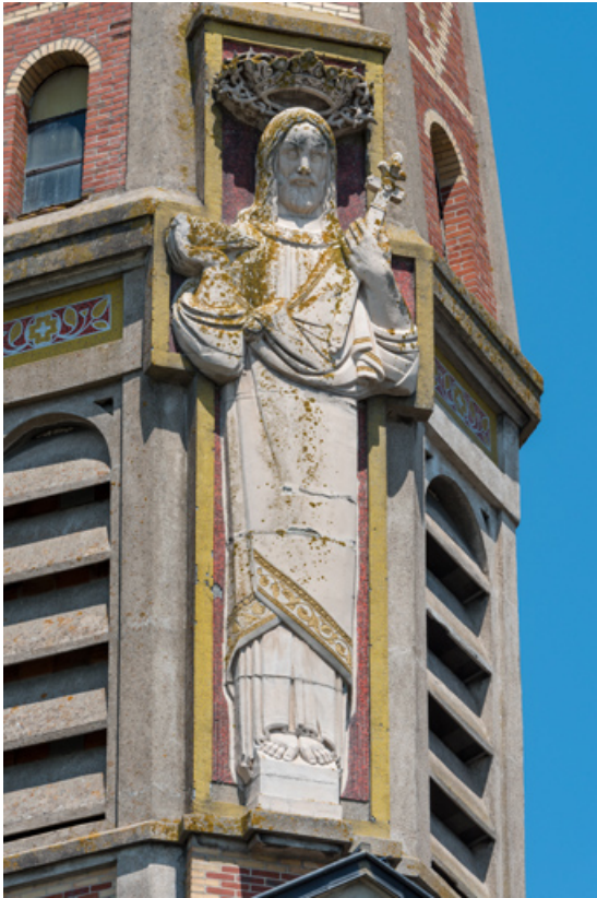
Bas-relief du clocher. Vue de trois quarts.

89, Migennes, 3 avenue Marcelin Berthelot