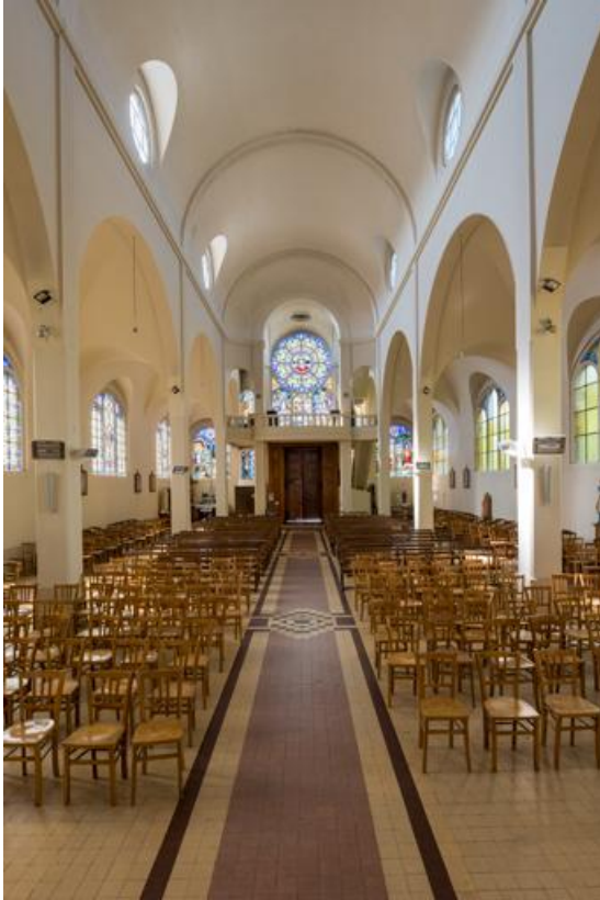
Nef. Vue depuis le chœur.

89, Migennes, 3 avenue Marcelin Berthelot