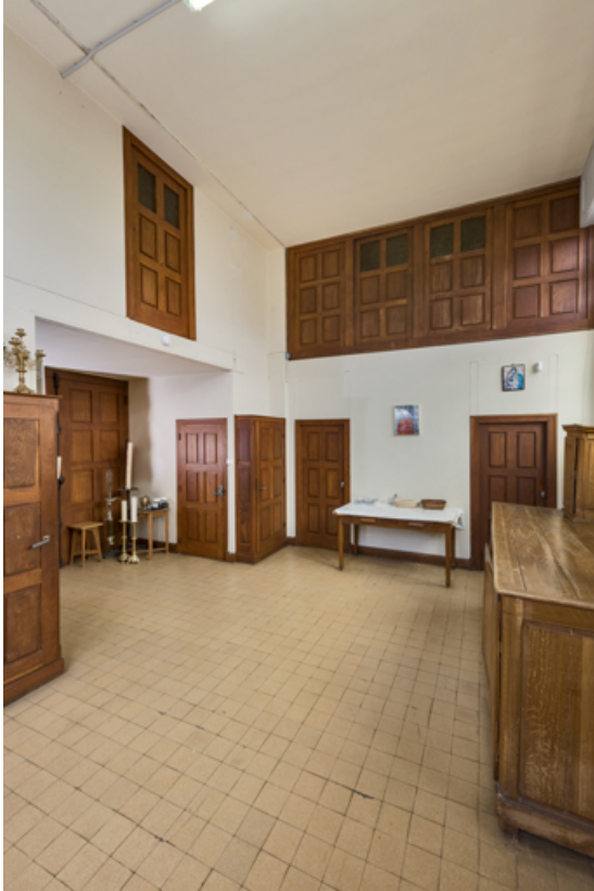
Sacristie. Vue de trois quarts.

89, Migennes, 3 avenue Marcelin Berthelot