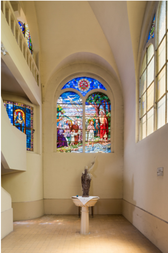
Chapelle des fonts. Vue d'ensemble.

89, Migennes, 3 avenue Marcelin Berthelot