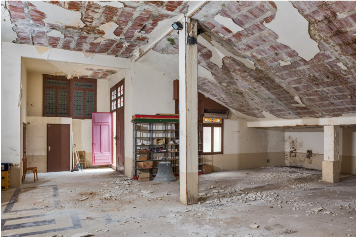
Crypte. Vue en direction de l'entrée est.

89, Migennes, 3 avenue Marcelin Berthelot