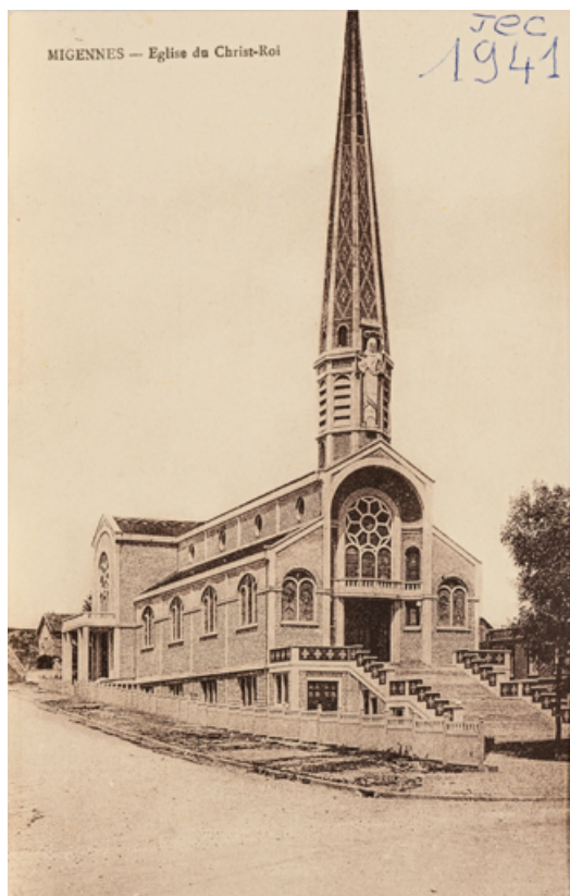
Carte postale de l'église du Christ-Roi à Migennes, en 1941.

89, Migennes, 3 avenue Marcelin Berthelot