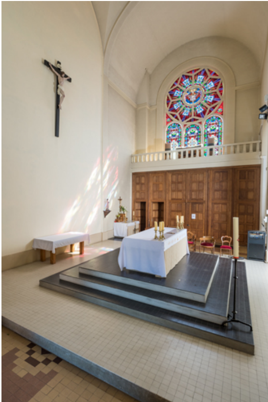
Chœur. Vue de trois quarts. Au second plan, le confessionnal, la porte de la sacristie et la tribune. 89, Migennes, 3 avenue Marcelin Berthelot