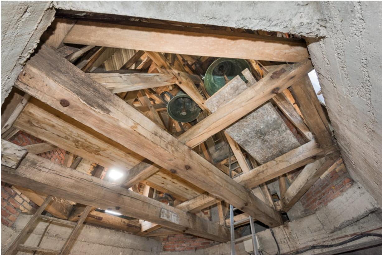
Enrayure de charpente du clocher. Vue en contre-plongée.

89, Migennes, 3 avenue Marcelin Berthelot