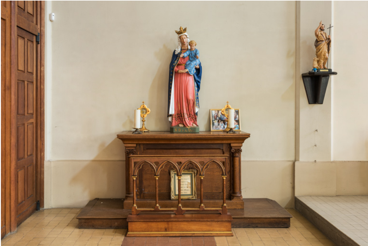
Autel latéral gauche.

89, Migennes, 3 avenue Marcelin Berthelot