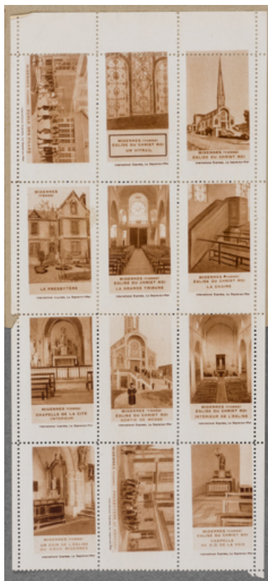
Carnet de timbres du Christ-Roi, détail. 89, Migennes, 3 avenue Marcelin Berthelot