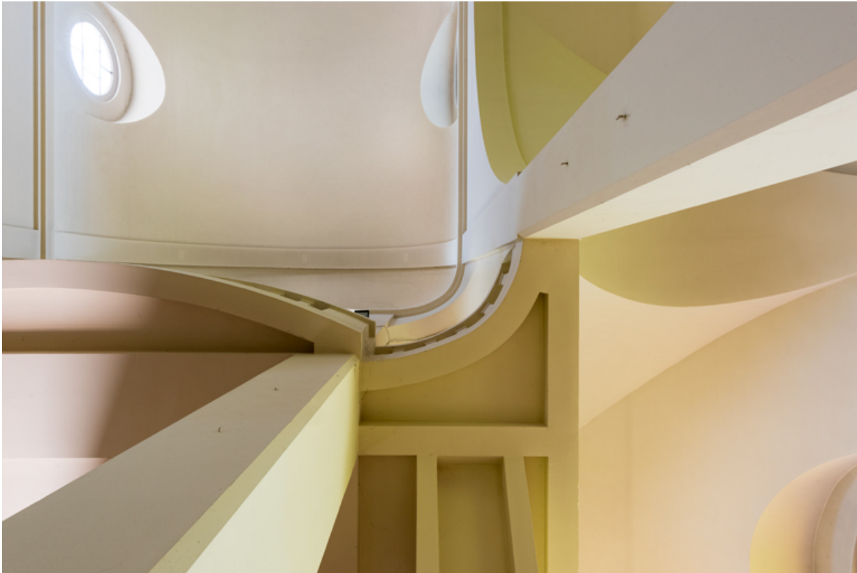
Couvrement de l'église à la jonction de la tribune, du vaisseau central et du bas-côté. Vue en contre-plongée. 89, Migennes, 3 avenue Marcelin Berthelot