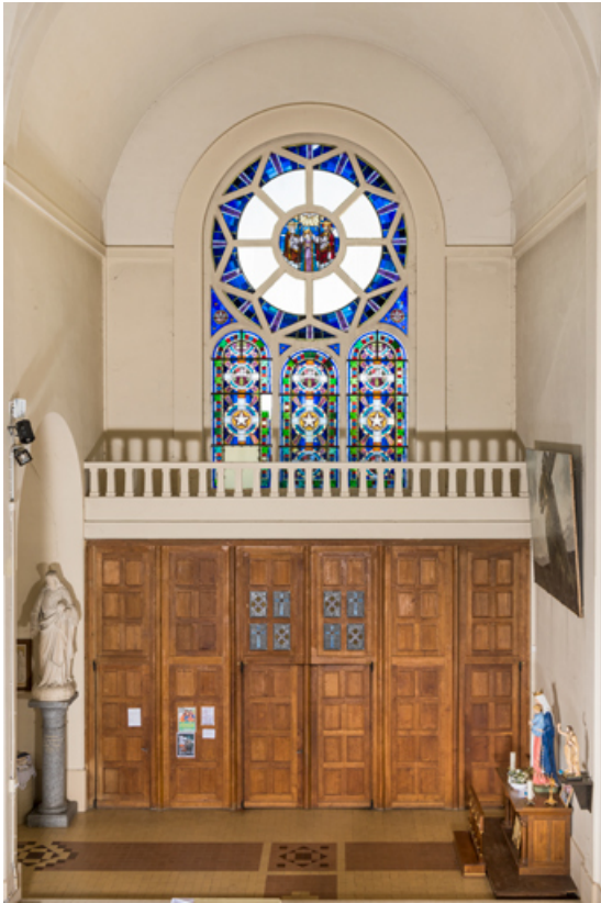
Bras gauche du transept. Vue d'ensemble.

89, Migennes, 3 avenue Marcelin Berthelot