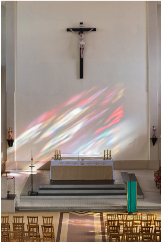
Chœur. Vue centrée.

89, Migennes, 3 avenue Marcelin Berthelot