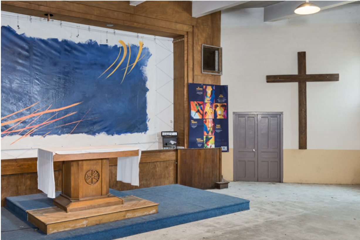
Salle de spectacle. Vue de trois quarts, en direction de l'accès aux loges et à la sacristie.

89, Migennes, 3 avenue Marcelin Berthelot