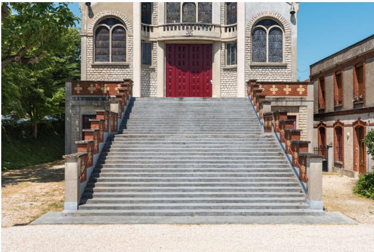
Escalier principal menant au parvis.

89, Migennes, 3 avenue Marcelin Berthelot