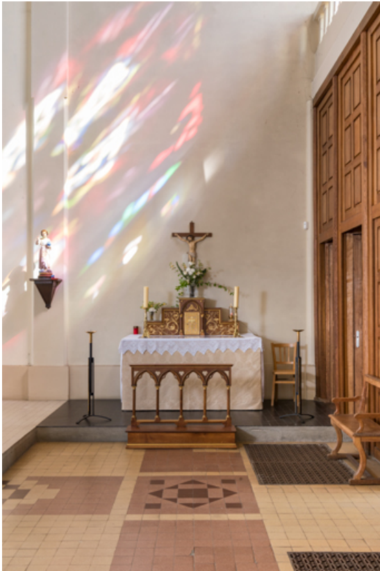
Autel latéral droite.

89, Migennes, 3 avenue Marcelin Berthelot