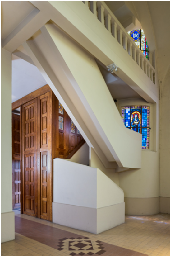
Escalier menant à la tribune sud.

89, Migennes, 3 avenue Marcelin Berthelot