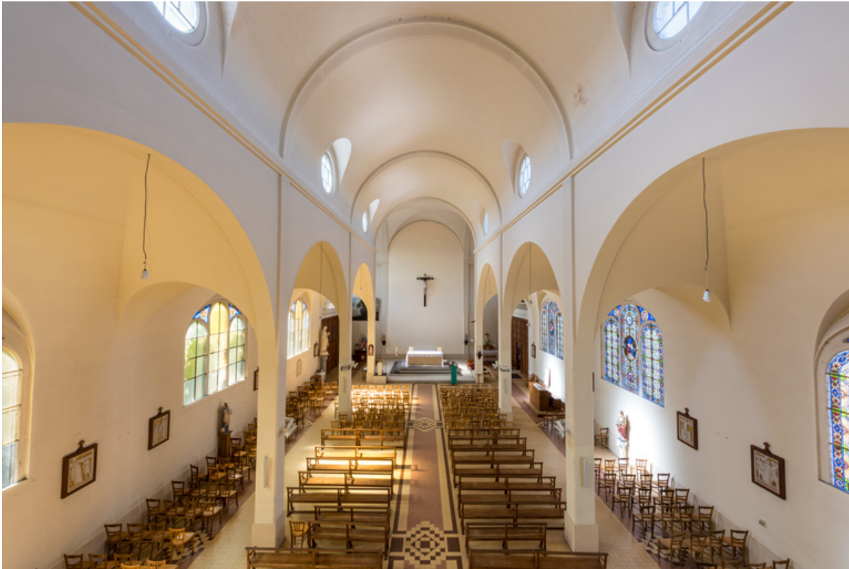
Nef. Vue en direction du chœur depuis la tribune.

89, Migennes, 3 avenue Marcelin Berthelot