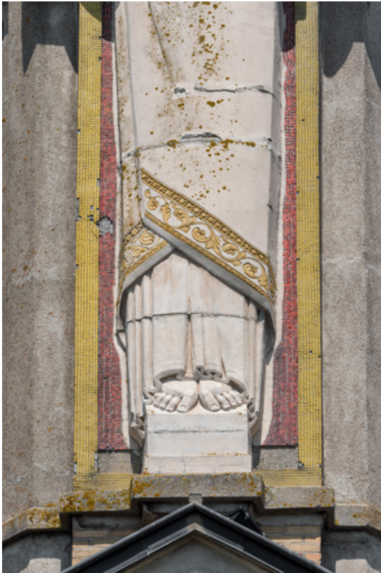
Bas-relief du clocher. Détail de la partie inférieure.

89, Migennes, 3 avenue Marcelin Berthelot