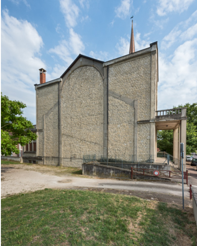
Chevet. Vue de trois quarts.

89, Migennes, 3 avenue Marcelin Berthelot