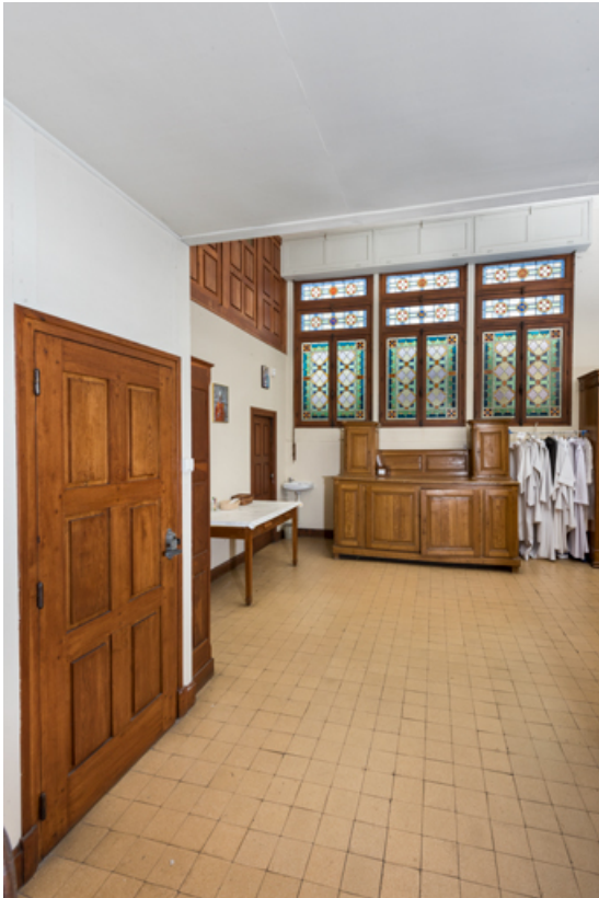
Sacristie. Vue depuis l'entrée.

89, Migennes, 3 avenue Marcelin Berthelot