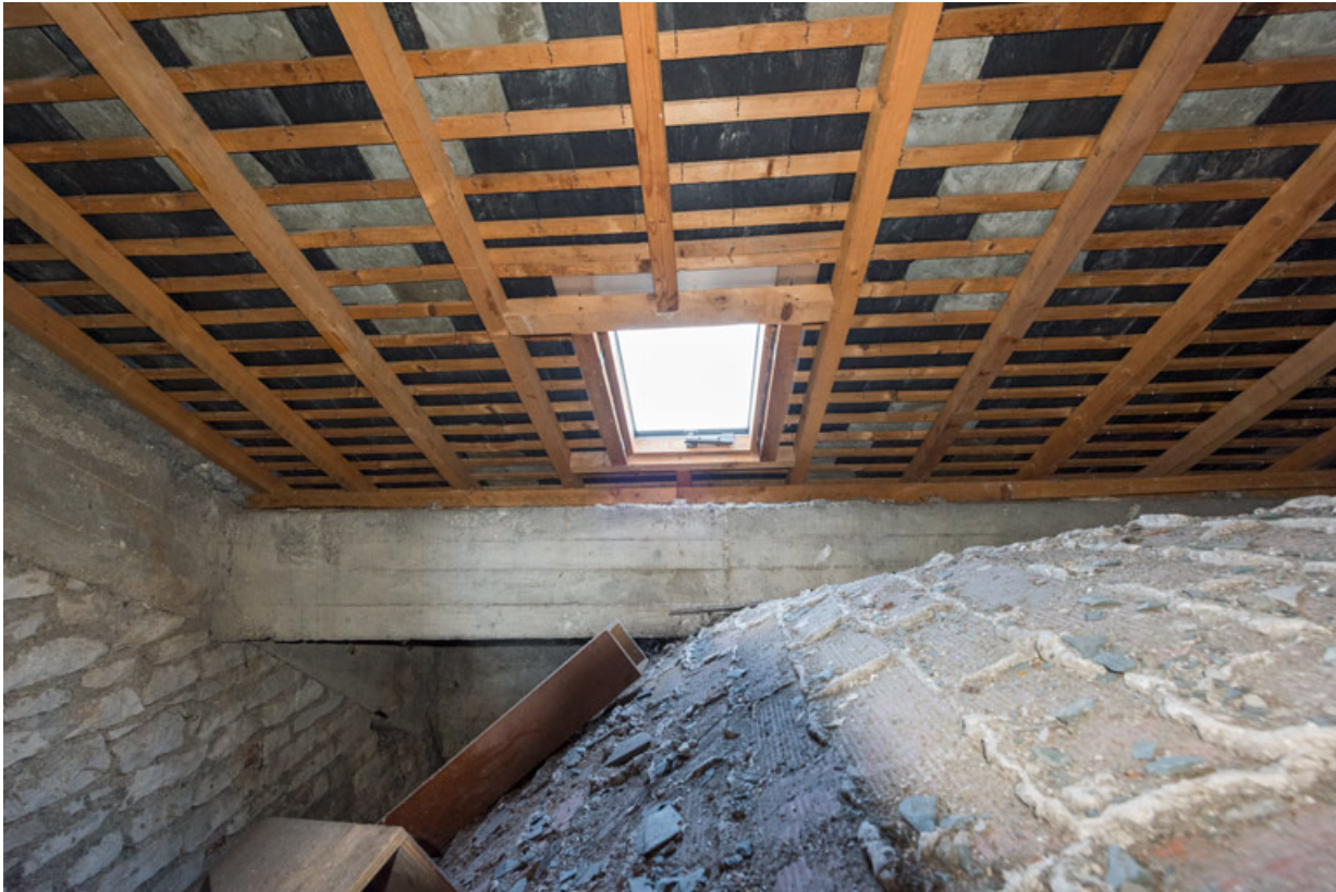
Voûte de la chapelle des fonts et charpente.

89, Migennes, 3 avenue Marcelin Berthelot