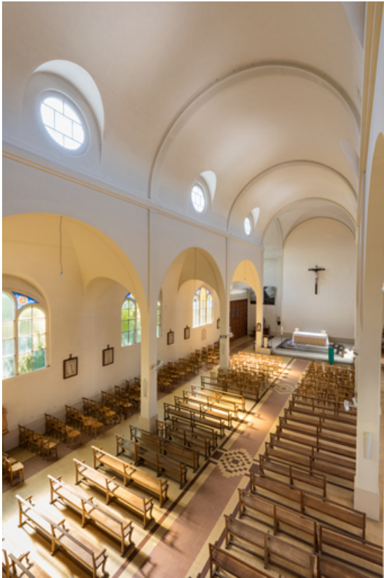
Nef. Vue en direction du chœur et du bas-côté gauche.

89, Migennes, 3 avenue Marcelin Berthelot