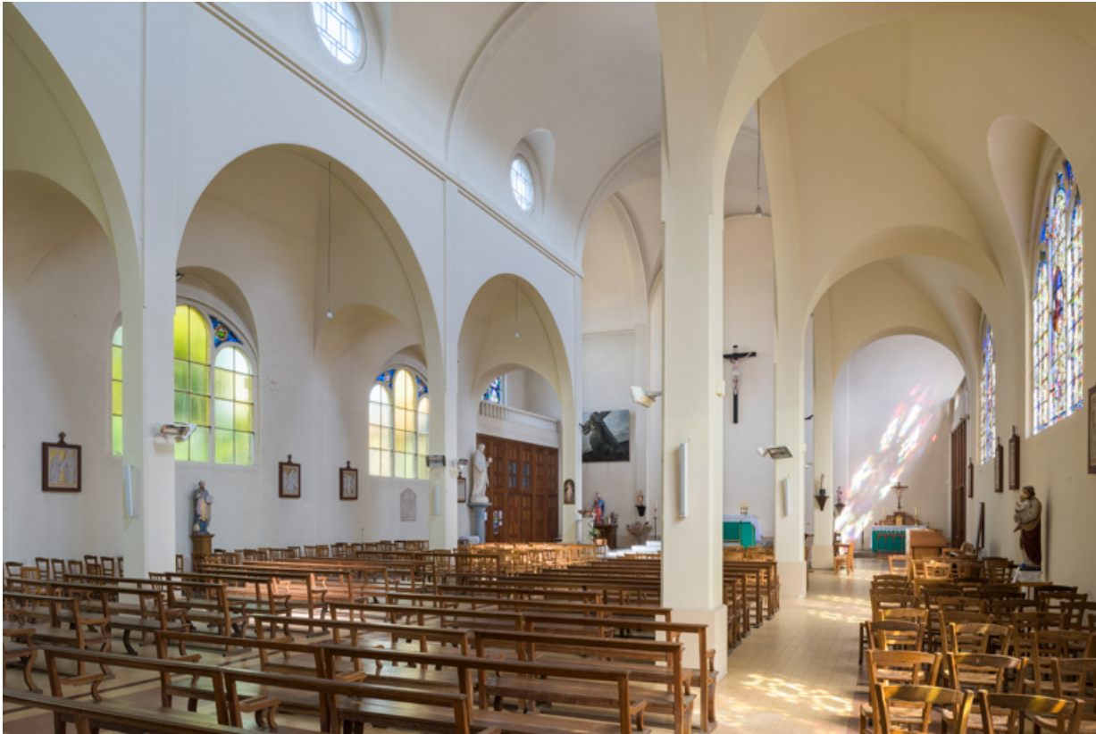
Nef. Vue de trois quarts en direction du nord-ouest.

89, Migennes, 3 avenue Marcelin Berthelot