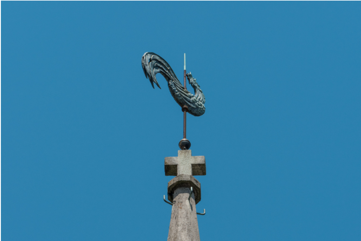
Croix et coq surmontant le clocher.

89, Migennes, 3 avenue Marcelin Berthelot