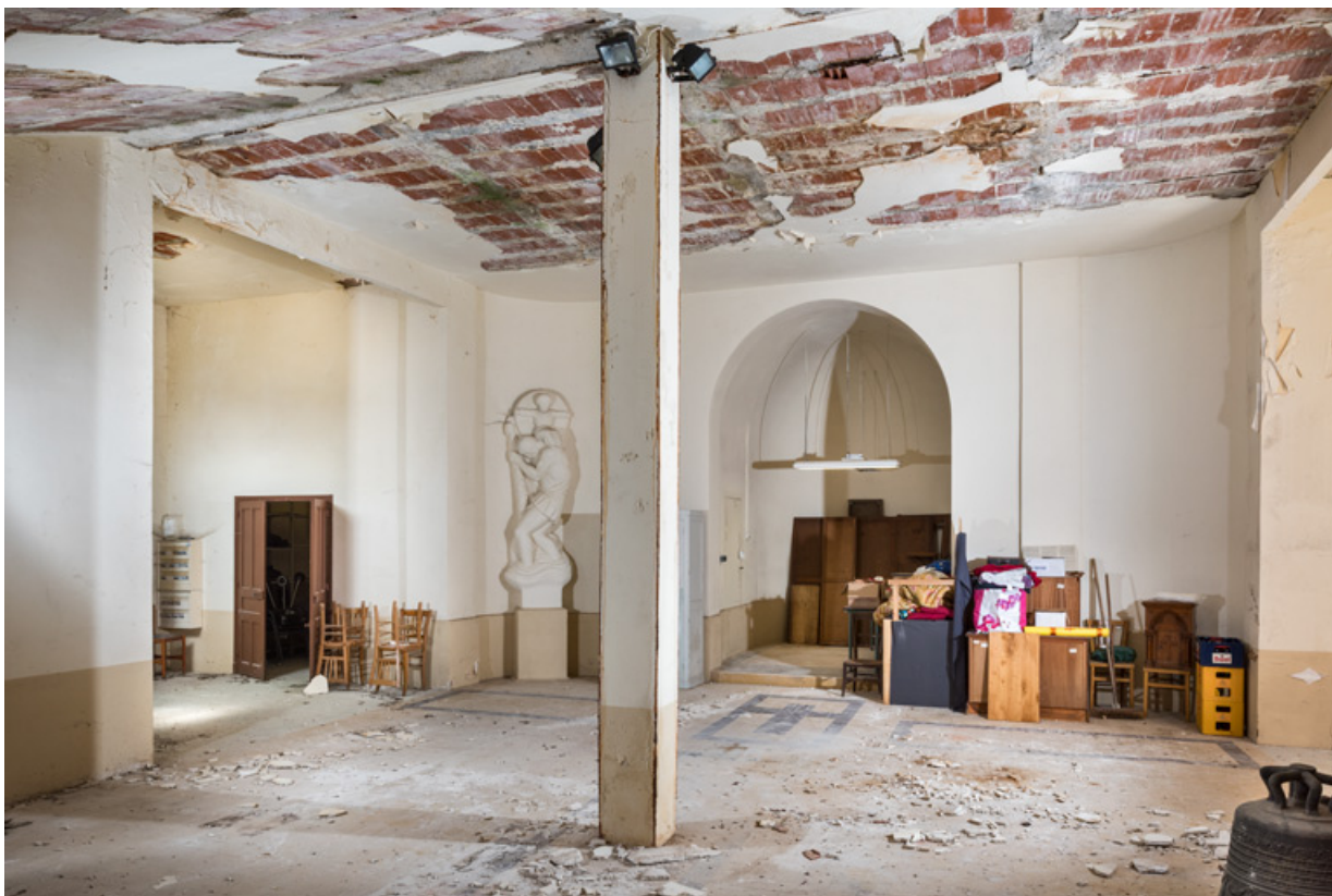
Crypte. Vue de trois quarts en direction du chœur.

89, Migennes, 3 avenue Marcelin Berthelot