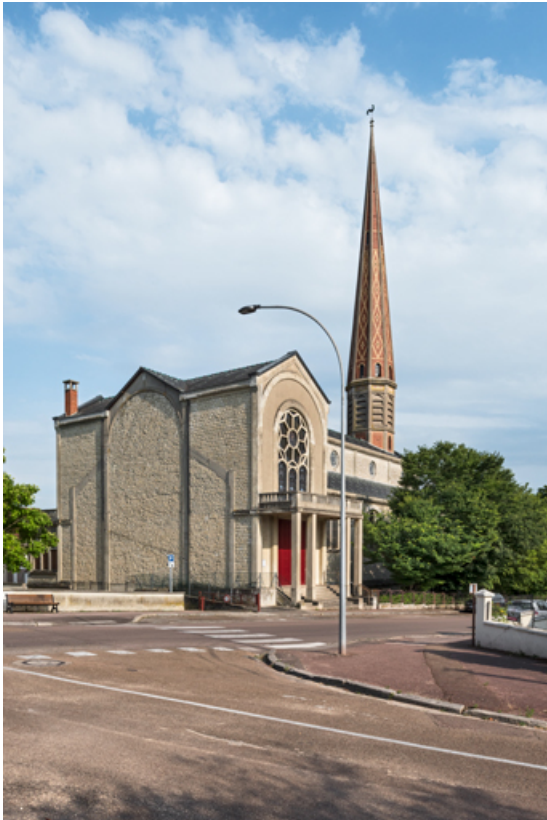
Transept. Vue d'ensemble, de trois quarts.

89, Migennes, 3 avenue Marcelin Berthelot