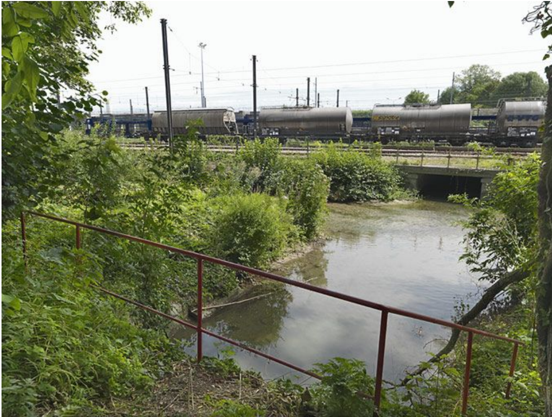
Sortie de l'aqueduc du ruisseau du Préblin, la rigole d'évacuation du canal le rejoint sur la gauche pour passer sous les voies ferrées.

89, Migennes, lieudit : bief 113 du versant Yonne