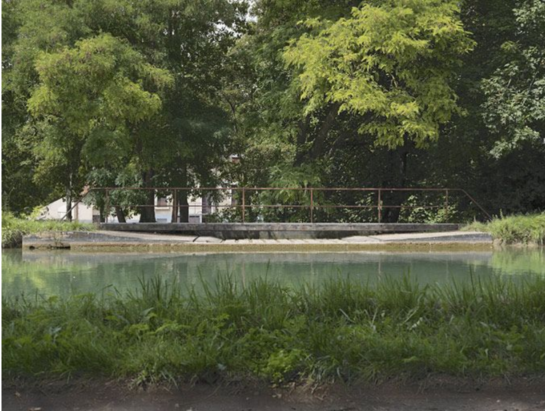
Détail du chemin de halage qui est prolongé par une passerelle métallique avec la maçonnerie du déversoir de superficie rive droite.

89, Migennes, lieudit : bief 113 du versant Yonne