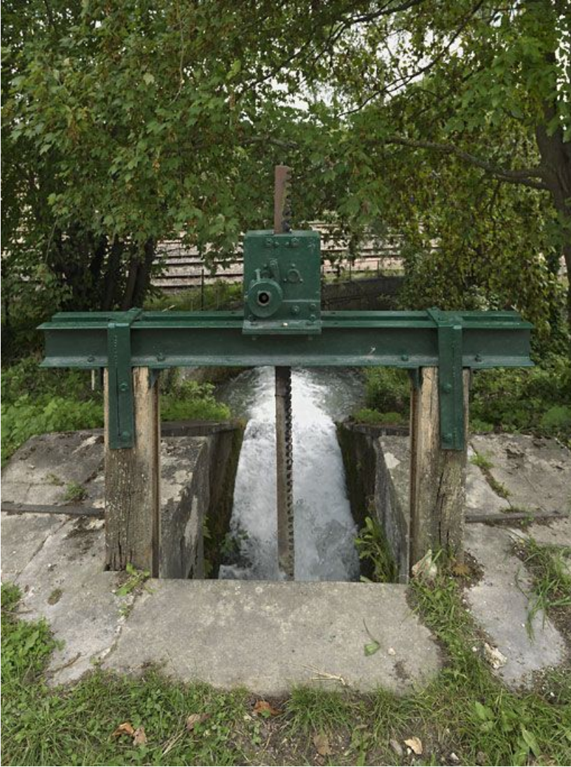
Détail de la vanne du déversoir de fond rive gauche.

89, Migennes, lieudit : bief 113 du versant Yonne