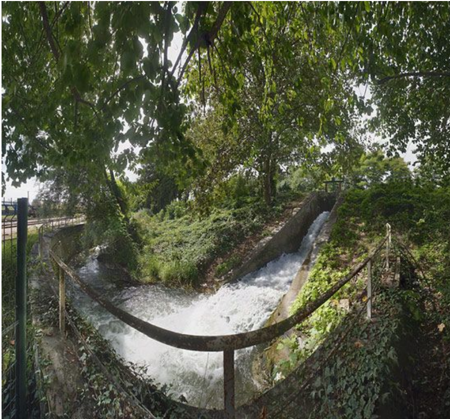
Vue d'ensemble de la rigole d'évacuation et de la vanne du déversoir de fond. 89, Migennes, lieudit : bief 113 du versant Yonne