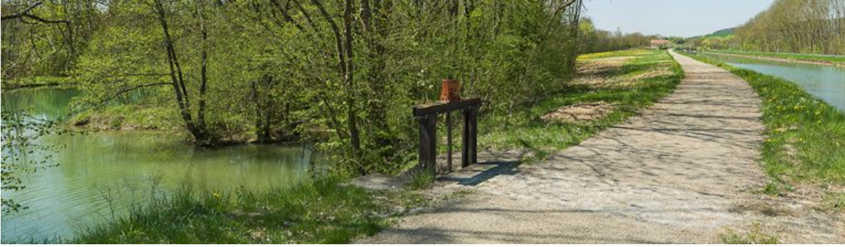
Détail de la vanne. Site d'écluse en fond.