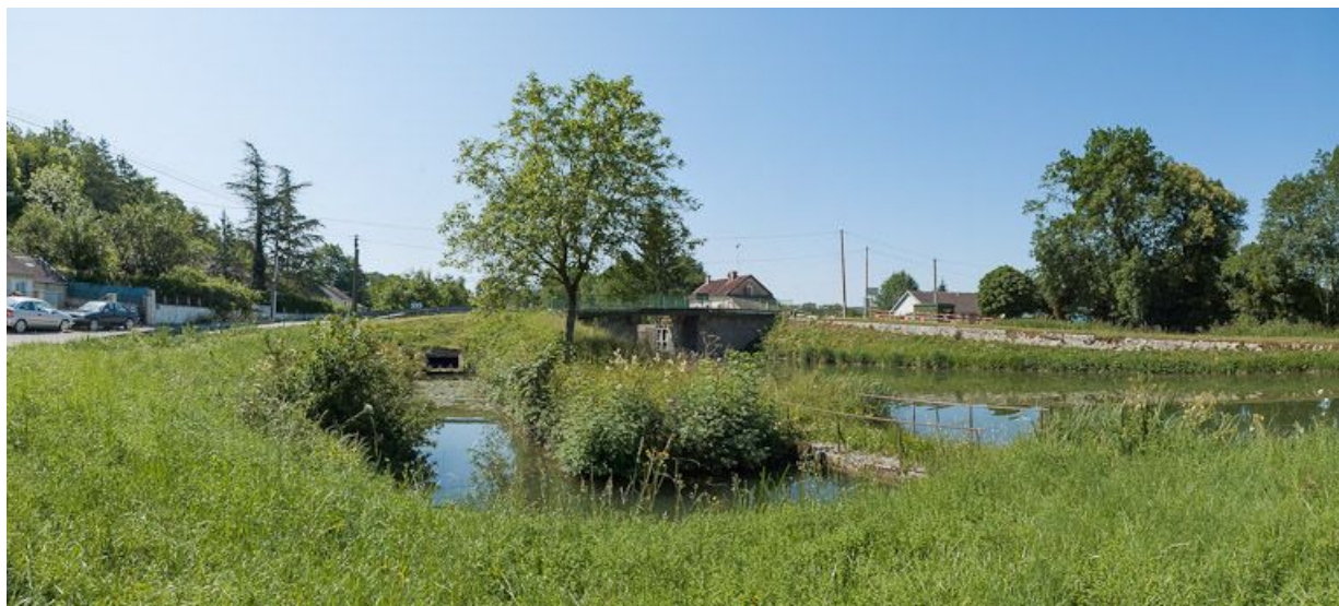
Vue d'ensemble de l'arrivée de la rigole et pont sur écluse 73 en arrière-plan.

89, Cry, lieudit : bief 74 du versant Yonne