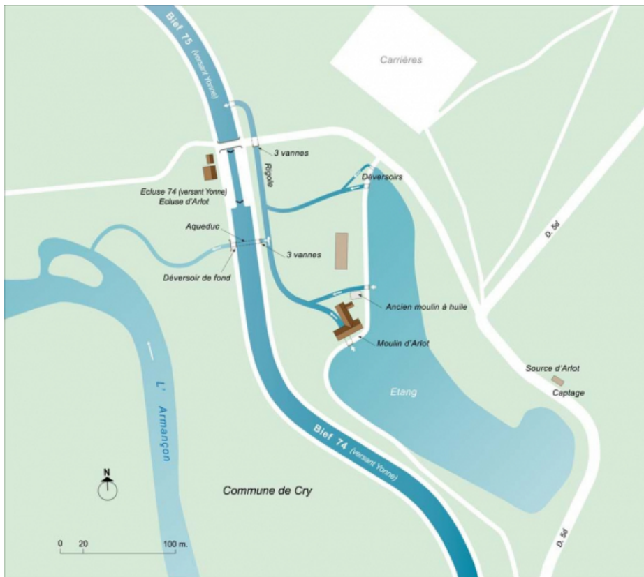
Plan schématique du réseau hydraulique aux biefs 74 et 75 du versant Yonne et du moulin d'Arlot. 89, Cry, lieudit : bief 74 du versant Yonne