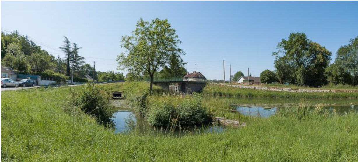
Vue d'ensemble de l'arrivée de la rigole et pont sur écluse 73 en arrière-plan.

89, Cry, lieudit : bief 74 du versant Yonne