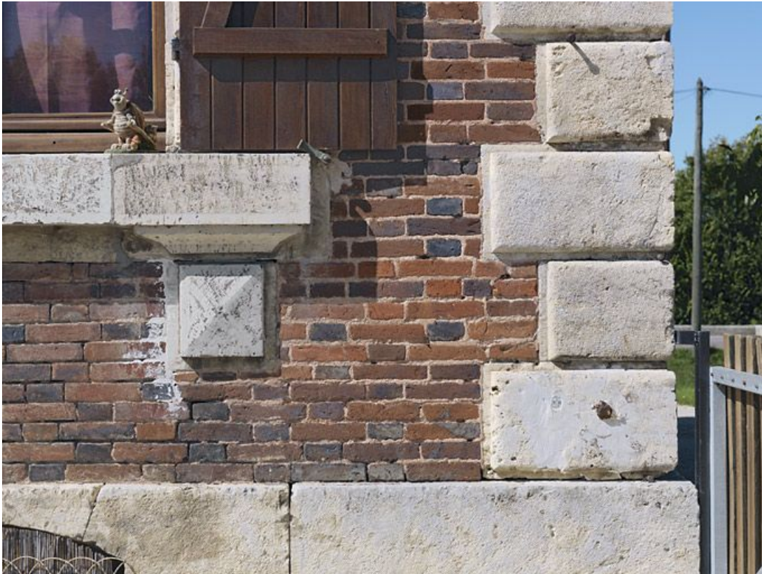
Maison éclusière : chaîne d'angle et encadrement de la fenêtre.

89, Brienon-sur-Armançon, lieudit : bief 112 du versant Yonne