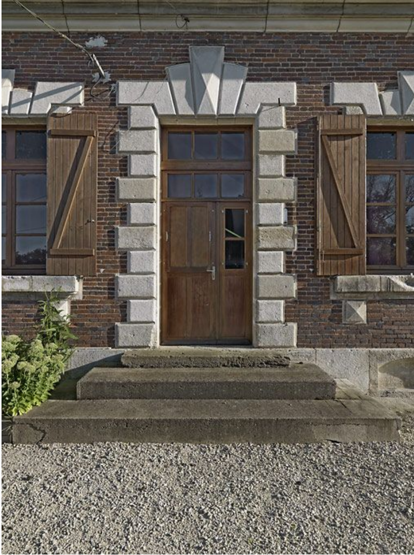
Maison éclusière : porte arrière.

89, Brienon-sur-Armançon, lieudit : bief 112 du versant Yonne