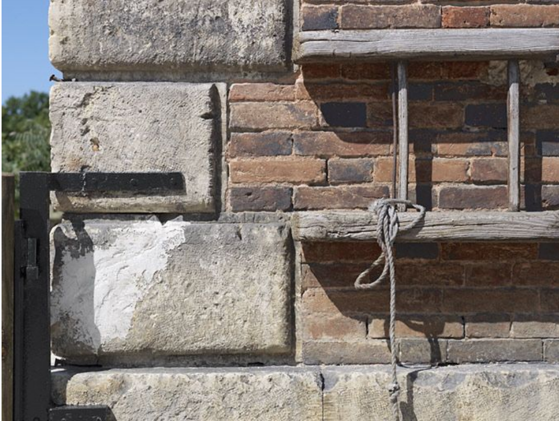
Maison éclusière : détail de la chaîne d'angle et de l'échelle fixée sur le côté.

89, Brienon-sur-Armançon, lieudit : bief 112 du versant Yonne