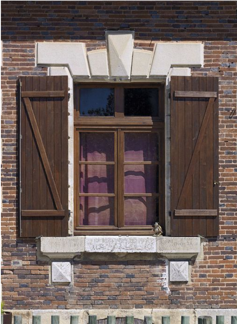
Maison éclésièrre : détail de la fenêtre.

89, Brienon-sur-Armançon, lieudit : bief 112 du versant Yonne