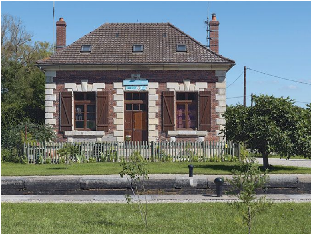
Maison éclusière : vue de face.

89, Brienon-sur-Armançon, lieudit : bief 112 du versant Yonne