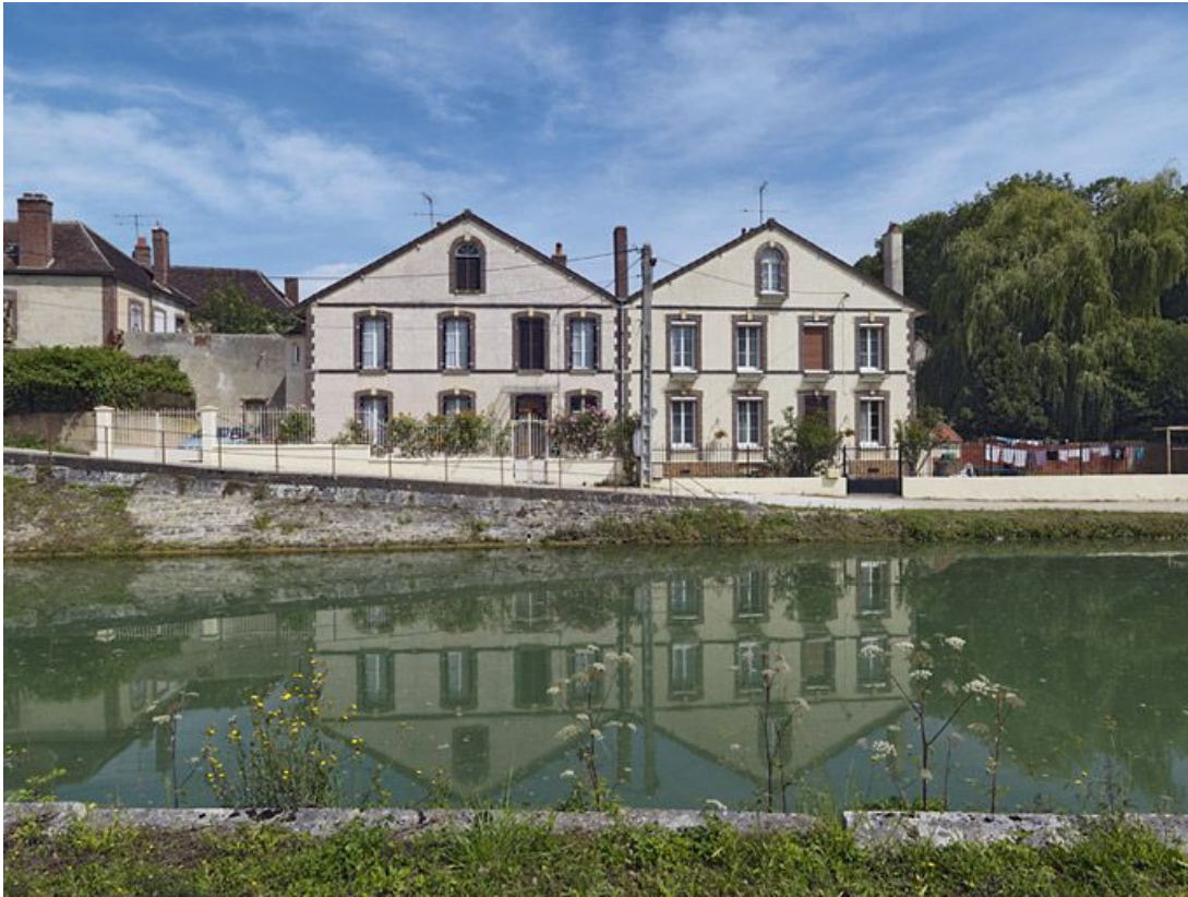
Amont du pont, rive droite : d'anciennes usines.

89, Brienon-sur-Armançon, lieudit : bief 112 du versant Yonne