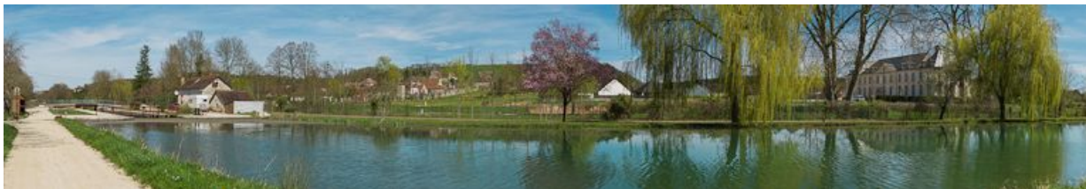
Vue panoramique. De gauche à droite : le site d'écluse et le château.

89, Cheney, lieudit : bief 98 du versant Yonne