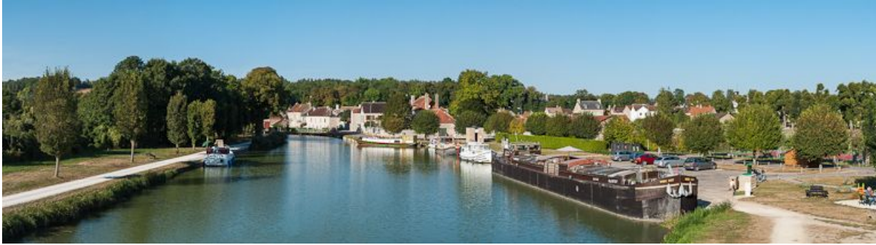
Le port au premier plan, le village de Tanlay en arrière-plan.

89, Tanlay, lieudit : bief 90 du versant Yonne