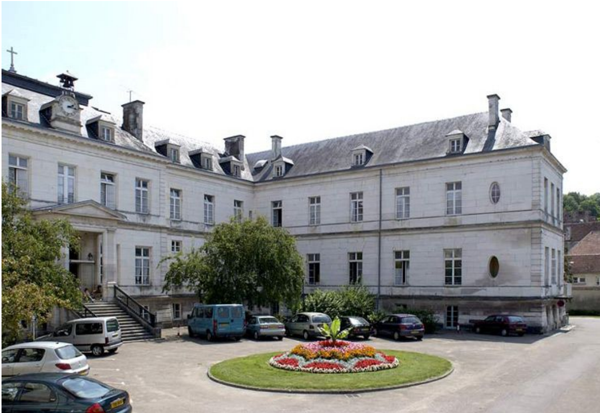
Pavillon Dormois : vue partielle du corps central et aile sud dévolue aux hommes. 89, Tonnerre Hôpital