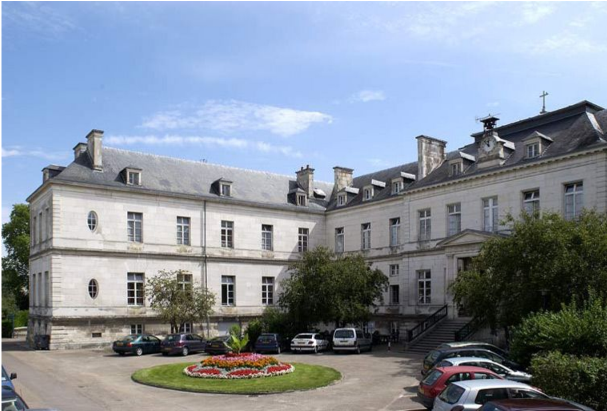
Pavillon Dormois : vue partielle du corps central et aile nord dévolue aux femmes.