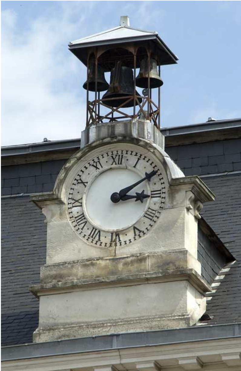
Pavillon Dormois : horloge et campanile.