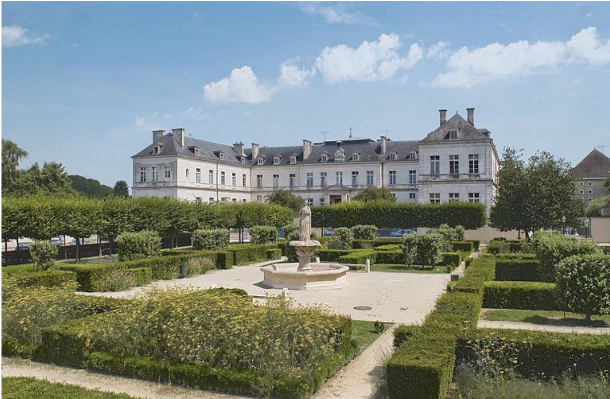
Pavillon Dormois : vue d'ensemble de la façade antérieure.