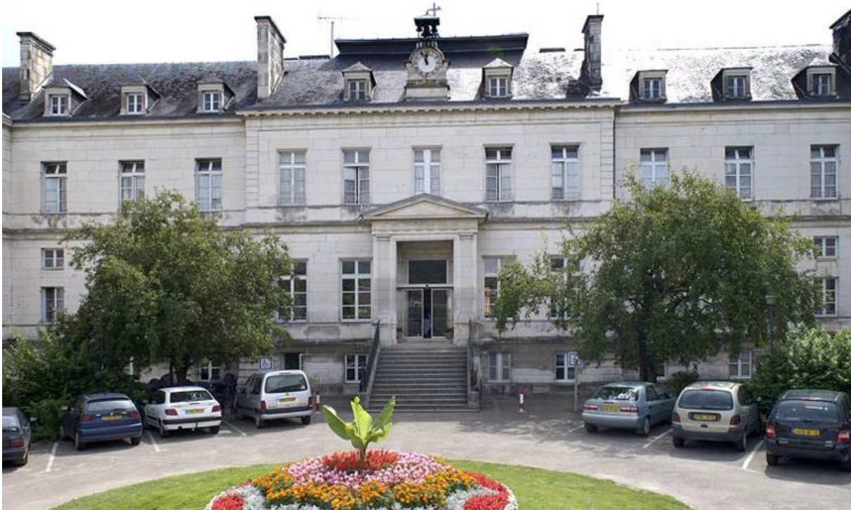
Pavillon Dormois : corps central dévolu à l'administration.