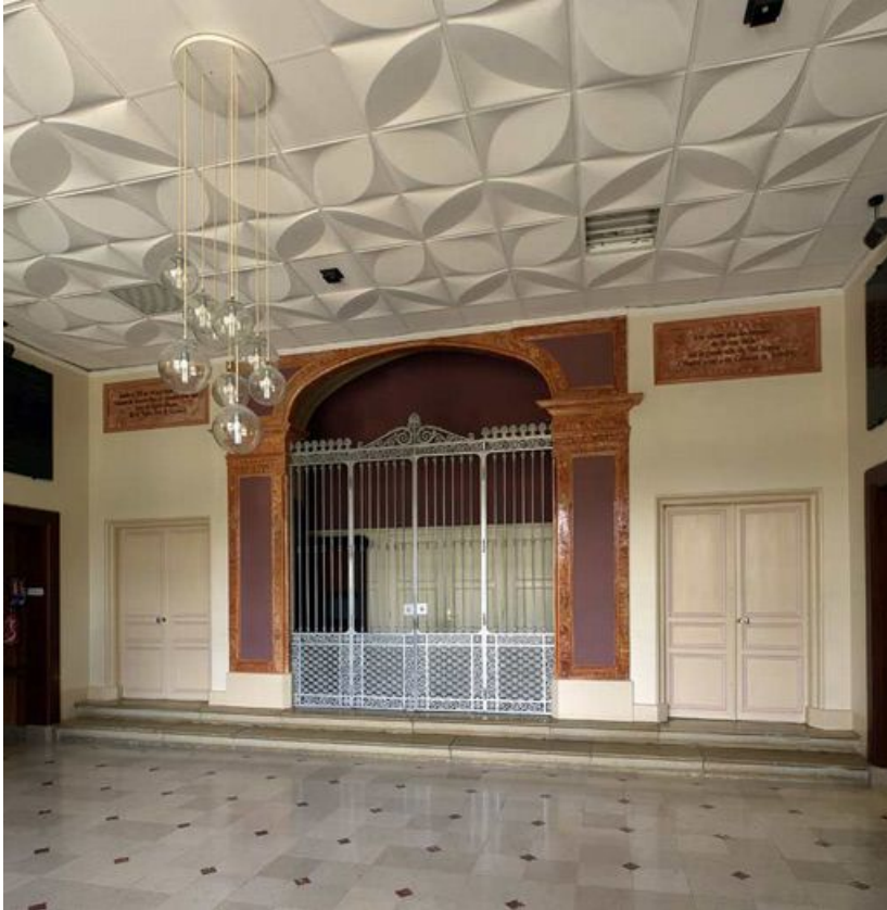
Pavillon Dormois : corps central, salle d'accueil et entrée de la chapelle. 89, Tonnerre Hôpital