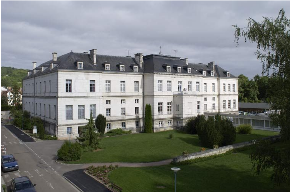
Pavillon Dormois : vue d'ensemble de la façade postérieure.