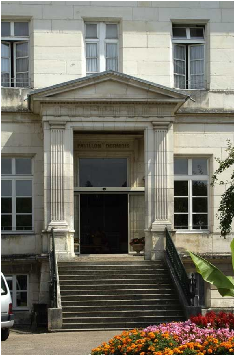
Pavillon Dormois : détail de la porte d'entrée de la façade antérieure. 89, Tonnerre Hôpital