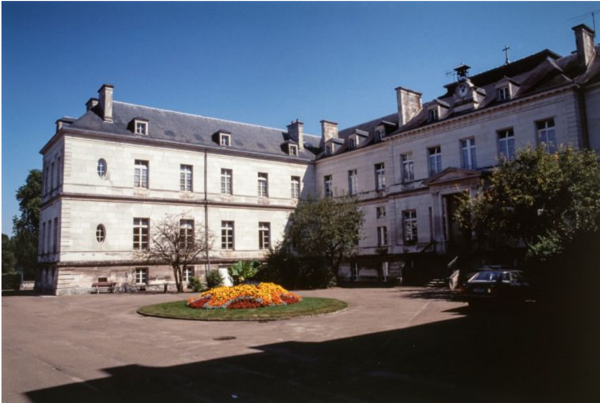
Cour et vue d'ensemble des façades.