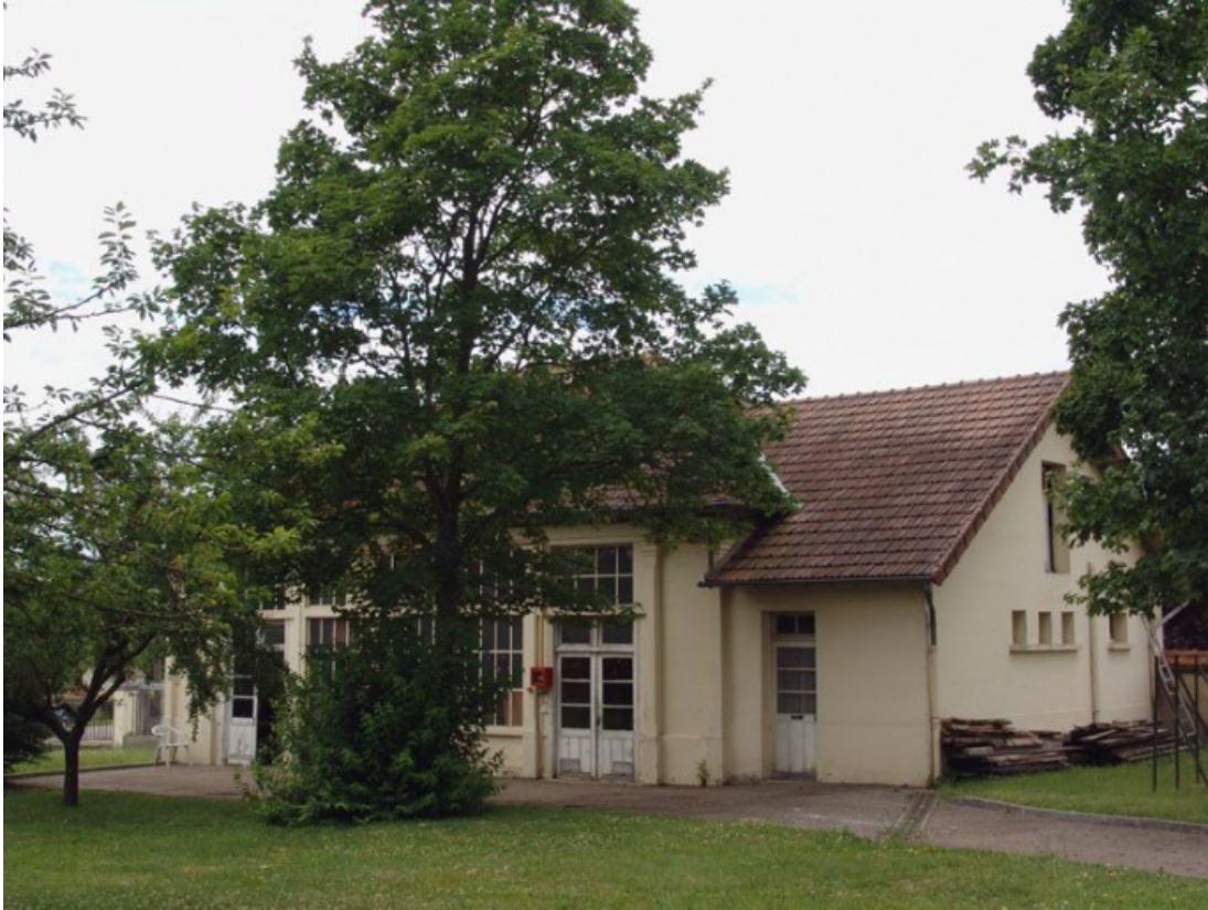
Le pavillon de la laverie, buanderie et désinfection.

89, Brienon-sur-Armançon, 4 rue Marie-Noël