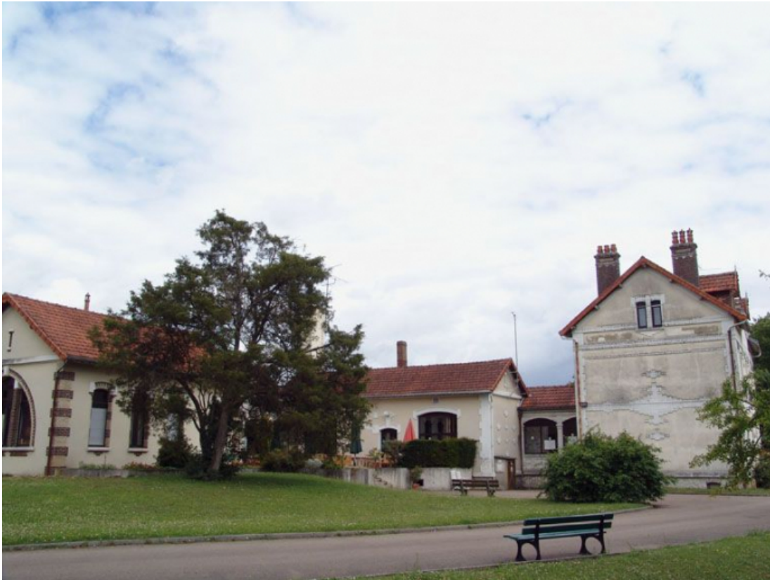
Vue d'ensemble prise de l'ouest.

89, Brienon-sur-Armançon, 4 rue Marie-Noël