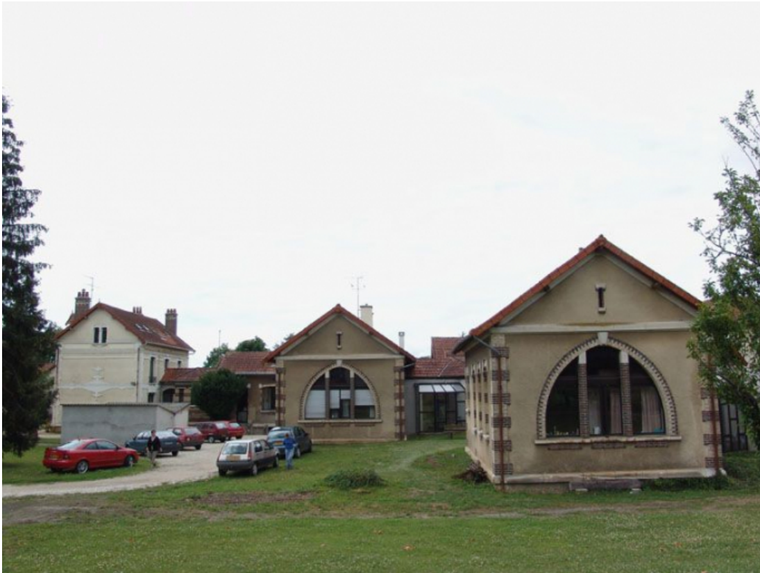
Vue générale prise de l'est : deux pavillons et le bâtiment de l'administration à l'arrière plan.

89, Brienon-sur-Armançon, 4 rue Marie-Noël