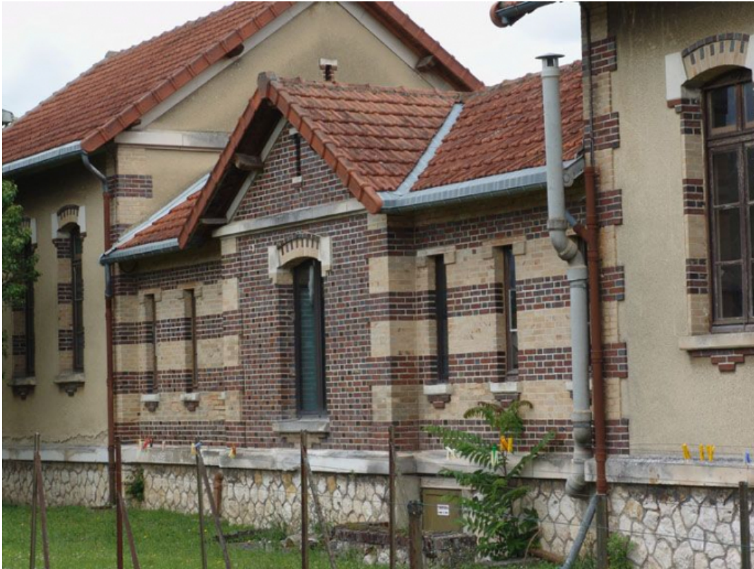
La galerie de liaison entre le pavillon des vieillards hommes et celui des femmes, élévation postérieure. 89, Brienon-sur-Armançon, 4 rue Marie-Noël