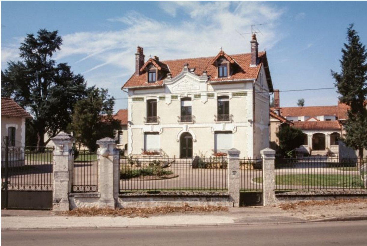
Bâtiment de l'administration, vue prise de la rue.

89, Brienon-sur-Armançon, 4 rue Marie-Noël