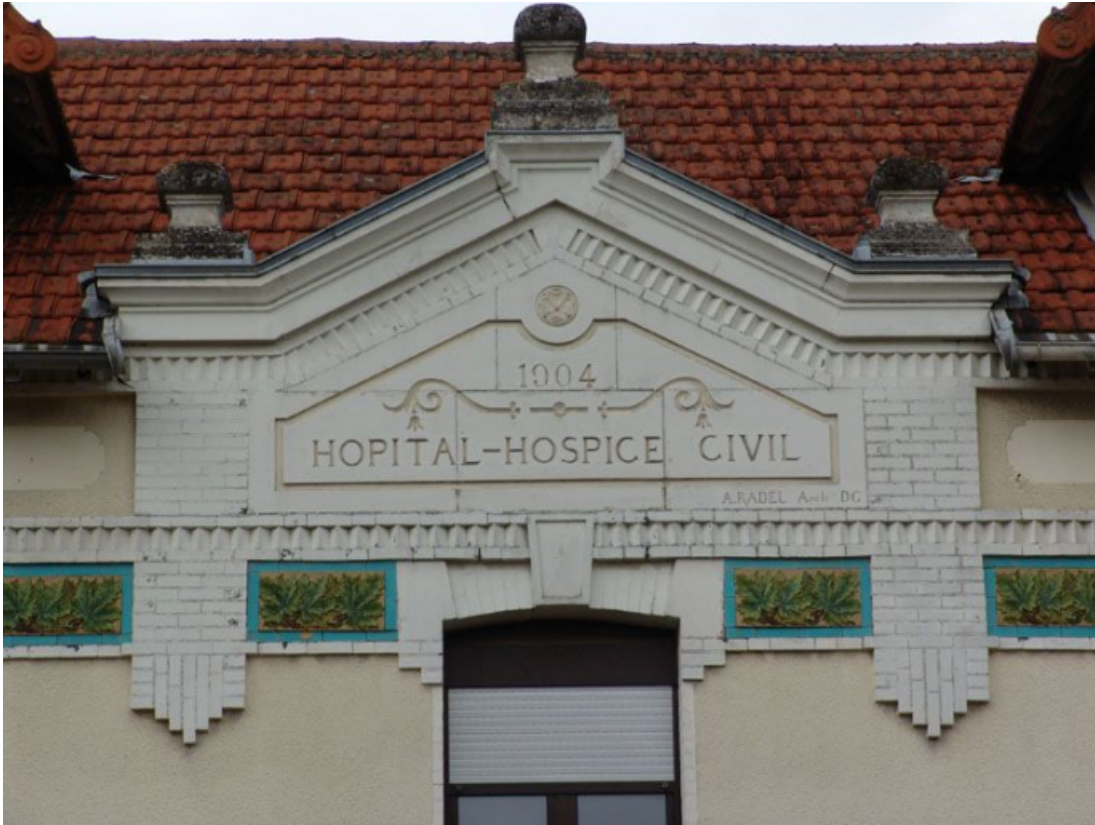
Bâtiment de l'administration, détail du fronton.

89, Brienon-sur-Armançon, 4 rue Marie-Noël