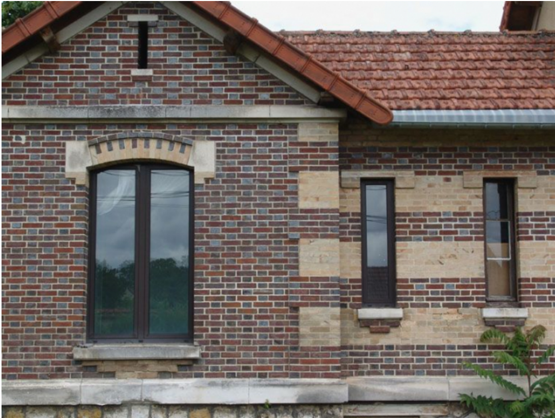
La galerie de liaison entre le pavillon des vieillards hommes et celui des femmes, détail de l'élévation postérieure. 89, Brienon-sur-Armançon, 4 rue Marie-Noël