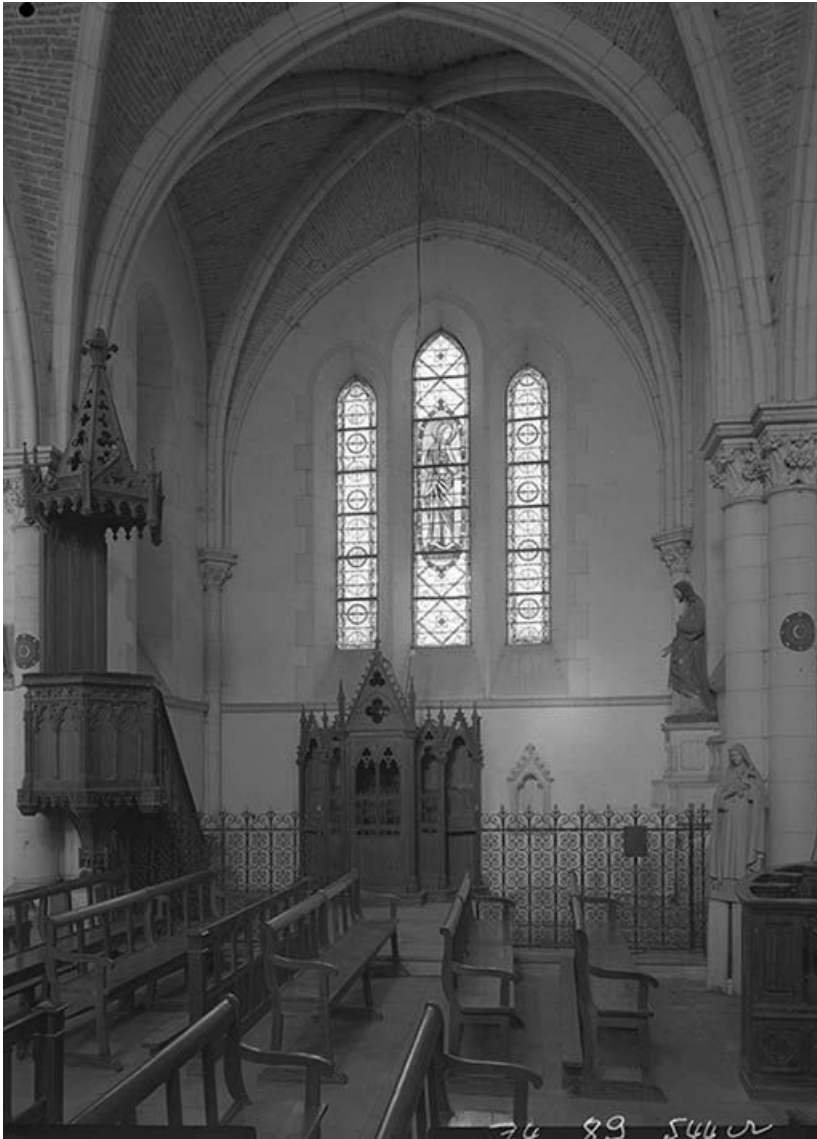
Chapelle du transept nord (?)