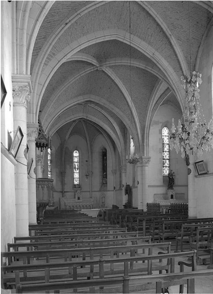
Vue intérieure vers le chœur. Voûte d'ogives.