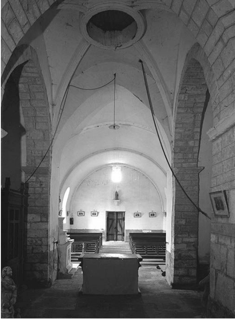
Vue intérieure prise depuis le chœur.