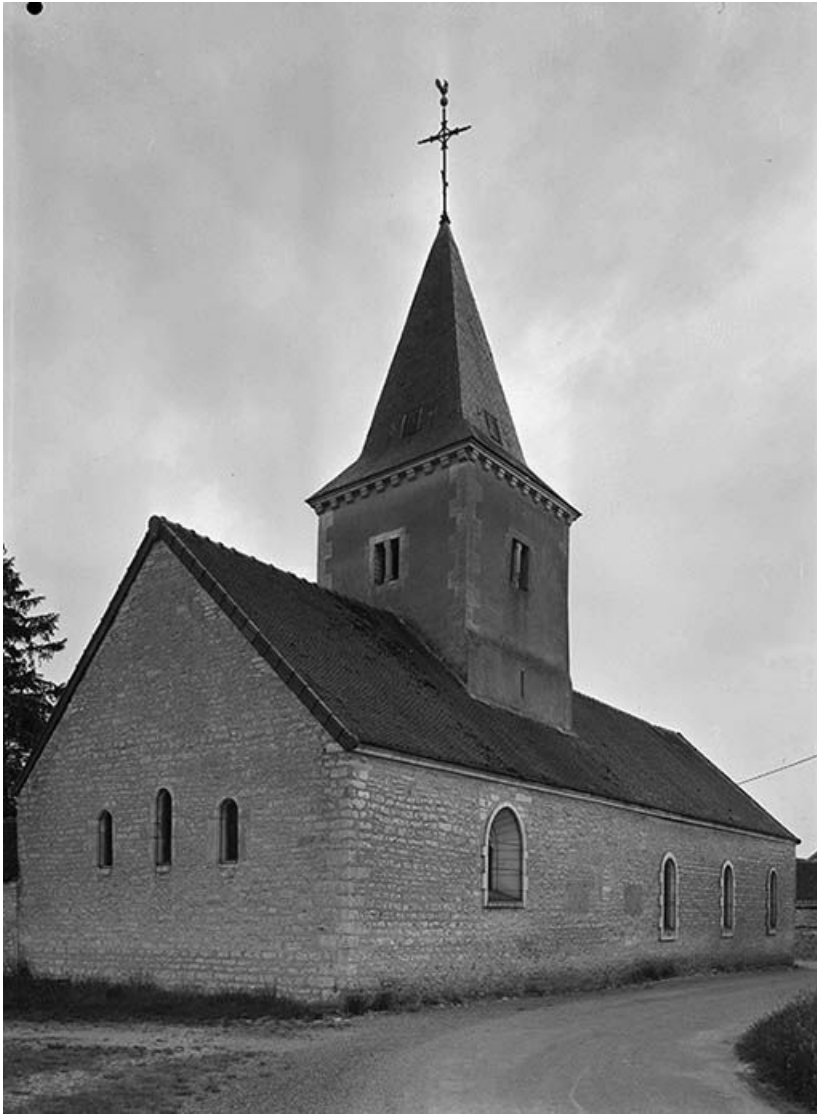
Chevet et bas-côté nord.