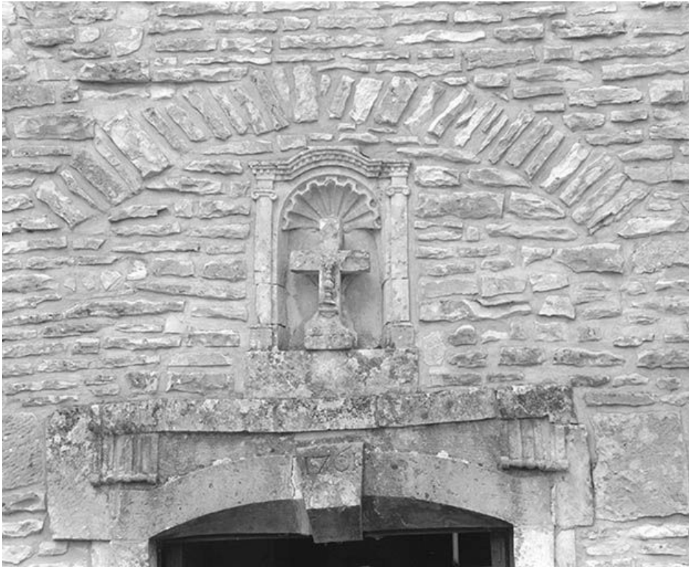
Niche surmontant le portail. Croix de pierre ornée d'un ostensorio en relief. 89, Sambourg