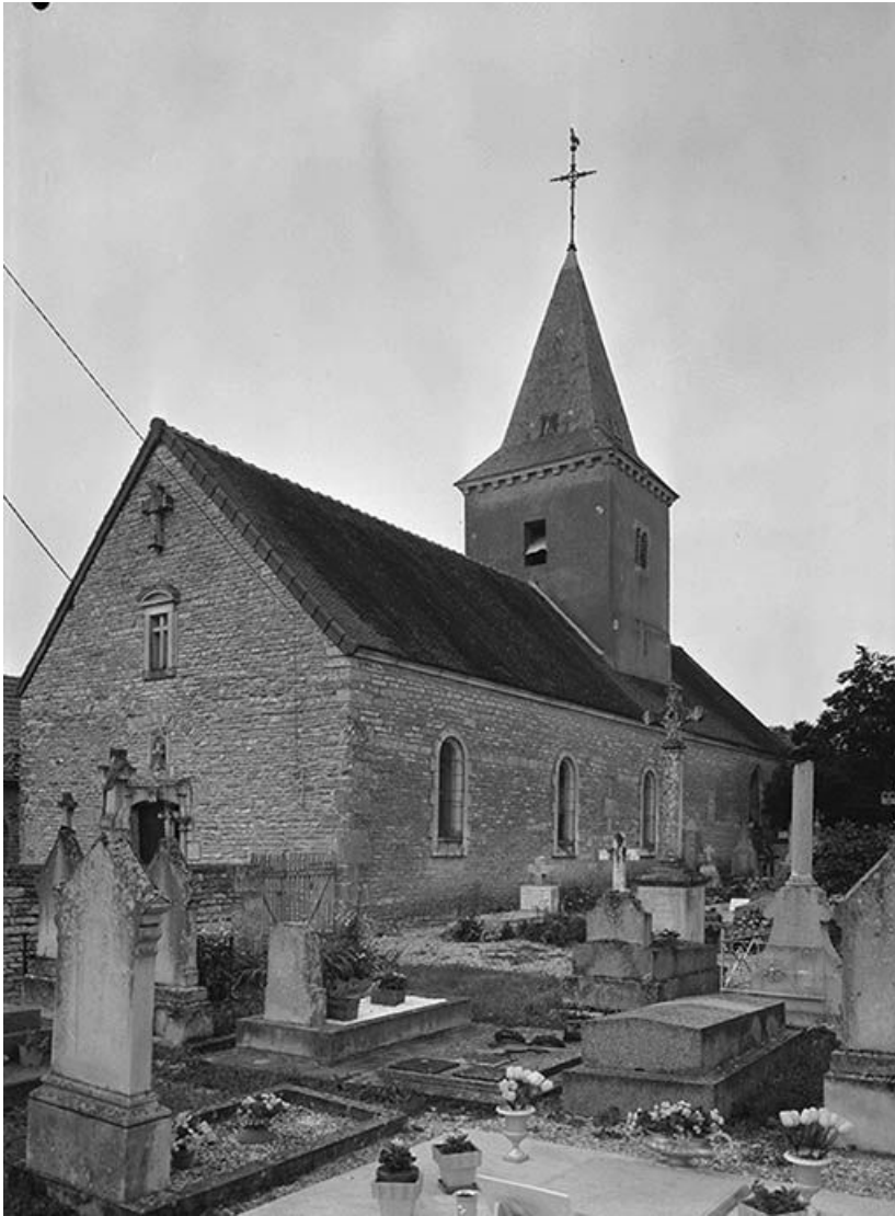
Façade occidentale et bas-côté sud.