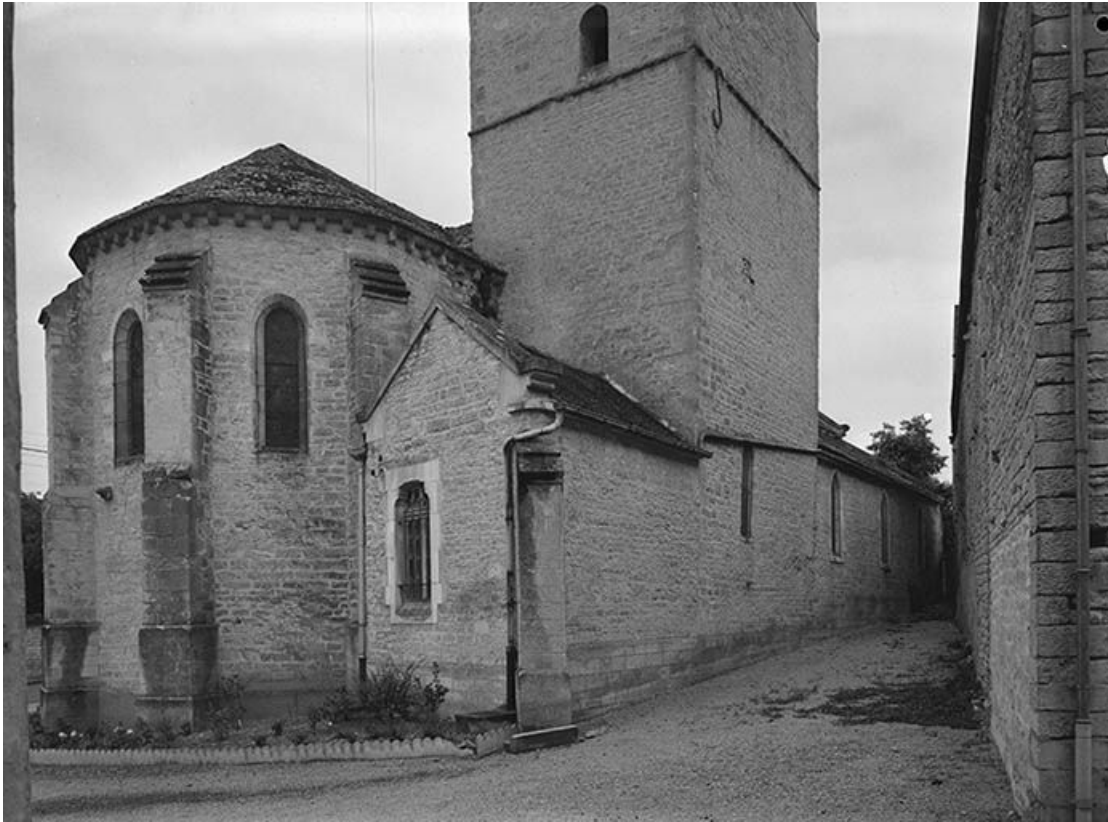
Chevet. 89, Lézennes