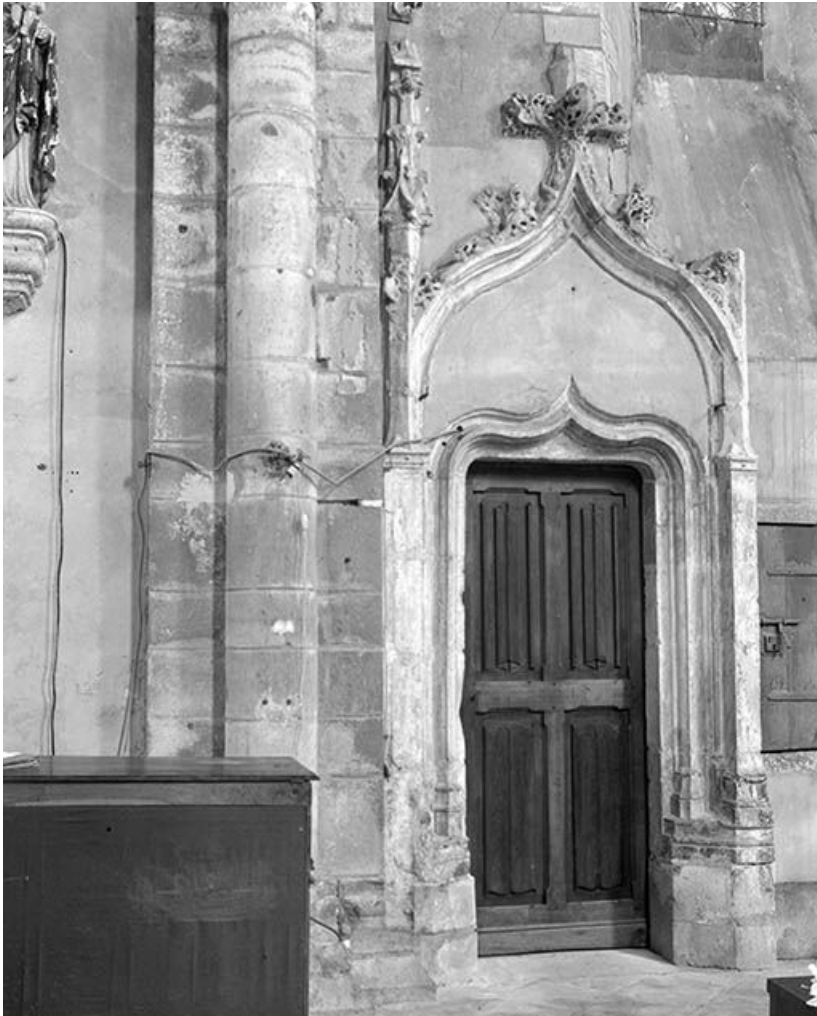
Porte ornée d'accolades et pinacles.