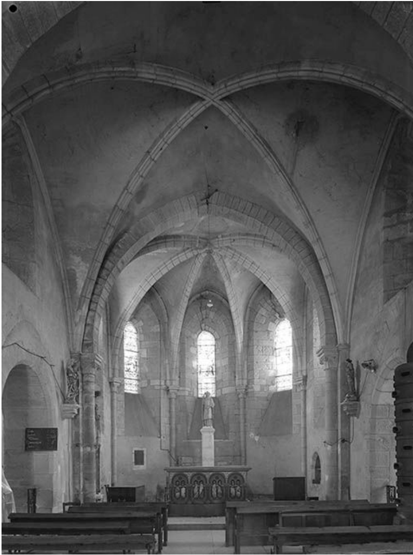
Vue intérieure vers le chœur, voûte d'ogives.