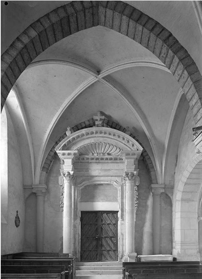
Travée d'un bas-côté avec porte monumentale.