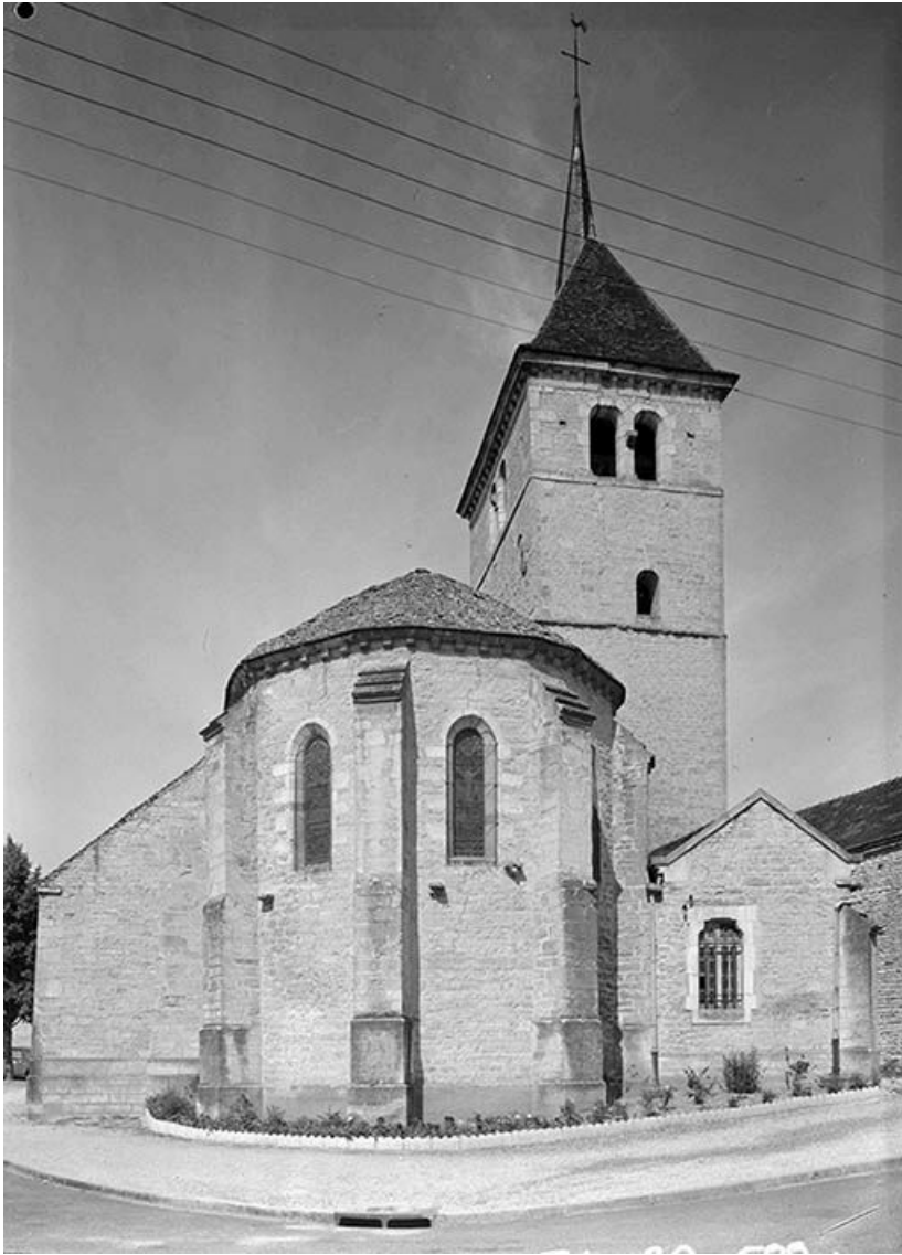
Chevet et clocher.