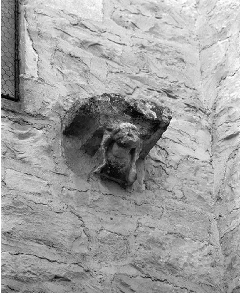
Corbeau ou console (?) orné(e) d'une figure humaine (?) 89, Lézennes