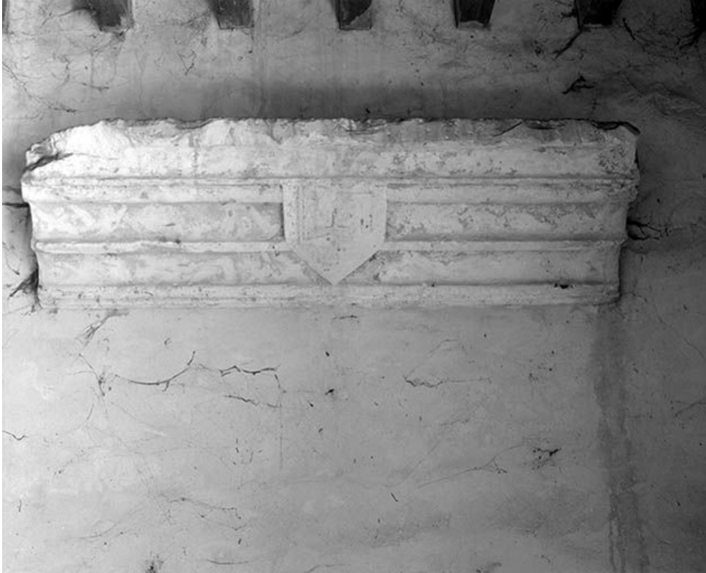
Tombeau. 89, Lézennes