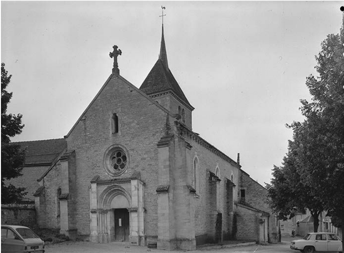
Façade occidentale avec portail.