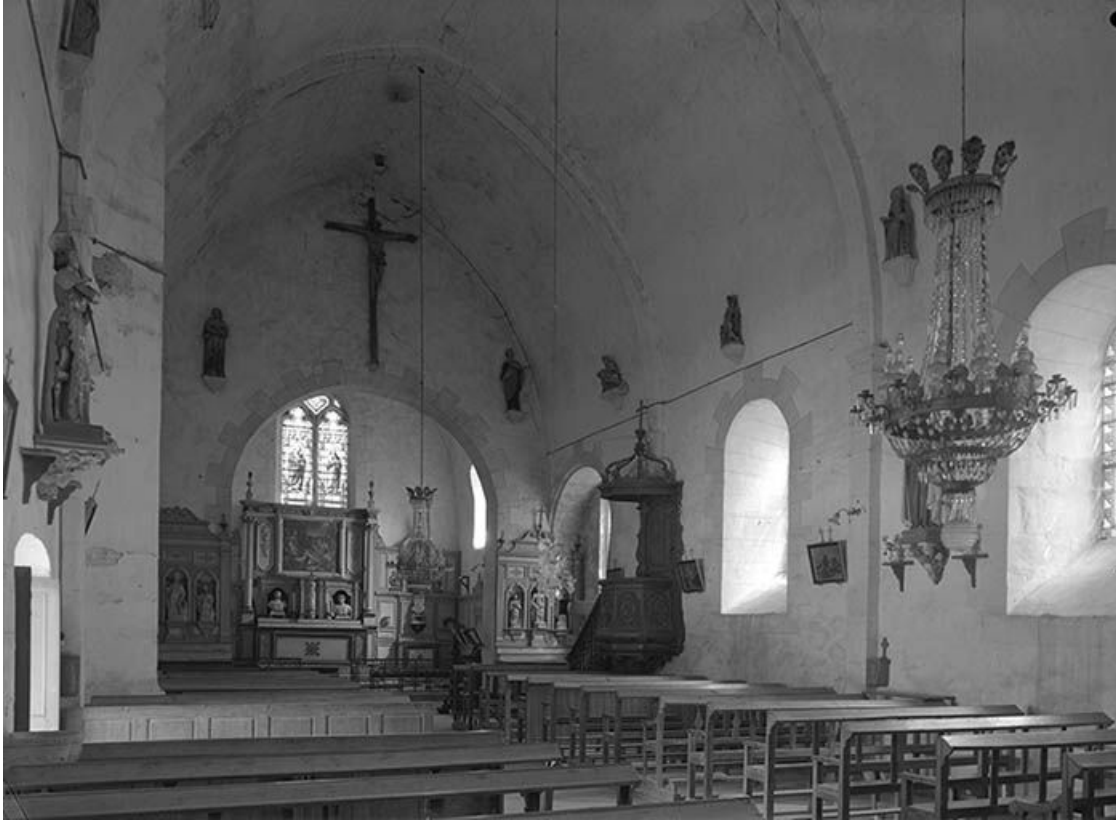
Vue intérieure vers le chœur.