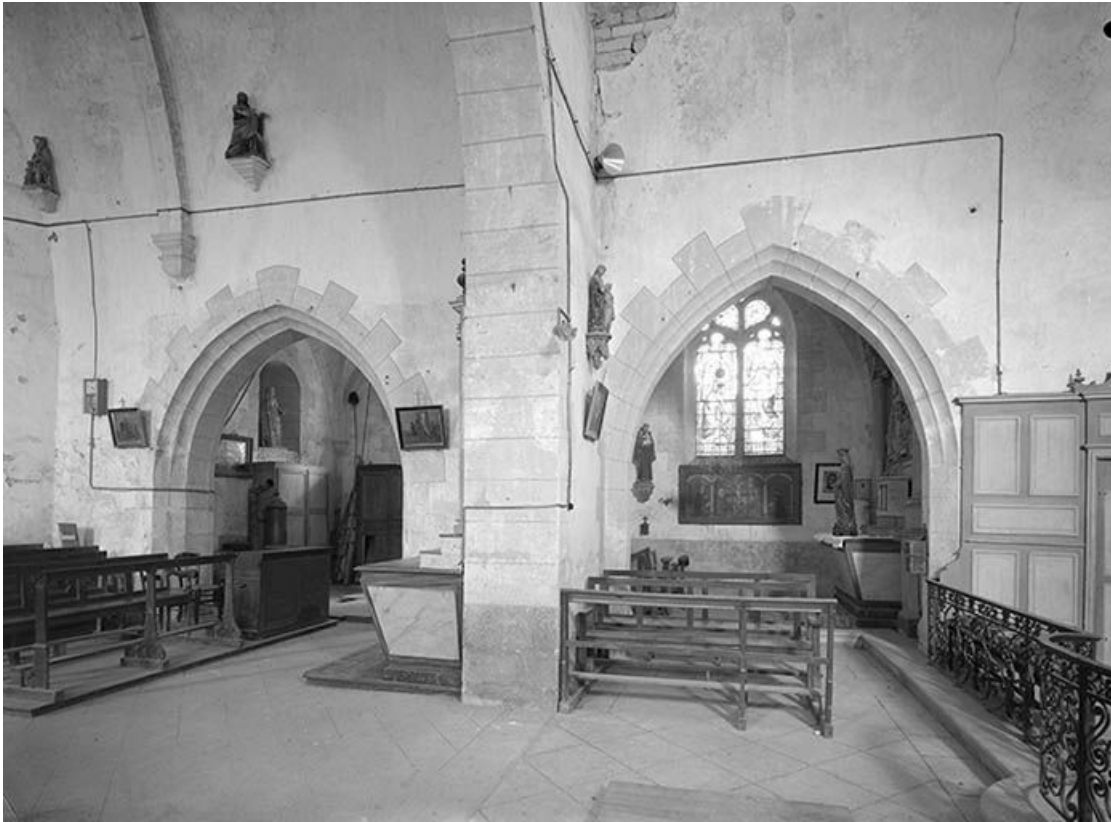
Chapelles du bas-côté sud (?)