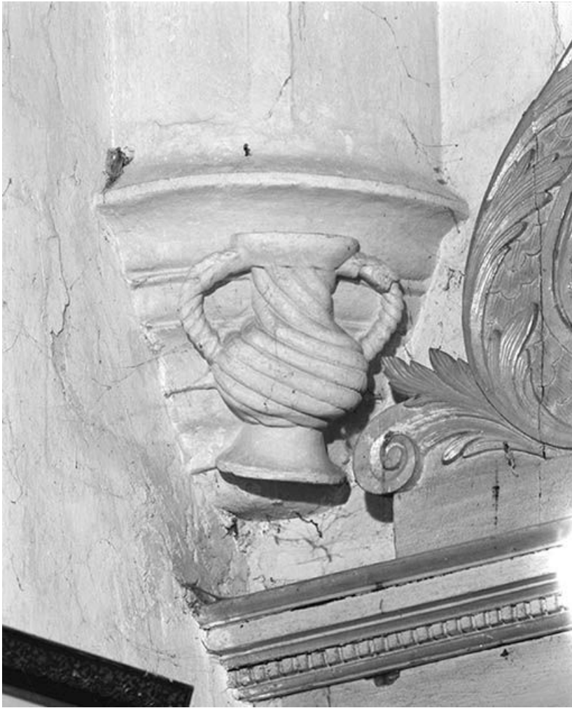
Chapelle gauche. Culot postérieur gauche mouluré avec vase en relief, à anses et panse torsadées. 89, Cry rue du Moulin