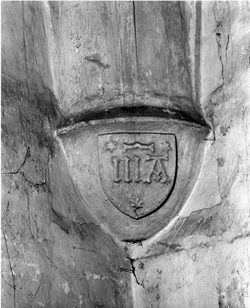
Rez-de-chaussée du clocher. Culot antérieur gauche sculpté d'un écu avec monogramme MA. 89, Cry rue du Moulin