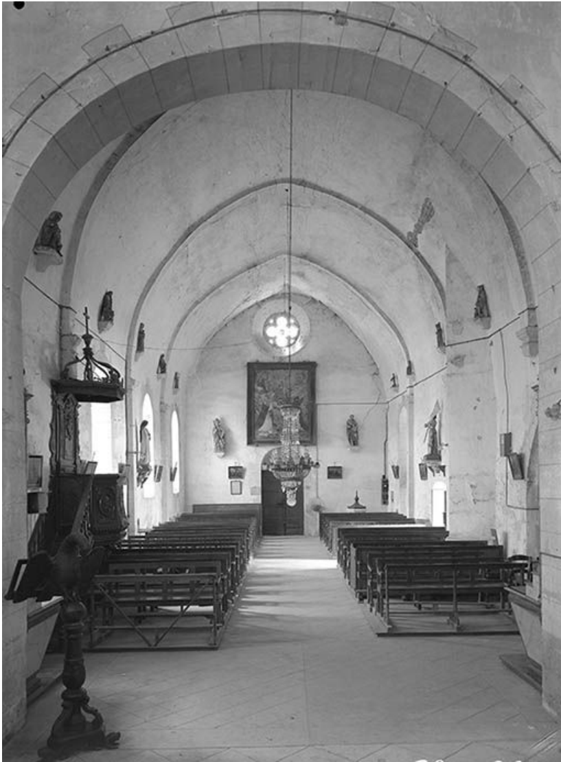
Vue est-ouest de la nef (?), à voûte en berceau brisé. 89, Cry rue du Moulin