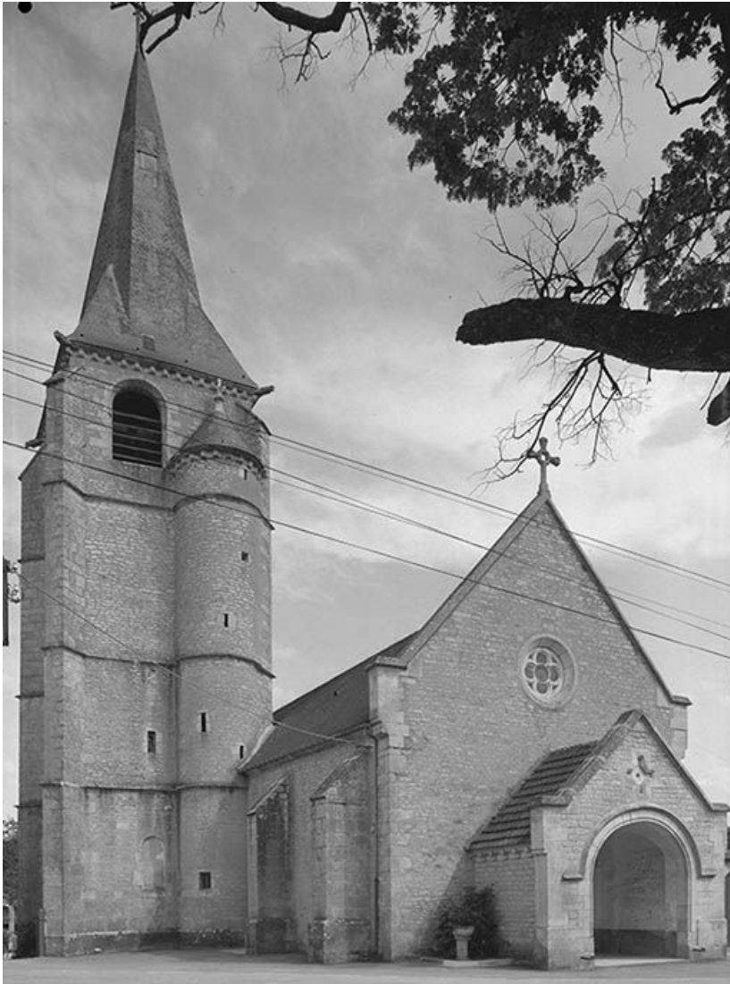
Façade occidentale avec porche et clocher (sur le bas-côté nord). 89, Cry rue du Moulin