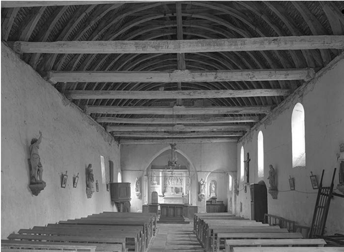
La nef vue depuis l'entrée.

89, Ancy-le-Libre, lieudit : bief 87 du versant Yonne