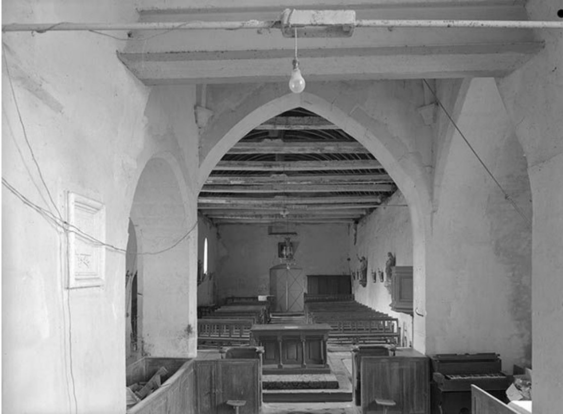
La nef vue depuis le chœur.

89, Ancy-le-Libre, lieudit : bief 87 du versant Yonne