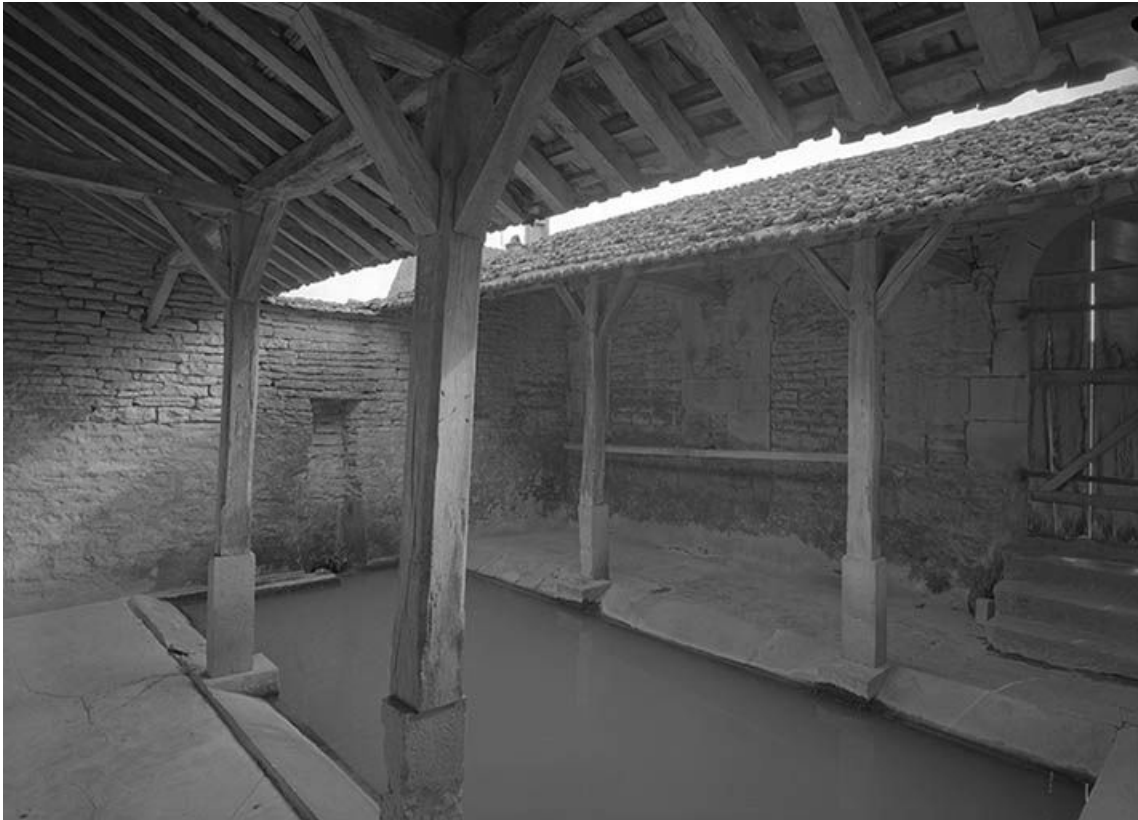
Vue intérieure. Bassin et charpente.