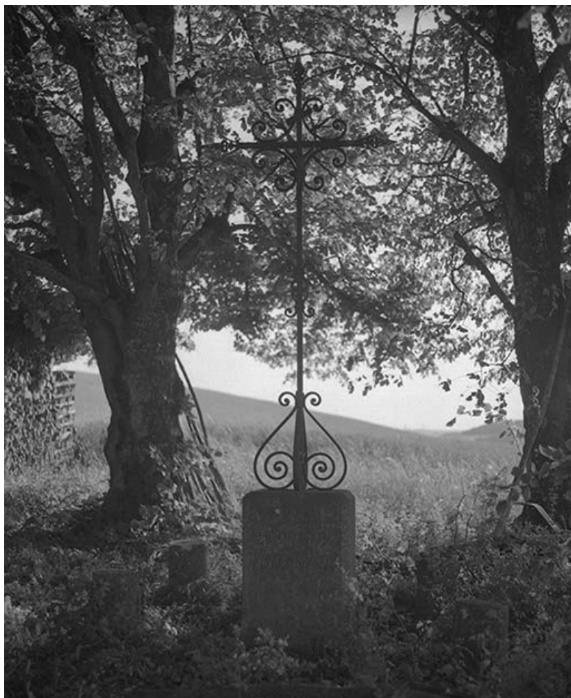
Croix de chemin.