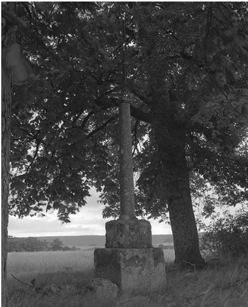
Croix de chemin.