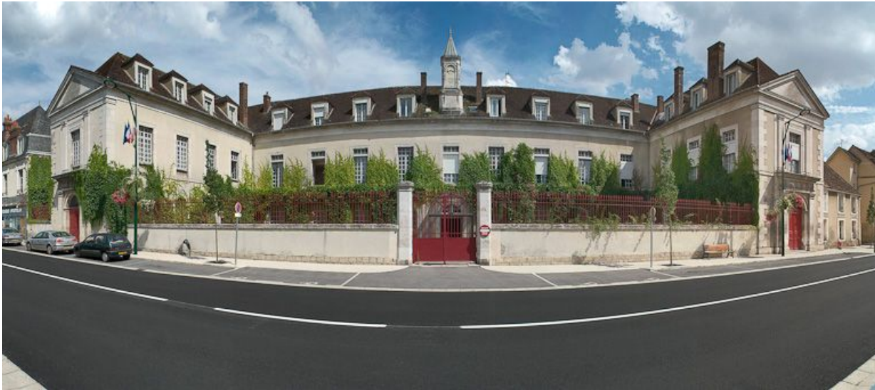
Bâtiment principal : vue d'ensemble des façades sur rue.