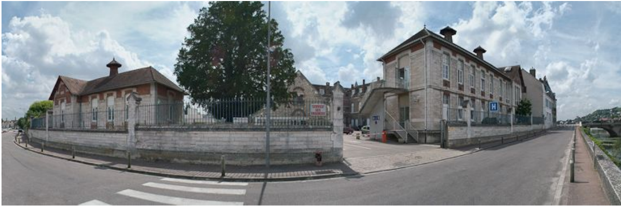
Vue d'ensemble depuis le quai.