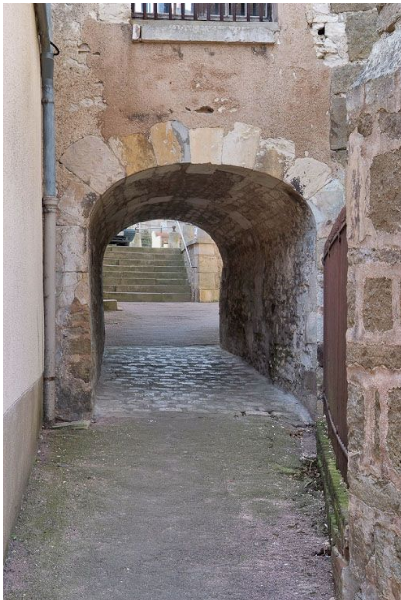
Passage couvert entre l'église et l'ancien hôpital.

89, Seignelay, 2 rue du Docteur Chauvelot