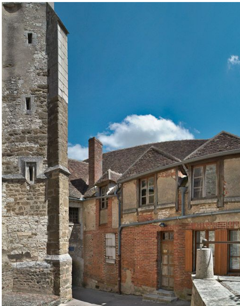
Façade postérieure du bâtiment sud-ouest. 89, Seignelay, 2 rue du Docteur Chauvelot