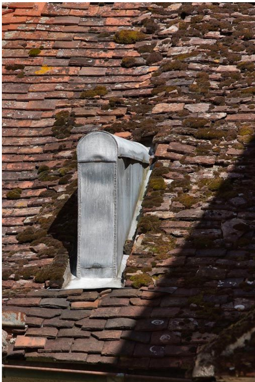
Elément en zinc sur le toit de la construction basse de l'angle nord-ouest de la cour. 89, Seignelay, 2 rue du Docteur Chauvelot