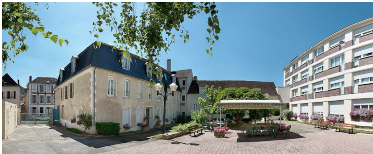
Vue d'ensemble depuis la cour.

89, Saint-Florentin, 31 avenue Général Leclerc