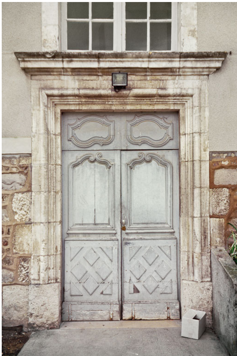
Bâtiment de plan rectangulaire qui abrite au rez-de-chaussée le réfectoire de l'ancien monastère : détail des portes à deux vantaux du 18 e siècle.