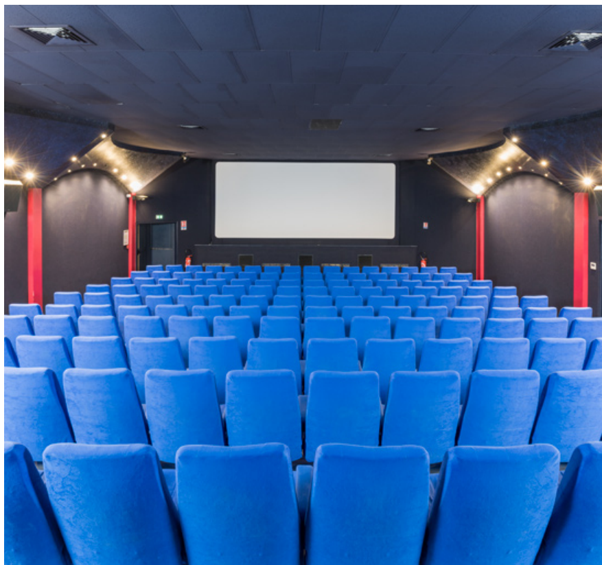
La salle, vue vers l'écran.