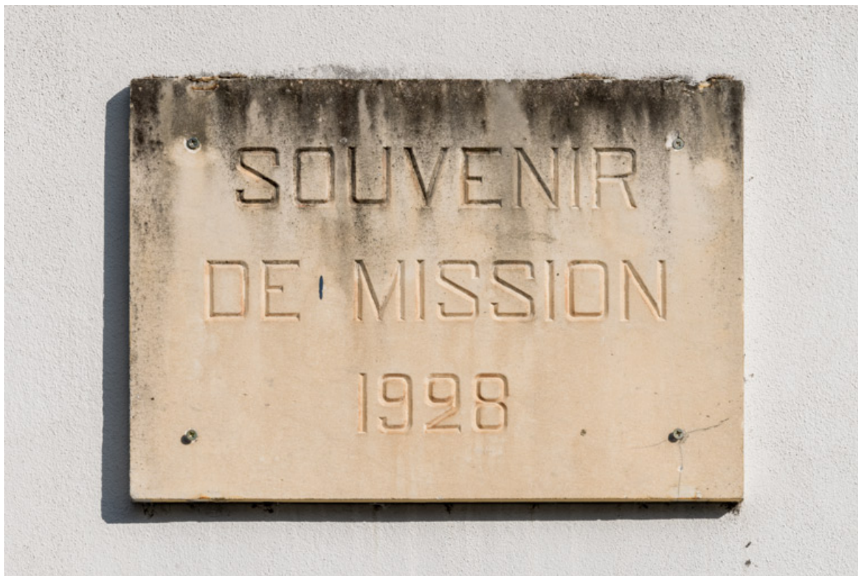
Façade latérale gauche : plaque commémorative de la mission de 1928. 71, La Clayette, 2A rue Faisant