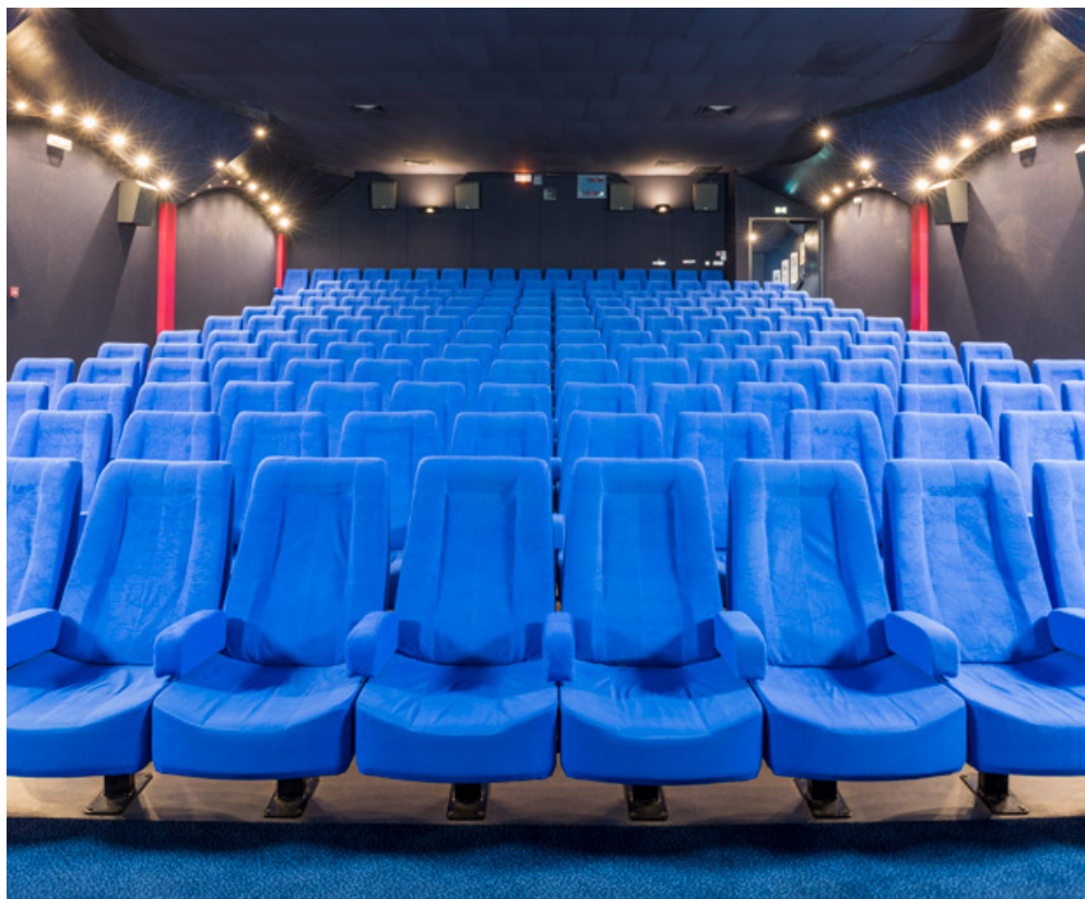
La salle, vue depuis l'écran.