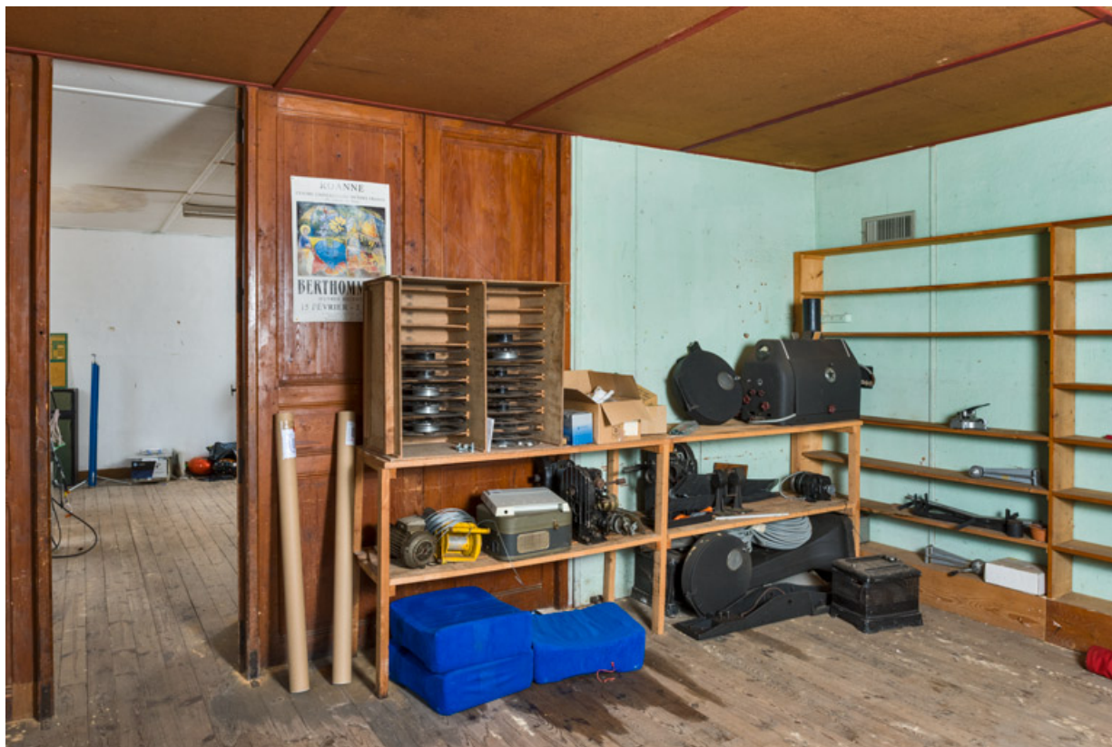
Ancienne salle de catéchisme : première pièce. En noir, les éléments du deuxième projecteur Etoile. 71, La Clayette, 2A rue Faisant