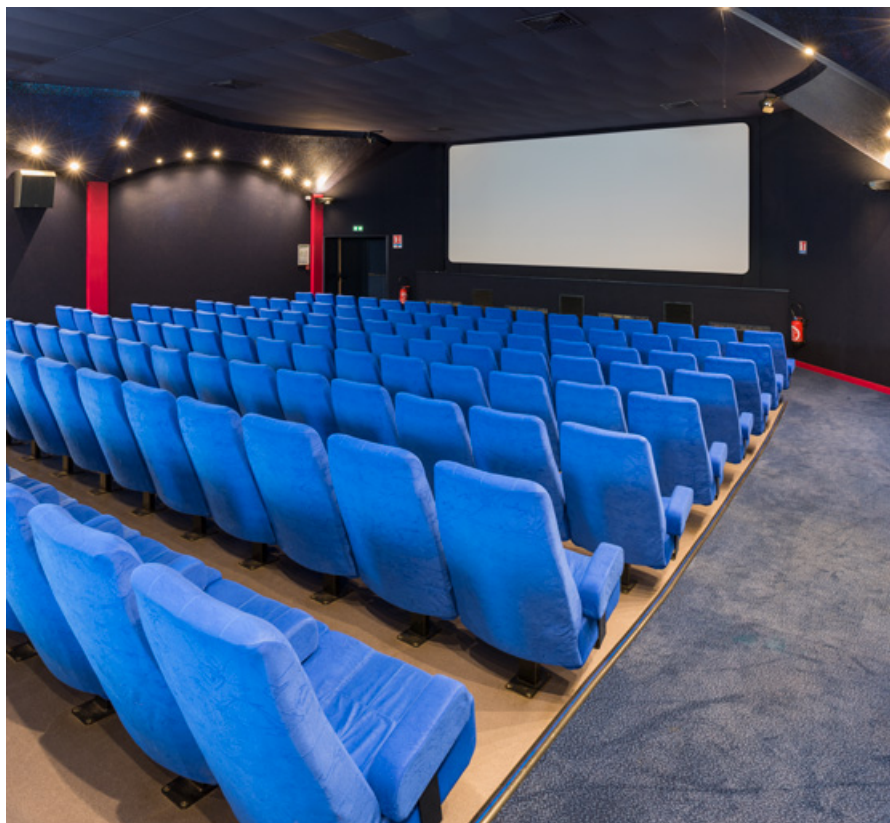
La salle, vue vers l'écran, de trois quarts.