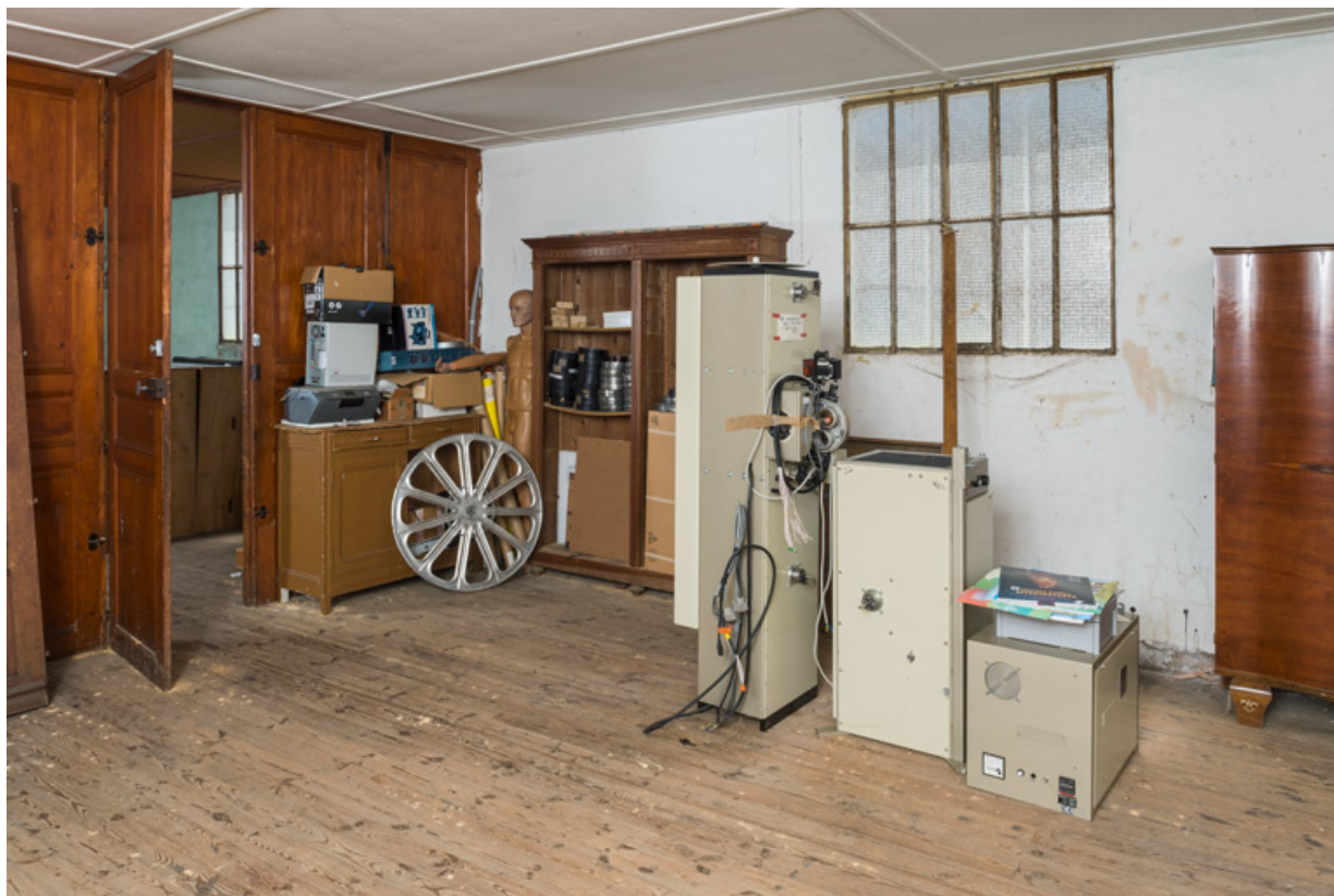
Ancienne salle de catéchisme : deuxième pièce. Modules du projecteur Kinoton. 71, La Clayette, 2A rue Faisant