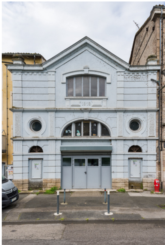
Façade postérieure, quai de Verdun.