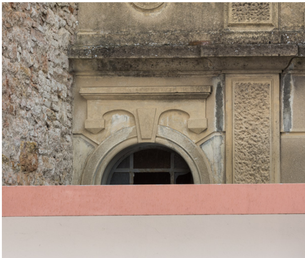
Façade antérieure : décor surmontant une fenêtre.