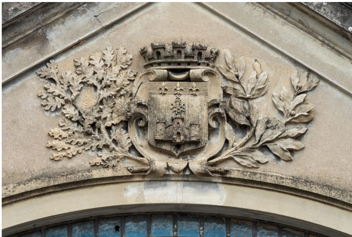
Façade antérieure : armoiries de la ville de Tournus.