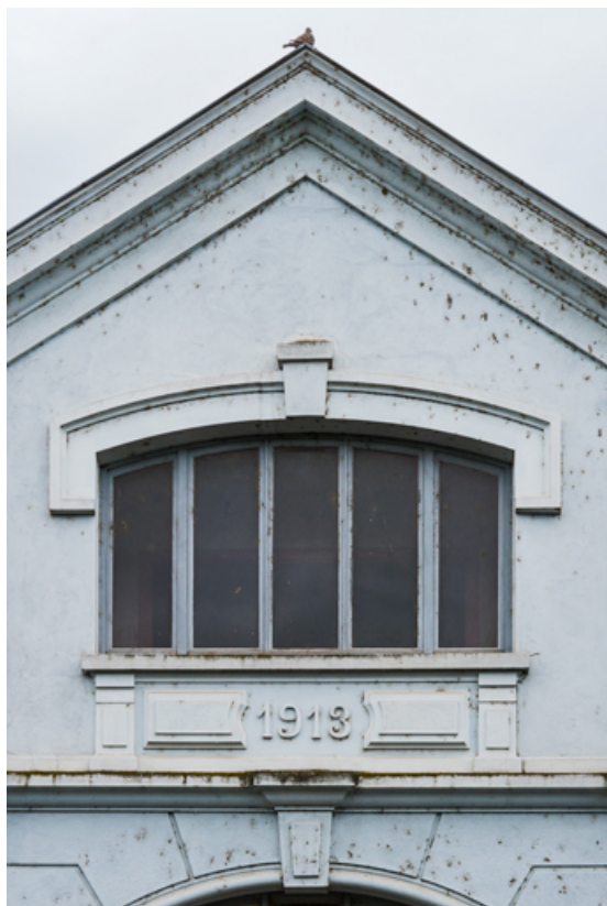
Façade postérieure: date portée 1913.