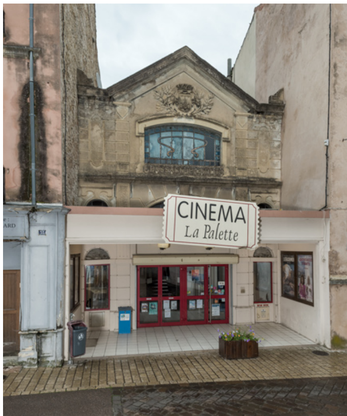
Façade antérieure, rue de la République.