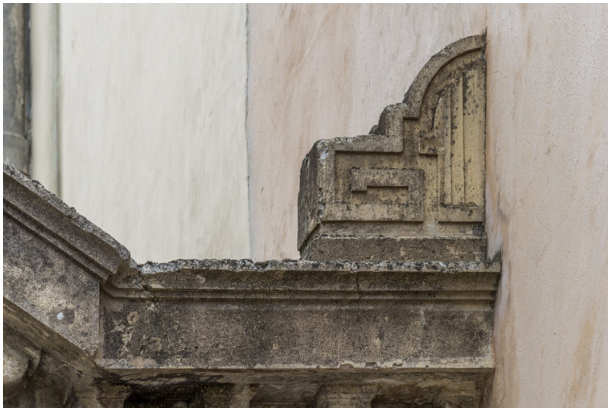
Façade antérieure : décor en partie supérieure.