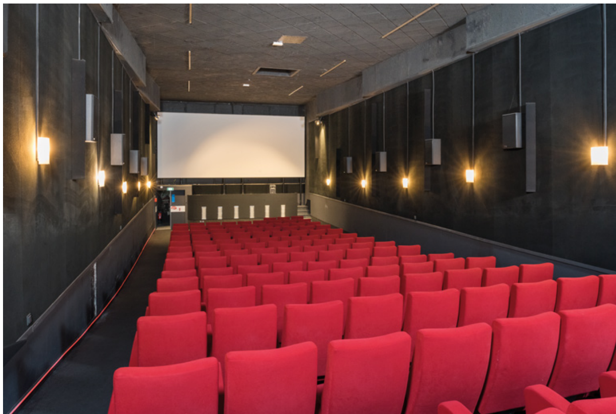
Salle, vue vers l'écran, depuis l'entrée.