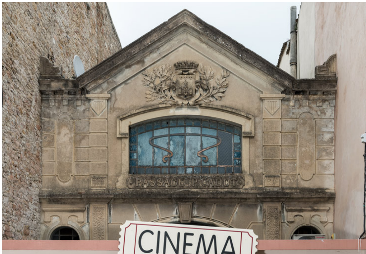
Façade antérieure : partie supérieure.