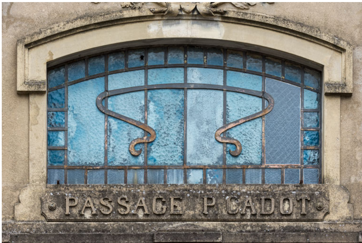
Façade antérieure : inscription et ferronnerie de la fenêtre centrale.