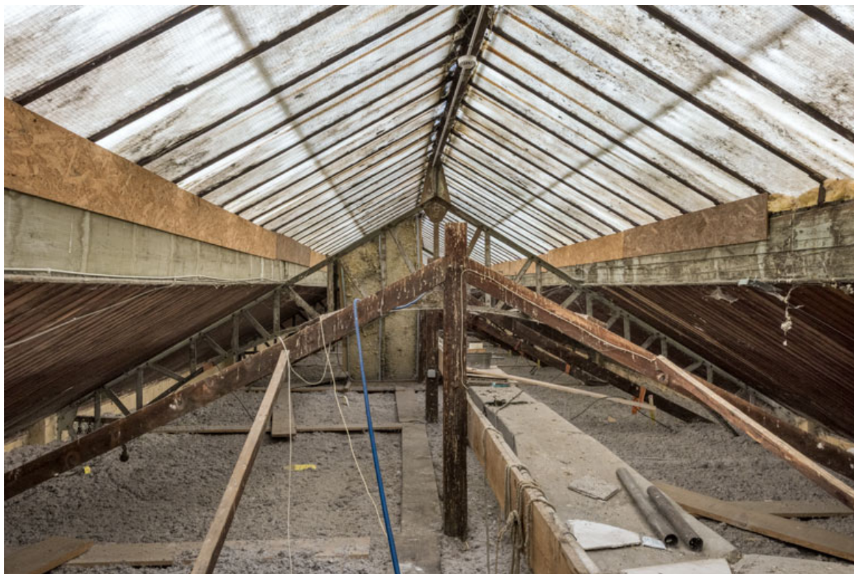
Charpente métallique et verrière, depuis le côté du quai.