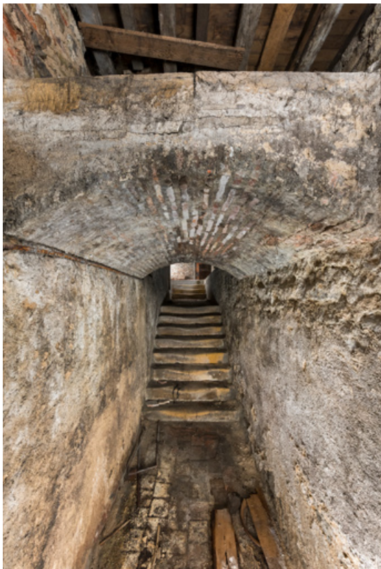
Couloir et escalier sous la salle.