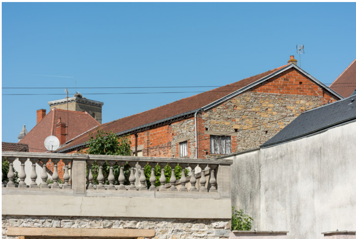
Façades postérieure et latérale droite, depuis le quai de la Loire au sud-ouest. 71, Digoin, 24 rue Nationale