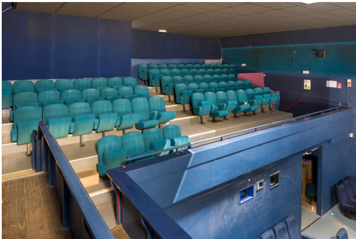
Le balcon, depuis la galerie.