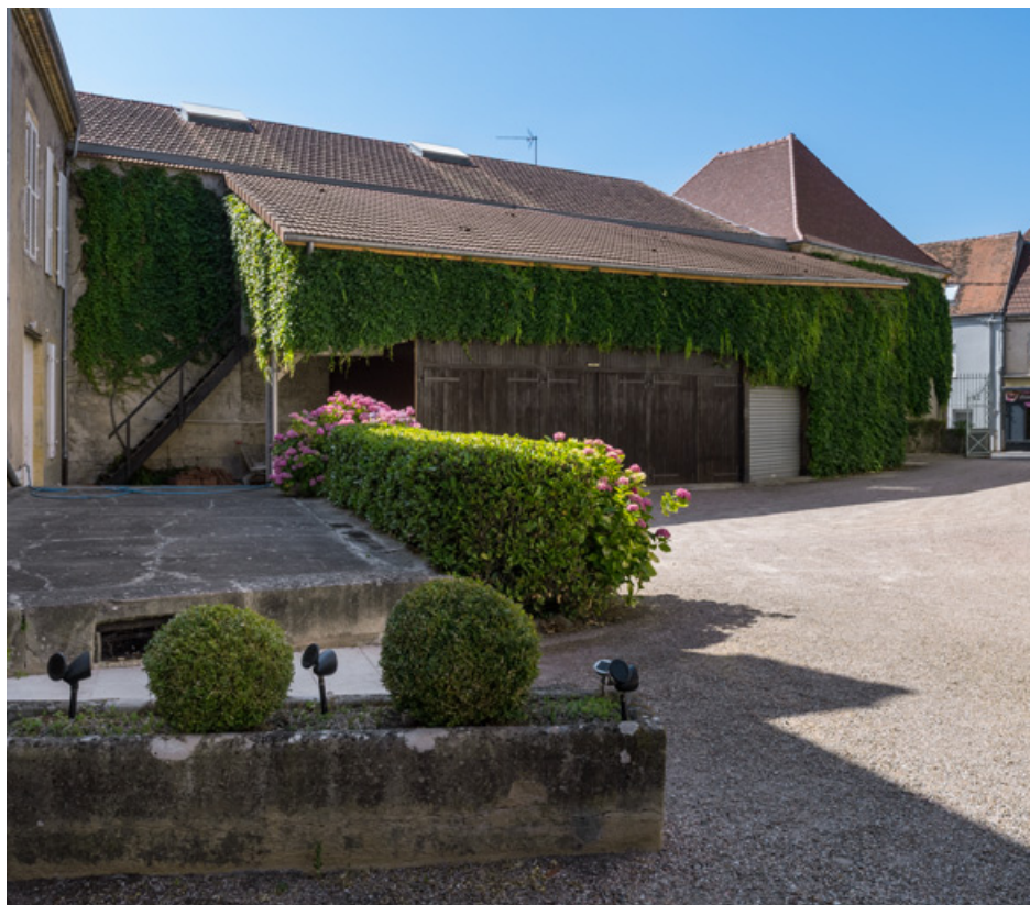
Façade latérale gauche, depuis une cour à l'est. 71, Digoin, 24 rue Nationale