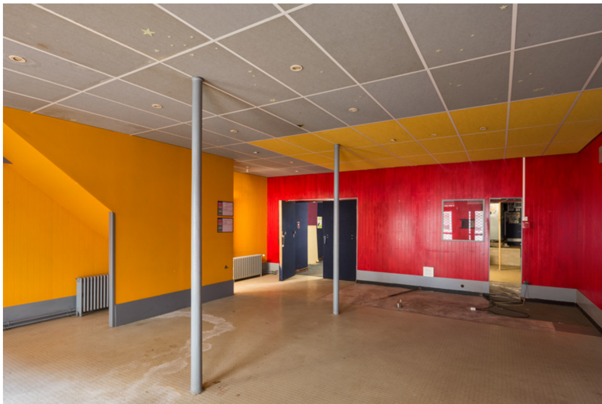
Vestibule. De gauche à droite, escalier desservant le logement à l'étage, accès à la salle et guichet en avant de la cabine de projection.