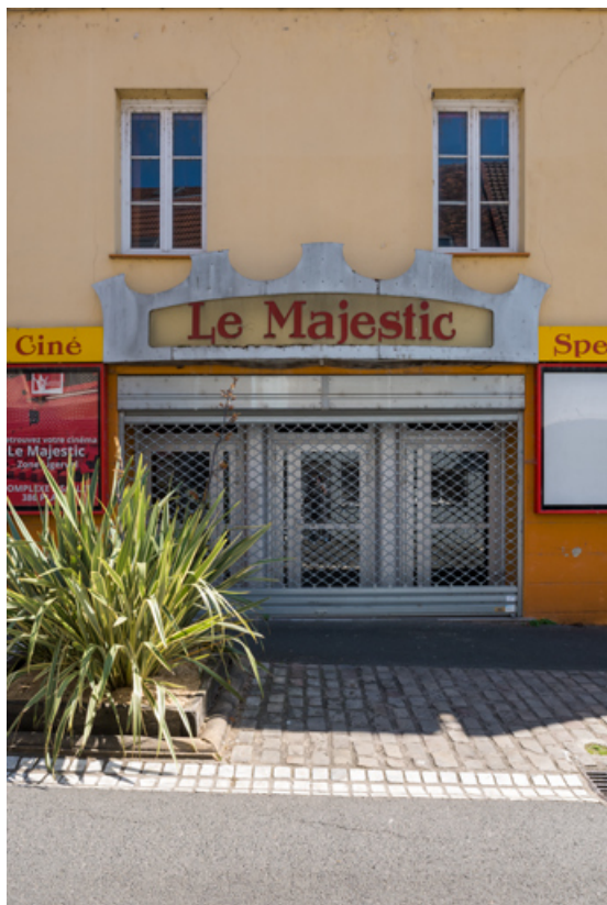
Façade antérieure : entrée et enseigne (cadrage vertical). 71, Digoin, 24 rue Nationale