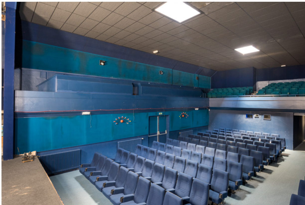
La salle, depuis la scène côté jardin. La galerie est en face, le balcon à droite. 71, Digoin, 24 rue Nationale