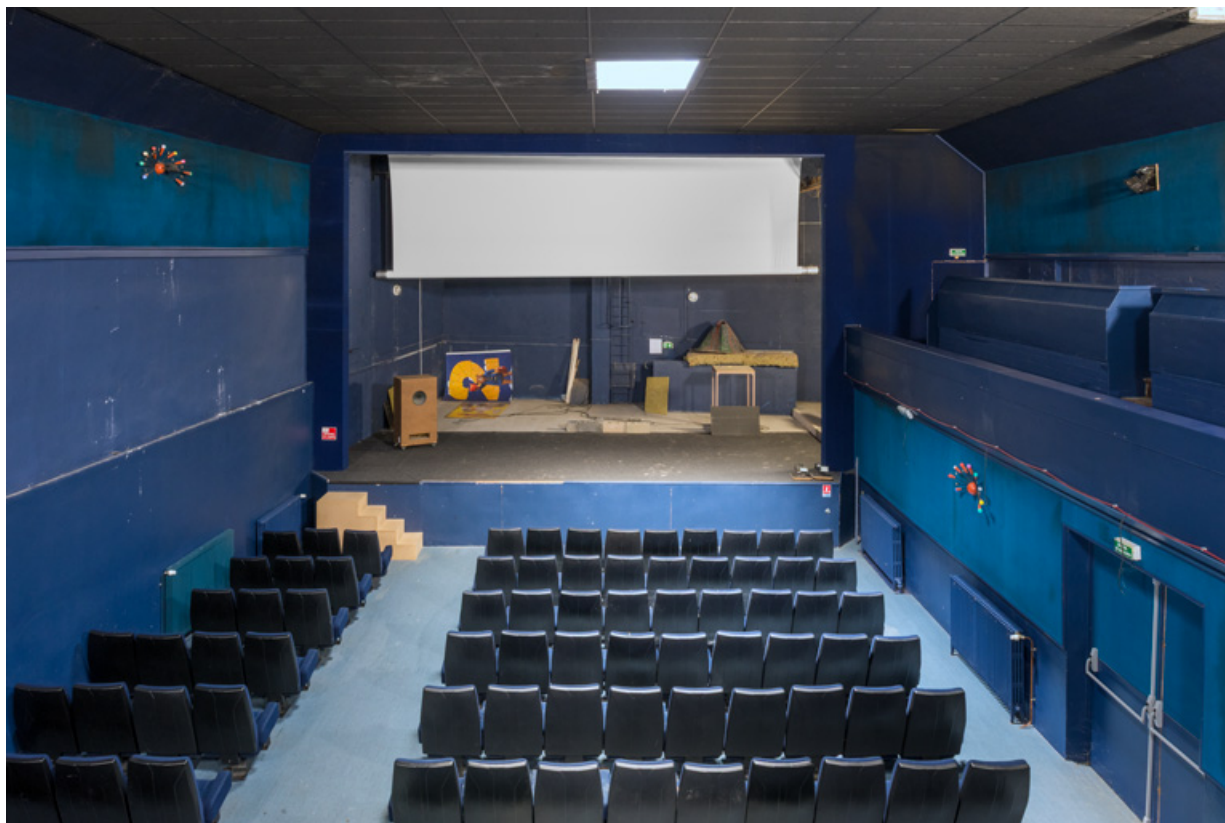
La salle depuis le balcon. La galerie est à droite.