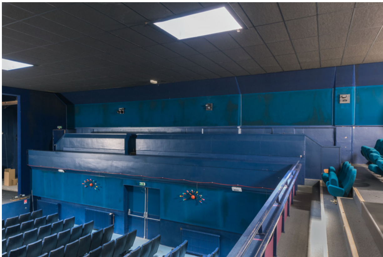
La galerie, depuis le balcon.