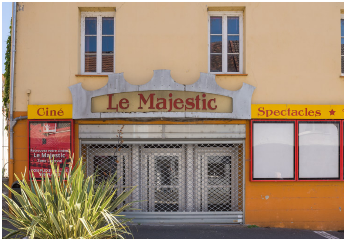
Façade antérieure : entrée et enseigne (cadrage horizontal). 71, Digoin, 24 rue Nationale