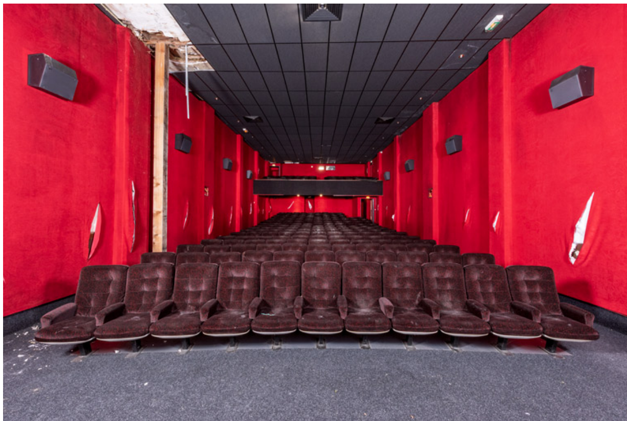
Salle 1, vue depuis l'écran.