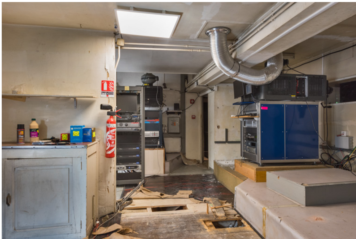
Cabine de projection des salles 1 (à droite) et 2 (au fond). 71, Louhans, 13 rue des Dodanes