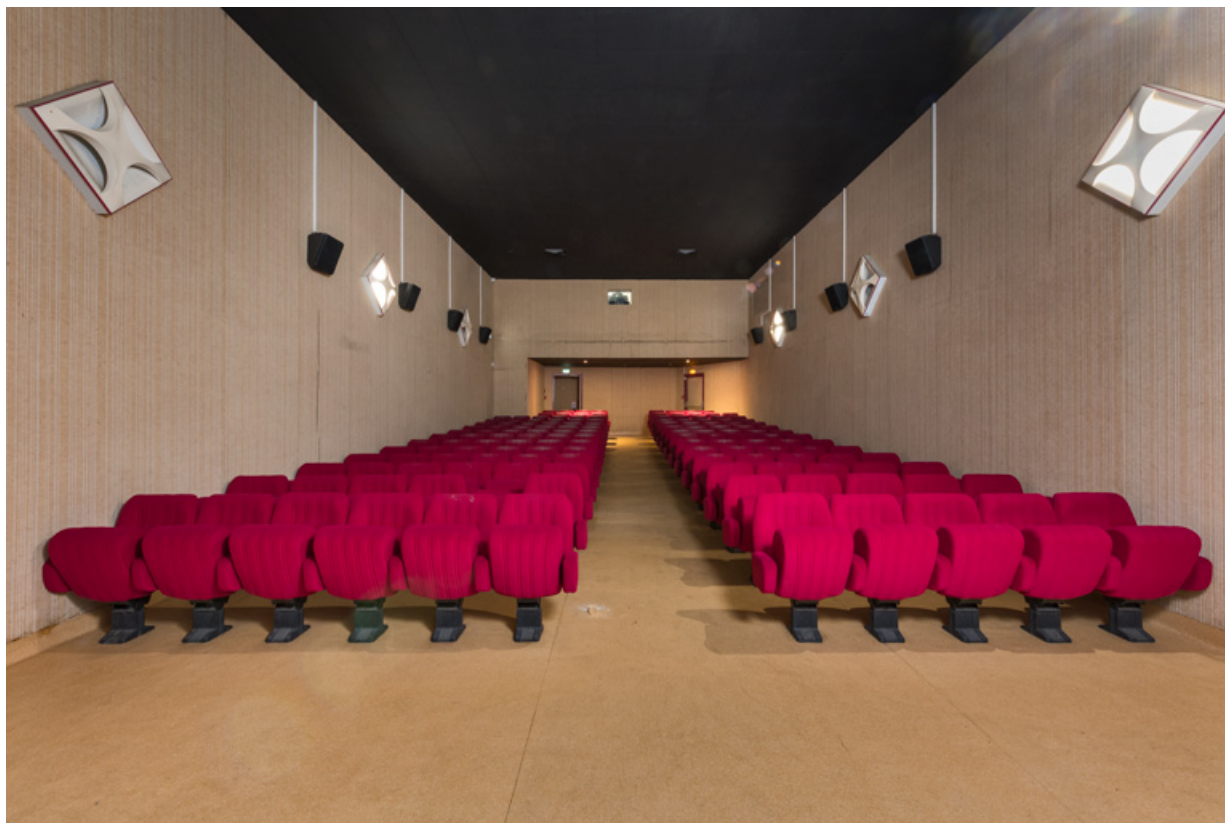
Salle 3, vue depuis l'écran.