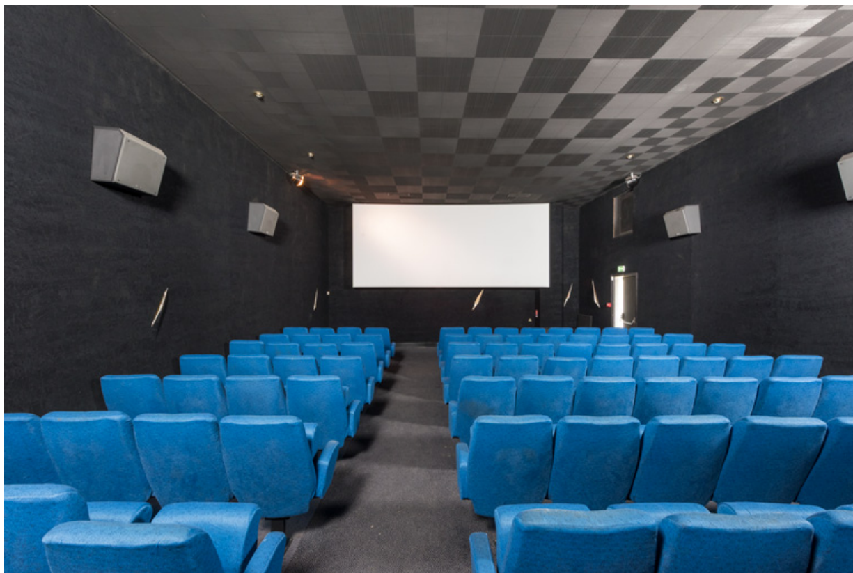
Salle 3, vue vers l'écran.