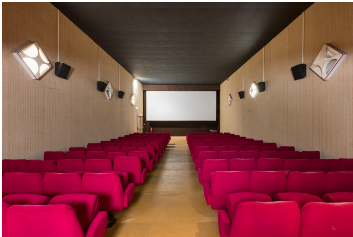
Salle 3, vue vers l'écran.