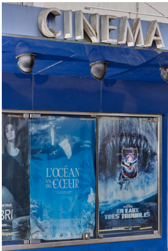
Façade antérieure : enseigne et tableau d'affichage. 71, Louhans, 13 rue des Dodanes