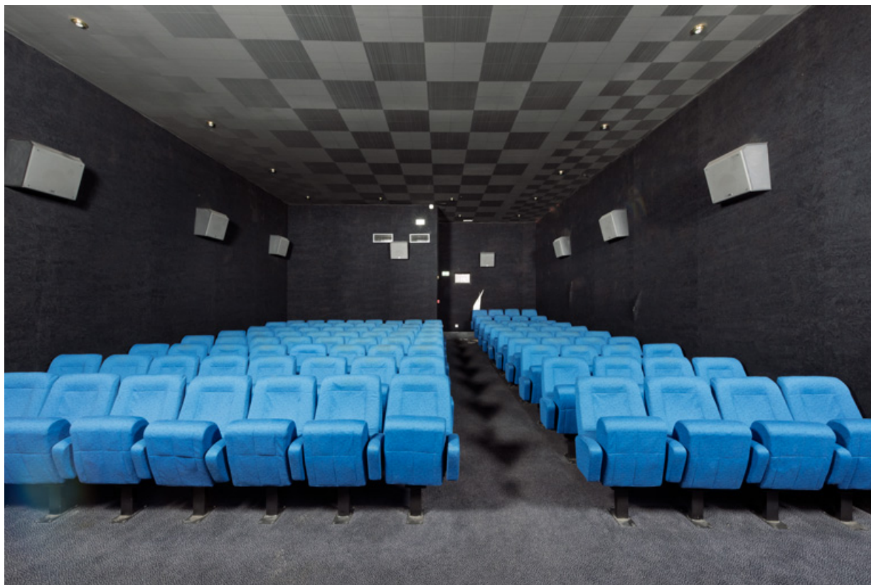
Salle 2, vue depuis l'écran.