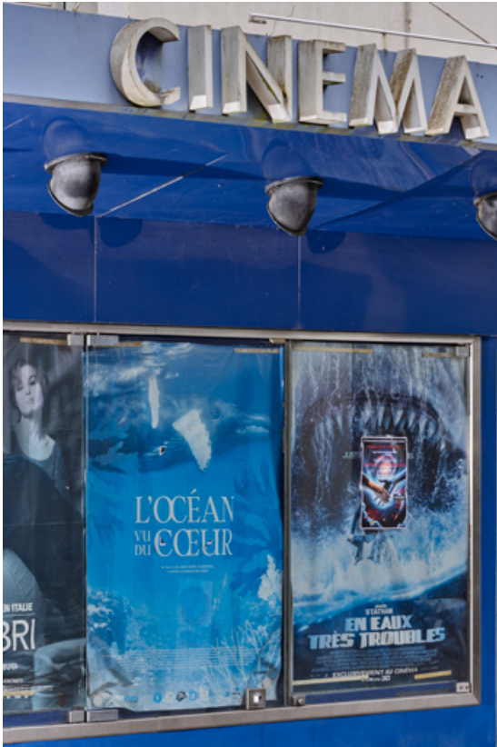
Façade antérieure : enseigne et tableau d'affichage. 71, Louhans, 13 rue des Dodanes