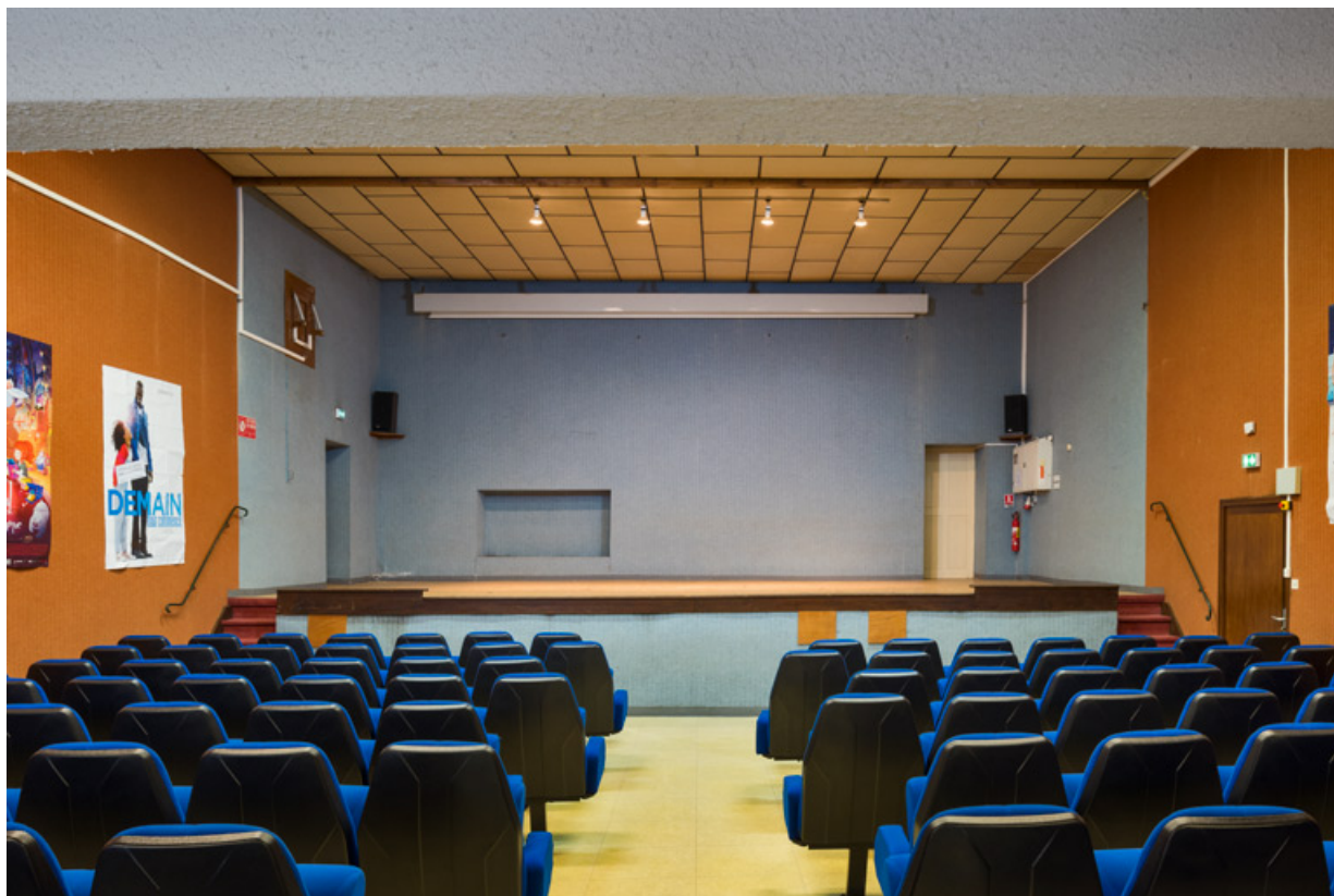
Scène, depuis l'entrée.