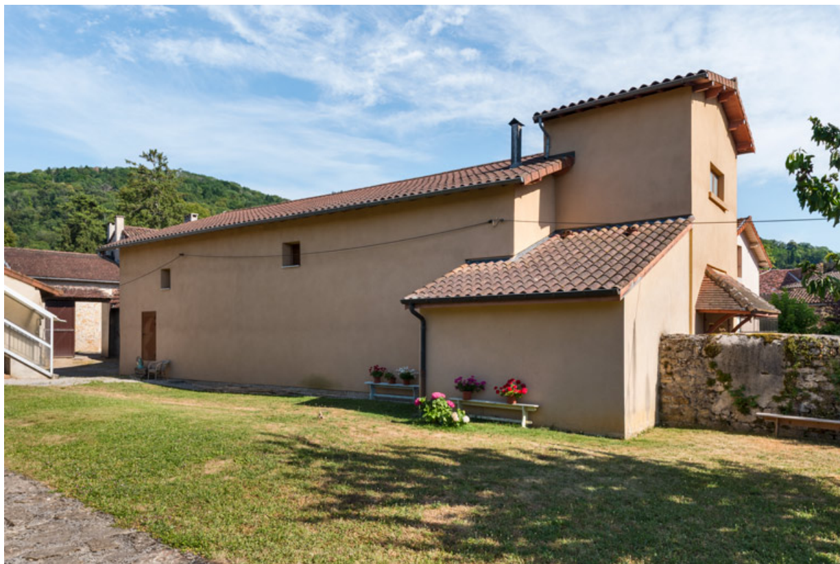
Façade latérale gauche, de trois quarts droite.