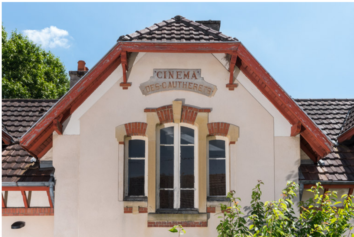
Façade antérieure : mur pignon, avec inscription. 71, Saint-Vallier rue Corneille, lieudit : les Gautherets