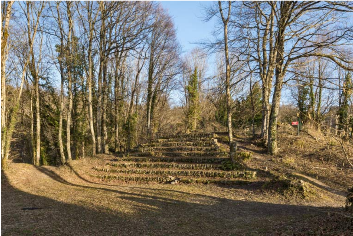
Les gradins, depuis la scène.