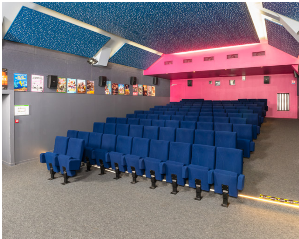
Salle, de trois quarts, depuis l'entrée.