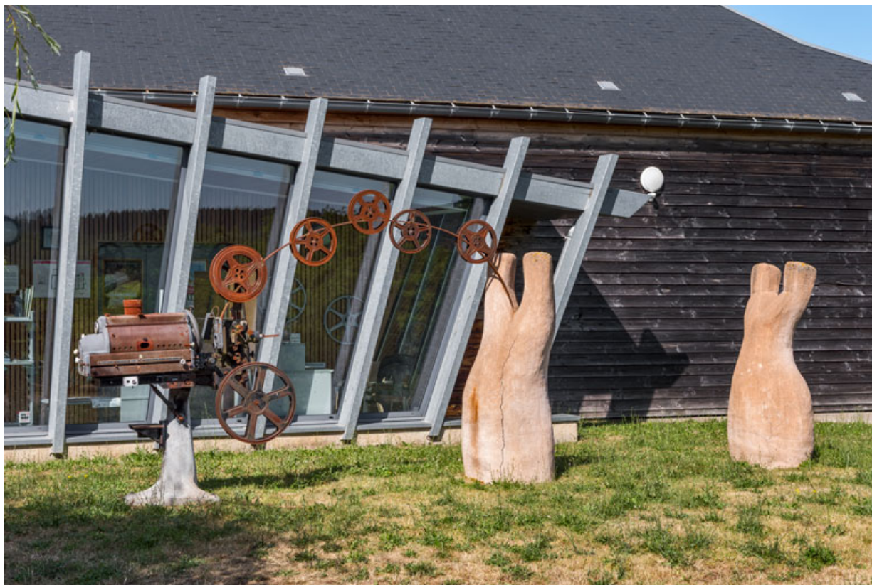
Ancien projecteur placé à l'extérieur, devant la façade antérieure.