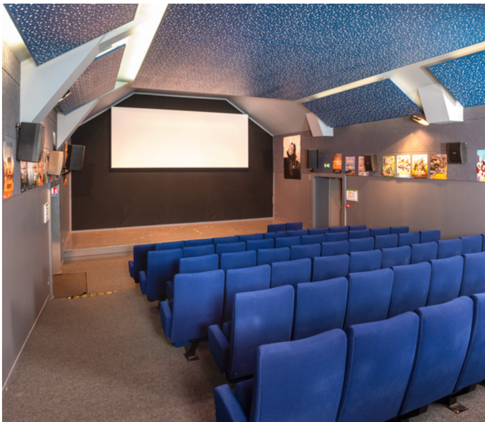
Salle, vue vers l'écran, de trois quarts.