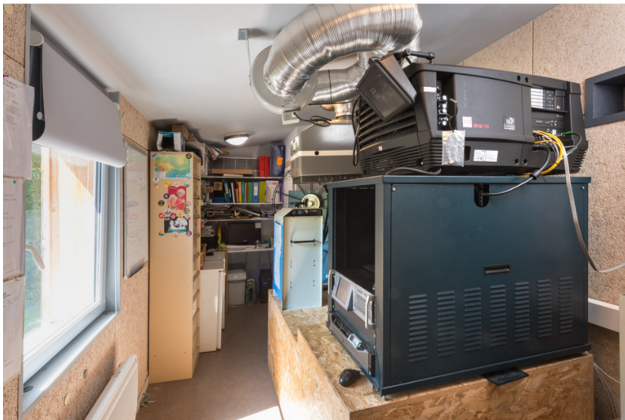
Cabine de projection. Au premier plan le projecteur numérique Barco DP2K-12C. 71, Anost, 4 place de la Bascule