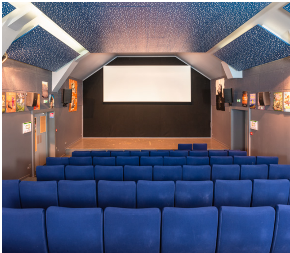
Salle, vue vers l'écran.