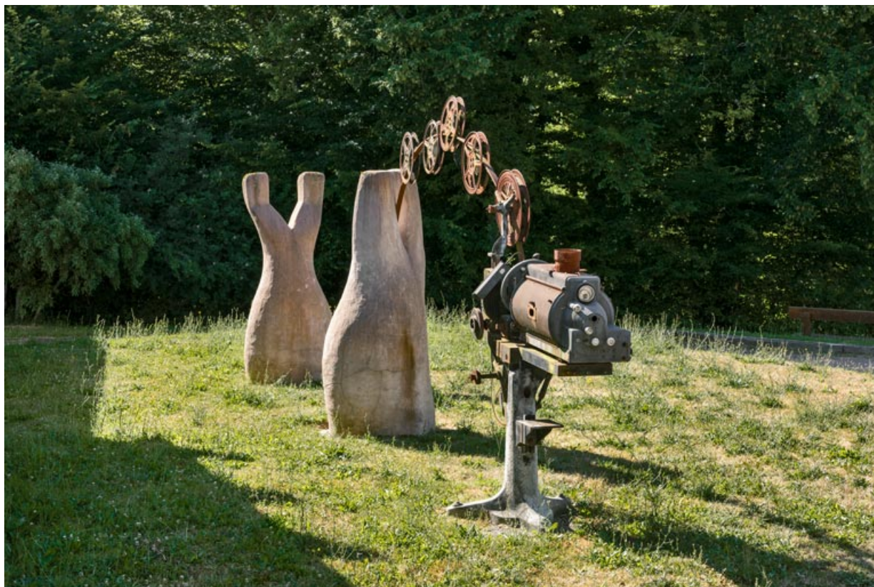
Ancien projecteur placé à l'extérieur, devant la façade antérieure.