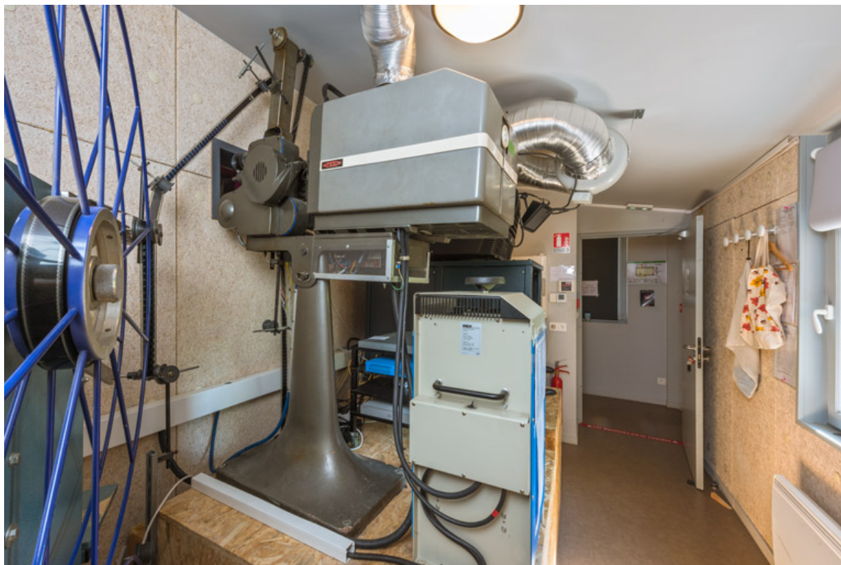
Cabine de projection. Au centre le projecteur argentique Fedi XV T et son redresseur Irem. 71, Anost, 4 place de la Bascule