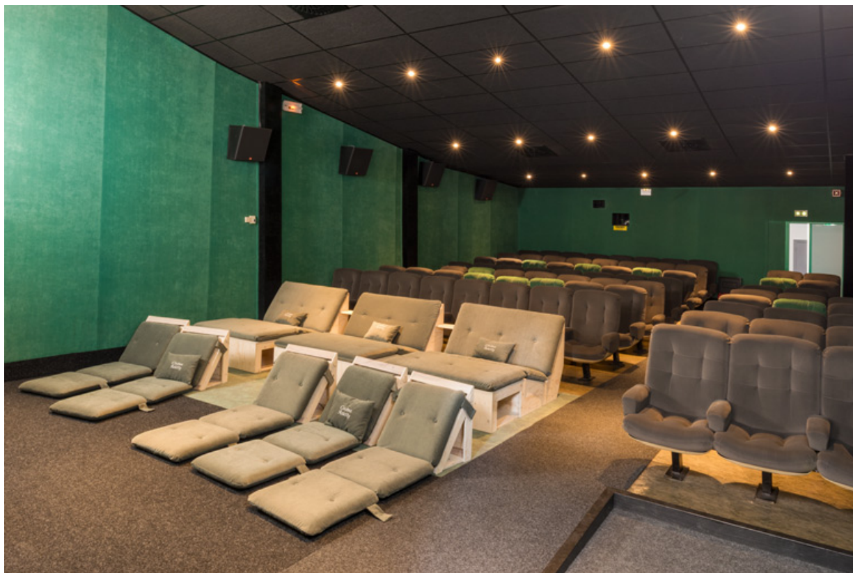
Salle 2 : vue depuis l'écran, de trois quarts.