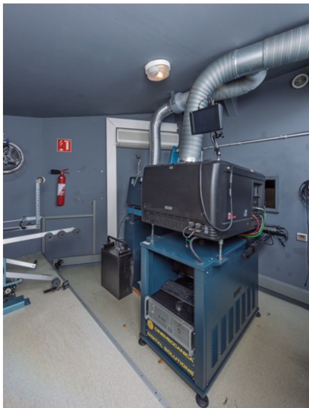
Cabine de la salle 1. Projecteurs numérique Barco (à droite) et argentique Cinemeccanica. 71, Autun, 3-5 rue Pernette