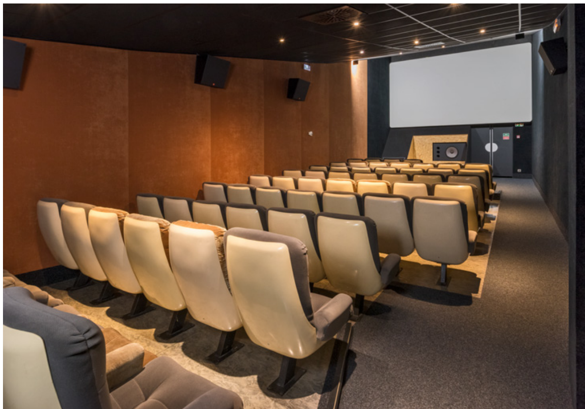
Salle 3 : vue vers l'écran.