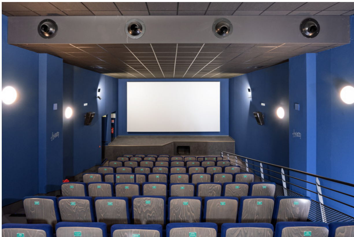
Salle 4 : vue vers l'écran.