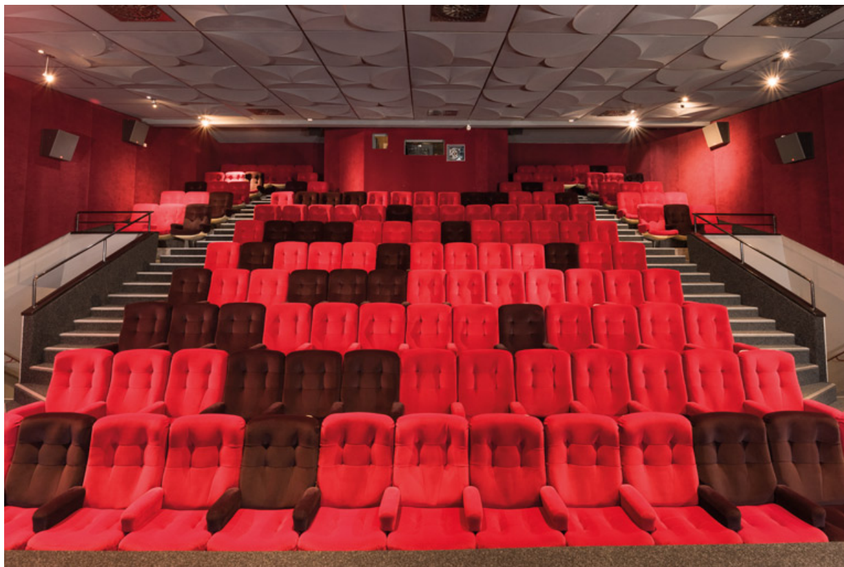
Salle 1 : vue depuis l'écran, de face.