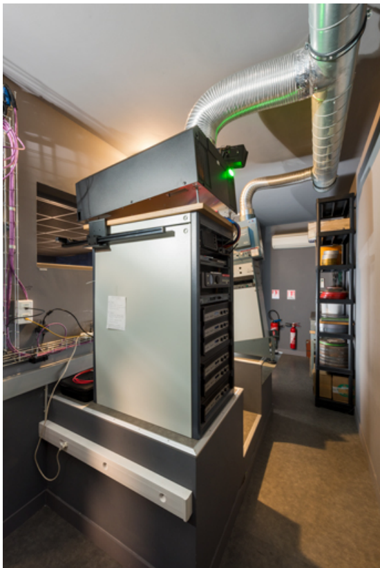
Cabine de la salle 4. Projecteurs numérique Barco (à gauche) et argentique Hortson. 71, Autun, 3-5 rue Pernette