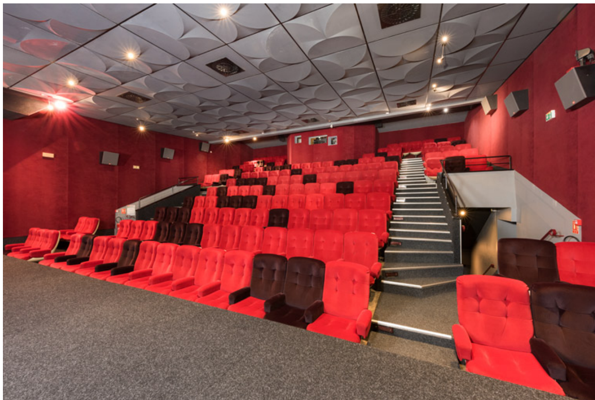
Salle 1 : vue depuis l'écran, de trois quarts. 71, Autun, 3-5 rue Pernette