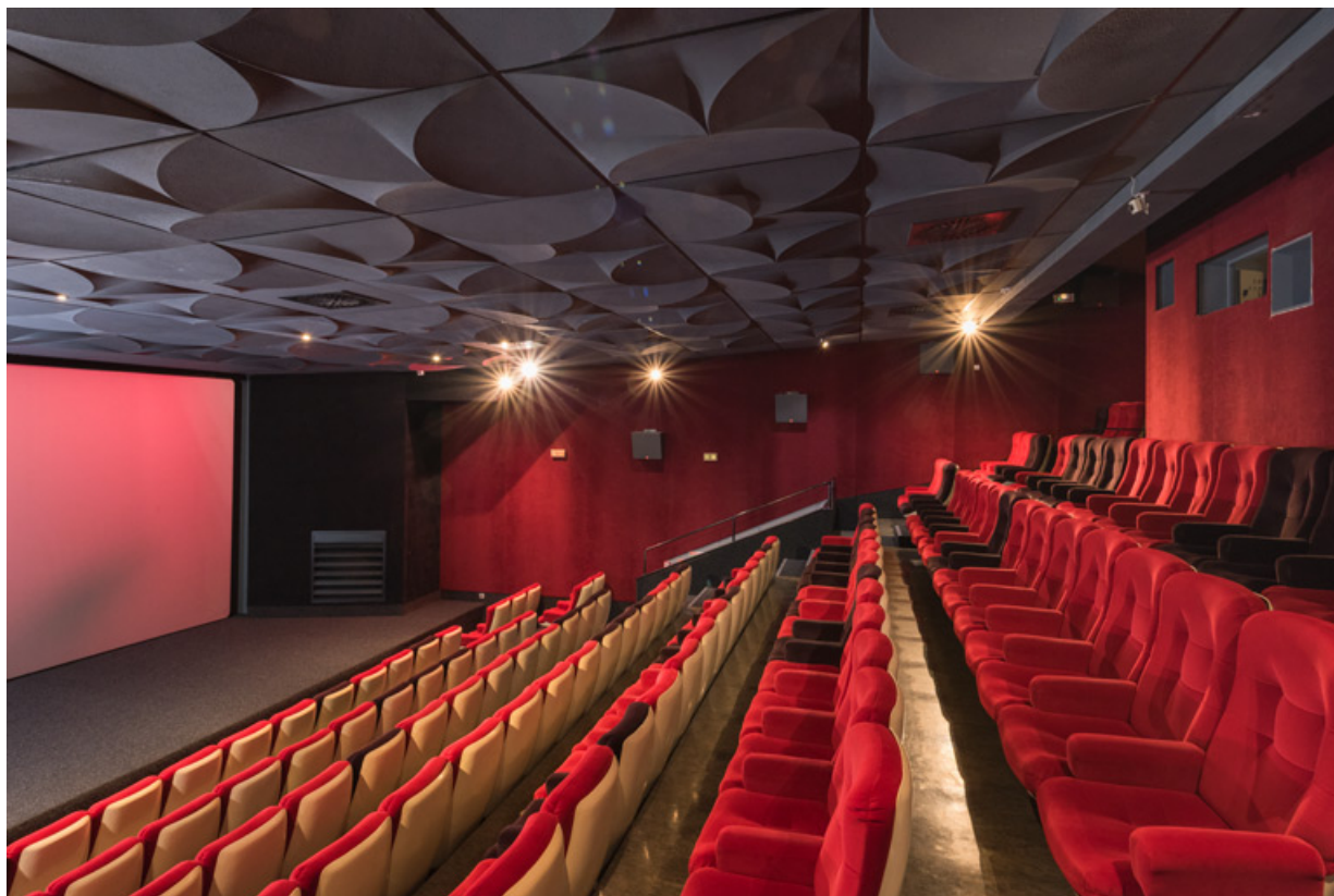
Salle 1 : vue de profil.