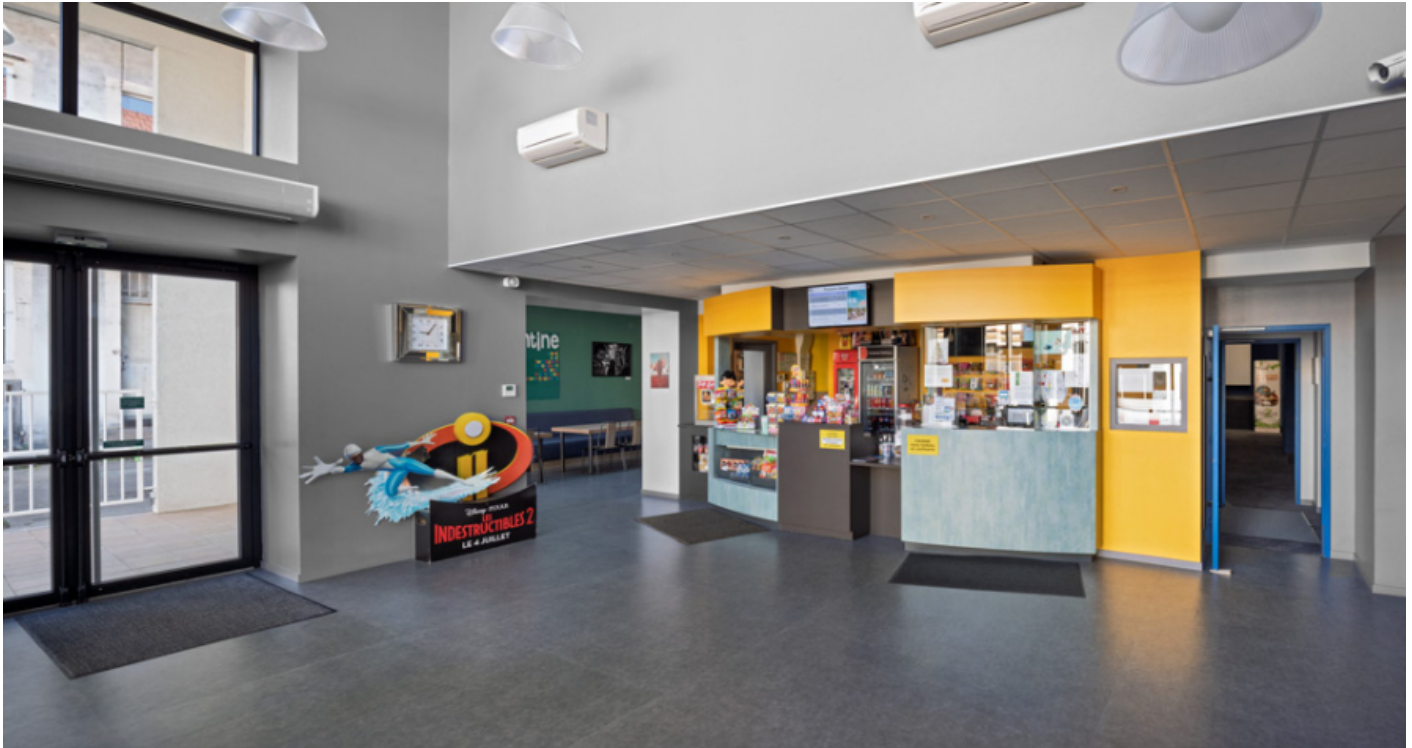
Le vestibule. L'accueil est séparé par l'entrée de la salle 4 du bâtiment d'origine, à droite. 71, Autun, 3-5 rue Pernette