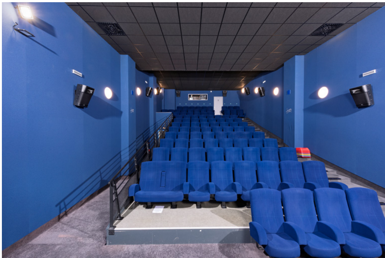
Salle 4 : vue depuis l'écran.