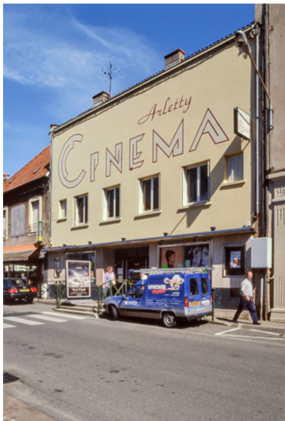
Façade antérieure de trois quarts droite, en 2001. 71, Autun, 3-5 rue Pernelle