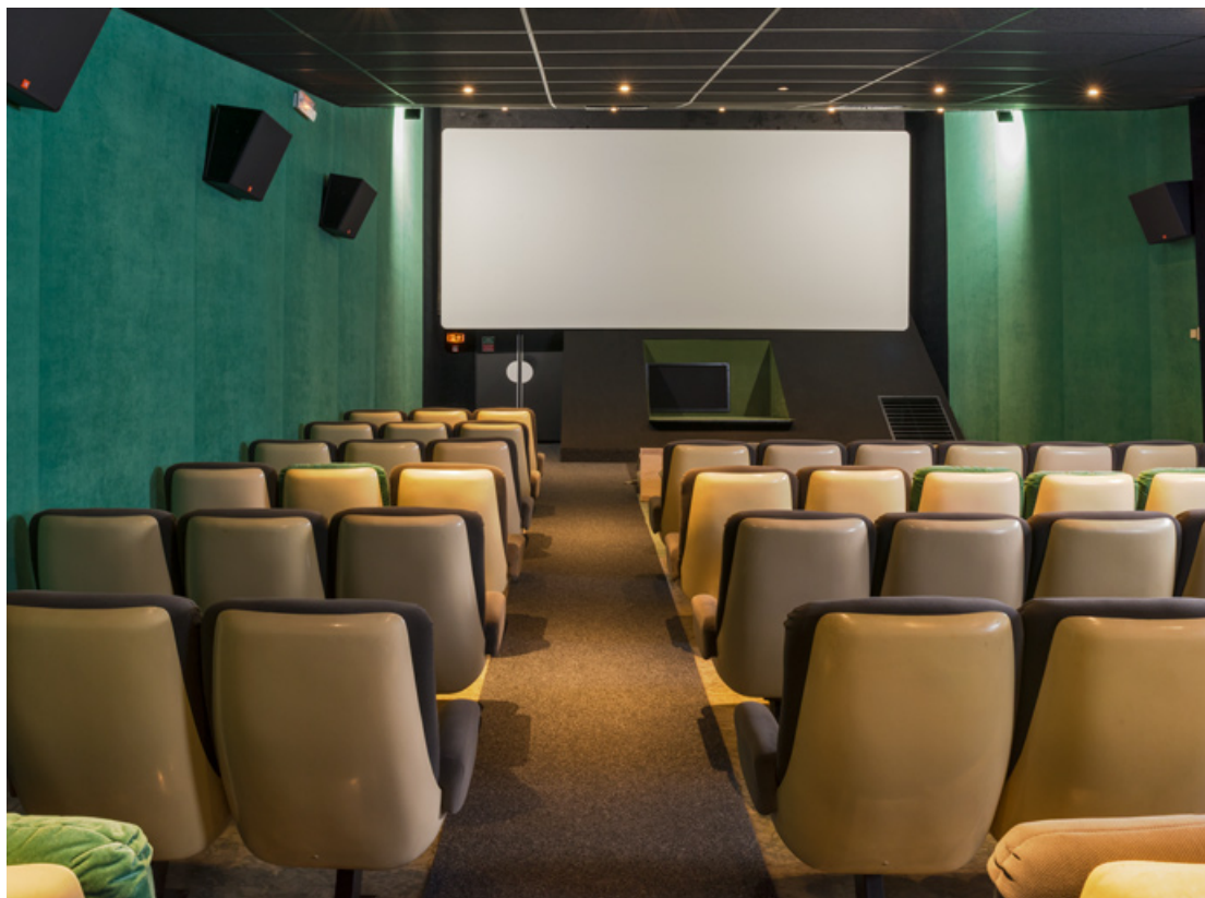
Salle 2 : vue vers l'écran.