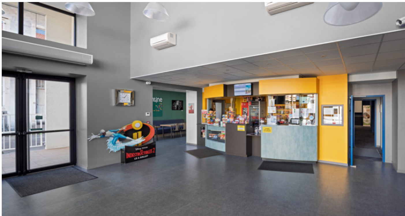
Le vestibule. L'accueil est séparé par l'entrée de la salle 4 du bâtiment d'origine, à droite. 71, Autun, 3-5 rue Pernelle