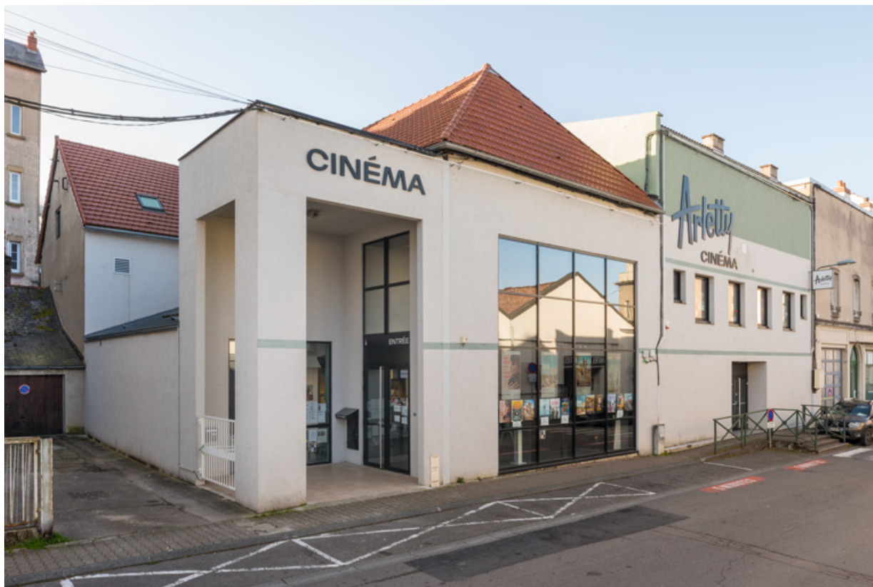
Vue d'ensemble, de trois quarts gauche. 71, Autun, 3-5 rue Pernette