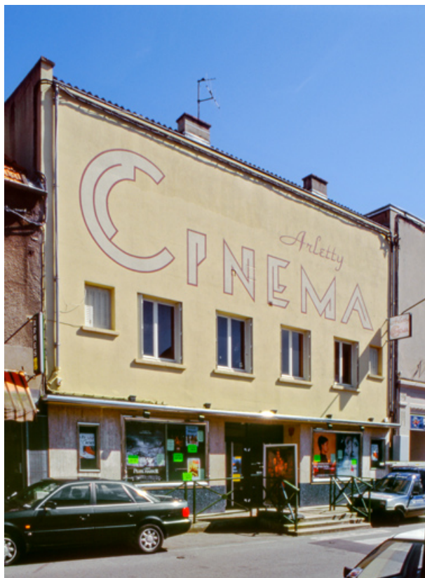
Façade antérieure de trois quarts gauche, en 2001.