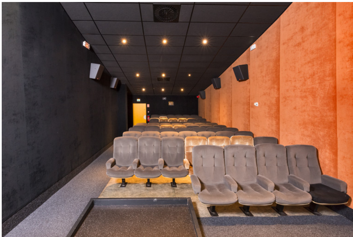
Salle 3 : vue depuis l'écran.