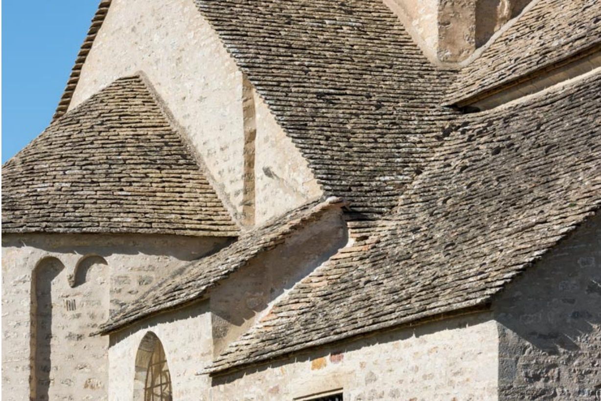
Couverture du chevet, détail.

71, Laives, lieudit : Montagne de Saint-Martin