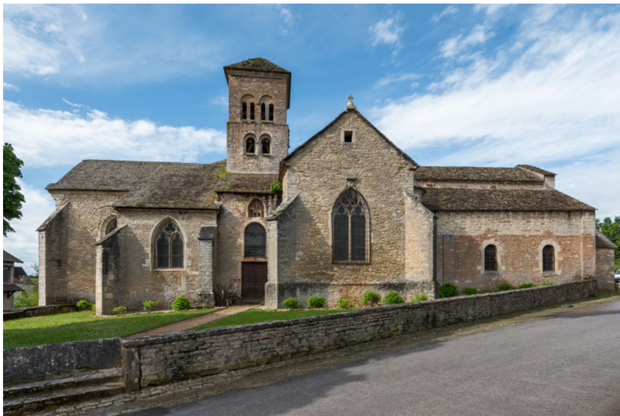
Flanc nord (vue depuis le nord).

71, Sennecey-le-Grand rue de l' Église Saint-Julien