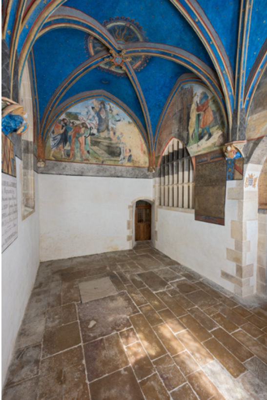
Chapelle de Lugny (vue intérieure en direction du nord-ouest).

71, Sennecey-le-Grand rue de l' Église Saint-Julien