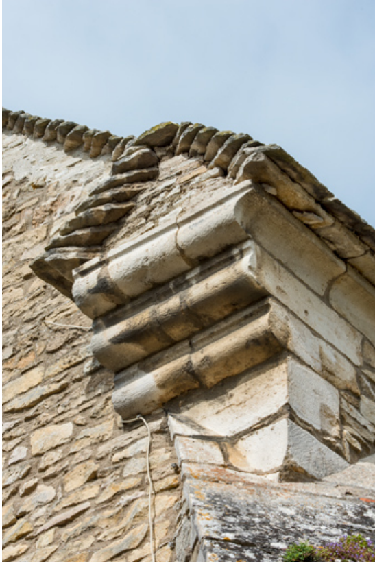
Chevet, détail : console à trois assises en ressaut.

71, Sennecey-le-Grand rue de l' Église Saint-Julien