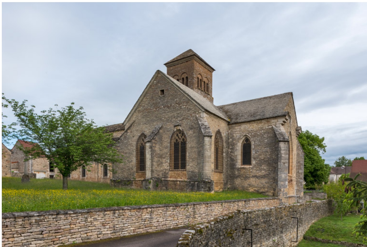
Flanc sud, avec la chapelle de Lugny et le chœur (vue depuis le sud).

71, Sennecey-le-Grand rue de l' Église Saint-Julien