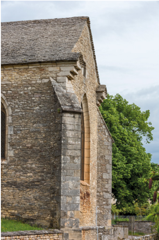
Chevet (vue depuis le sud).

71, Sennecey-le-Grand rue de l' Église Saint-Julien