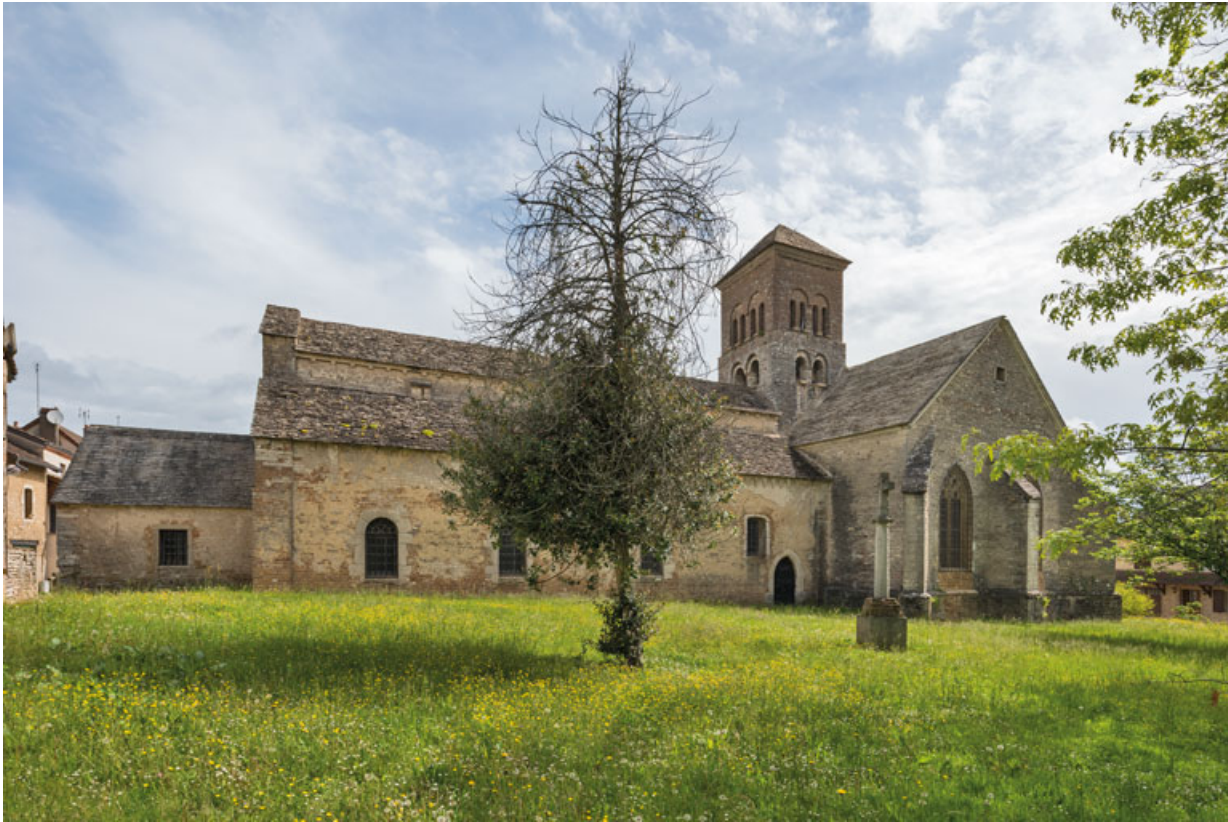
Flanc sud, avec la nef (vue depuis le sud-ouest).

71, Sennecey-le-Grand rue de l' Église Saint-Julien