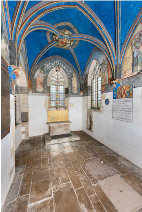
Chapelle de Lugny (vue intérieure en direction du sud-est). 71, Sennecey-le-Grand rue de l' Église Saint-Julien