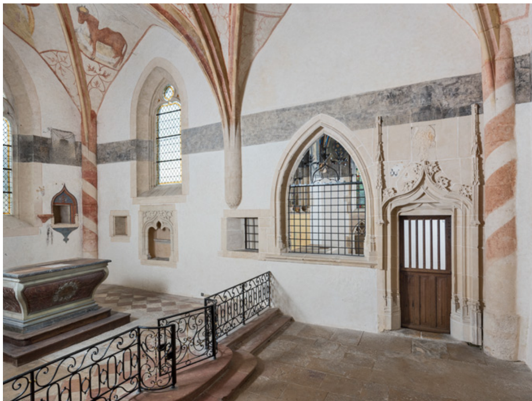
Chœur avec le maître-autel et la chapelle de Lugny (vue en direction du sud, porte fermée). 71, Sennecey-le-Grand rue de l' Église Saint-Julien