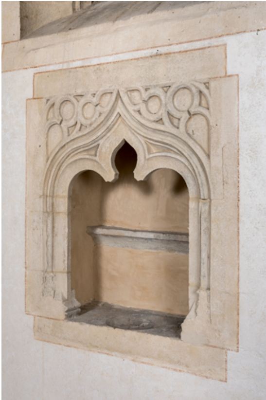
Lavabo dans le chœur.

71, Sennecey-le-Grand rue de l' Église Saint-Julien