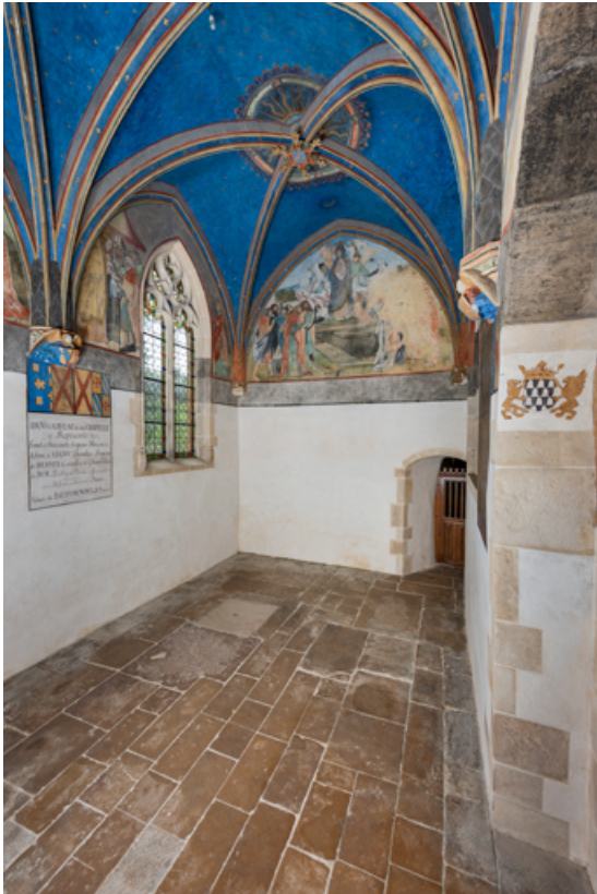
Chapelle de Lugny (vue intérieure en direction de l'ouest). 71, Sennecey-le-Grand rue de l' Église Saint-Julien