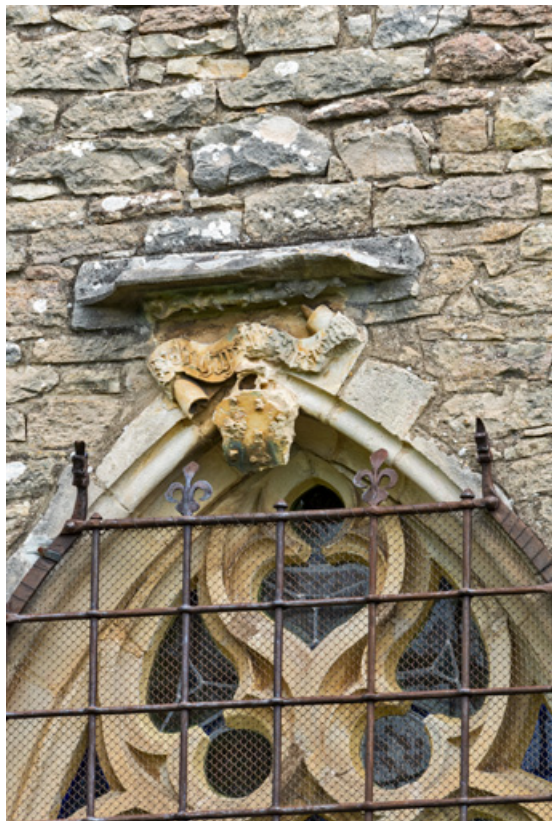
Baie de la chapelle de Lugny, détail de l'encadrement sculpté : écu aux armes de la famille de Lugny surmonté d'un phylactère (inscription non lue).

71, Sennecey-le-Grand rue de l' Église Saint-Julien