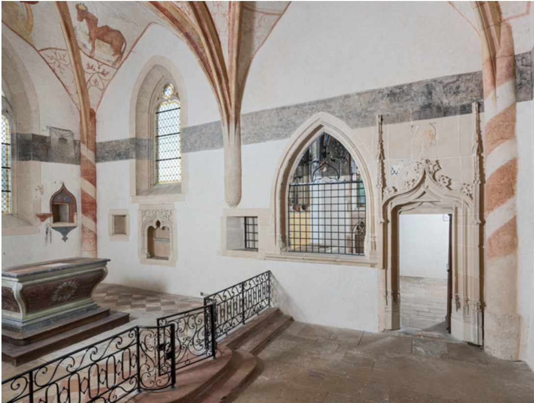
Chœur avec le maître-autel et la chapelle de Lugny (vue en direction du sud, porte fermée). 71, Sennecey-le-Grand rue de l' Église Saint-Julien