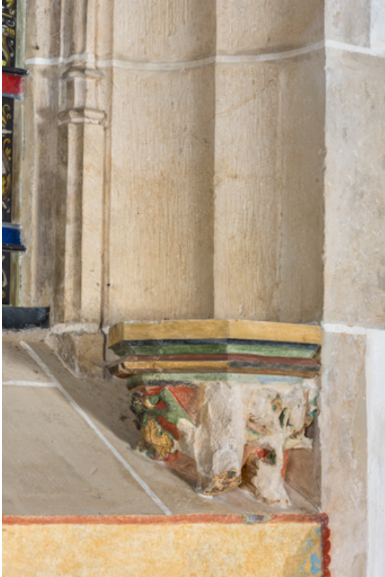
Embrasure de la baie au-dessus de l'autel de la chapelle de Lugny, détail : culot à décor de feuillage.

71, Sennecey-le-Grand rue de l' Église Saint-Julien