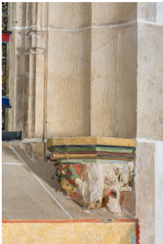
Embrasure de la baie au-dessus de l'autel de la chapelle de Lugny, détail : culot à décor de feuillage. 71, Sennecey-le-Grand rue de l'Église Saint-Julien