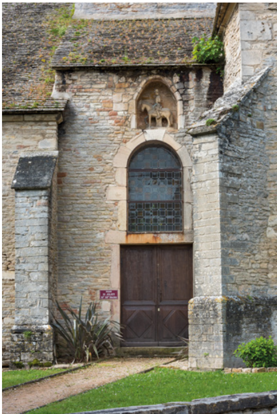
Situation de la statue, dans une niche au-dessus d'une baie (flanc nord).

71, Sennecey-le-Grand rue de l' Église Saint-Julien