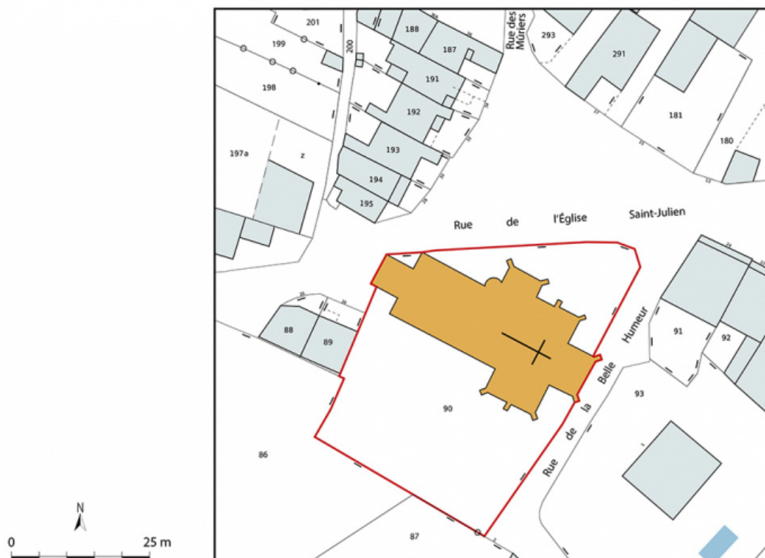
Plan-masse et de situation. Extrait du plan cadastral, 2024. Sennecey-le-Grand, section AE. Échelle 1/500. 71, Sennecey-le-Grand rue de l' Église Saint-Julien