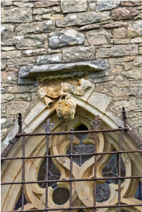
Baie de la chapelle de Lugny, détail de l'encadrement sculpté : écu aux armes de la famille de Lugny surmonté d'un phylactère (inscription non lue).

71, Sennecey-le-Grand rue de l'Église Saint-Julien