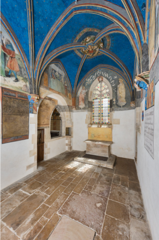
Chapelle de Lugny (vue intérieure en direction de l'est).

71, Sennecey-le-Grand rue de l' Église Saint-Julien