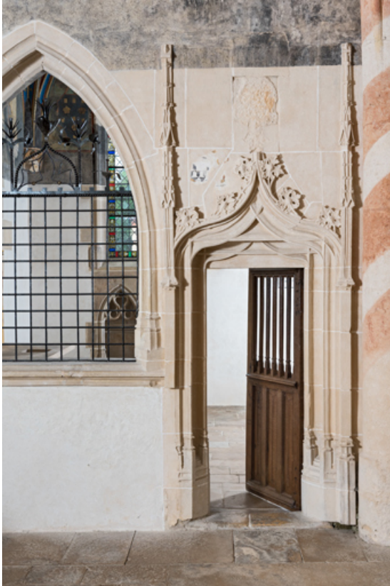
Porte de la chapelle de Lugny.

71, Sennecey-le-Grand rue de l' Église Saint-Julien