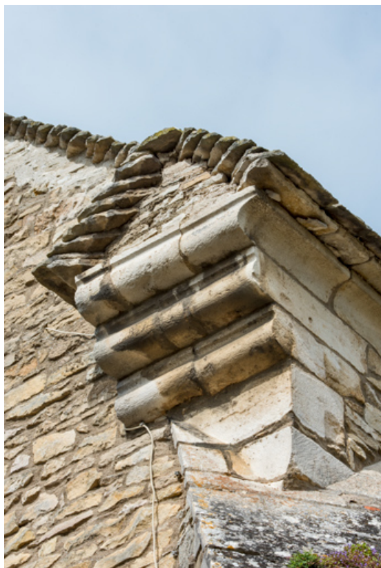
Chevet, détail : console à trois assises en ressaut.

71, Sennecey-le-Grand rue de l' Église Saint-Julien