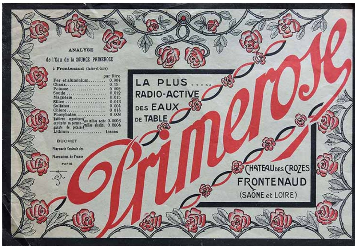
Étiquette de bouteille.