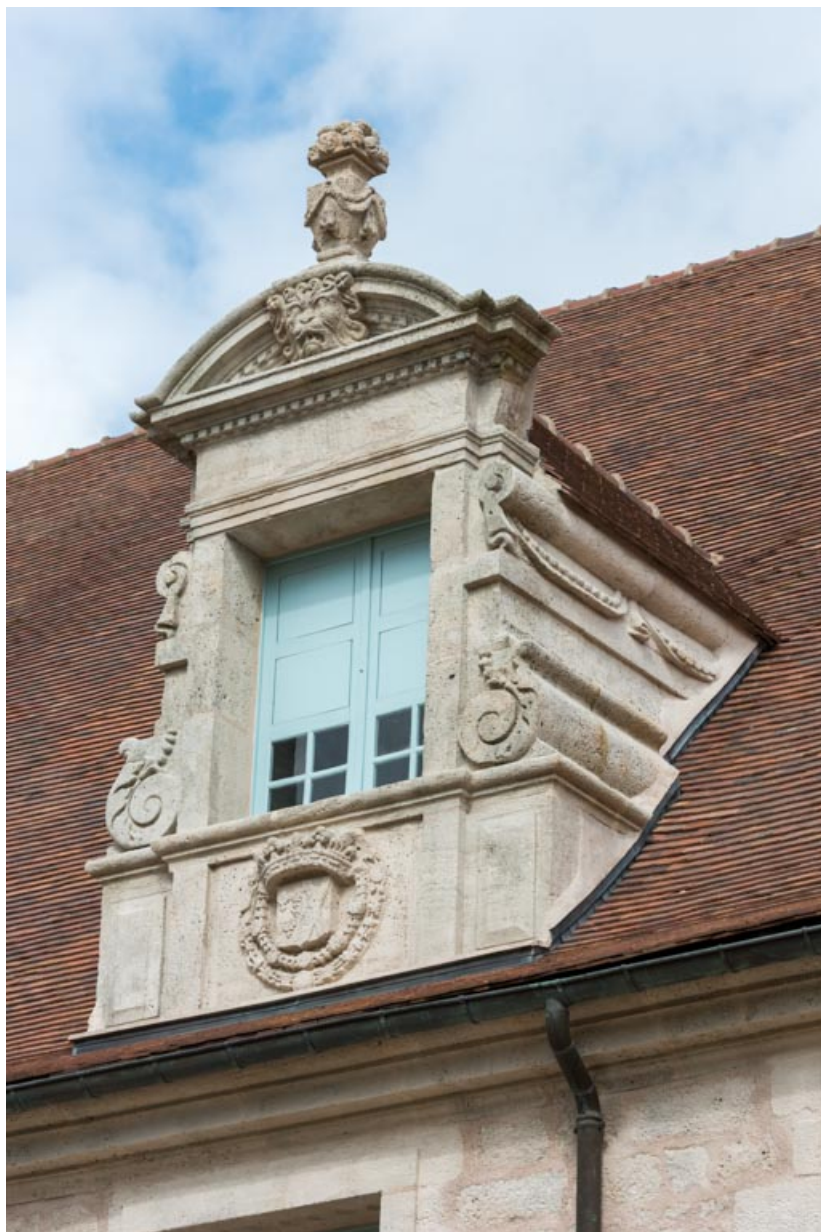
Façade sud-est, lucarne à ailerons à volutes et à fronton cintré surmonté d'un pot-à-feu.

71, Saint-Bonnet-de-Joux chemin du Bois de Chaumont, lieudit : Château de Chaumont