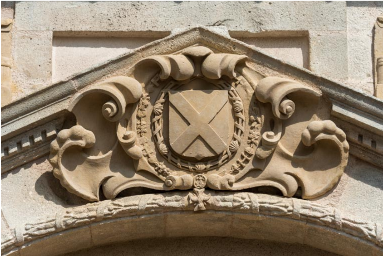
Cartouche à cuir découpé portant l'écu armorié de la famille La Guiche entouré des colliers des ordres de Saint-Michel et du Saint-Esprit.

71, Saint-Bonnet-de-Joux chemin du Bois de Chaumont, lieudit : Château de Chaumont