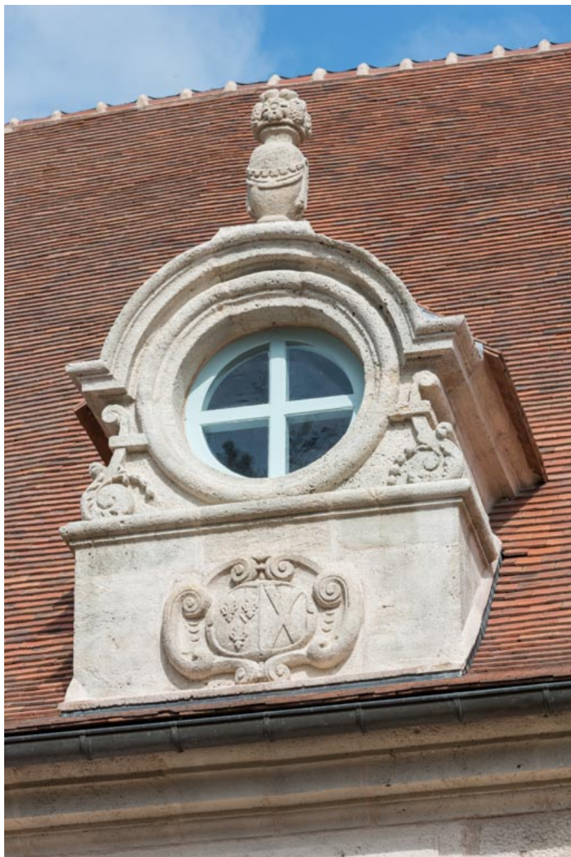
Façade sud-est, œil-de-boeuf à ailerons à volutes et à archivolte surmontée d'un pot-à-feu. 71, Saint-Bonnet-de-Joux chemin du Bois de Chaumont, lieudit : Château de Chaumont