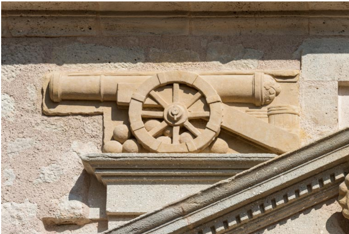
Canon d'arillerie ornant le rampant gauche du fronton de la niche.

71, Saint-Bonnet-de-Joux chemin du Bois de Chaumont, lieudit : Château de Chaumont