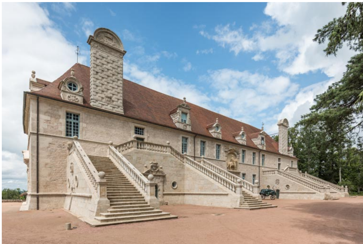
Façade sud-est, vue d'ensemble depuis le sud.

71, Saint-Bonnet-de-Joux chemin du Bois de Chaumont, lieudit : Château de Chaumont