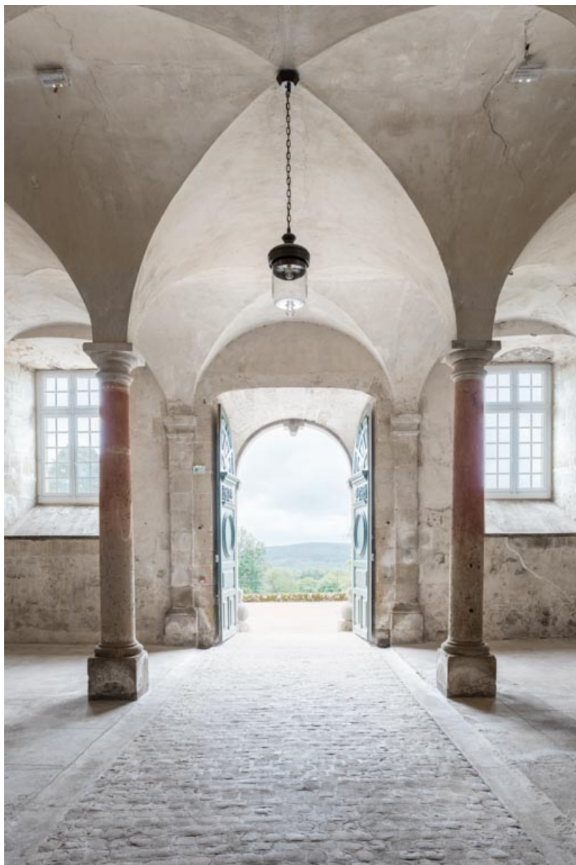
71, Saint-Bonnet-de-Joux chemin du Bois de Chaumont, lieudit : Château de Chaumont