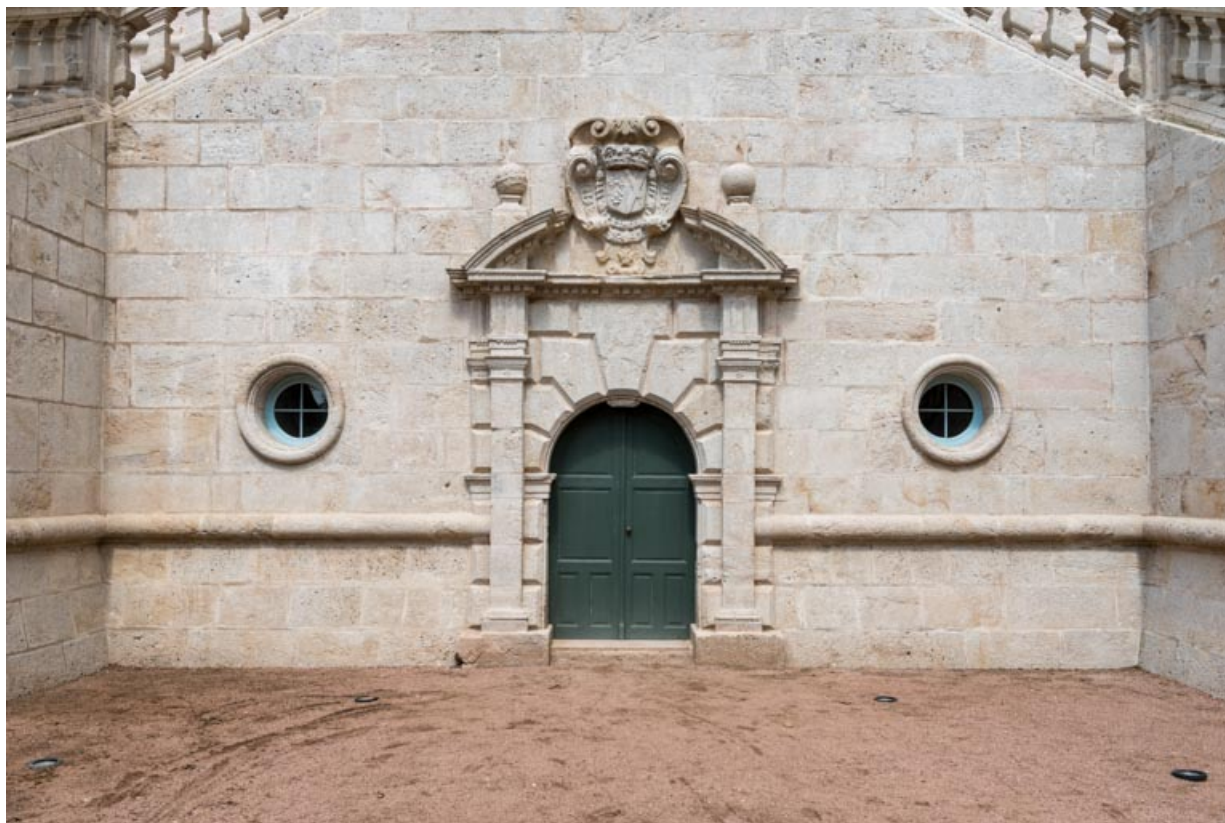
Façade sud-est, partie droite, mur d'échiffre du grand-degré.

71, Saint-Bonnet-de-Joux chemin du Bois de Chaumont, lieudit : Château de Chaumont