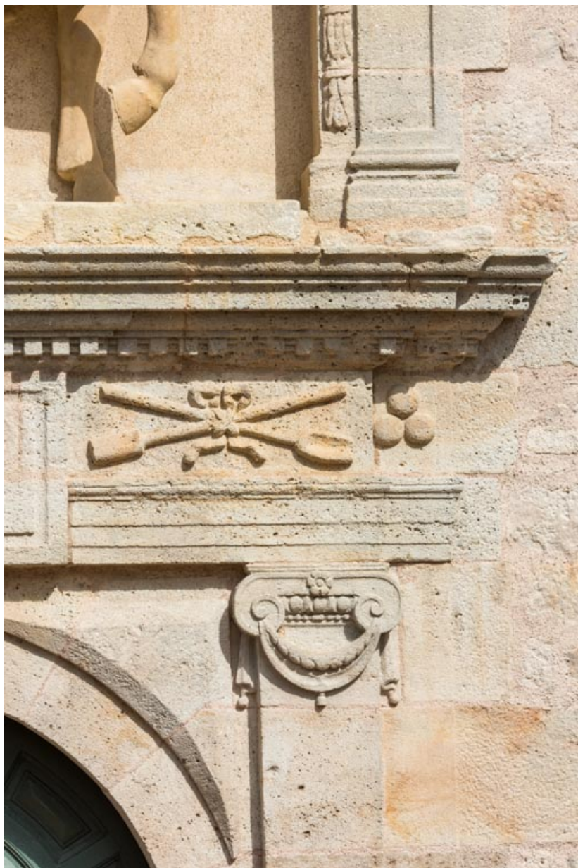
Frise ornée d'une lanterne et d'un refouloir entrecroisés et de trois boulets de canon.

71, Saint-Bonnet-de-Joux chemin du Bois de Chaumont, lieudit : Château de Chaumont