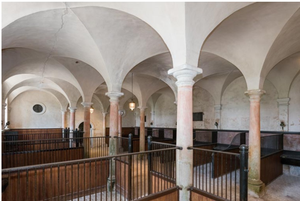
Rez-de-chaussée, salle centrale, vue en direction de l'ouest.

71, Saint-Bonnet-de-Joux chemin du Bois de Chaumont, lieudit : Château de Chaumont