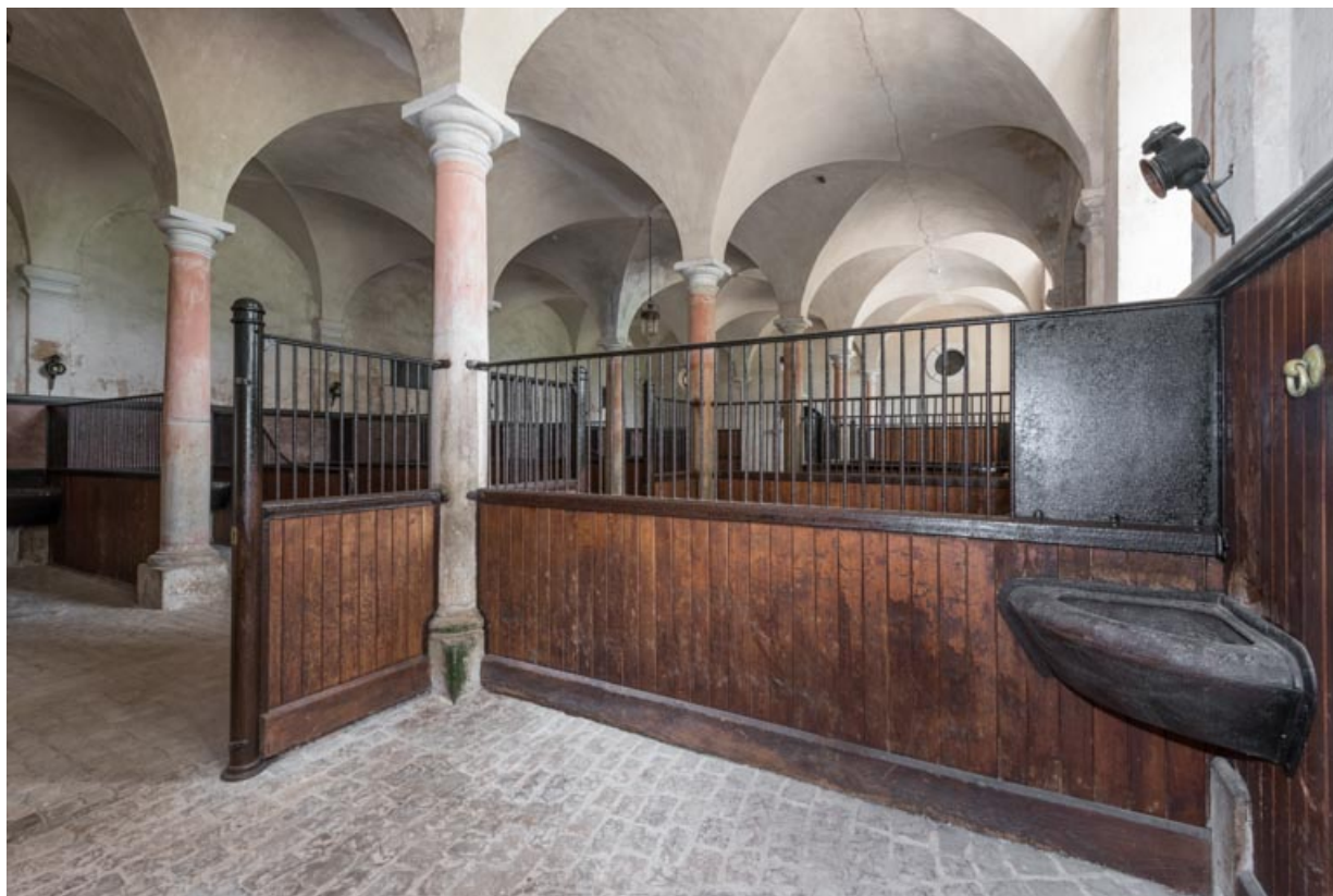
Rez-de-chaussée, salle centrale, boxes contre le mur sud-est.

71, Saint-Bonnet-de-Joux chemin du Bois de Chaumont, lieudit : Château de Chaumont