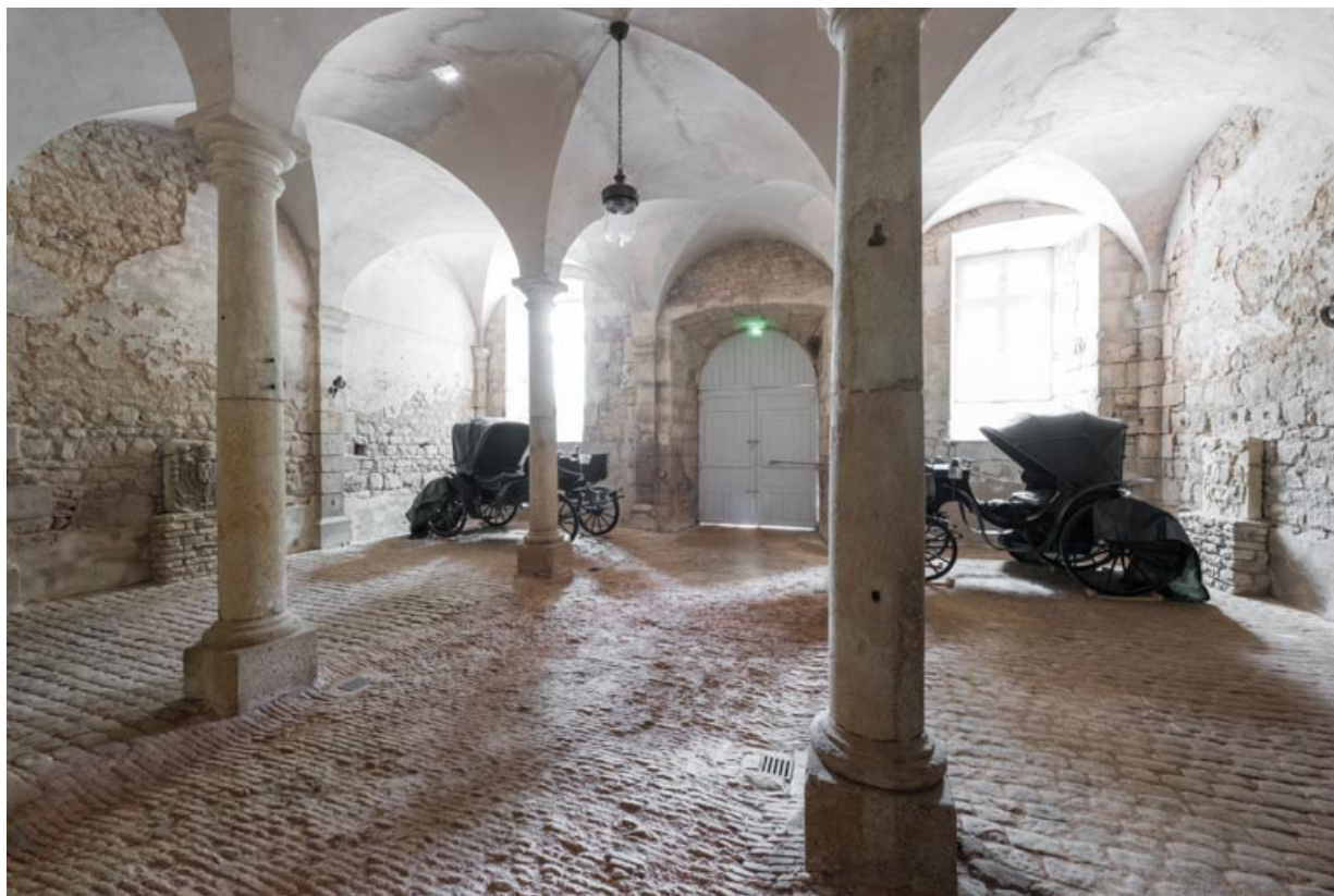
Rez-de-chaussée, salle nord-est.

71, Saint-Bonnet-de-Joux chemin du Bois de Chaumont, lieudit : Château de Chaumont