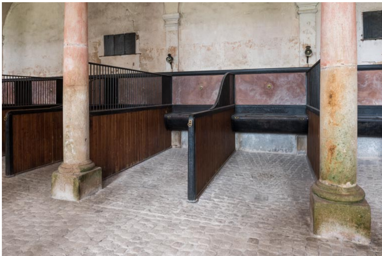
Rez-de-chaussée, salle centrale, stalles contre le mur nord-ouest.

71, Saint-Bonnet-de-Joux chemin du Bois de Chaumont, lieudit : Château de Chaumont