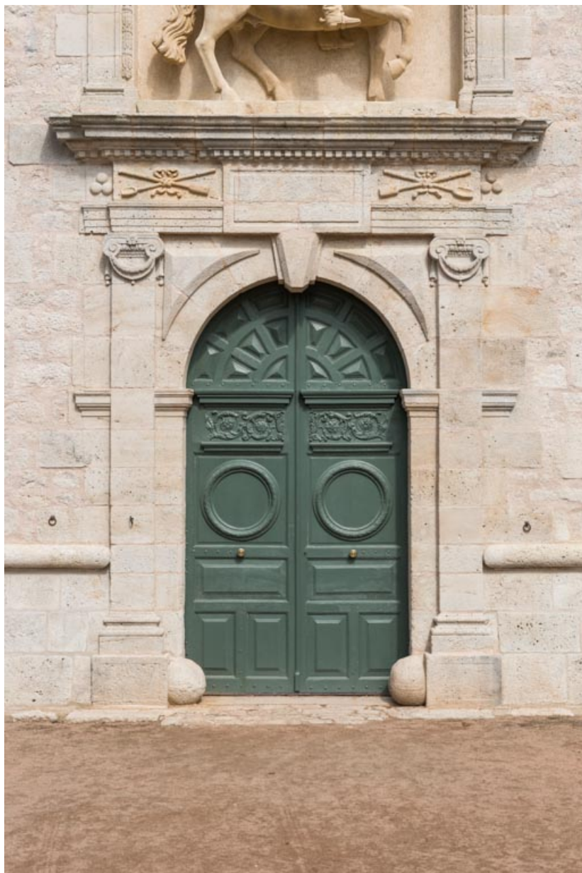
Façade sud-est, travée centrale, portail.

71, Saint-Bonnet-de-Joux chemin du Bois de Chaumont, lieudit : Château de Chaumont