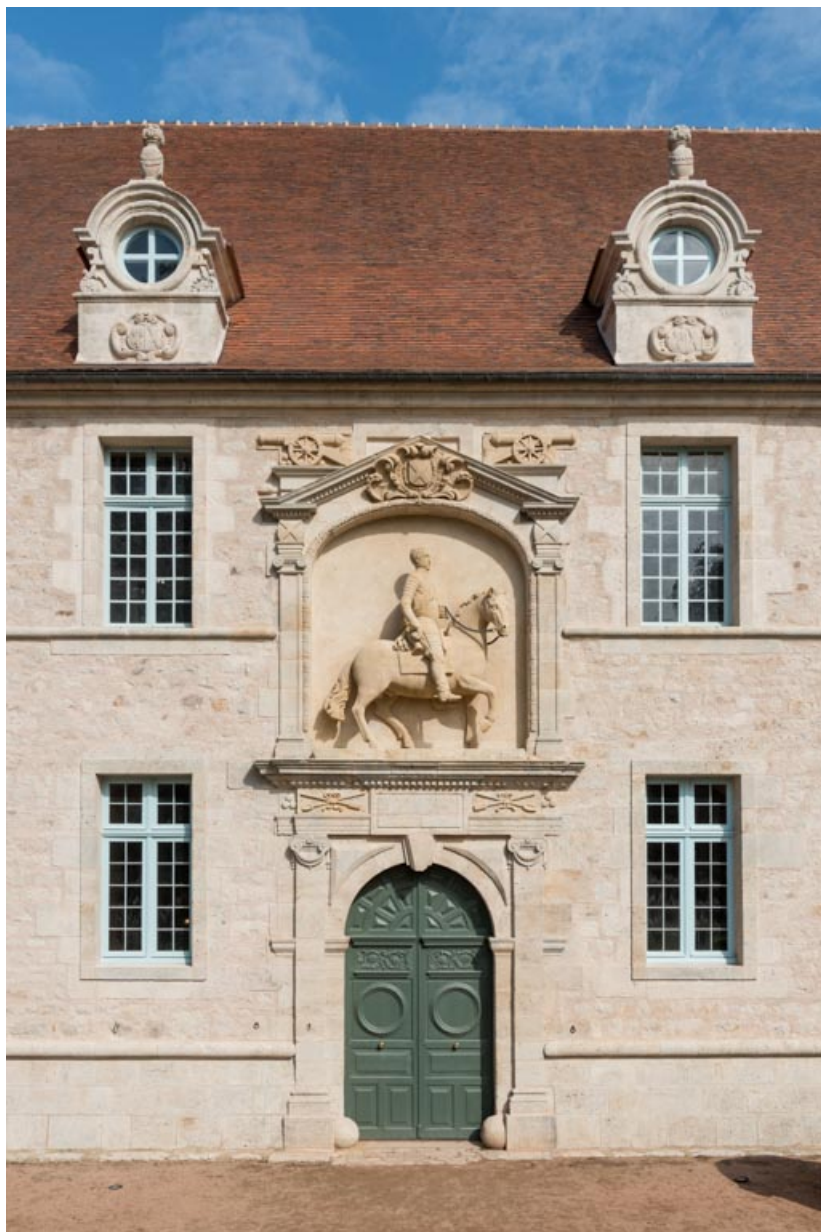
Travée centrale de la façade sud-est, vue après restauration.

71, Saint-Bonnet-de-Joux chemin du Bois de Chaumont, lieudit : Château de Chaumont