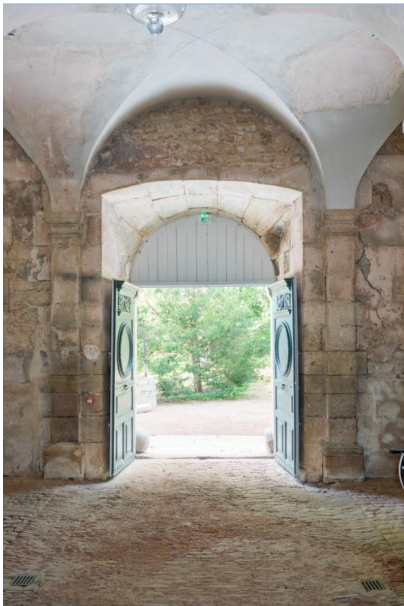
Rez-de-chaussée, salle nord-est, porte ouverte.

71, Saint-Bonnet-de-Joux chemin du Bois de Chaumont, lieudit : Château de Chaumont