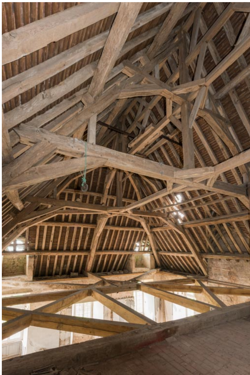
Charpente à chevrons portant-fermes, croupe sud-ouest, vue depuis l'étage de comble.

71, Saint-Bonnet-de-Joux chemin du Bois de Chaumont, lieudit : Château de Chaumont