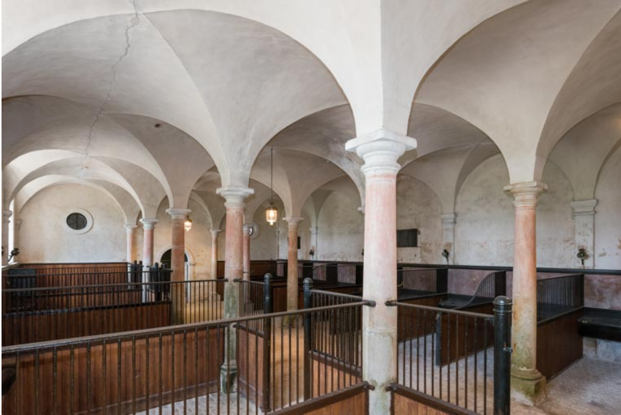
Rez-de-chaussée, salle centrale, vue en direction de l'ouest.

71, Saint-Bonnet-de-Joux chemin du Bois de Chaumont, lieu-dit : Château de Chaumont