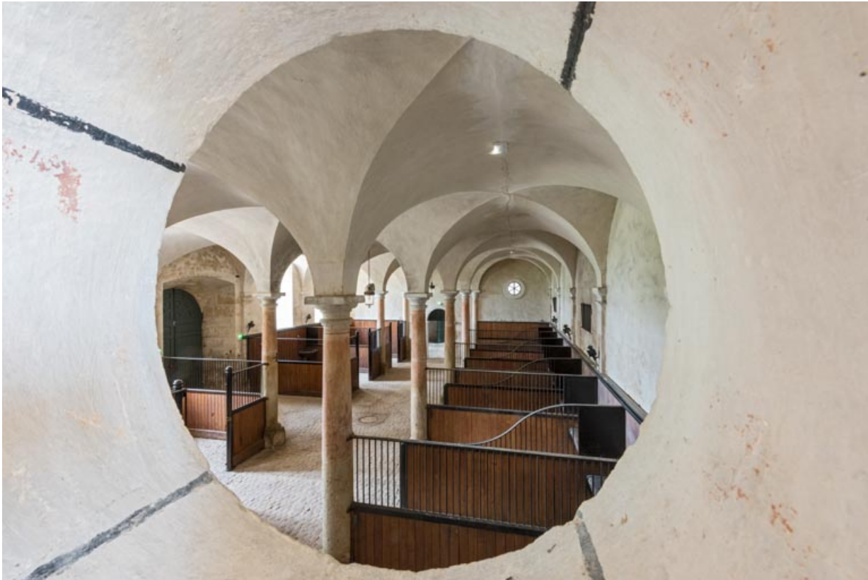
Pièce entresolée entre la salle centrale et la salle nord-est, oculus avec vue sur la salle centrale.

71, Saint-Bonnet-de-Joux chemin du Bois de Chaumont, lieu dit : Château de Chaumont