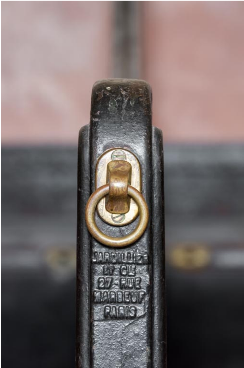
Plaque de firme sur les cloisons des stalles : "JARDILLIER ET CIE 27 RUE MARBEUF PARIS". 71, Saint-Bonnet-de-Joux chemin du Bois de Chaumont, lieudit : Château de Chaumont