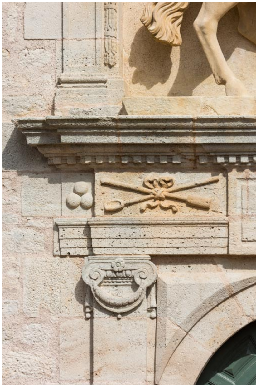
Frise ornée d'une lanterne et d'un refouloir entrecroisés et de trois boulets de canon.

71, Saint-Bonnet-de-Joux chemin du Bois de Chaumont, lieudit : Château de Chaumont