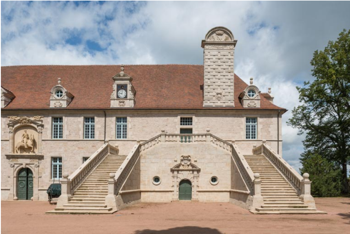
Façade sud-est, partie droite, grand-degré.

71, Saint-Bonnet-de-Joux chemin du Bois de Chaumont, lieu dit : Château de Chaumont