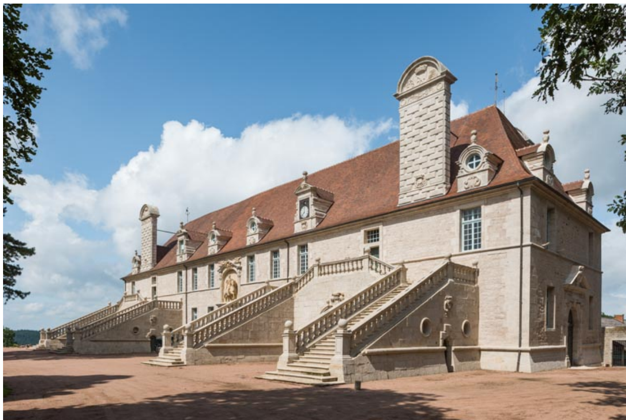
Façade sud-est, vue d'ensemble depuis l'est.

71, Saint-Bonnet-de-Joux chemin du Bois de Chaumont, lieudit : Château de Chaumont