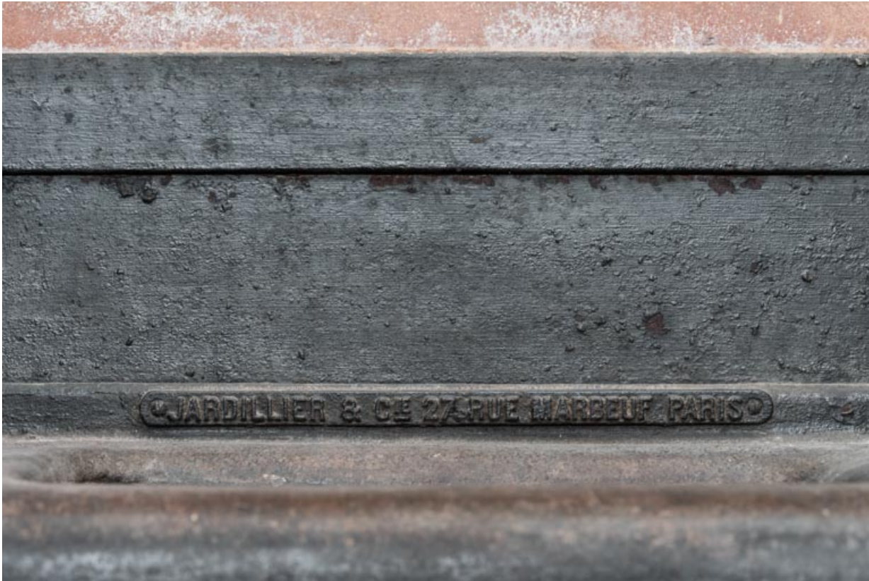
Plaque de firme sur les mangeoires des stalles : "JARDILLIER ET CIE 27 RUE MARBEUF PARIS".

71, Saint-Bonnet-de-Joux chemin du Bois de Chaumont, lieudit : Château de Chaumont