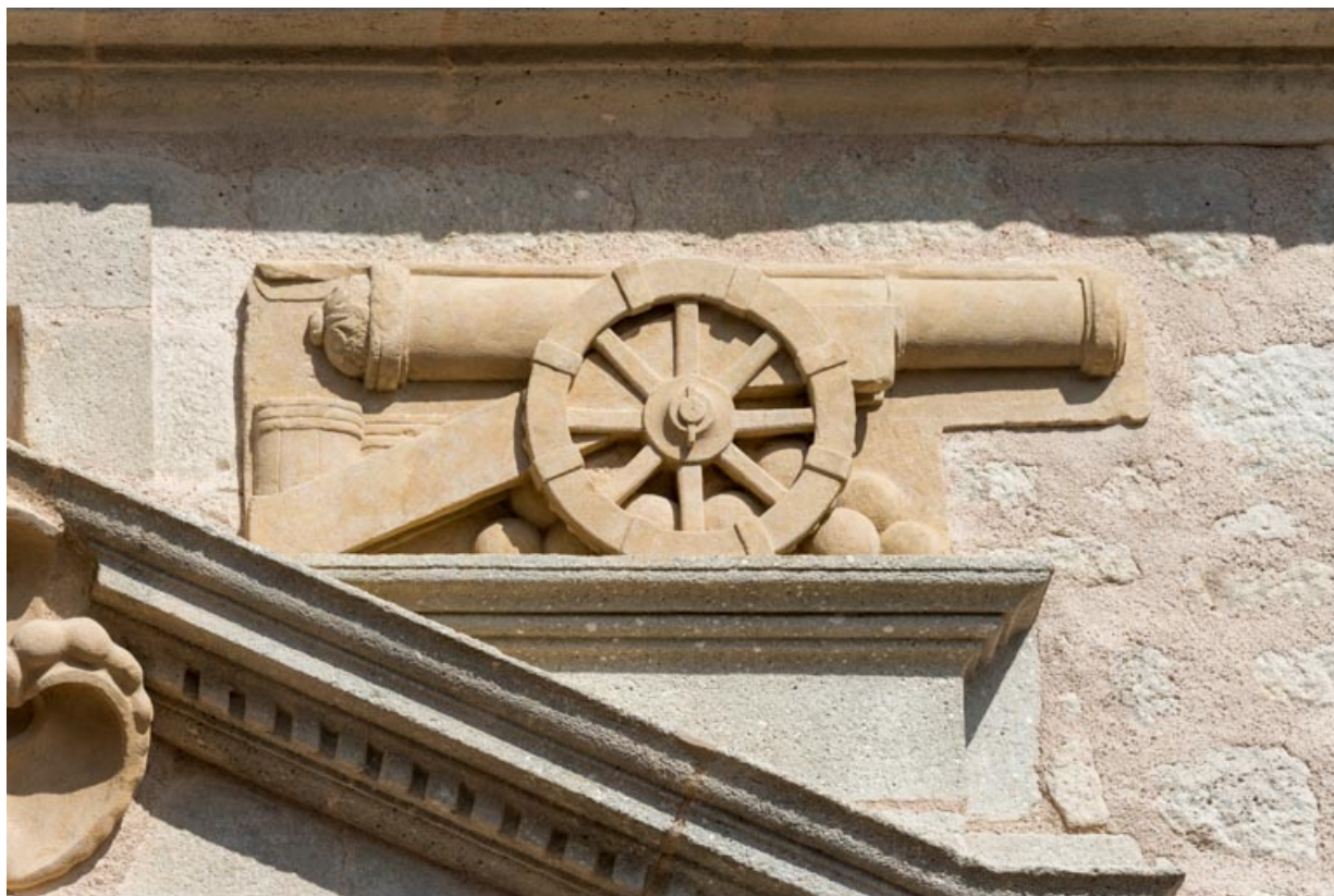
Canon d'artillerie ornant le rampant droit du fronton de la niche.

71, Saint-Bonnet-de-Joux chemin du Bois de Chaumont, lieudit : Château de Chaumont