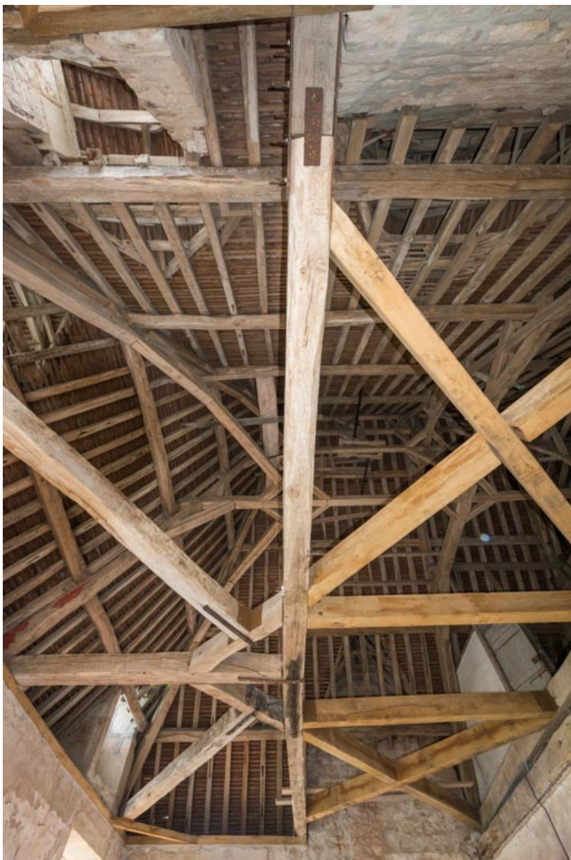
Charpente à chevrons portant-fermes, croupe sud-ouest, vue depuis le premier étage. 71, Saint-Bonnet-de-Joux chemin du Bois de Chaumont, lieudit : Château de Chaumont