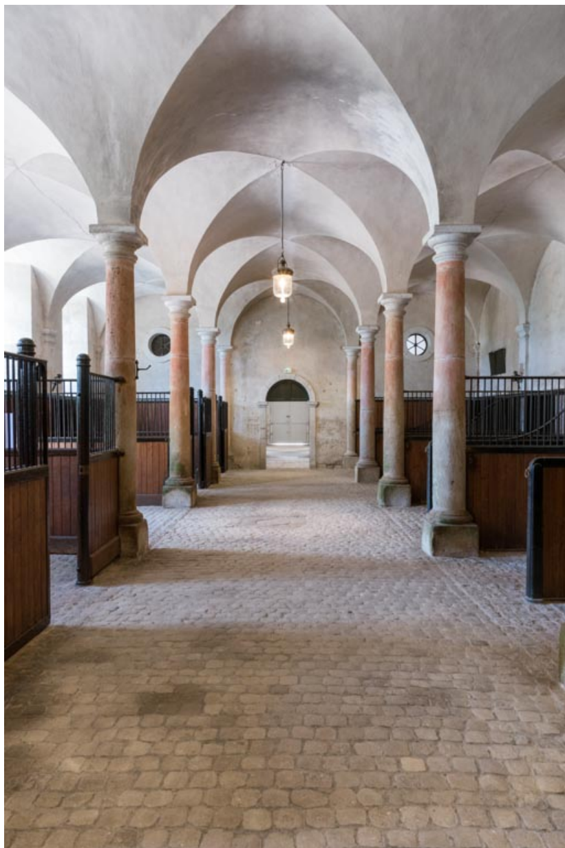
Rez-de-chaussée, salle centrale, vue en direction du sud-ouest.

71, Saint-Bonnet-de-Joux chemin du Bois de Chaumont, lieudit : Château de Chaumont