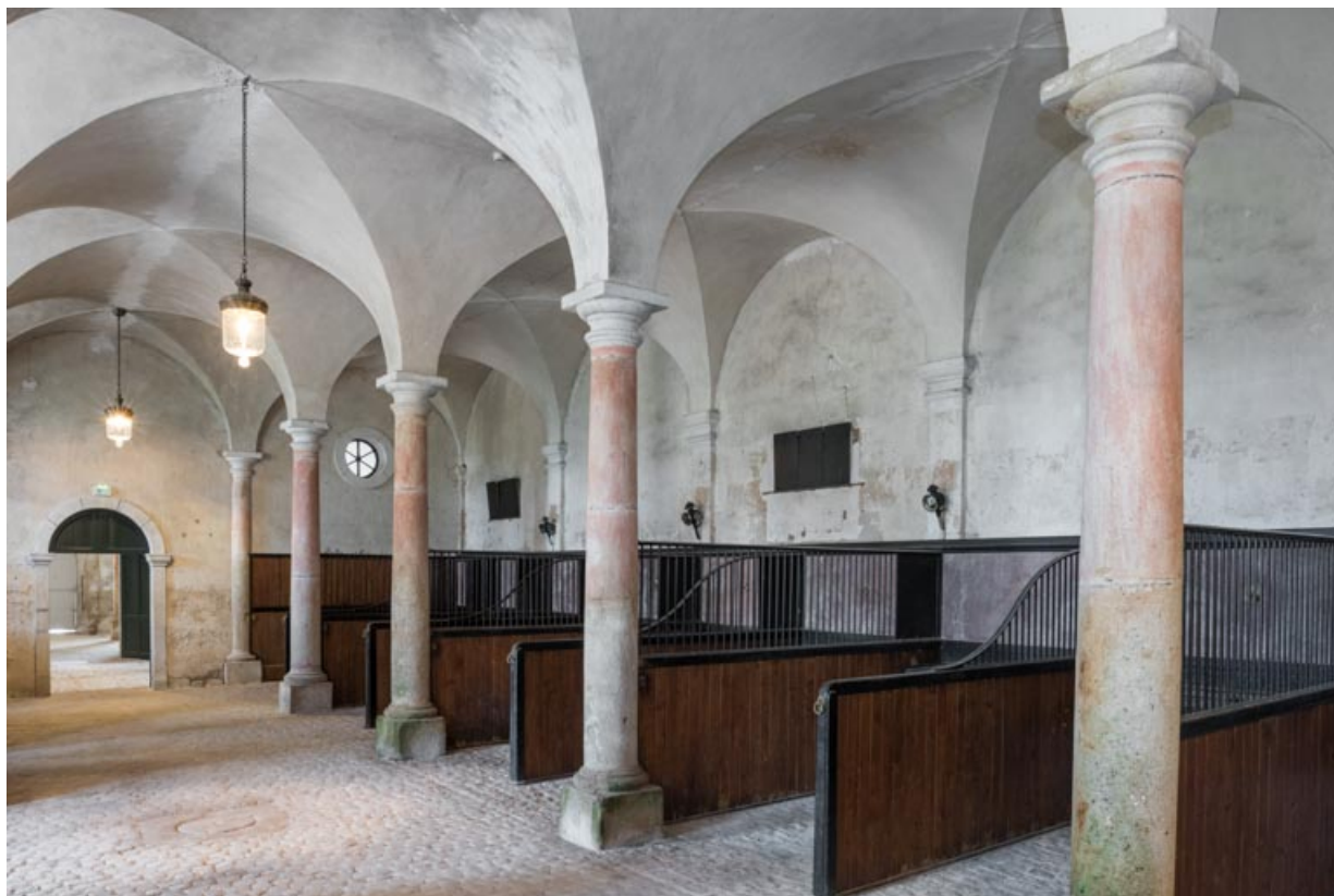
Rez-de-chaussée, salle centrale, stalles contre le mur nord-ouest.

71, Saint-Bonnet-de-Joux chemin du Bois de Chaumont, lieudit : Château de Chaumont