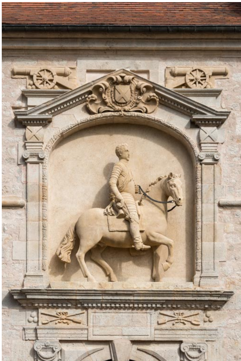
Haut-relief, portrait équestre, vue de côté.

71, Saint-Bonnet-de-Joux chemin du Bois de Chaumont, lieudit : Château de Chaumont