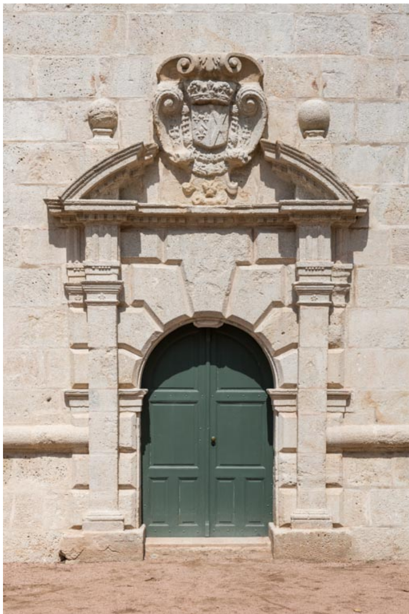
Façade sud-est, partie droite, mur d'échiffre du grand-degré, portail.

71, Saint-Bonnet-de-Joux chemin du Bois de Chaumont, lieudit : Château de Chaumont