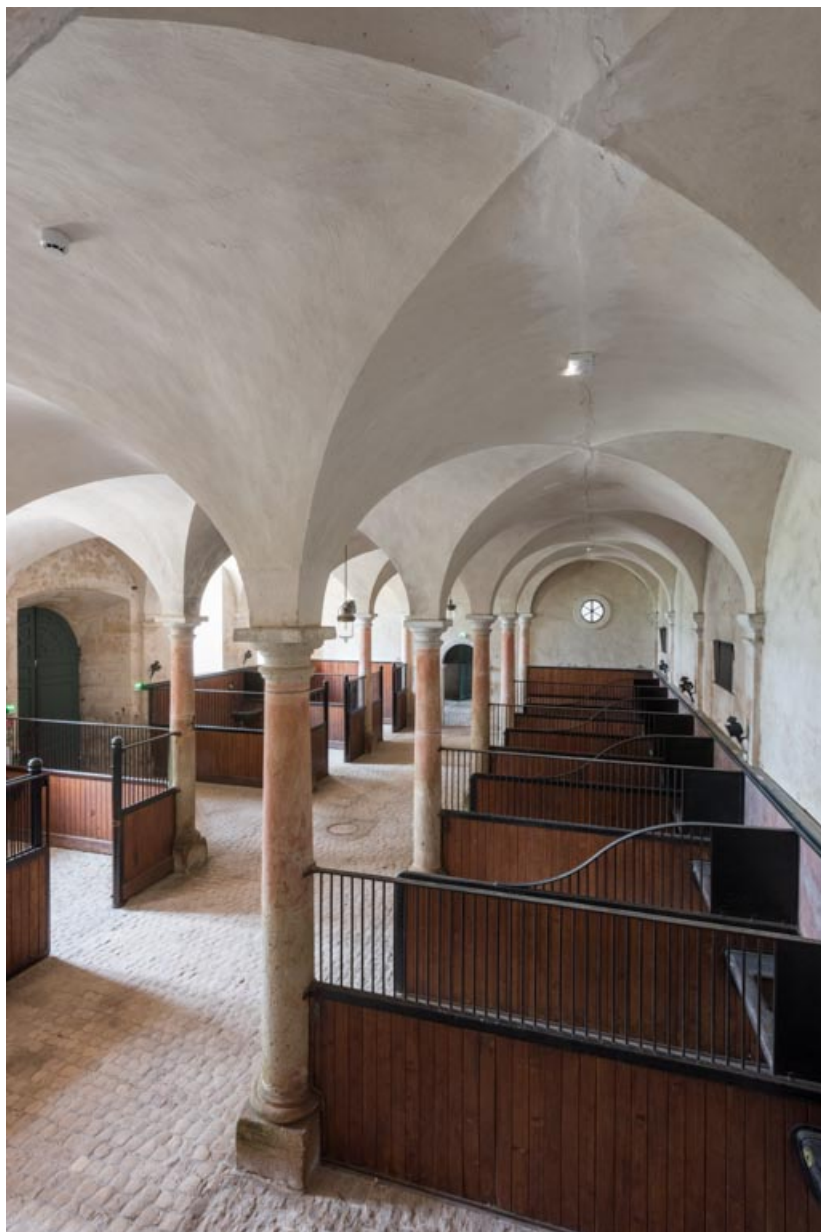
Rez-de-chaussée, salle centrale, stalles contre le mur nord-ouest.

71, Saint-Bonnet-de-Joux chemin du Bois de Chaumont, lieudit : Château de Chaumont