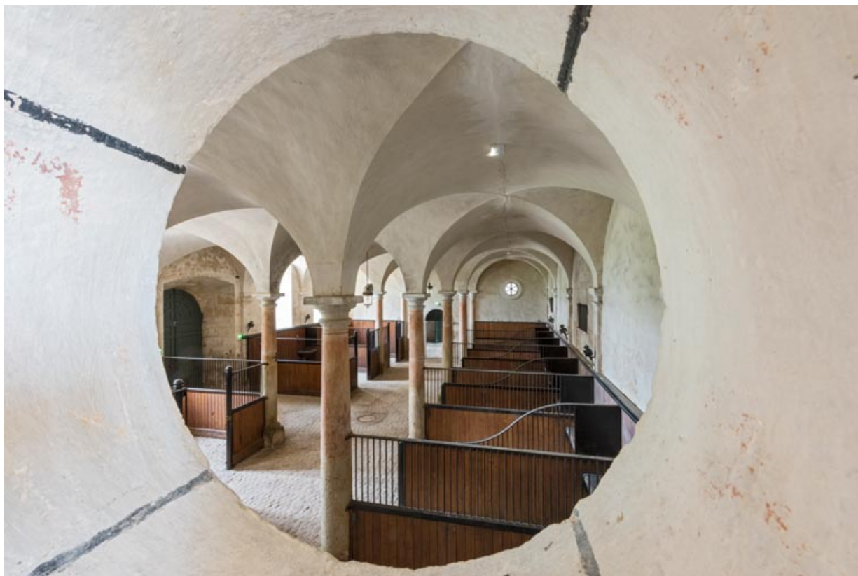
Pièce entresolée entre la salle centrale et la salle nord-est, oculus avec vue sur la salle centrale.

71, Saint-Bonnet-de-Joux chemin du Bois de Chaumont, lieudit : Château de Chaumont