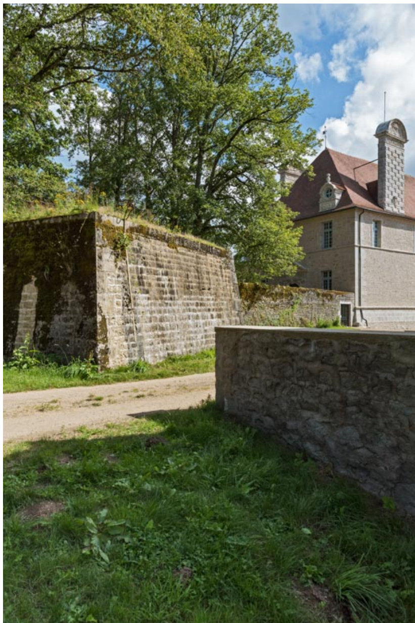
Mur d'enceinte, vue depuis le nord.

71, Saint-Bonnet-de-Joux chemin du Bois de Chaumont, lieudit : Château de Chaumont