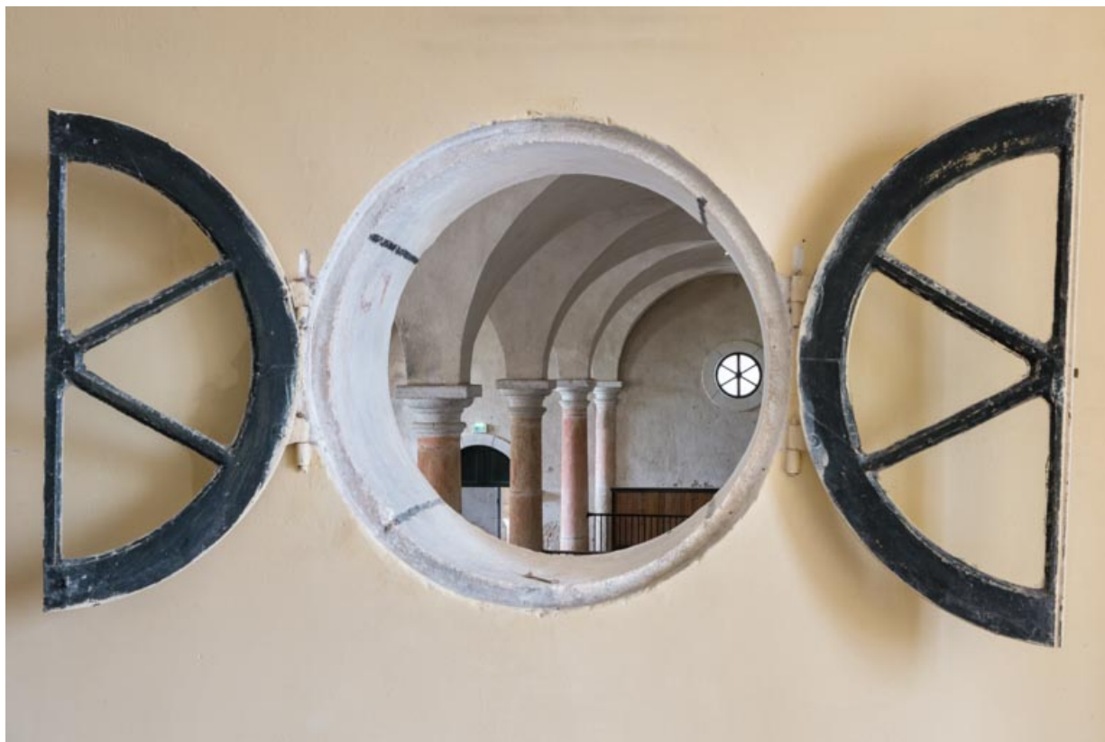
Pièce entresolée entre la salle centrale et la salle nord-est, oculus avec vue sur la salle centrale.

71, Saint-Bonnet-de-Joux chemin du Bois de Chaumont, lieudit : Château de Chaumont