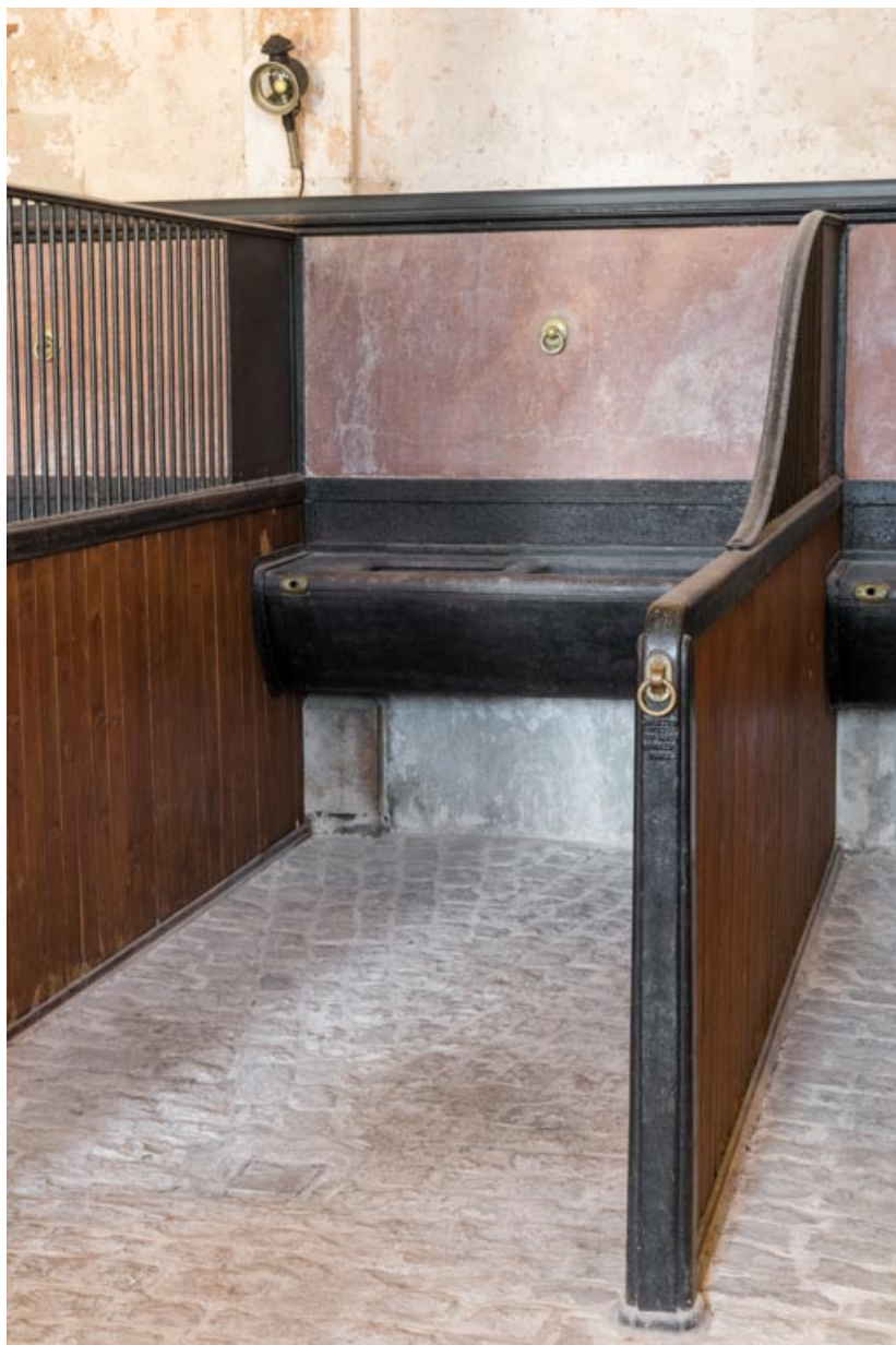
Rez-de-chaussée, salle centrale, stalles contre le mur nord-ouest, mangeoire.

71, Saint-Bonnet-de-Joux chemin du Bois de Chaumont, lieudit : Château de Chaumont