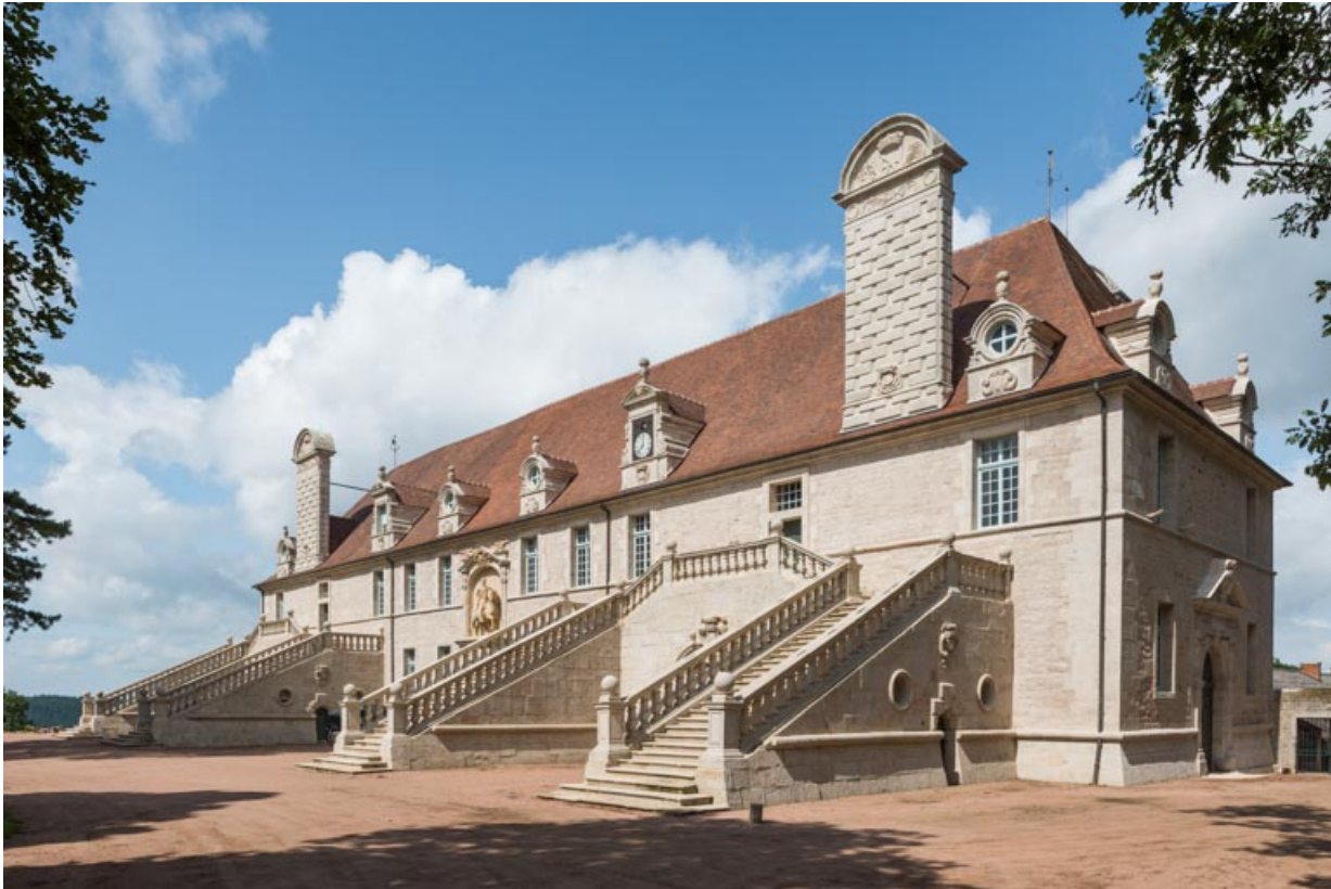
Façade sud-est, vue d'ensemble depuis l'est.

71, Saint-Bonnet-de-Joux chemin du Bois de Chaumont, lieu dit : Château de Chaumont