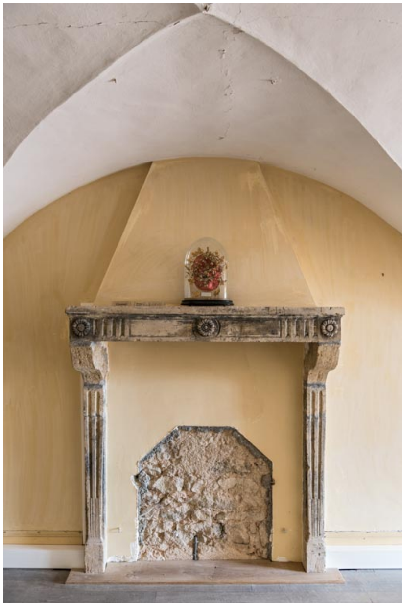
Pièce entresolée entre la salle centrale et la salle nord-est, cheminée factice (?). 71, Saint-Bonnet-de-Joux chemin du Bois de Chaumont, lieudit : Château de Chaumont