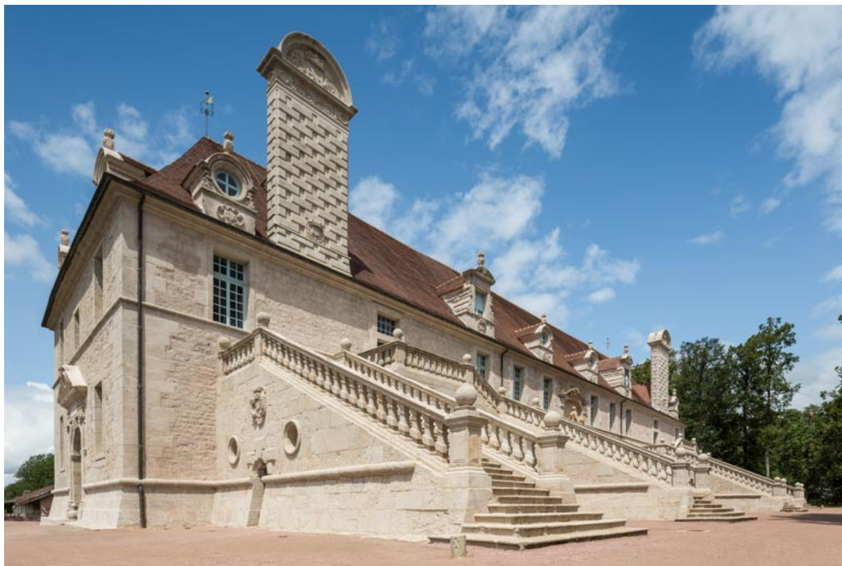
Façade sud-est, vue d'ensemble depuis le sud.

71, Saint-Bonnet-de-Joux chemin du Bois de Chaumont, lieudit : Château de Chaumont