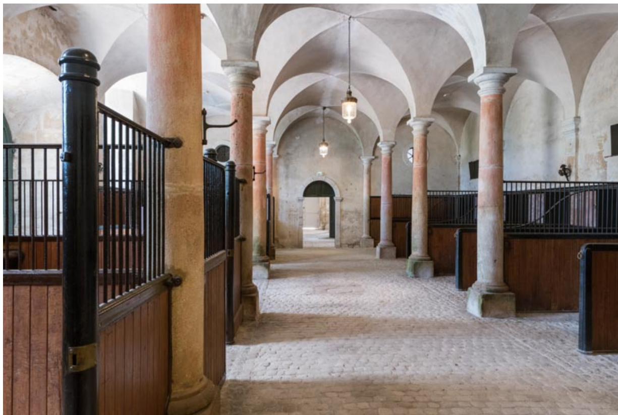
Rez-de-chaussée, salle centrale, vue en direction du sud-ouest.

71, Saint-Bonnet-de-Joux chemin du Bois de Chaumont, lieudit : Château de Chaumont