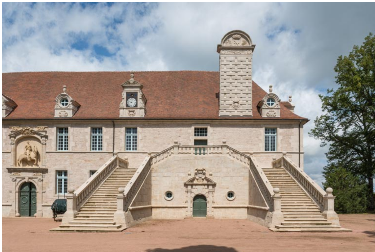
Façade sud-est, partie droite, grand-degré.

71, Saint-Bonnet-de-Joux chemin du Bois de Chaumont, lieudit : Château de Chaumont