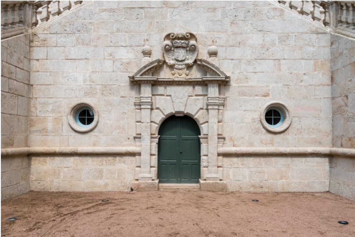
Façade sud-est, partie droite, mur d'échiffre du grand-degré.

71, Saint-Bonnet-de-Joux chemin du Bois de Chaumont, lieu dit : Château de Chaumont