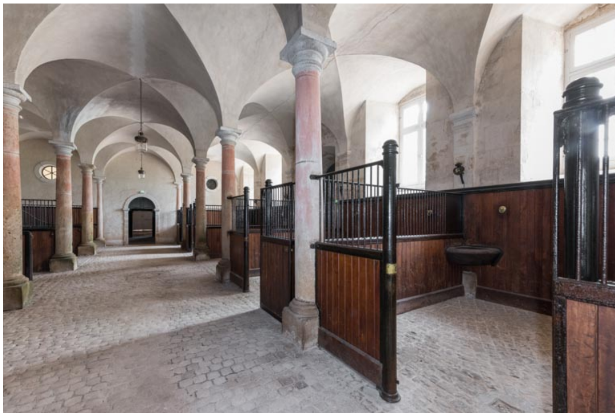
Rez-de-chaussée, salle centrale, boxes contre le mur sud-est.

71, Saint-Bonnet-de-Joux chemin du Bois de Chaumont, lieudit : Château de Chaumont