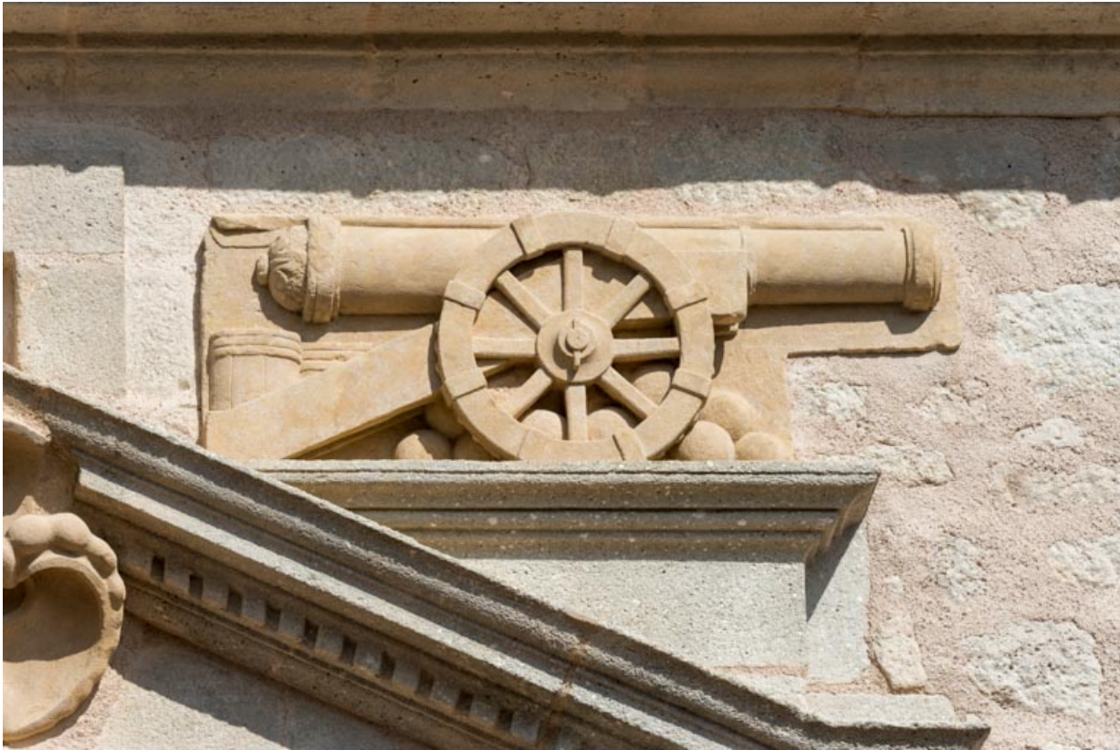
Canon d'artillerie ornant le rampant droit du fronton de la niche.

71, Saint-Bonnet-de-Joux chemin du Bois de Chaumont, lieu dit : Château de Chaumont