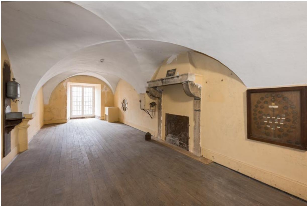
Pièce entresolée entre la salle centrale et la salle nord-est.

71, Saint-Bonnet-de-Joux chemin du Bois de Chaumont, lieudit : Château de Chaumont