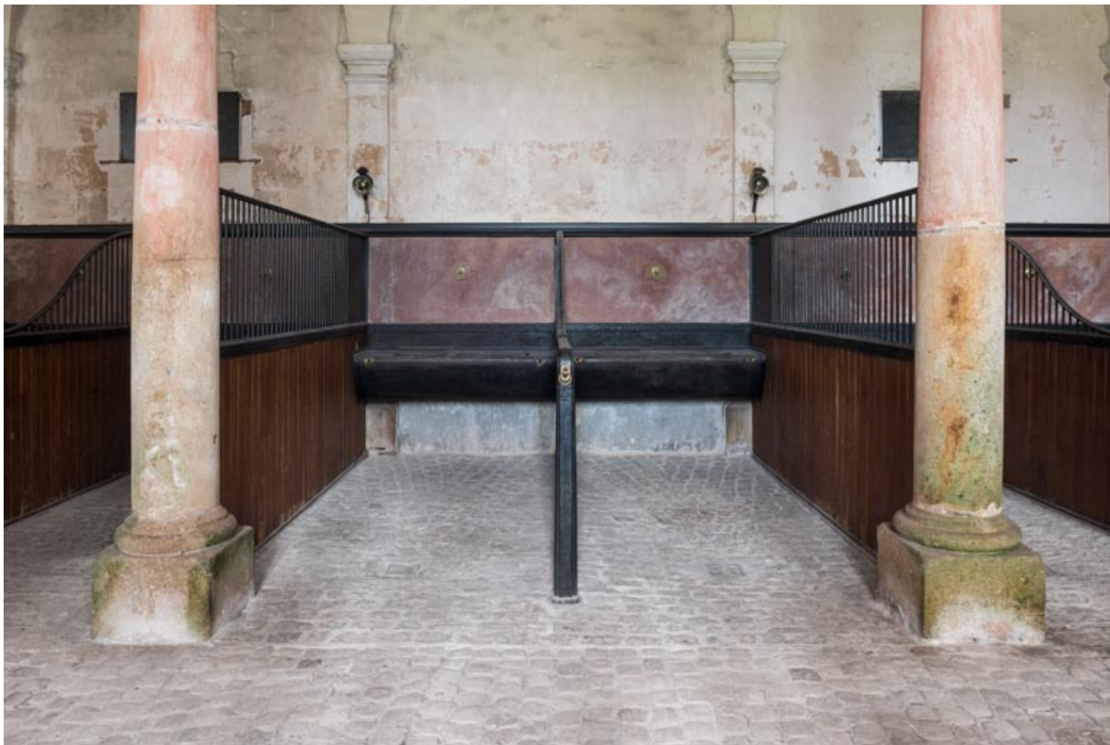
Rez-de-chaussée, salle centrale, stalles contre le mur nord-ouest.

71, Saint-Bonnet-de-Joux chemin du Bois de Chaumont, lieudit : Château de Chaumont