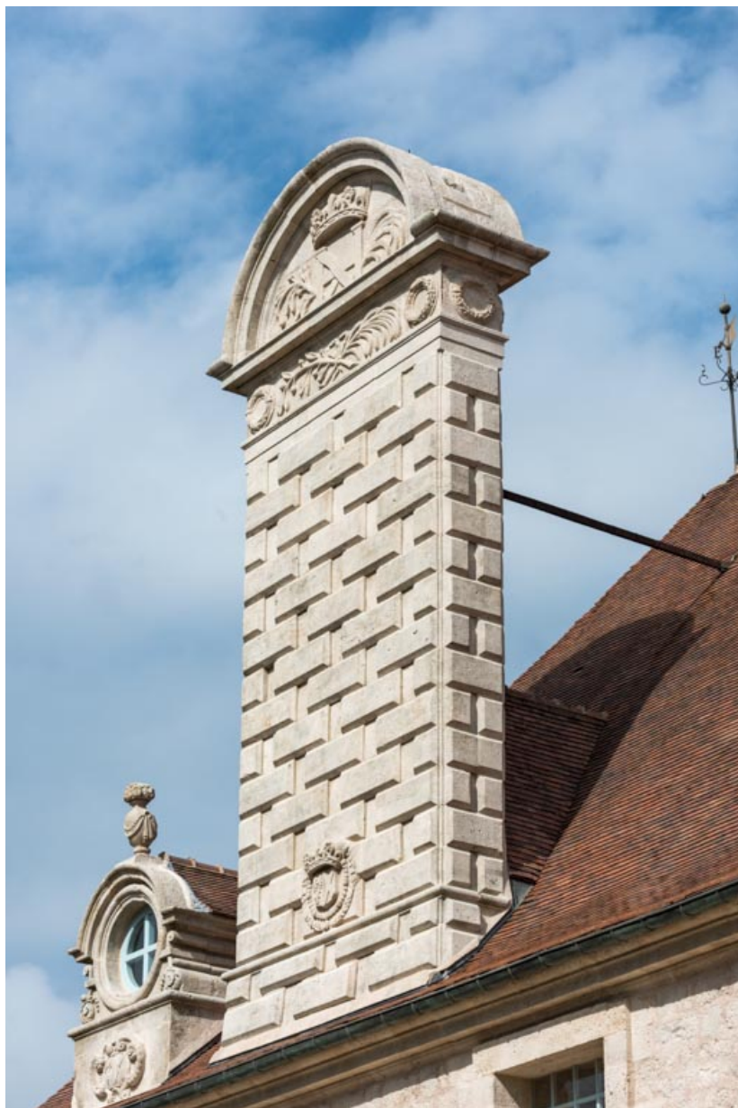
Façade sud-est, souche de cheminée ornée d'un bossage en table chanfreinée et surmontée d'un fronton cintré au chiffre des propriétaires (lettre lambda et lettre H).

71, Saint-Bonnet-de-Joux chemin du Bois de Chaumont, lieudit : Château de Chaumont