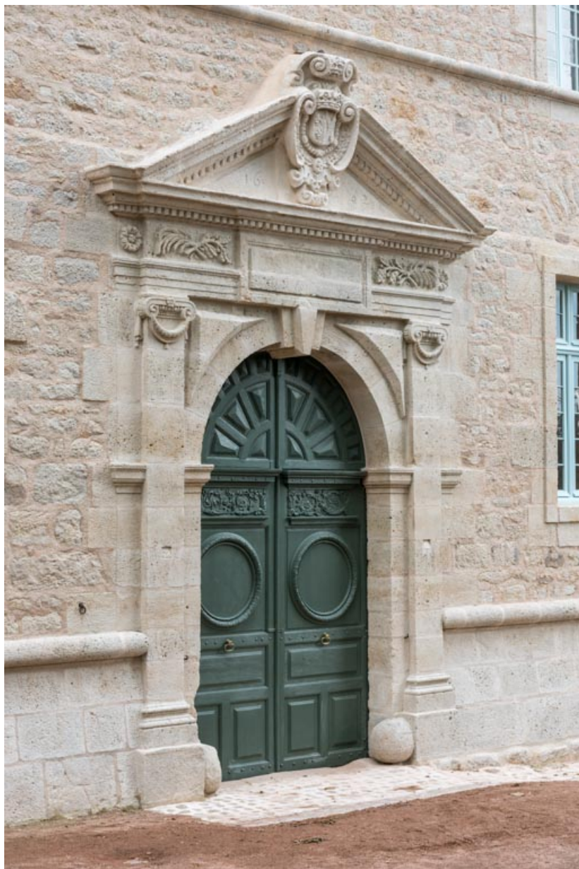
Façade nord-est, portail portant la date de 1652.

71, Saint-Bonnet-de-Joux chemin du Bois de Chaumont, lieudit : Château de Chaumont