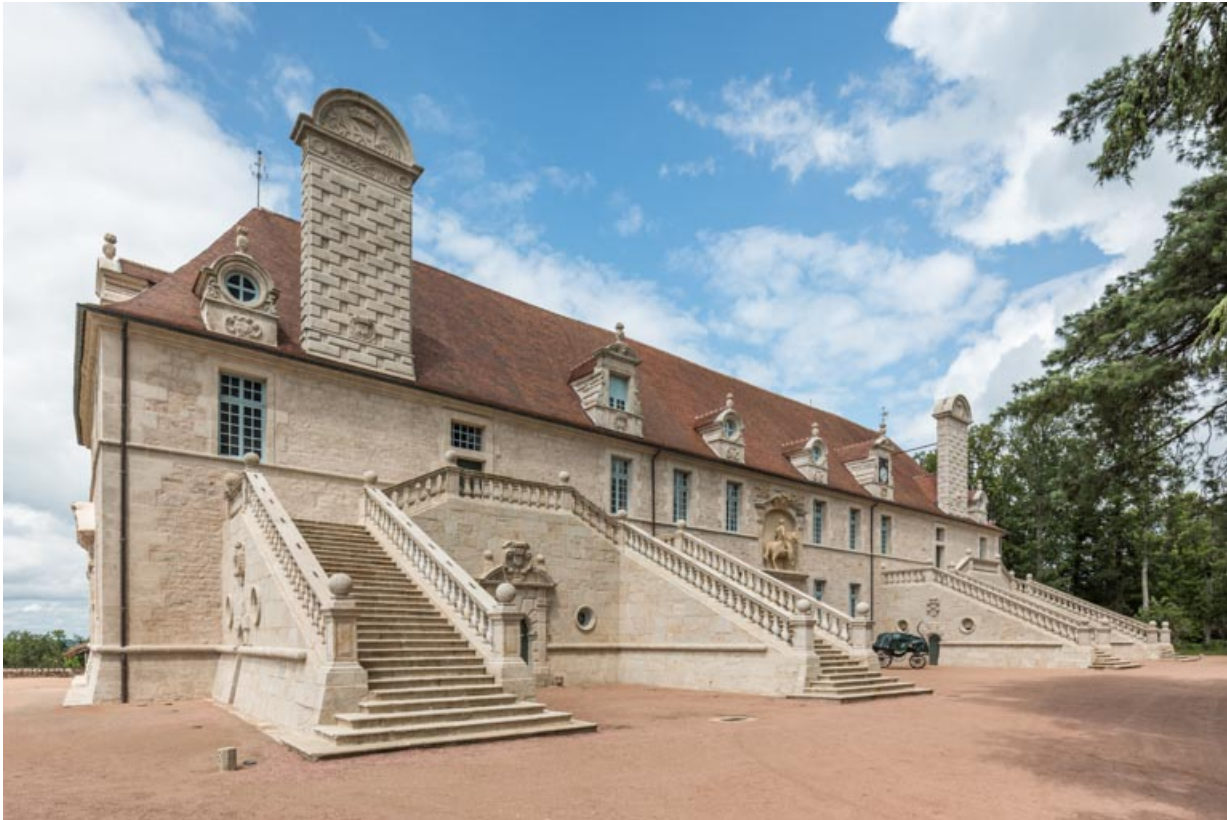
Façade sud-est, vue d'ensemble depuis le sud.

71, Saint-Bonnet-de-Joux chemin du Bois de Chaumont, lieu dit : Château de Chaumont