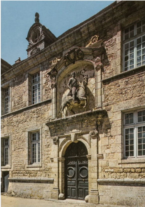
Travée centrale de la façade sud-est, vue avant restauration.

71, Saint-Bonnet-de-Joux chemin du Bois de Chaumont, lieudit : Château de Chaumont