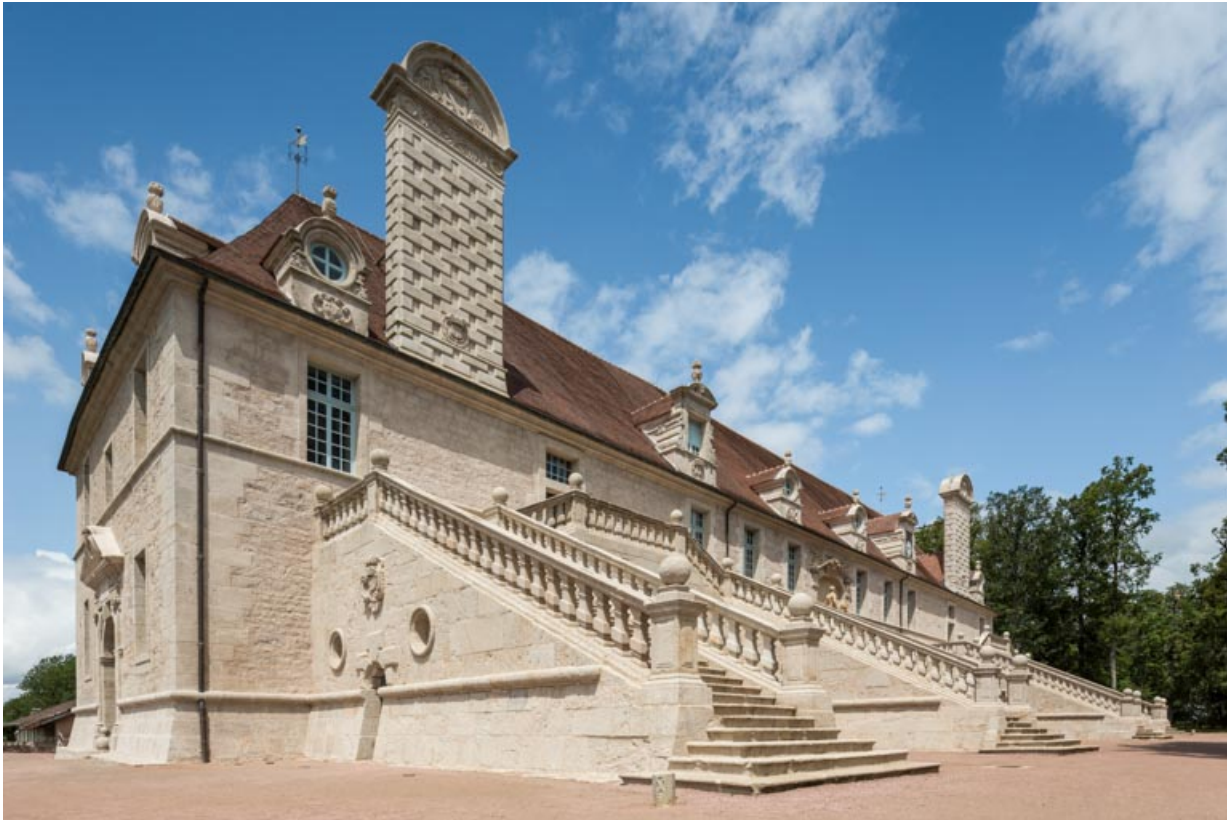
Façade sud-est, vue d'ensemble depuis le sud.

71, Saint-Bonnet-de-Joux chemin du Bois de Chaumont, lieu dit : Château de Chaumont