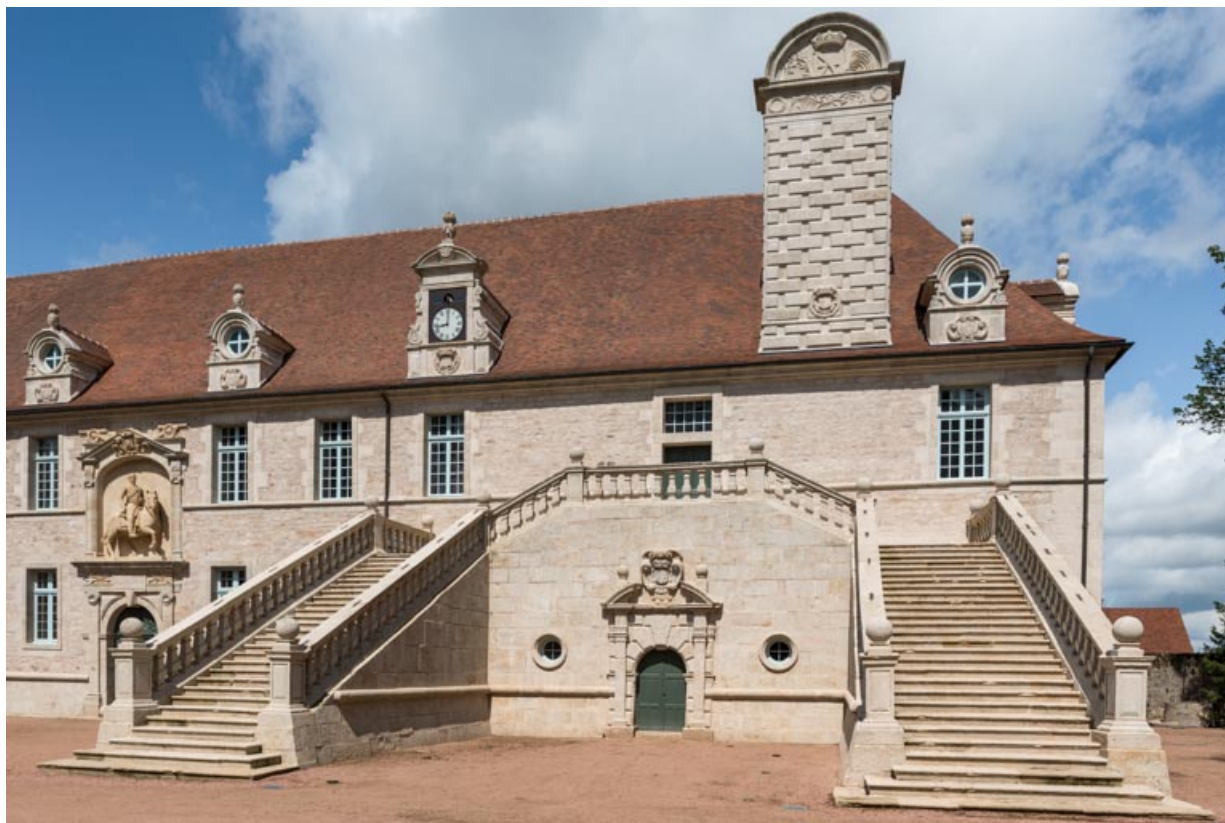
Façade sud-est, partie droite, grand-degré.

71, Saint-Bonnet-de-Joux chemin du Bois de Chaumont, lieudit : Château de Chaumont