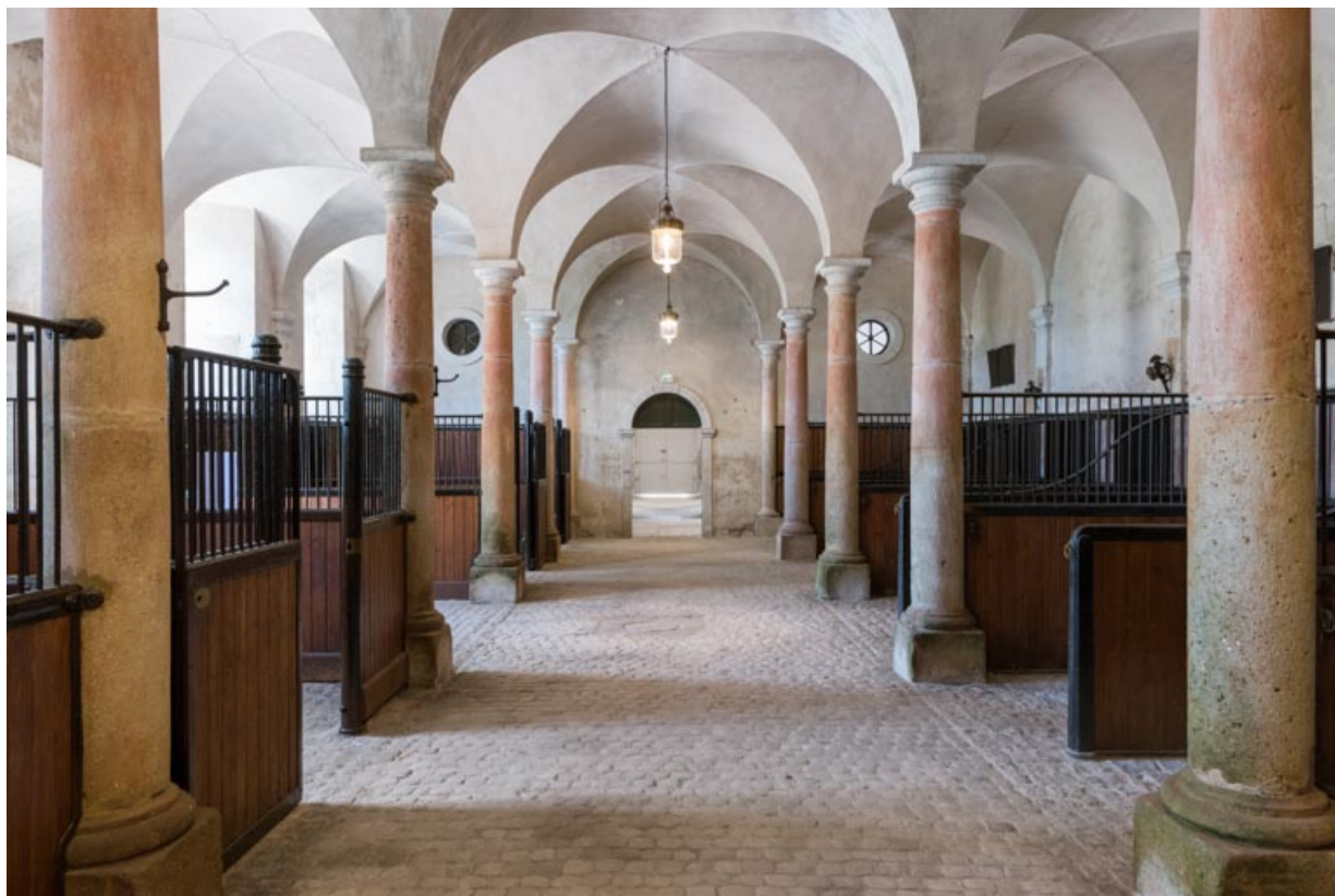
Rez-de-chaussée, salle centrale, vue en direction du sud-ouest.

71, Saint-Bonnet-de-Joux chemin du Bois de Chaumont, lieudit : Château de Chaumont