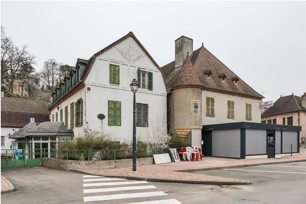
Vue actuelle depuis l'ouest.