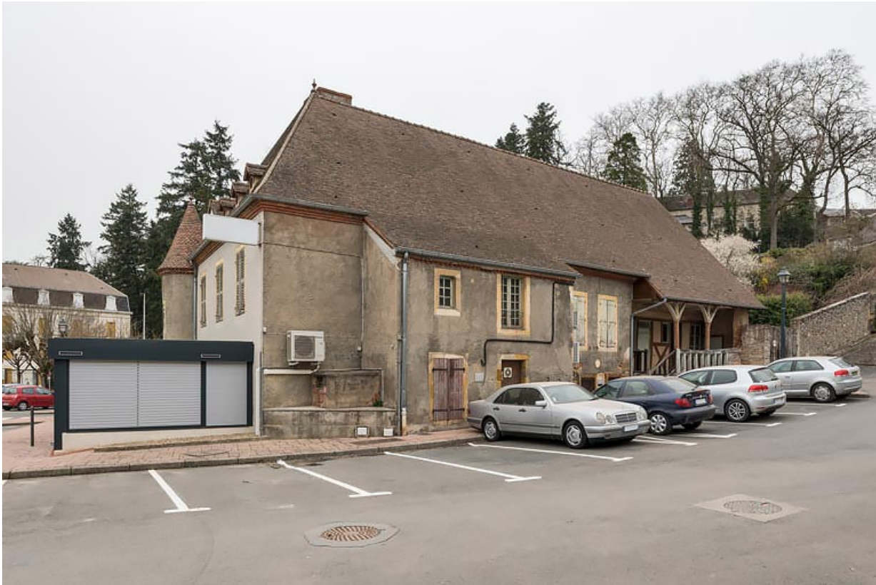
Vue actuelle depuis le sud.