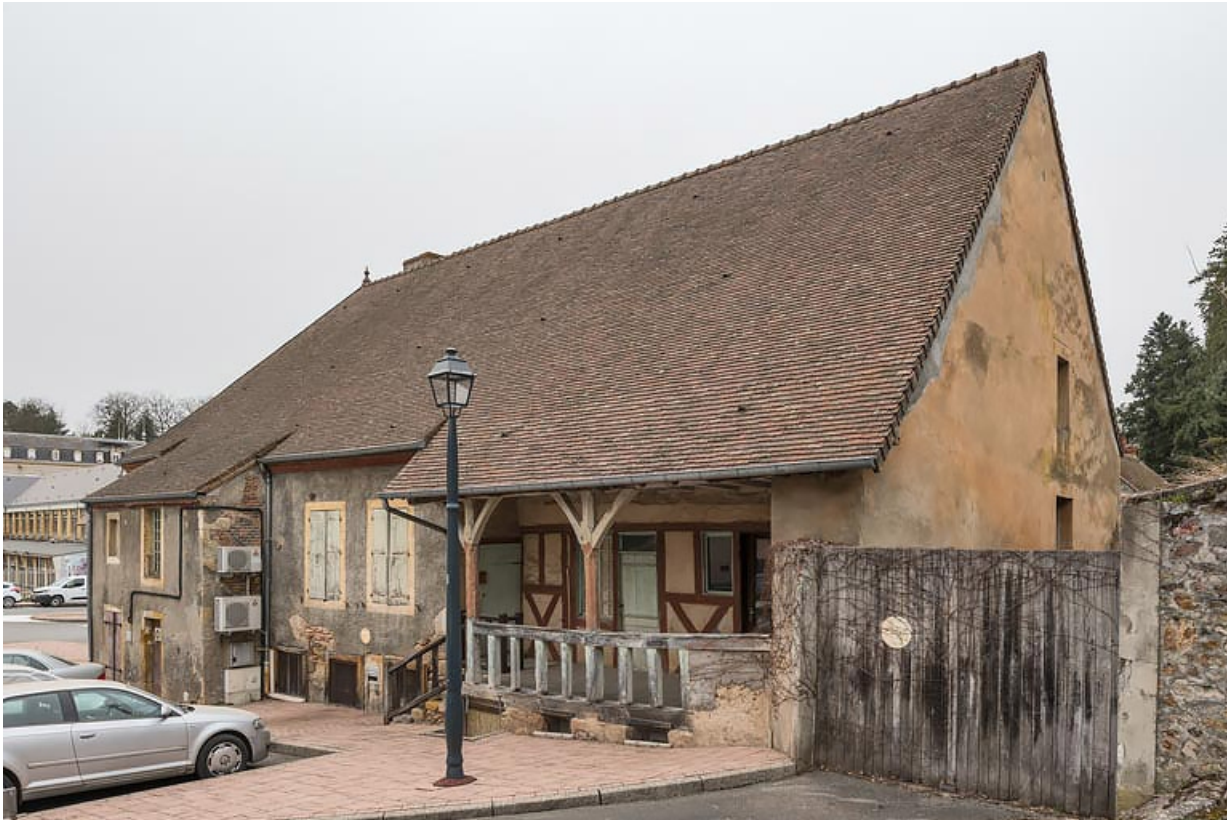
Vue actuelle depuis l'ouest.