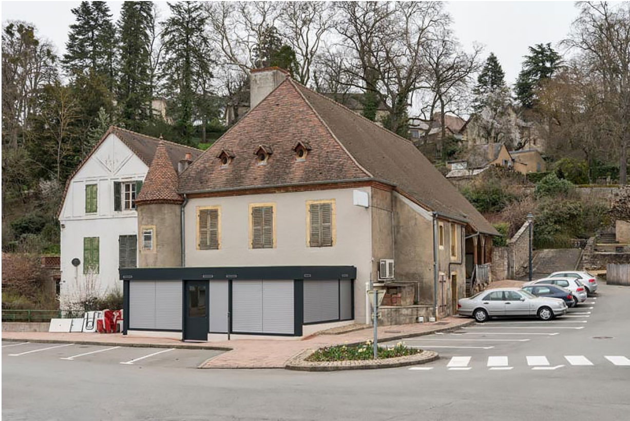
Vue actuelle depuis le sud-ouest.