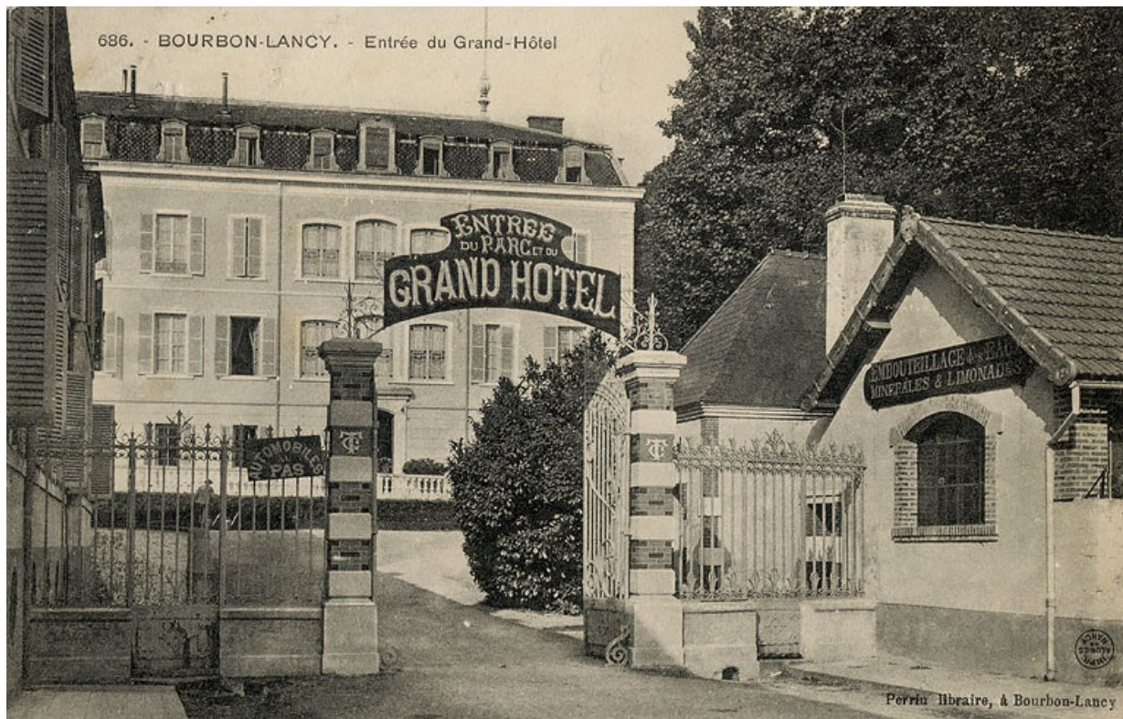
Grille établie vers 1864-1868.