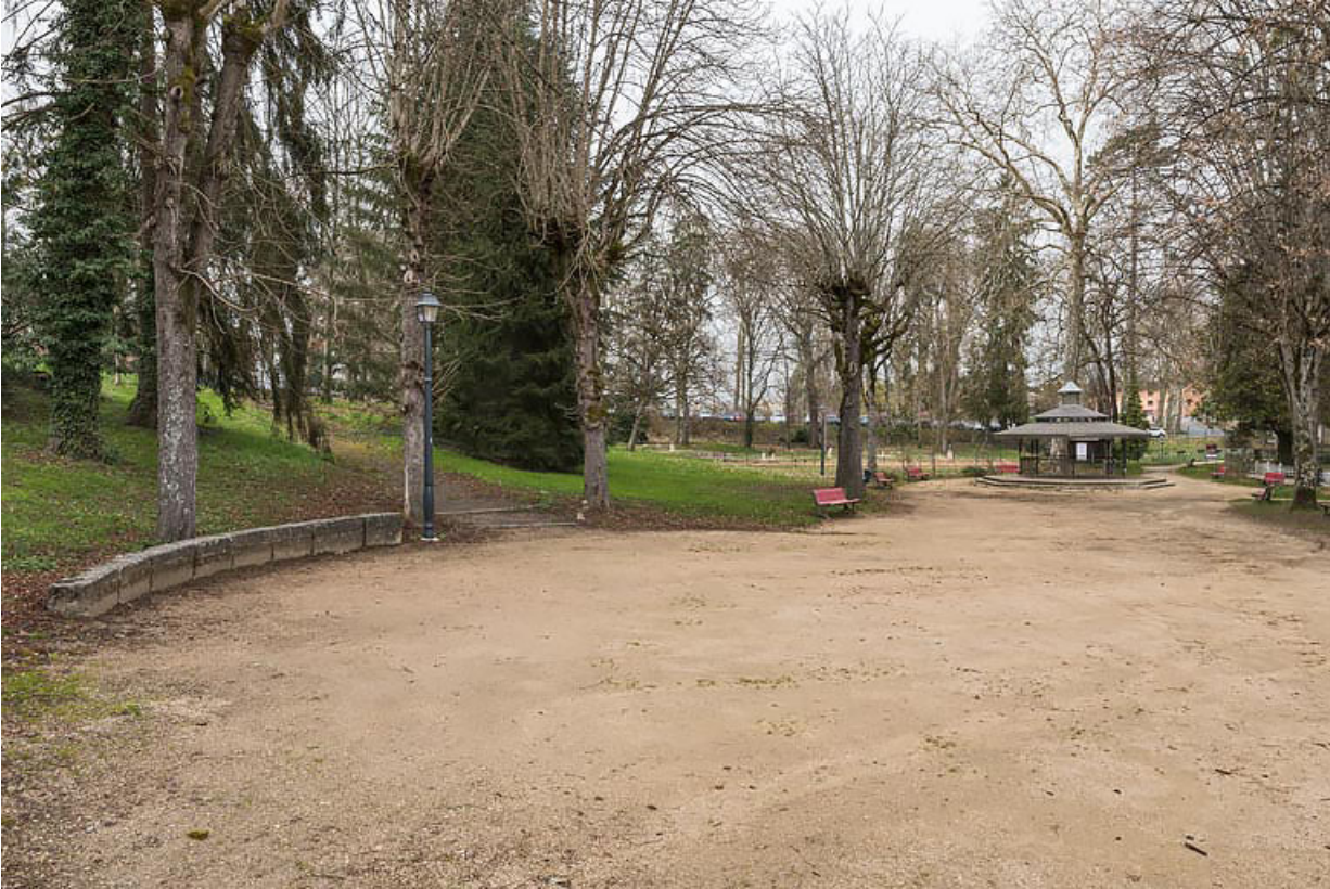
Sol sablé, au centre du parc.